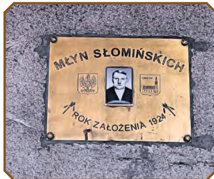
Tabliczka zdobiąca budynek młyna parowego w Cekcynie.

Pomysł na przyszłość młyna na razie przedstawiamy jako zarys, bo – mimo spisanych pomysłów na każde piętro, a nawet mniejsze pomieszczenia, których w budynku jest mnóstwo – wiele może zmienić się, gdy uda się znaleźć źródła finansowania. Nie wchodzi już w grę przemysłowe wykorzystanie budynku. Za to imponujące wyposażenie młyna samo