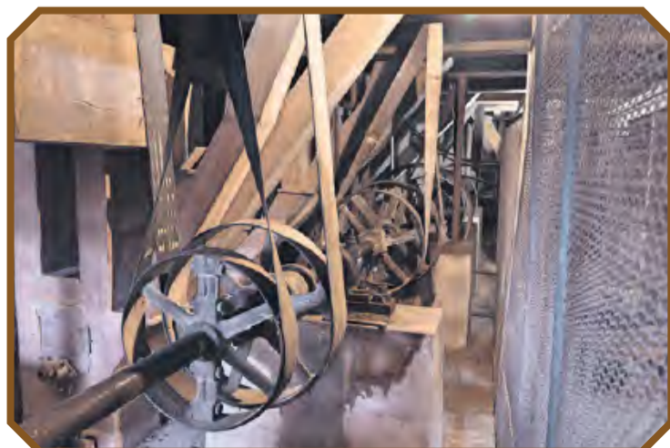
Pszczegółowe elementy są nadal w dobrym stanie. Wszak młyn przestał działać dopiero dekadę temu.

– Na razie wszystkie działania w młynie prowadzimy własnymi środkami i siłami. Ale to będzie możliwe tylko do jakiegoś czasu.