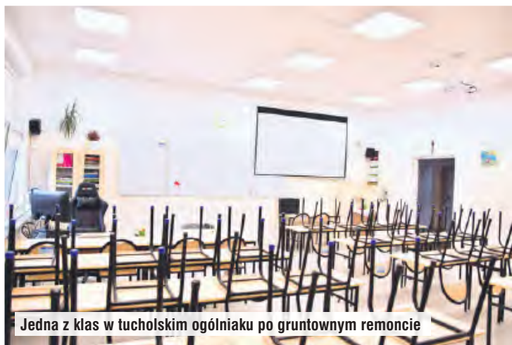
Jedna z klas w tucholskim ogólniaku po gruntownym remoncie