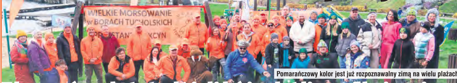
Pomarańczowy kolor jest już rozpoznawalny zimą na wielu plażach.

Kolor pomarańczowy kontrastował też z bielą śniegu, bo taki zapewnił bawiącym się morsom wójt gminy Cekcyn, za co otrzymał wielkie brawa. Mowa o pianie, którą wytworzyli wiadomym sobie sposobem fachowcy, czyli jednostka OSP Cekcyn. Główną atrakcją było jednak wspólne wejście do zimnej wody. Najważniejsze słowa prezesa stowarzyszenia: „Oficjalnie otwieram nowy sezon morsowania” były hasłem do skoku w lodowatą toń.