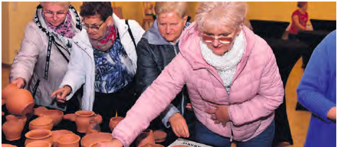
Bez względu na wiek uczestnikom warsztatów frajdę sprawiało odszukiwanie swoich oryginalnych prac.

Całość dopełnił borowiacki poczęstunek. Zgromadzeni w piątkowy wieczór w B-CKiP uczestnicy warsztatów i ich bli-