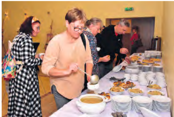
Zwieńczeniem wydarzenia podsumowującego projekt był poczęstunek. W menu znalazły się m.in. wysmienity żurek i ryba w occie.