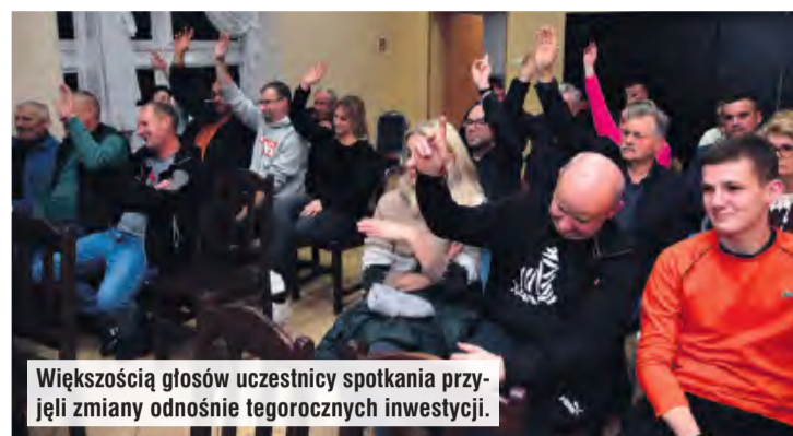
Większością głosów uczestnicy spotkania przyjęli zmiany odnośnie tegorocznych inwestycji.

Z tego miejsca uczniowie mieliby dużo bliżej do swoich domów. Mieszkaniec wskazał też inne możliwe rozwiązanie problemu. Zamiast stawiać wiatę, do której dzieci musiałyby pokonywać kilka kilometrów, gmina mogłaby zwracać rodzicom koszty dojazdu do i ze szko-