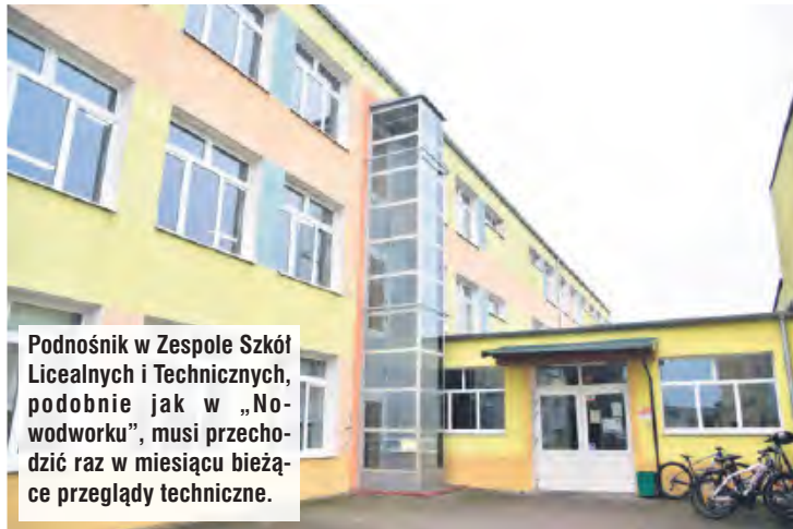
Podnośnik w Zespole Szkół Licealnych i Technicznych, podobnie jak w „Nowodworku”, musi przechodzić raz w miesiącu bieżące przeglądy techniczne.

W ramach projektu, na którego realizację tucholskie starostwo pozyskało 1.265.468,10 zł dofinansowania z Unii Europejskiej (wkład własny samorządu wyniósł kolejne 221.900 zł), przeprowadzono także kompleksowy remont pięciu pracowni. Nowy wygląd i wyposażenie zyskały dwie sale do nauki matematyki, języka polskiego, a także informatyki (łącznie z komputerami). No-