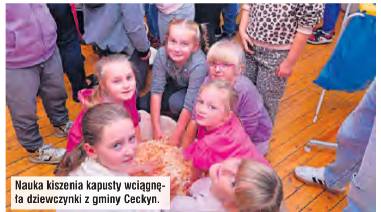
Nauka kiszenia kapusty wciągnęła dziewczynki z gminy Cekcyn.

mionkowych garnkach. Dzieci dowiedziały się też o kolejno następujących po sobie czynnościach, m.in. o przebijaniu kapusty za pomocą drewnia-