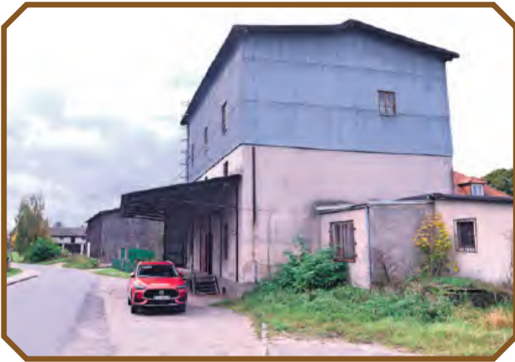
Budynek przy ul. Młyńskiej w Cekcynie. Przed wiekiem znajdował się w tej okolicy (w kierunku jeziora Główka) okazały wiatrak – holender.