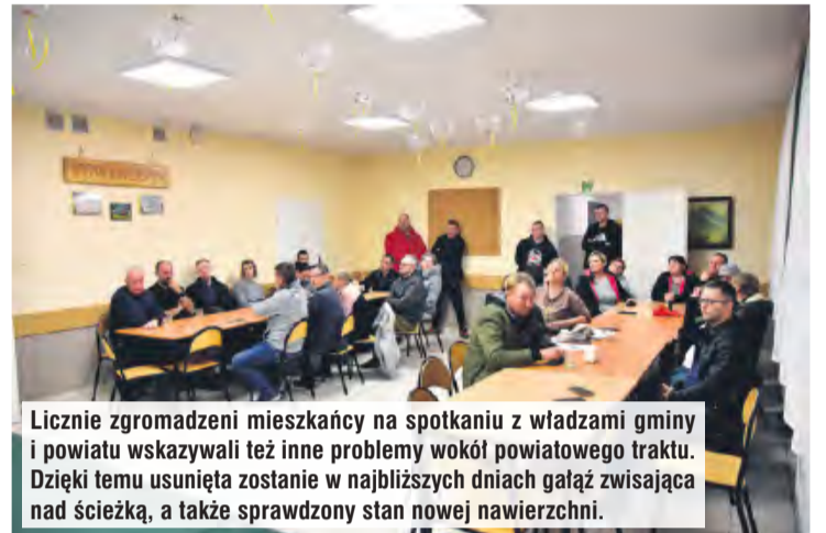
Licznie zgromadzeni mieszkańcy na spotkaniu z władzami gminy i powiatu wskazywali też inne problemy wokół powiatowego traktu. Dzięki temu usunięta zostanie w najbliższych dniach gałąź zwisająca nad ścieżką, a także sprawdzony stan nowej nawierzchni.

– Wiecie państwo jaka jest nawierzchnia w samym Węlpinie i okolicach. Jest bardzo gliniasta. Mimo tego, że są czasami rowy i woda spływa na pobocza, to akurat tutaj tak nie jest. Wykonawca