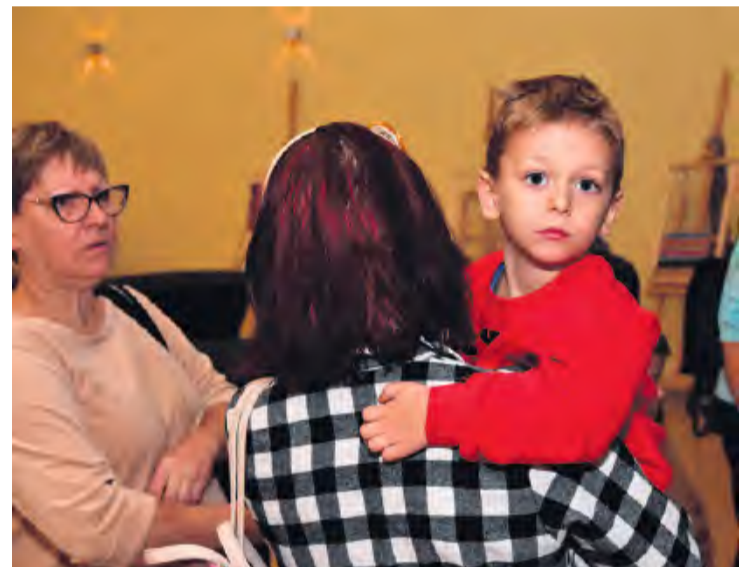
W Bibliotece – Centrum Kultury i Promocji Gminy Lubiewo po raz kolejny gościła rodzinna atmosfera.

scy mieli okazję skosztować wysmienitego żurku, pstrąga w occie, pieczywa oraz drożdżówki. Nie lada frajdę, bez względu na wiek, sprawiało uczestnikom odszukiwanie swoich prac, które po zakończeniu wystawy mogli zabrać do domów. Dodajmy, że całe przedsięwzięcie zostało dofinansowane ze środków Narodowego Instytutu Kultury i Dziedzictwa Wsi w programie „Folk(od) nowa”.