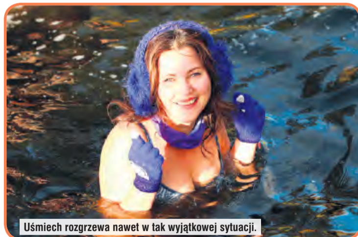
Uśmiech rozgrzewa nawet w tak wyjątkowej sytuacji.