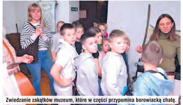
Zwiedzanie zakątków muzeum, które w części przypomina borowiacką chatę.

– Dzieci zwiedziły ekspozycje stałe muzeum i poznały historię, tradycje oraz zwyczaje ludowe swojego regionu. W części zajęć praktycznych poznały rytuał kiszenia kapusty. Było krojenie, szatkowanie i smakowanie surowej kapusty, później mieszanie jej z solą i marchewką, a następnie ubijanie trampkiem w ka-