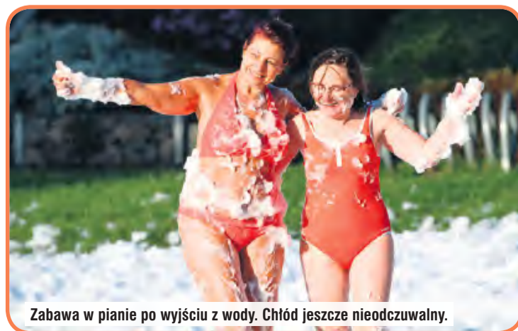
Zabawa w pianie po wyjściu z wody. Chłód jeszcze nieodczuwalny.

służyć uświetnieniu ważnego wydarzenia wśród członków Stowarzyszenia Morsy z Borów Tucholskich, a było nim otwarcie sezonu 2025/2026. Na plaży pojawiły się: sauna, turbogrill (do ogrzania się), potężna plama piany, ponadto zwykły grill i nagłośnienie. Nie zabrakło także oznaczeń, ozdób, barw klubowych i banerów. Dzięki nim nie można było nie wiedzieć, co się tu dzieje.