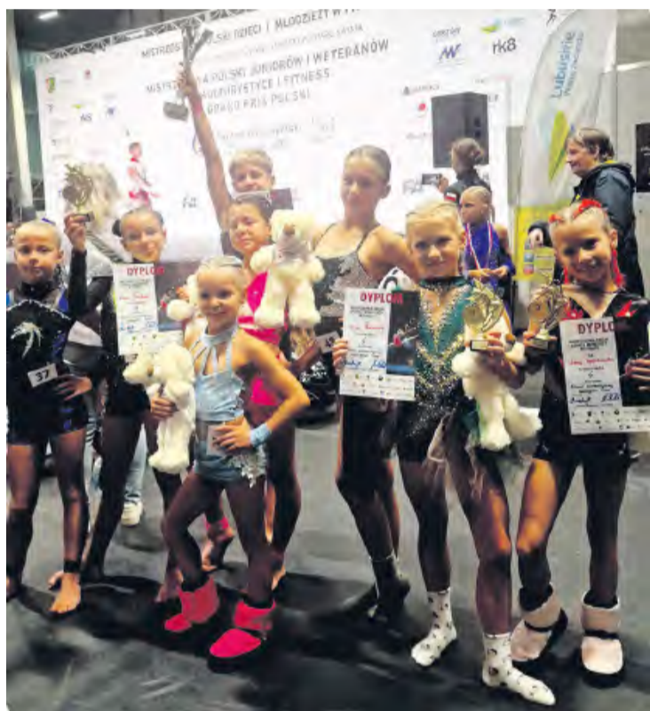
Część ekipy Fitness Sportowy Tuchola, która wzięła udział w mistrzostwach Polski.