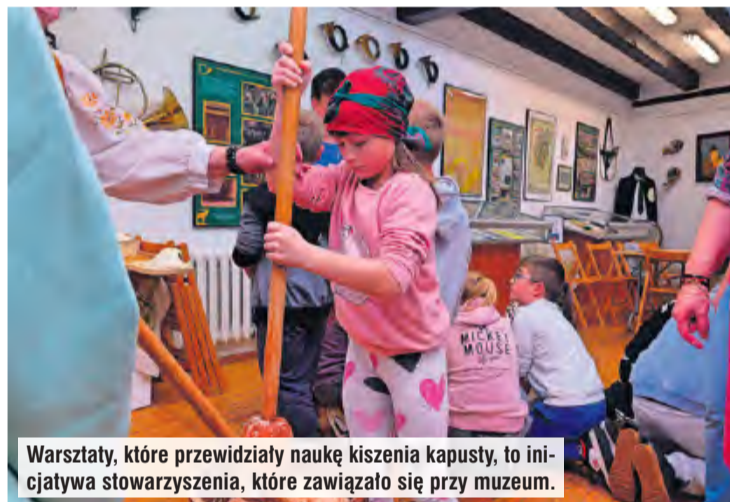
Warsztaty, które przewidziały naukę kiszenia kapusty, to inicjatywa stowarzyszenia, które zawiązało się przy muzeum.

Dzieci prezentowały m.in. bł. Karolinę Kózkównę, św. Barbarę, św. Franciszka, Hiacyntę Marto, Marię Teresę Goretti