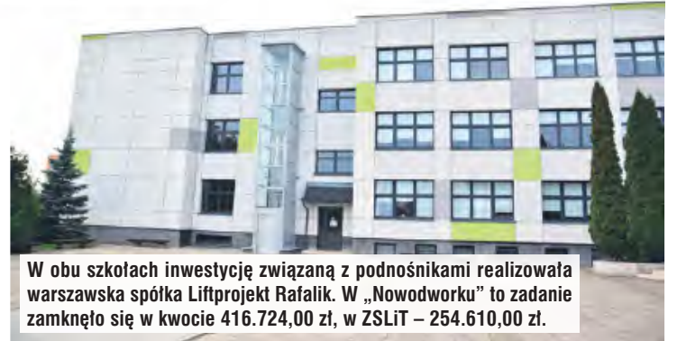
W obu szkołach inwestycję związaną z podnośnikami realizowała warszawska spółka Liftprojekt Rafalik. W „Nowodworku” to zadanie zamknęto się w kwocie 416.724,00 zł, w ZSLiT – 254.610,00 zł.