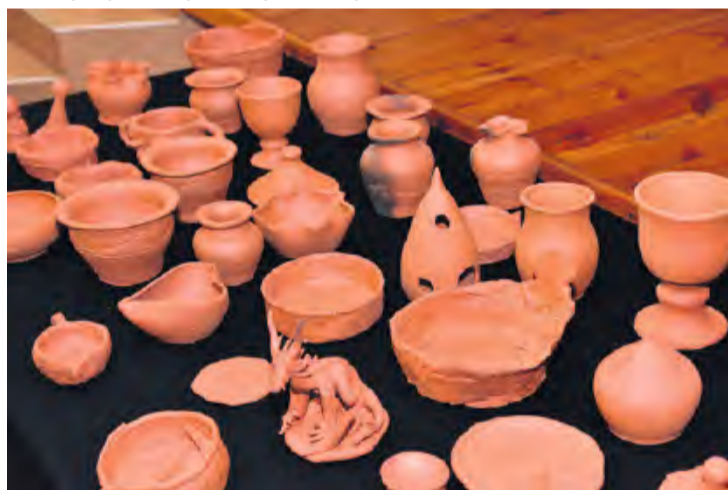
Wyroby gliniane, które powstały na kole garncarskim, przybrały najrozmaitsze formy.