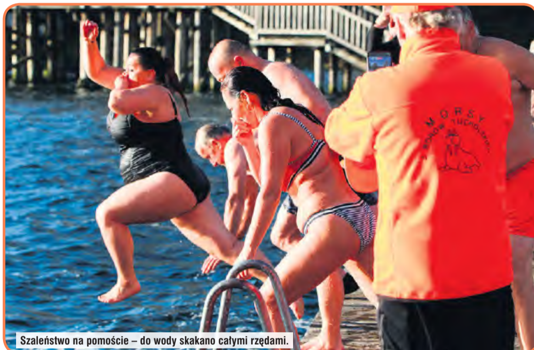
Szaleństwo na pomoście – do wody skakano całymi rzędami.