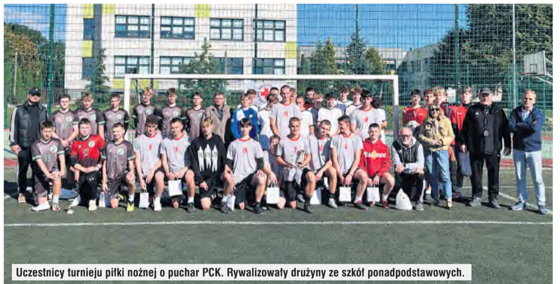
Uczestnicy turnieju piłki nożnej o puchar PCK. Rywalizowały drużyny ze szkół ponadpodstawowych.