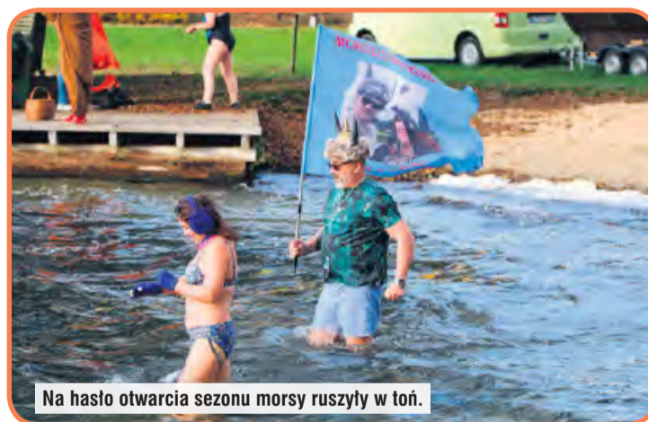
Na hasło otwarcia sezonu morsy ruszyły w toń.

na – to właśnie ona pierwszy raz weszła zimą do lodowatej wody jako...sześciolatka, więc warto by – wedle słów mówiącej o małej bohaterce – napisać do firmy Google, by zaktualizowała swoje dane i uwzględniła, że nie tylko sześciolatek jest