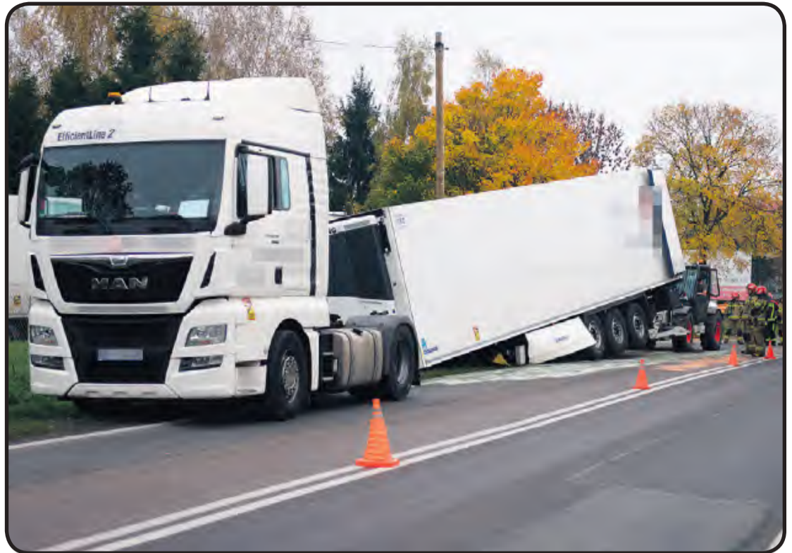
Czwartek 23 października. Do niebezpiecznej sytuacji doszło na drodze wojewódzkiej 240 w okolicach Bładowa. Naczepa wypięła się z pojazdu siodłowego. Na szczęście nikomu nic się stało. Do kierowcy z gminy Śliwice powędrował mandat.