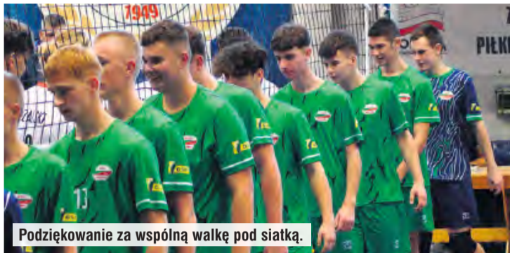
Podziękowanie za wspólną walkę pod siatką.

Tucholanie musieli przelknąć gorzką pigułkę już na początku sezonu i podczas pierwszego starcia o punkty. Mecz nie trwał długo. Rozstrzygnięty w trzech setach będących zupełną dominacją bydgoszczan. Tylko w jednej z odsłon Borowiacy przekroczyli barierę dziesięciu punktów. Należy pamiętać, że początki bywają trudne, a zespół z Bydgoszczy to doświadczony team