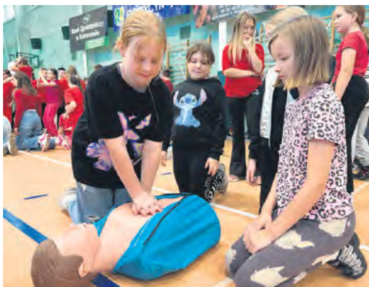
W ćwiczeniach z resuscytacji wzięli udział uczniowie w różnym wieku.

Wydarzeniu towarzyszyła atmosfera zaangażowania, energii i wspólnego działania dla ważnego celu – nauki ratowania życia. (aw), fot. SP w Gostycynie