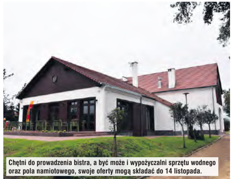
Chętni do prowadzenia bistra, a być może i wypożyczalni sprzętu wodnego oraz pola namiotowego, swoje oferty mogą składać do 14 listopada.

Minimalna miesięczna kwota tego czynszu nie może być niższa niż 3000 zł netto – w przypadku dzierżawy tylko części socjalno-gastronomicznej. Natomiast przedsiębiorca, który zdecyduje się na prowadzenie działalności gastronomicznej, ale też wypożyczalni sprzętu wodnego i pola namiotowego, będzie musiał zapłacić minimum 2500 zł netto. Dodajmy, że podane minimalne kwoty nie obejmują podat-