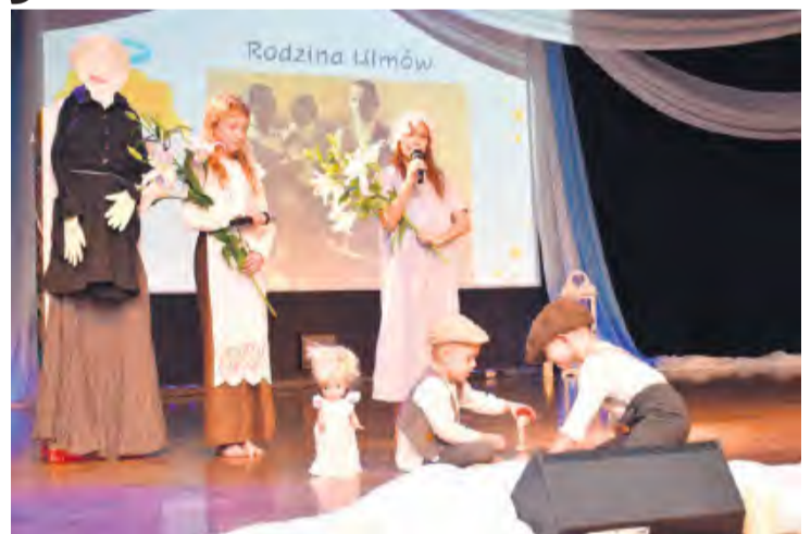
Podwójne zwycięstwo przyniosła rodzina Ulmów.

Aleksandra Śmigiel oraz Tomasz Klinger dodatkowo oceniali: biogram świętego, ciekawostki na jego temat (np. cud czy charakterystyczne wydarzenia), sposób przedstawienia świętego lub błogosławionego, które nie pozostawiały wątpliwości, co do tożsamości prezentowanej postaci oraz przedstawienie