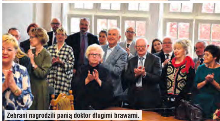
Zebrani nagrodzili panią doktor długimi brawami.