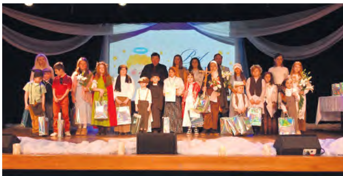
Do tegorocznej edycji „Balu Świętych” przystąpiło 17 osób.