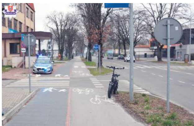
Rowerzysta został potrafił na przejeździe dla rowerów.

Do wypadku doszło 1 kwietnia około godziny 14.10. –Zc wstępnych ustaleń poli-