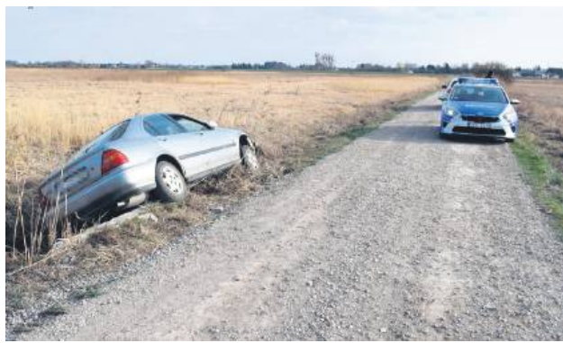
Pijany 43-latek z gm. Zamość skończył jazdę w rowie.

43-latek z sądowym zakazem prowadzenia pojazdów, mając w organizmie ponad 3 promile, kierował hondą. W jednej z miejscowości w gminie Zamość stracił panowanie nad pojazdem, wjechał do przydrożnego rowu i uderzył w przepust.