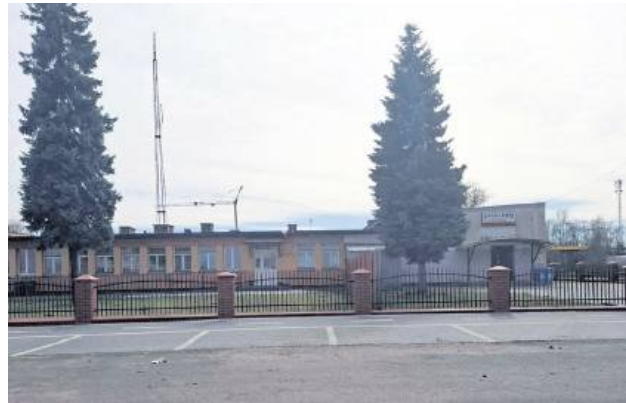
Tymczasowa siedziba Centrum Kultury znajduje się przy ul. Tomaszowskiej 81 w Ulhówku.

– Musimy być gotowi na nabór, który ma być ogłoszony