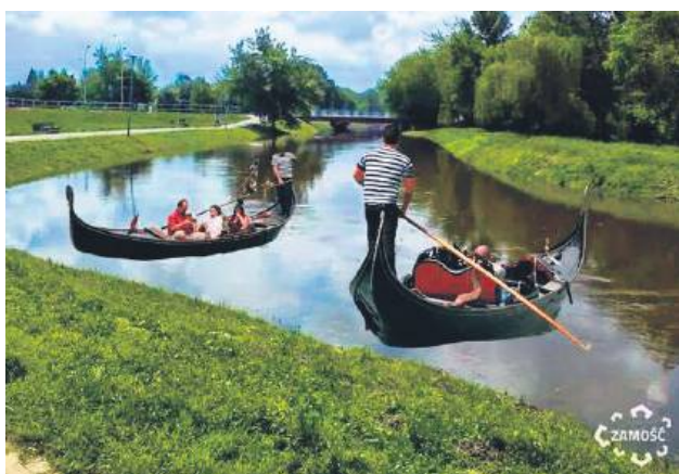
Zamość miały zostać drugą Wenecją.

Dzięki unijnemu dofinansowaniu oraz wsparciu lokalnych przedsiębiorców już 1 maja miasto uda się uruchomić wodny transport publiczny między osiedlem Młyńska a Wiejską. Zamojskie gondole będą mogły pomieścić do 10 pasażerów, a rejsy będą odbywać się codziennie od godz. 10 do 22. W planach są trzy przystanki: Weteranów, Sienkiewicza i Okrzei. W razie niesprzyjających warunków (czytaj: suszy) gondole zostaną wyposażone w kółka, a pasażerowie będą mogli siłą własnych