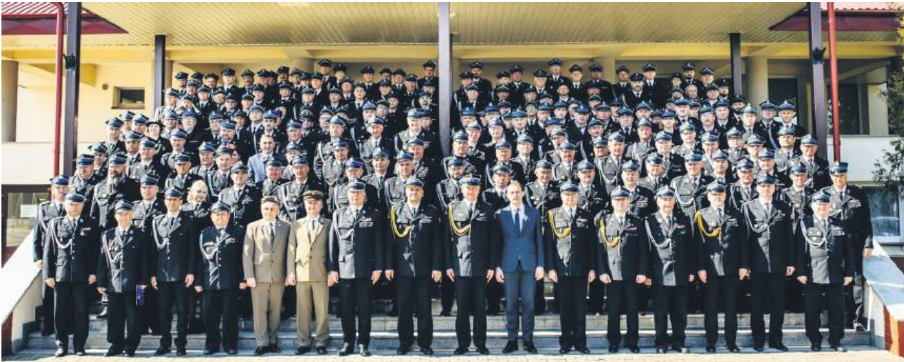
Tradycyjne, pamiątkowe zdjęcie na schodach Komendy Powiatowej PSP w Tomaszowie.

Wydarzenie zgromadziło ponad 200 uczestników – w tym przedstawicieli