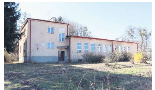
Szkoła Rolnicza w Dołhobyczowie została zlikwidowana około dekady temu, a teraz są spore szanse na przebudowę, adaptację i utworzenie tam Centrum Opiekuńczo-Mieszkalnego.

korzystnie, pomimo że na uboczu, to blisko centrum Dołhobyczowa, w pobliżu ośrodka zdrowia, kościoła i sklepów. Dodatkowo teren porastają stare drzewa, które planujemy pozostawić. Z diagnozy społecznej Gminy Dołhobyczów wynika wprost, że ta inwestycja to „strzał w 10” dla naszego starzejącego się społeczeństwa i jednocześnie trochę, tak ważnych dla nas, miejsc pracy. Centrum Opiekuńczo-Mieszkal-