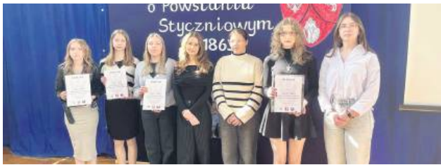
Uczniowie LO im. ONZ biorący udział w konkursie.

Konkurs został zorganizowany już po raz 32. Uczestnicy musieli wykazać się wiedzą o Powstaniu Styczniowym (1863-1864), z uwzględnieniem działań powstańczych na Lubelszczyźnie. Jego pierwsza edycja odbyła się w 1993 roku, jest więc