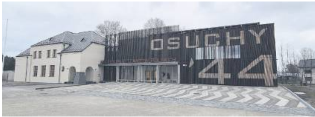
Budowa nowego obiektu kosztowała blisko 13 mln zł.

Wybudowane w Osuchach (gm. Łukowa) Muzeum Partyzantów Polskich będzie pierwszym w kraju muzeum narracyjnym, którego tematyka skoncentruje się na historii polskich partyzantów. Budynek jest już gotowy.