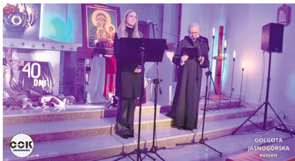
„Golgota jasnogórska” to poetycka Droga Krzyżowa.