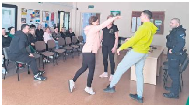
Uczestnicy zajęć w GOPS w Horodlu zapoznali się z teorią i przećwiczyli różne techniki samoobrony.

Policjanci z Hrubieszowa uczyli pracowników socjalnych Gminnego Ośrodka Pomocy Społecznej w Horodlu, jak mają reagować i się bronić w sytuacjach różnego zagrożenia. Do tej pory nie odnotowano żadnych przypadków ataku na pracowników tego ośrodka, ale profilaktyka bezpieczeństwa wcześniej lub później może się okazać bardzo pomocna.