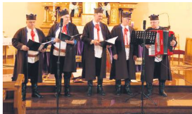
Organizatorzy zaprosili do udziału 18 wykonawców.

Patronat nad wydarzeniem sprawowała redakcja „Kroniki Tygodnia”. wd