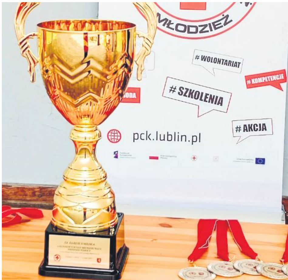
Nagrody dla najlepszych drużyn ufundowały Starostwo Powiatowe w Tomaszowie Lubelskim oraz Urząd Miasta Tomaszów Lubelski.

Mistrzostwa Pierwszej Pomocy to ogólnopolski konkurs co roku organizowany przez Polski Czerwony Krzyż. Jest skierowany do uczniów szkół średnich. Młodzież ćwiczy udzielanie pierwszej pomocy poszkodowanym w wypadkach w warunkach zbliżonych do rzeczywistych, dzięki sztucznej krwi, rekwizytom i profesjonalnej charakterystyce.