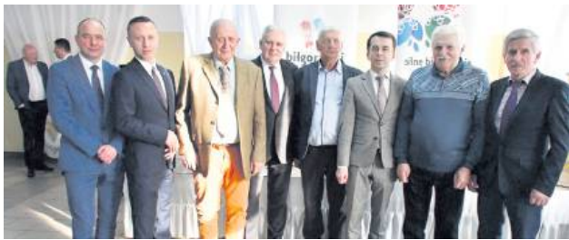
Celem wydarzenia było uhonorowanie ciężkiej pracy sołtysów.

Dzień sołtysa to coroczne święto datowane na 11 marca.