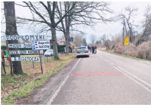
2 kwietnia odbyło się w Guciuwie spotkanie w sprawie poprawy bezpieczeństwa na drodze.

– Latem Guciuw przypomina zakopiańskie Krupówki, dochodzi tu do wypadków, giną też dzikie zwierzęta, dlatego warto zapewnić bezpieczeństwo mieszkańcom i turystom, przywracając trasę ścieżki rowerowej