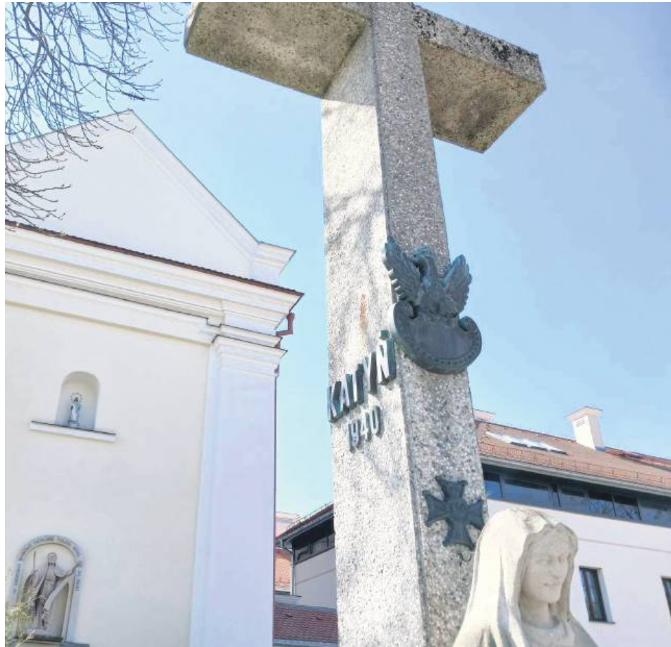
Nowa tablica będzie eksponowana na zewnętrznej ścianie prezbiterium, pod figurą św. Andrzeja Boboli i za Krzyżem Katyńskim.

Obchody rocznicowe rozpoczyna się 13 kwietnia o godz. 11.25. Zaplanowano okolicznościowe