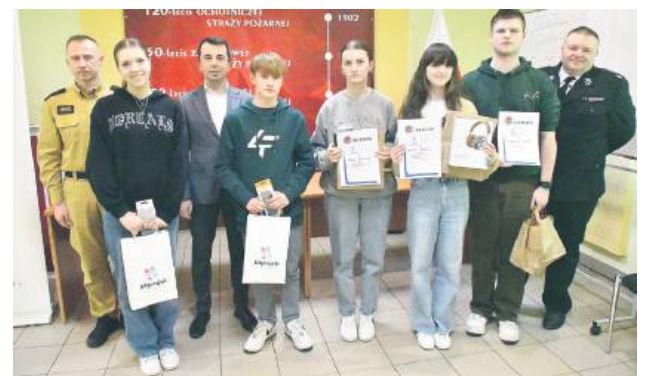
Najlepsi w kategorii uczniów szkół średnich.