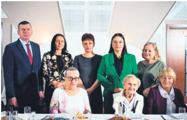
Były gratulacje, życzenia, kwiaty, upominki, a nawet lampka szampana.

Bilisy jednej z najstarszych mieszanek gminy zorganizowali uroczystość, na którą zaprosili m.in. przedstawicieli gminnych władz samorządowych. Jak powiedział syn, z którym obecnie mieszka pani Marianna, jednym z jej sposobów na zachowanie kondycji