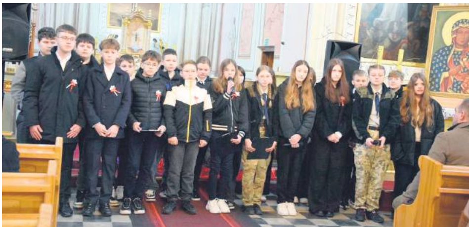
W uroczystości uczestniczyli m.in. uczniowie Szkoły Podstawowej im. Kardynała Stefana Wyszyńskiego w Telatynie.

2 kwietnia w Poturzynie odbyły się uroczystości patriotyczne w 81. rocznicę mordu na mieszkańcach wioski. Udział w nich wzięły władze powiatu tomaszowskiego, gminy Telatyn oraz wielu mieszkańców.