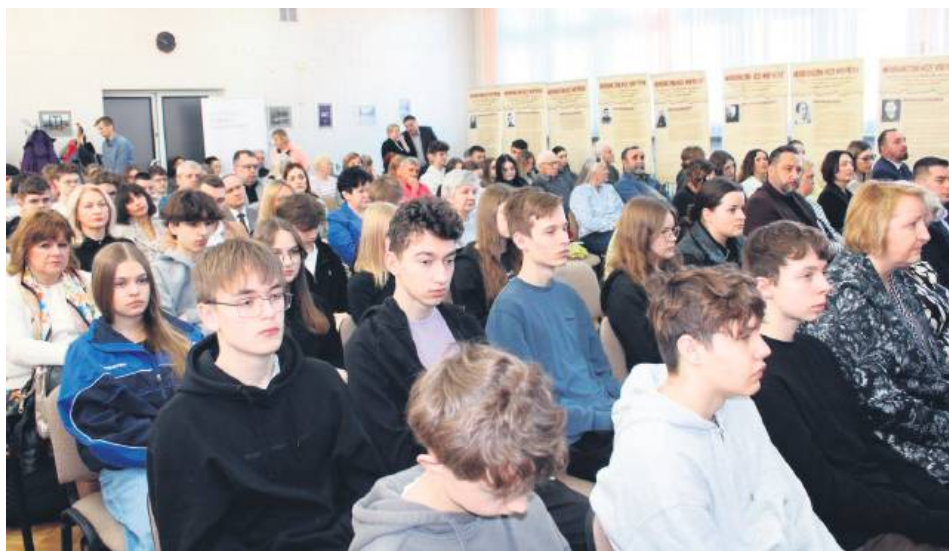
Udział w wydarzeniu wzięli również młodzi ludzie.