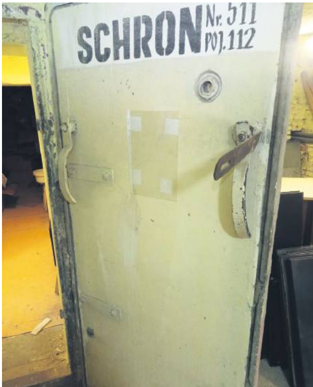
W Hrubieszowie są jedynie pozostałości po schronach z czasów PRL.

Ponad 4 lata temu pisaliśmy w „Kronice Tygodnia” o zimnowojennych schronach w Hrubieszowie za tzw. komuny. Wiele