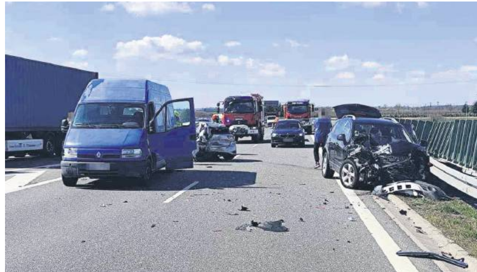
Nieodpowiedzialny manewr zamościanki był przyczyną groźnego wypadku.