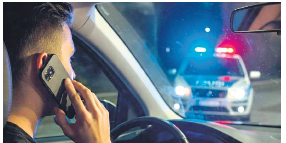
Nawet kilka sekund nieuwagi za kierownicą może doprowadzić do niebezpiecznych następstw.