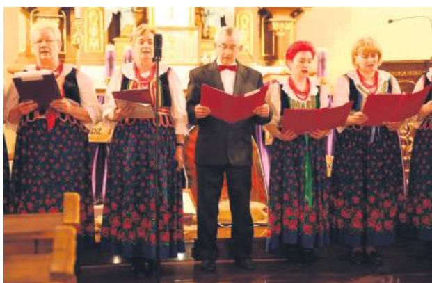
Przegląd Pieśni Pasyjnych w Bełżcu na stałe wpisał się w kalendarz kulturalny regionu.

Co roku Przegląd Pieśni Pasyjnej organizowany przez Gminny Ośrodek Kultury w Bełżcu gromadzi zespoły i chóry prezentujące pieśni pasyjne oraz pokutne, będące nie tylko formą modlitwy, ale także artystycznym wyrazem duchowej refleksji. Tym razem cieszył się tak dużym zainteresowaniem, że zgłoszenia zakończono przyjmować tuż po rozpoczęciu. Organizatorzy przyznali prawo wystąpienia osiemnastu