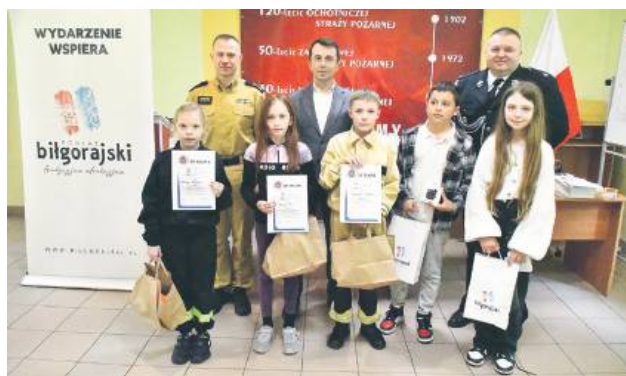
Najlepsi w kategorii uczniów szkół podstawowych.

47. edycja prestiżowego turnieju zgromadziła 35 uczestników, którzy zmagali się z testem i pytaniami przed komisją sędziowską. Turniej składał się z testu pisemnego i pytań ustnych. Uczestnicy konkursu mieli także możliwość zapoznania się ze sprzętem pożarniczym będącym na wypo-