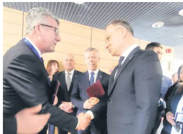
Burmistrz Tomaszowa odbył owocną rozmowę z prezydentem.

To remedium na problemy Tomaszowa, który z roku na rok traci coraz więcej mieszkańców.