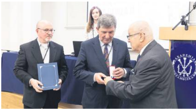
Rektor AZ otrzymał Medal Jana Pawła II.

Po nabożeństwie obrady przeniosły się do auli Roberta Schumana w Akademii Zamojskiej, gdzie zgromadzili się przedstawiciele środowiska naukowego oraz instytucji związanych z dziedzictwem Jana Pawła II. – Jan Paweł II to największa postać wśród wielkich postaci, które stanowią o naszej tożsamości. To pierwszy Polak w historii, który został głową Kościoła i zasiadł w Stolicy Piotrowej.