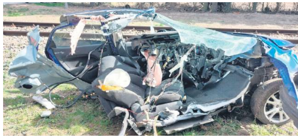
Kierująca samochodem 43-latka nie przeżyła wypadku.