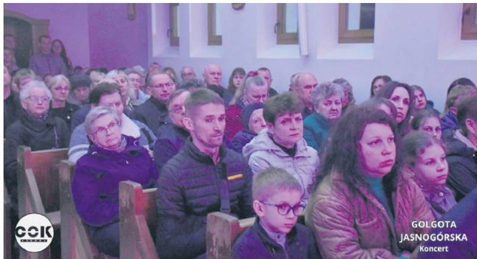
Kościół wypełniony był po brzegi.

G olgota jasnogórska to poetycka Droga Krzyżowa stworzona na podstawie tekstów Ernesta Brylla, inspirowana obrazami Jerzego Dudy-Gracza z Kaplicy Matki Boskiej Częstochowskiej. To niezwykle połączenie poezji i malarstwa, które przeniosło słuchaczy w głębię męki Pańskiej i dotknęło serce współczesnego odbiorcy.