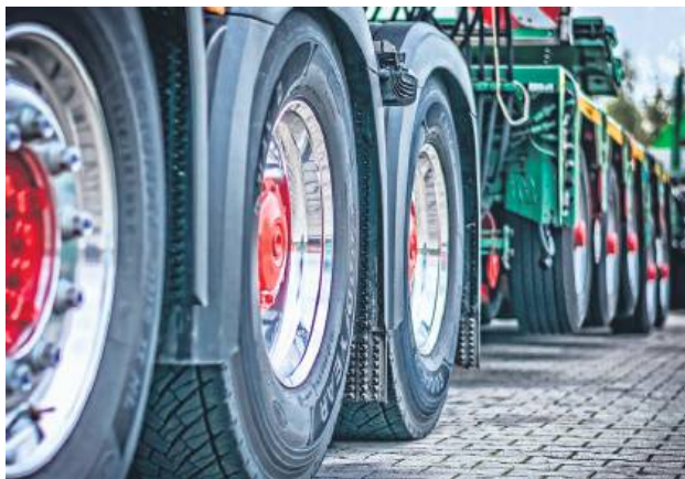
Dzięki niskim stawkom podatku od środków transportowych przedsiębiorcy wrócili do gminy Bełżec, nowi inwestorzy zgłosili swoje pojazdy, a wpływy do budżetu wzrosły.

W listopadzie ub.r. Rada Gminy Bełżec podjęła decyzję o znacznym obniżeniu podatku transportowego w 2025 roku. W niektórych kategoriach stawki spadły nawet o 50 proc., co oznacza, że gmina zeszła do minimalnego poziomu dopuszczonego przez ministra finansów.