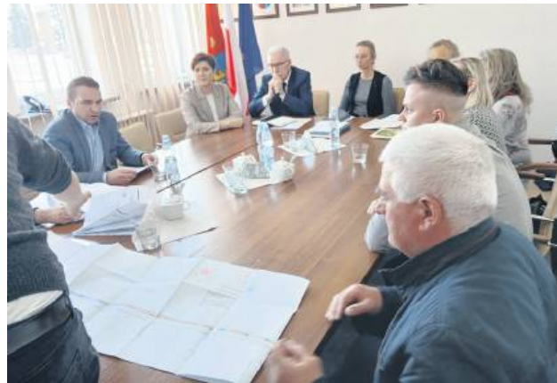
Pod koniec marca mieszkańcy spotkali się ze starostą zamojskim.