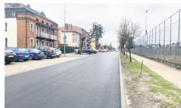
31 marca zakończono inwestycję zrealizowaną w ramach zadania pn. „Przebudowa drogi gminnej – ul. Wyspiańskiego w Tomaszowie Lubelskim”.