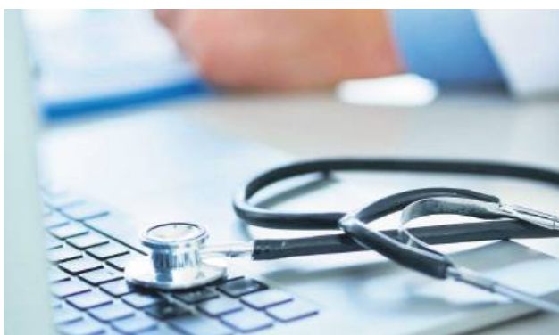
Szpital powiatowy dostał grant na wsparcie Poradni Podstawowej Opieki Zdrowotnej.

Samodzielny Publiczny Zespół Opieki Zdrowotnej w Tomaszowie Lubelskim reali-