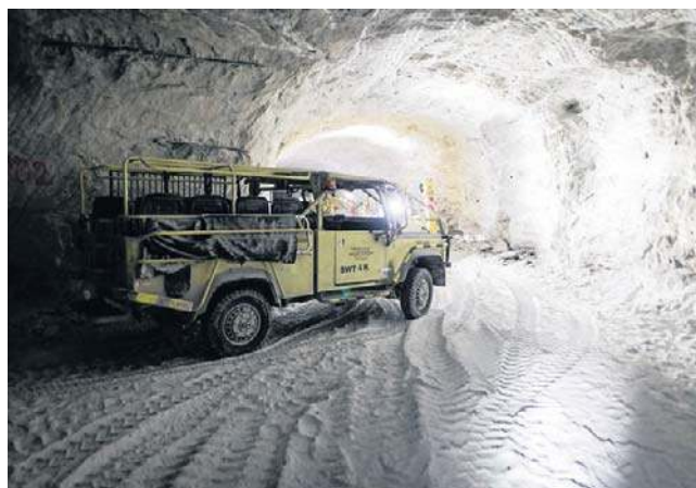
Mamy ogromne złoża soli kamiennych. Mimo to przegrywamy z zagranicznymi podmiotami, które oferują znacznie niższe ceny

– Możliwości produkcyjne kopalni w krajach UE są niewykorzystane, dlatego rynek polski narażony jest na napływ taniego produktu. Z powodu niskiego poziomu cen następuje również wypieranie polskiego „eksportu” soli do takich krajów, jak: Niemcy, Czechy, Słowacja, Węgry oraz kraje nadbałtyckie. Producenci niemieccy, K+S, SUD Salz, stanowią potężną konkurencję dla wszystkich produktów Kopalni Soli