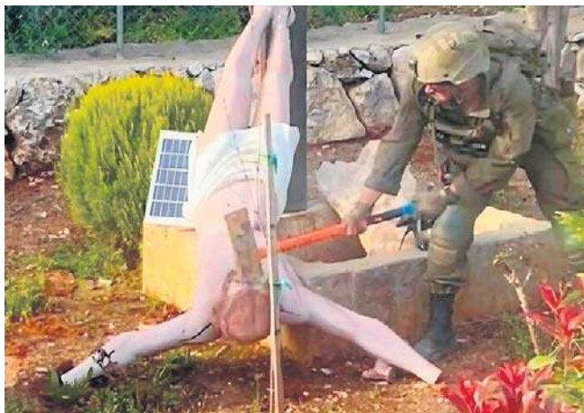
Na fotografii udostępnionej przez dziennikarzy widać żołnierza rozbijającego figurę Jezusa ciężkim młotem

Sprawę skomentował w poniedziałek na X szef MSZ Radosław Sikorski. „Dobrze, że minister Saar szybko przeprosił, było za co. Należy ukarać tego żołnierza, ale i wyciągnąć wnioski wobec sposobu, w jaki są formowani” - napisał Sikorski. PAP