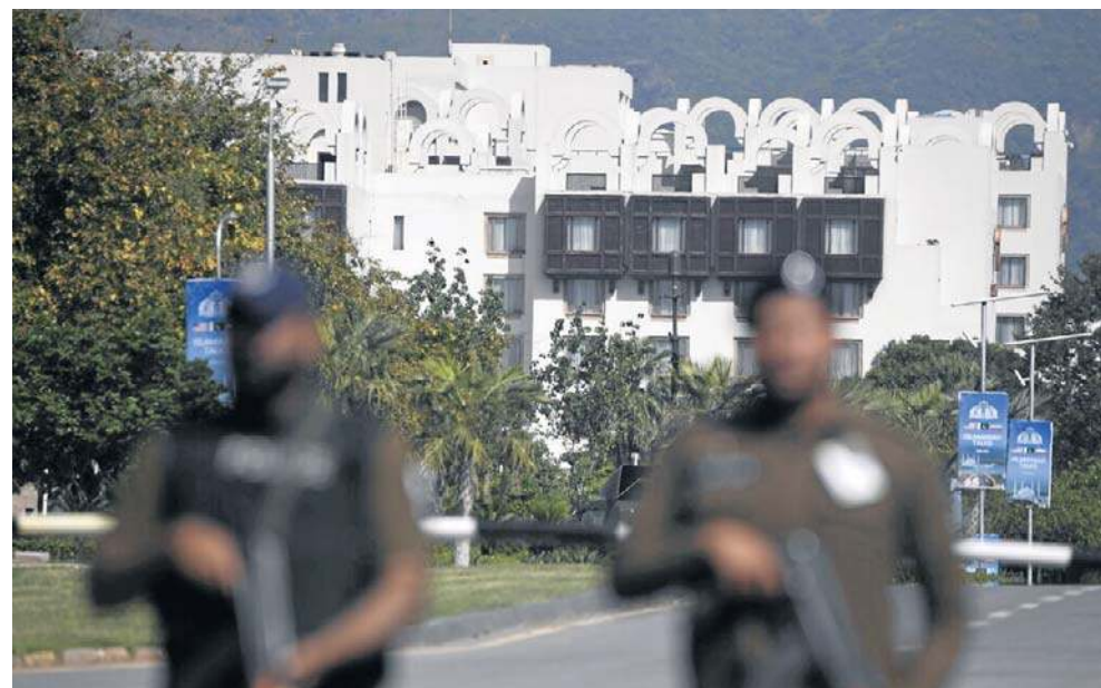
Widok hotelu Serena, w którym 20.04 odbyły się ostatnie rozmowy pokojowe między USA a Iranem. Czy dojdzie do kolejnego spotkania?

Oznajmił też, że usunięcie z Iranu materiałów nuklearnych nigdy nie było traktowane przez jego kraj jako opcja w negocjacjach i ostateczne stanowisko Teheranu jest takie, iż jego „osiągnięcia nuklearne” muszą pozostać na terytorium kraju.