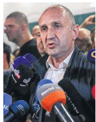
Rumen Radew udziela pierwszych komentarzy

Rok po odejściu z wojska został prezydentem Bułgarii z poparciem postkomunistycznej Bułgarskiej Partii Socjalistycznej. W drugiej turze pokonał