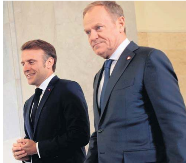
Wizyta w Gdańsku prezydenta Macrona to kolejny etap zacieśniania relacji polsko-francuskich

„Zgodnie z postanowieniami artykułu 51 Karty Narodów Zjednoczonych w przypadku napaści zbrojnej na ich terytorium Strony udzielają sobie nawzajem pomocy, w tym przy zastosowaniu środków wojskowych. Pomoc