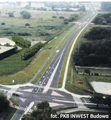
fot. PKB INWEST Budowa

przyłączeniowe, nie mogą przesądzać, że projektowane budynki stanowią całość techniczno-użytkową. Również okoliczność objęcia zamierzenia budowlanego jednym wnioskiem nie może być argumentem przemawiającym za sumowaniem powierzchni i