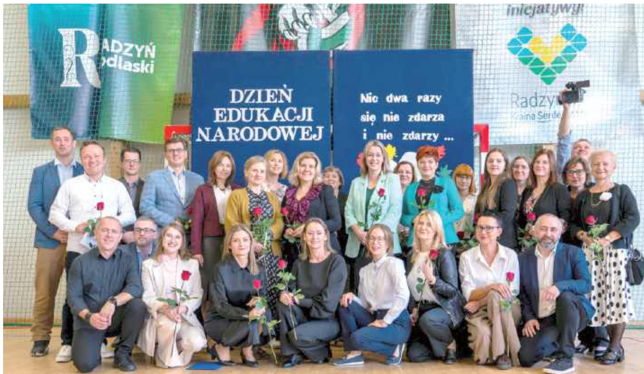
Grono pedagogiczne I LO w Radzynie Podlaskim to zgrany zespół