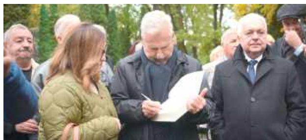
Aleksander Kwaśniewski podpisuje książkę

– Była symbolem lubelskiej Lewicy. Wszyscy pamiętają te słynne dyżury przy ul. Beliniaków, kiedy to przychodzili ludzie, którym zawsze udzieliła pomocy bez względu na sytuację. Wyciągała