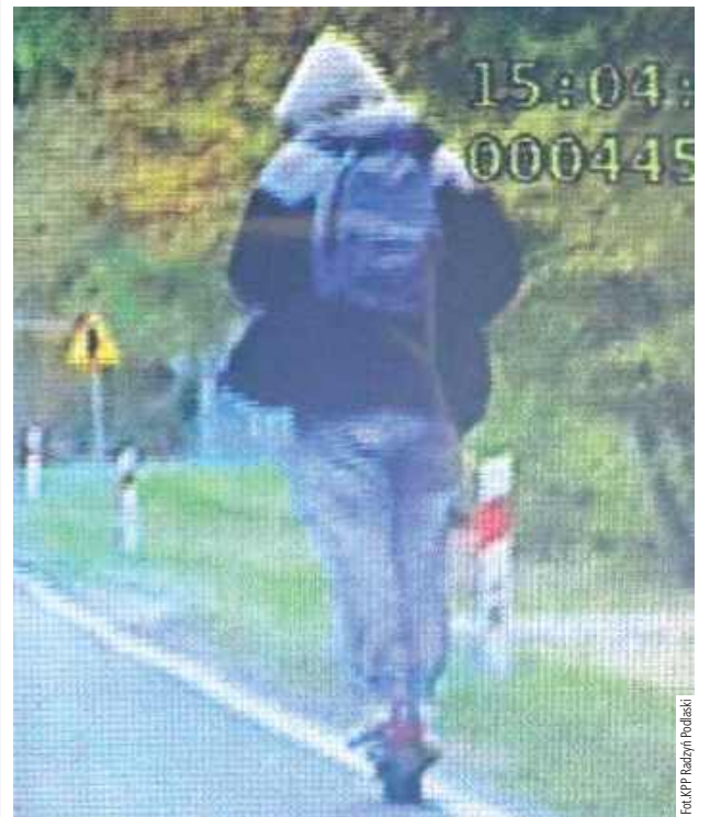
Funkcjonariusze zauważyli, że mężczyzna miał problem z utrzymaniem toru jazdy, co wzbudziło ich podejrzenia

16 października radzyscy policjanci zatrzymali do kontroli drogowej mężczyznę, który jechał hulajnogą elektryczną na drodze krajowej nr 63 w miejscowości Bezwola. Zauważyli, że miał problem z utrzymaniem toru jazdy.