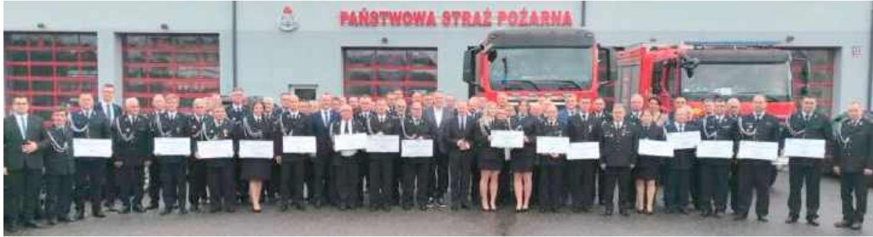
Promesy trafiły do 26 jednostek

Strażacy z powiatów: bialskiego, radzyńskiego i parczewskiego odebrali promesy na zakup sprzętu do ratowania życia i mienia. W tym gronie jest 7 jednostek z powiatu parczewskiego.