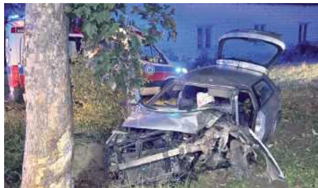
Kierowca Audi stracił panowanie nad pojazdem i uderzył w przydrożne drzewo. Zabrało go Lotnicze Pogotowie Ratunkowe

GM. ADAMÓW: W miejscowości Budziska doszło do groźnego wypadku drogowego