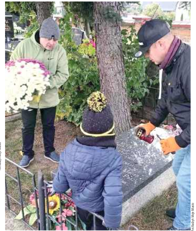
Porządkowano starsze, mniej zadbane groby i otoczenie cmentarza