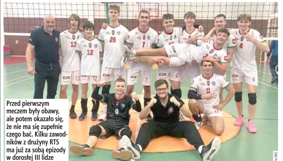
Przed pierwszym meczem były obawy, ale potem okazało się, że nie ma się zupełnie czego bać. Kilku zawodników z drużyny RTS ma już za sobą epizody w dorosłej III lidze

Juniorzy Radzyńskiego Klubu Sportowego swój debiutancki sezon zaczęli od zwycięstwa w Krasnymstawie.