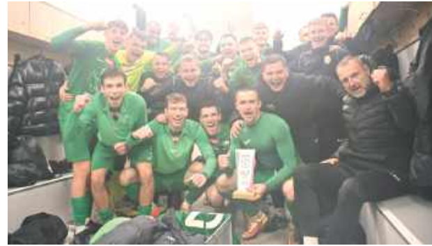
Radość białczan po kolejnym zwycięstwie na wyjeździe