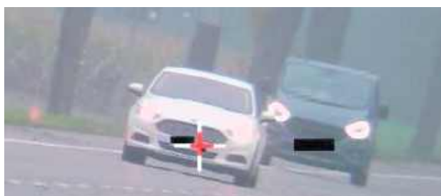
Obydwa kierowcy stracili uprawnienia na najbliższe trzy miesiące

Biała Podlaska: Policjanci zatrzymali dwóch kierowców, którzy znacznie przekroczyli prędkość w terenie zabudowanym. Zarówno 30-latek kierujący Seatem jak też 29-latek siedzący za kierownicą Forda stracili uprawnienia.