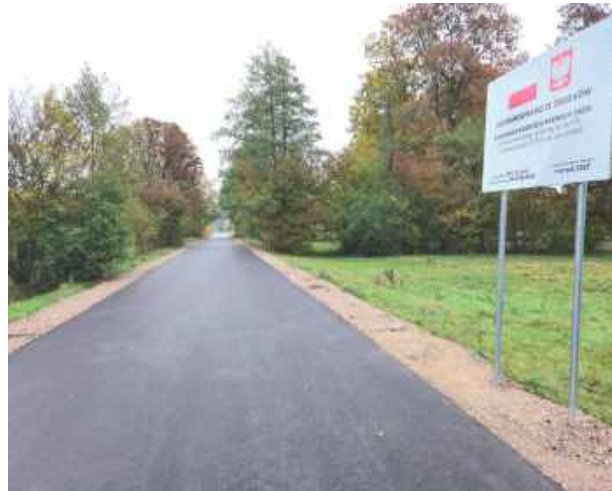
Inwestycja objęła przebudowę drogi gminnej nr 101715L o długości 566 metrów