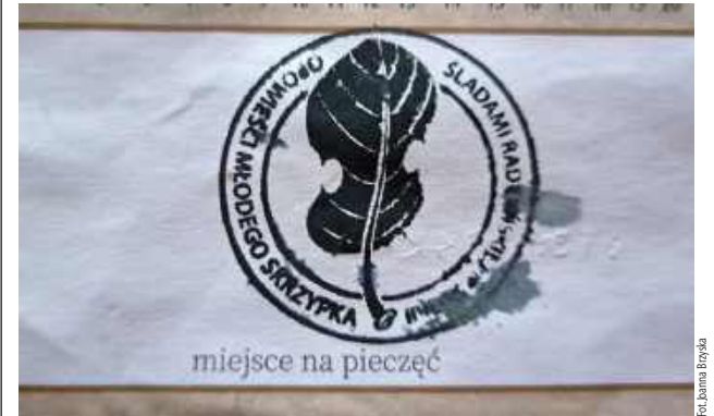
Tak wygląda tajemnicza, radzyńska pieczęć

18 października w Radzynie wystartowała gra terenowa „Śladami radzyńskiej historii - opowieści młodego skrzypka”.