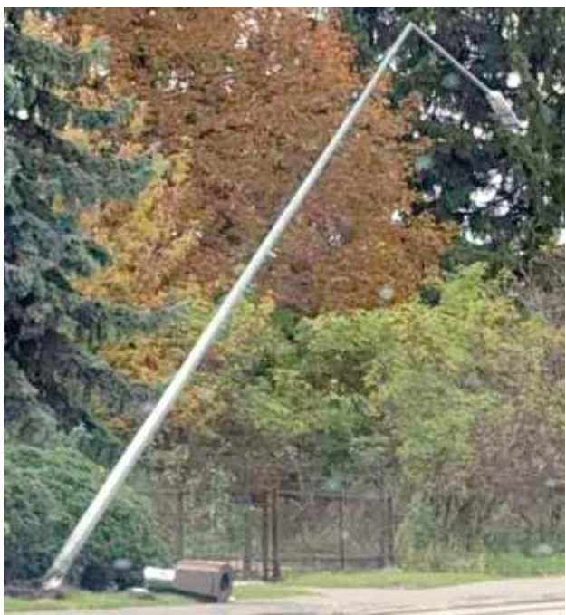
Pijany 34-letni mieszkaniec Łukowa uderzył audi w latarnię uliczną

ŁUKÓW: W piątek, 10 października około godz. 20 w Łukowie na ul. Cieszkowizna, doszło do zdarzenia drogowego.