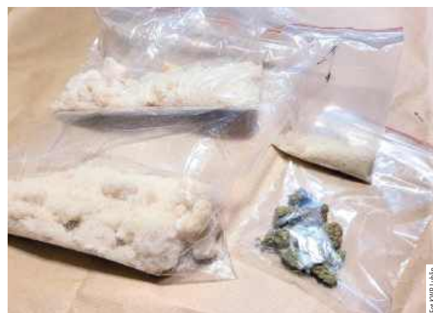
Mężczyźni działający w grupie przewozili kobiety do wynajętych lokali i sprawowali nad nimi nadzór

Podczas przeszukań policja znalazła broń gazową i hukową oraz amunicję, imitację legity-