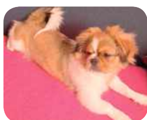
Alvin, Krystyna Kurowska, Biała Podlaska