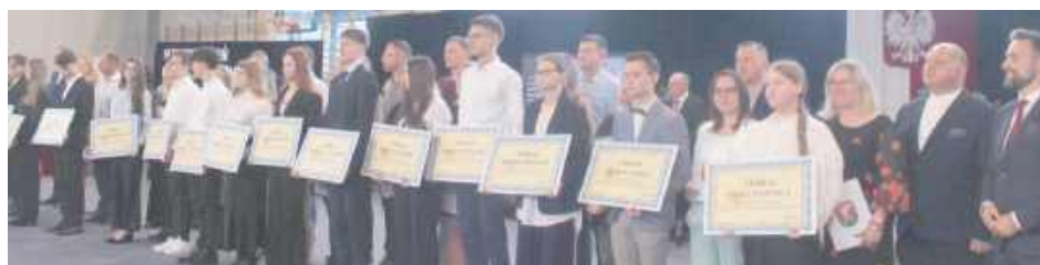
Stypendyści prezydenta Białej Podlaskiej z różnych typów szkół.

- Setki milionów złotych corocznie angażujemy środków, by środowisko oświatowe mogło funkcjonować na poziomie satysfakcjonującym – mówił. Dodał, że w szkołach i przedszkolach pracuje ponad 1100 nauczycieli i ponad 200 pracowników placówek oświatowych. W miejskich szkołach uczy się ponad 10 tys.