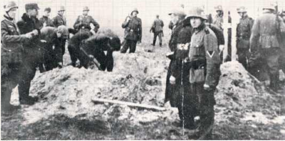
Zdjęcie nieznanego pochodzenia spotykane w internecie z opisem wskazującym, że dotyczy ono egzekucji w Cycowie. Raport o poniesionych przez Polskę stratach w wyniku okupacji niemieckiej wskazuje na 15 miejsc na terenie dzisiejszej gminy Cyców, gdzie dokonały się takie zbrodnie

Odwetowa akcja Wehrmachtu spowodowana była chęcią zemsty za straty poniesione w czasie walki z oddziałem partyzanckim złożonym w dużej części ze zbiegłych jeńców sowieckich. Najpierw zabito trzynastu mężczyzn. Kolejnego dnia jeszcze jednego podpalono żywcem i dobito strzałem z pistoletu. Z całego przysiółka zostały tylko dwa gospodarstwa.