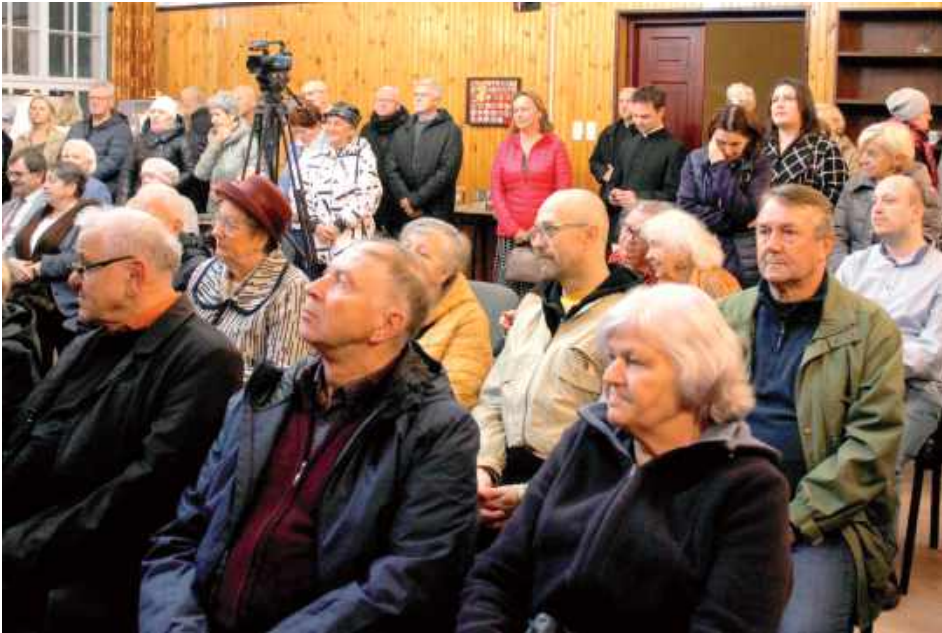
Na spotkanie przybyło wielu zainteresowanych, którzy ze wzruszeniem dzielili się swoimi wspomnieniami

Podczas spotkania uczestnicy mieli okazję obejrzeć archiwalne zdjęcia dokumentujące spotkanie mieszkańców Radzyna z papieżem oraz wysłuchać świadectw osób, które miały możliwość osobiście go