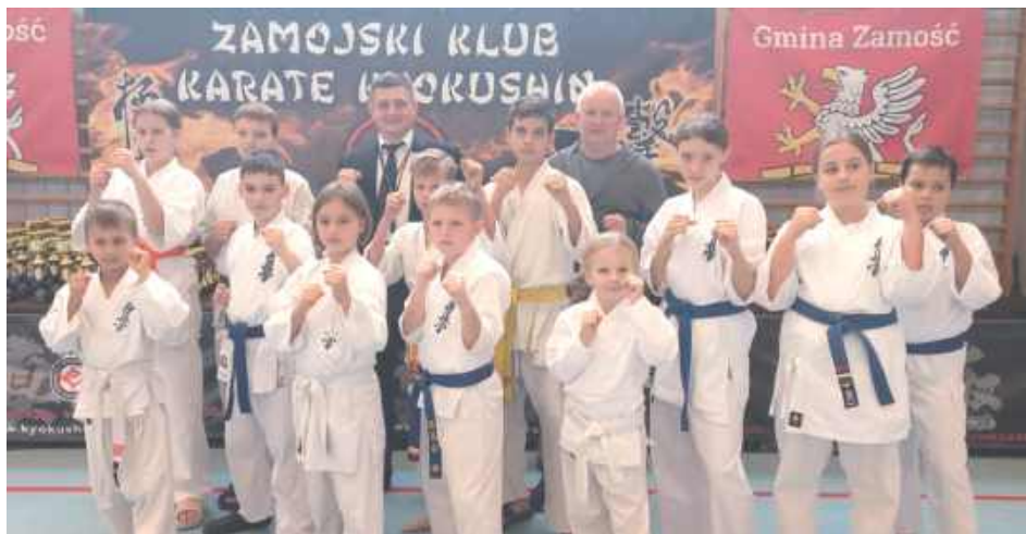
Dwóch wodzów, dwunastu wojowników, wspólny sukces

Spośród dwustu trzydziestu siedmiu zawodników z siedemnastu klubów rywalizujących w V Turnieju Karate Kyokushin koło Zamościa dwunastu reprezentowało Radzyński Klub Karate Kyokushin Raptor. Efekt: dziesięć krążków!