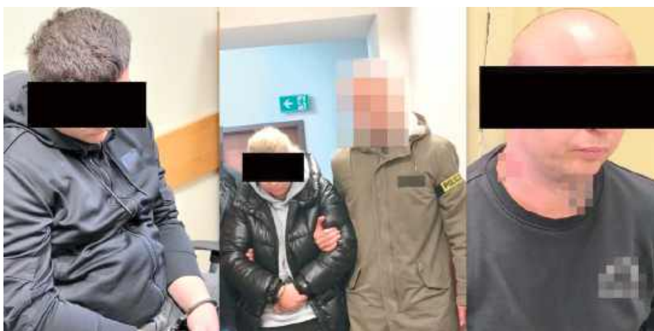
Mężczyźni działający w grupie przewozili kobiety do wynajętych lokali i sprawowali nad nimi nadzór

- Następnie umawiała spotkania z klientami poprzez zamieszczanie ofert w internecie. Grupa wynajmowała w tym celu mieszkania w danym mieście przez najbliższe dni i przewoziła tam kobiety. Wśród nich była 27-latka,