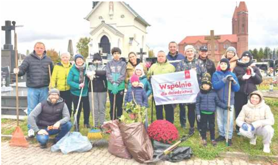
Kilkanaście osób zebrało się tylko po to, by poświęcić swój czas na porządkowanie naszej wspólnej przestrzeni

Organizatorzy podkreślają, że wspólna praca na cmentarzu to nie tylko troska o porządek, ale również czas refleksji, rozmów i wspomnień. Jak co roku, w wydarzeniu uczestniczyli mieszkańcy Radzyna, którzy z zaangażowaniem i dobrym humorem podjęli się tego za-