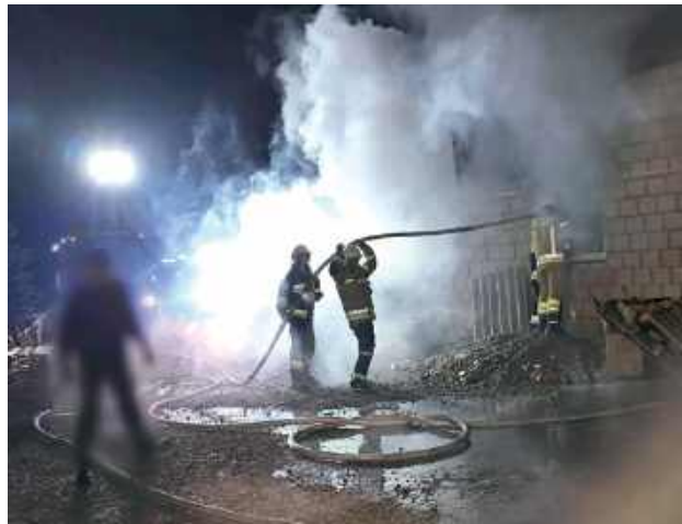
Po przybyciu służb ratunkowych na miejsce pożaru działania skupiły się na szybkim opanowaniu ognia i zabezpieczeniu terenu

15 października około godziny 21 służby ratunkowe zostały powiadomione o pożarze budynku gospodarczego w Olszewnicy. Na miejsce zdarzenia natychmiast udało się osiem zastępów straży pożarnej, w tym jednostki z OSP Polskowola, OSP Kąkolewnica, OSP Wygnanka, OSP Turów, OSP Żakowola Stara oraz dwa zastępy