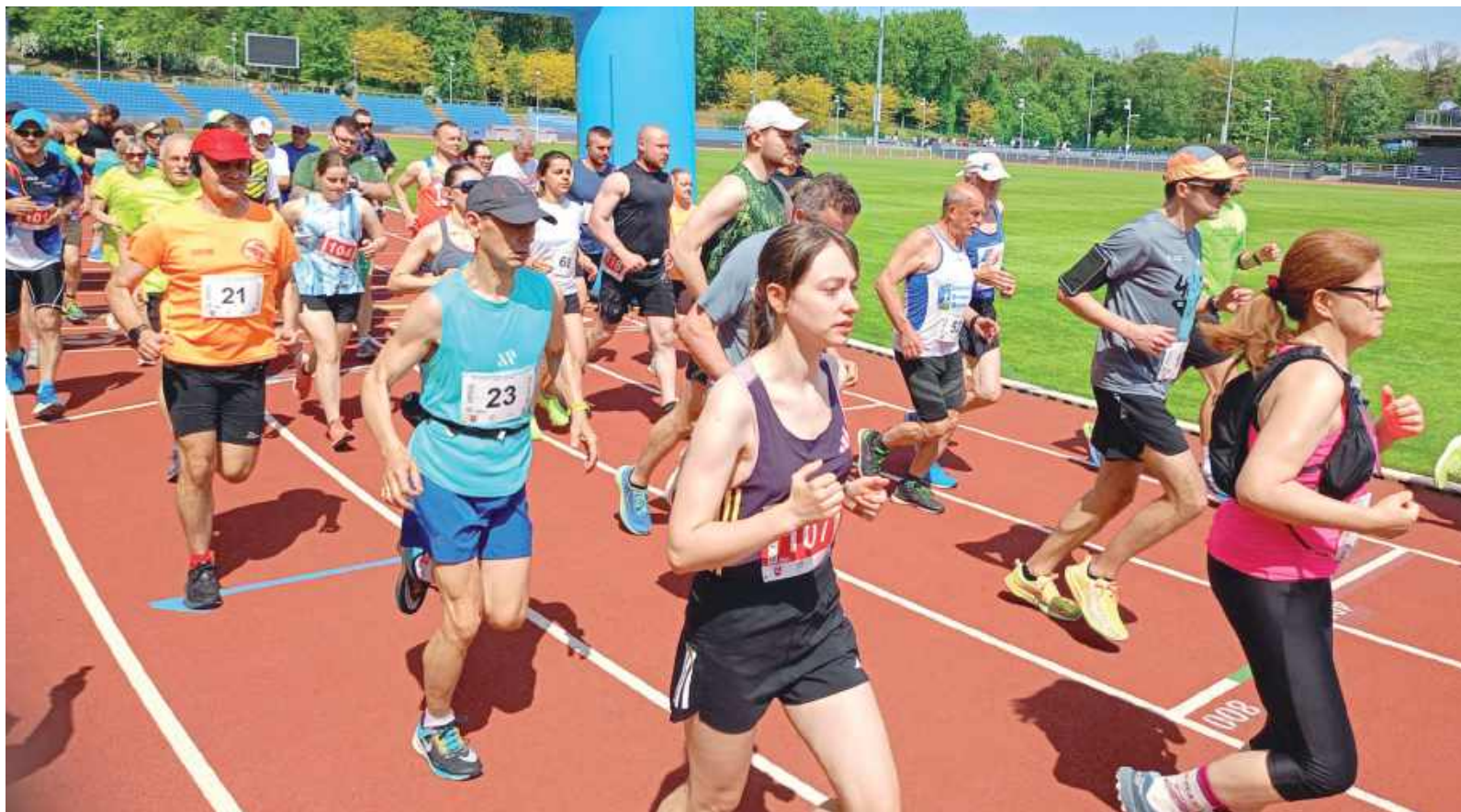
W rywalizacji na obu dystansach wzięło udział ponad 100 biegaczy i biegaczek