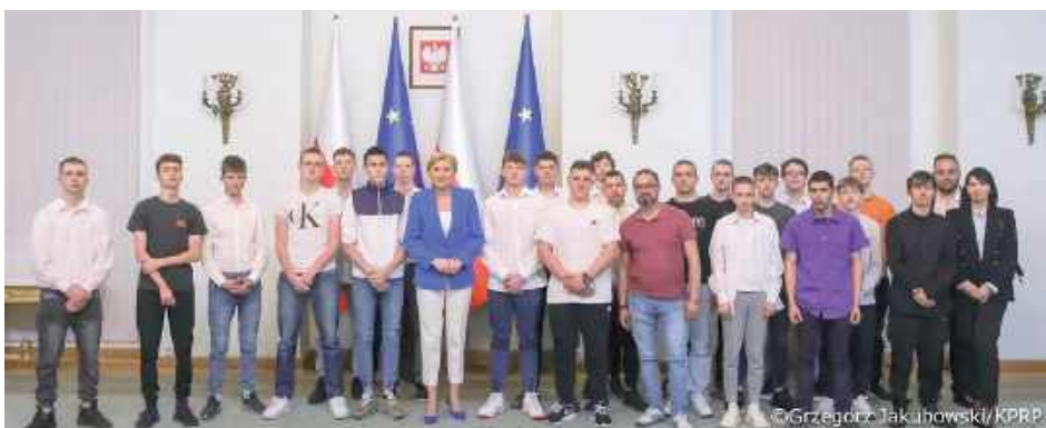
Wizyta w Pałacu Prezydenckim była okazją do zrobienia pamiątkowego zdjęcia we wnętrzach znanych jedynie z telewizji

– Każdy człowiek zasługuje na drugą szansę i wierzę, że z tego skorzystacie. Macie tu wspaniałe warunki do edukacji i osobistego rozwoju – mówiła Pierwsza Dama, gdy w 2023 r. wizytowała puławską placówkę. Teraz przyszedł czas na rewizytę i to podopieczni Młodzieżowego Ośrodka Wychowawczego odwiedzili ją w Pałacu Prezydenckim w Warszawie.