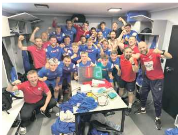
Bezcenne chwile. Radość puławian po wygranej na boisku Wieczystej Kraków

Choć Wisła Puławy mierzy się z poważnymi problemami organizacyjno-finansowymi