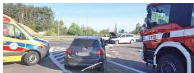
Jak ustaliła policja, zawinił kierowca Toyoty, który nieprawidłowo skręcał, przez co doprowadził do zderzenia z Oplem

- Jak ustalili policjanci, kierujący Toyotą 39-latek z gminy Baranów, jadąc od miejscowo-