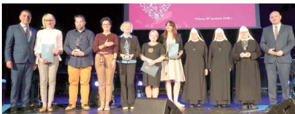
Nagrody w kategorii Puławski Organizacja Pozarządowa Roku 2024 trafiły do: Fundacji PIĘKNE-SILNE-WYJĄTKOWE, Fundacji Obok Nas oraz Fundacji Benedyktynki Zakątek