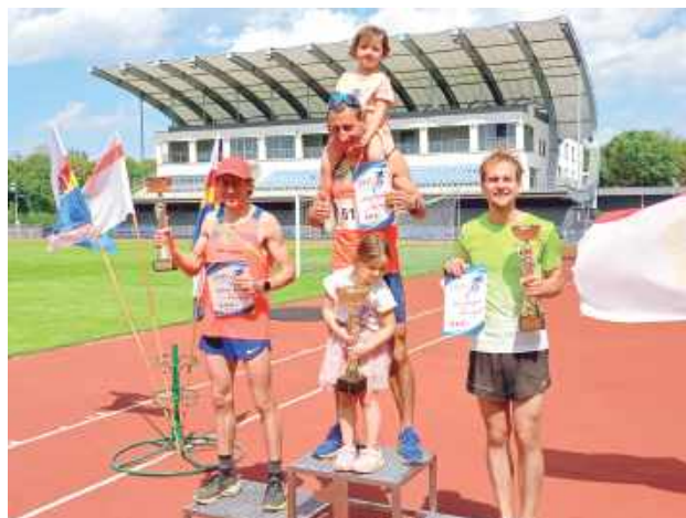
Najlepsi w biegu na 10 km