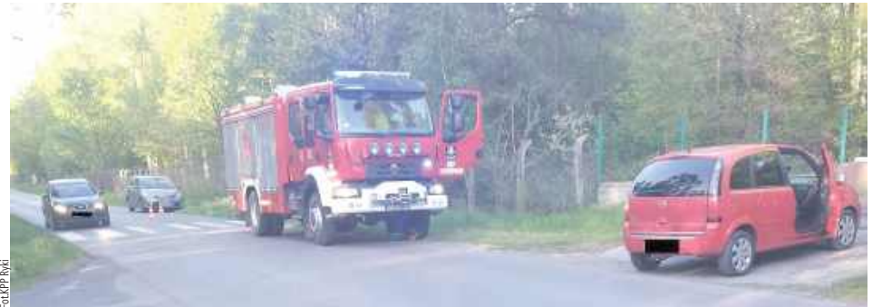
36-letnia mieszkanka Siedlec, kierująca oplem, nie zachowała należytej ostrożności podczas skrętu w lewo, w wyniku czego doprowadziła do zderzenia z kierującym motorowerem, który poruszał się drogą z pierwszeństwem przejazdu

Ze wstępnych ustaleń funkcjonariuszy wynika, że przyczyną zdarzenia było nieustąpienie pierwszeństwa przejazdu. 36-letnia mieszkanka