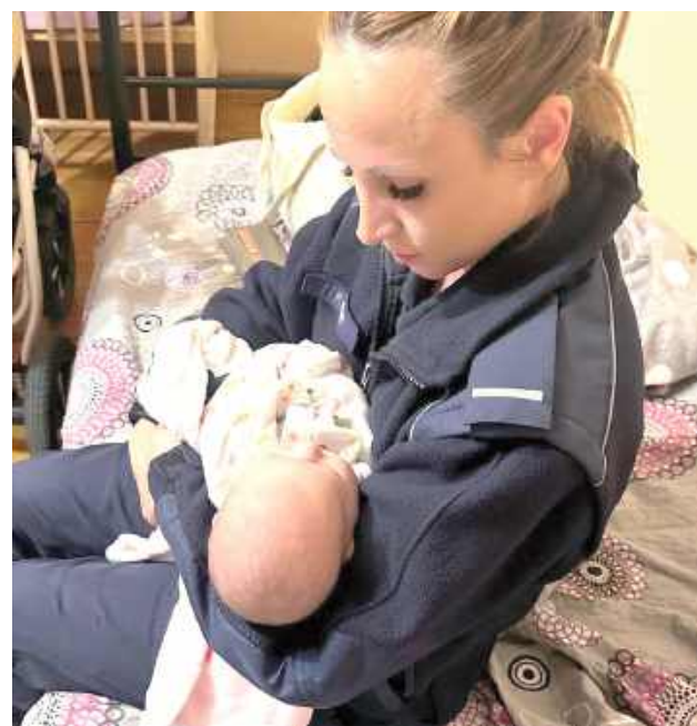
Do czasu przyjazdu wezwanej na miejsce karetki pogotowia dziećmi zajęła się policjantka

Po otrzymaniu zgłoszenia na miejsce dyżurny skierował patrol. Na podwórku pod domem funkcjonariusze zastali dziecięcy wózek, a w nim śpiące niemowlę oraz kilkuletniego chłopca. Dzieci przebywały na dworze bez nadzoru rodzica. Ponadto w wózku, w którym znajdowała się dziewczynka, policjanci ujawnili dwie butelki alkoholu. Po chwili wyszła z domu ich matka, którą okazała się 37-letnia obywatelka Ukrainy. Mundurowi wyczuli od niej wyraźną woń alkoholu, jednak ta zaprze-