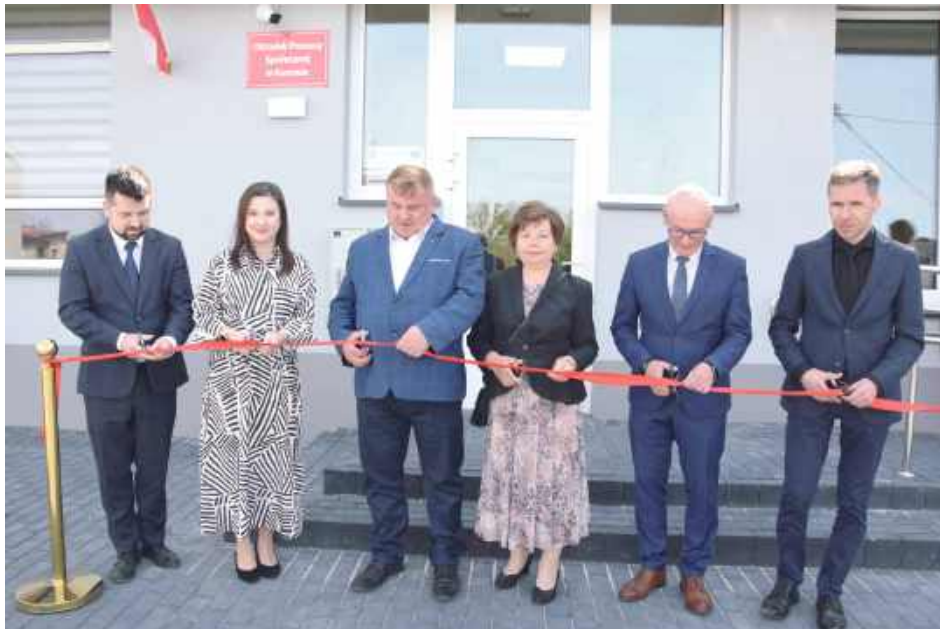
Kiedyś w gminnym budynku przy ul. Puławskiej mieścił się sklep. Po remoncie korzystają z niego pracownicy OPS. Teraz pracują i obsługują petentów w komfortowych warunkach

Jednak zawsze przeszkodą były pieniądze. Okazja do