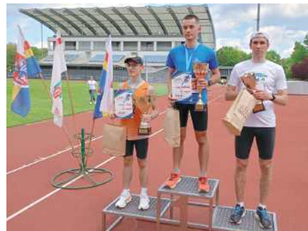
Podium najszybszych w biegu na 5 km