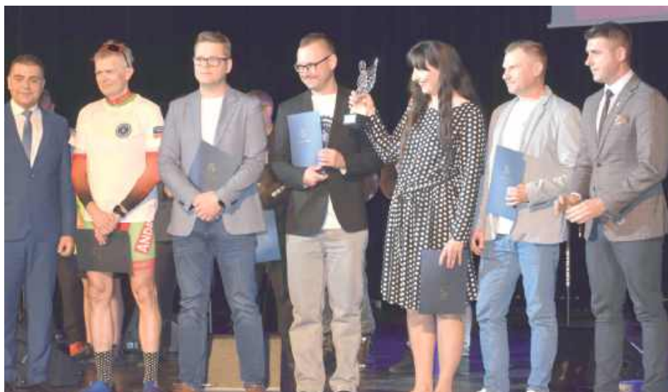
Podczas gali prezydent Puław nagrodził społeczników w dwóch kategoriach. Statuetkę w kategorii Puławski Społecznik Roku otrzymała Puławska Grupa Rowerowa, która aktywnie bierze udział w akcji Rowerowa Stolica Polski