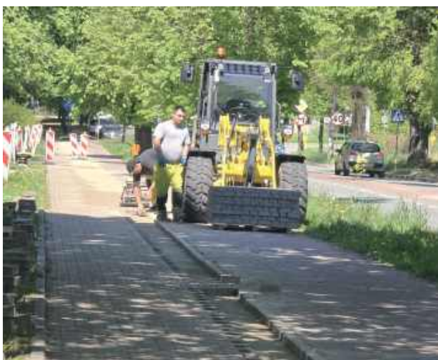
W ubiegłym tygodniu pracownicy Rejonu Dróg Wojewódzkich w Puławach rozpoczęli prace związane z usuwaniem krawężnika oddzielającego ścieżkę rowerową od chodnika wzdłuż ul. Kazimierskiej

Oddzielał chodnik od ścieżki rowerowej i stwarzał niebezpieczeństwo wywrócenia się, zwłaszcza dla młodszych rowerzystów, którzy dopiero zaczynają przygodę z rowerem. Dzięki interwencji radnych i władz miasta zostanie rozebrany.