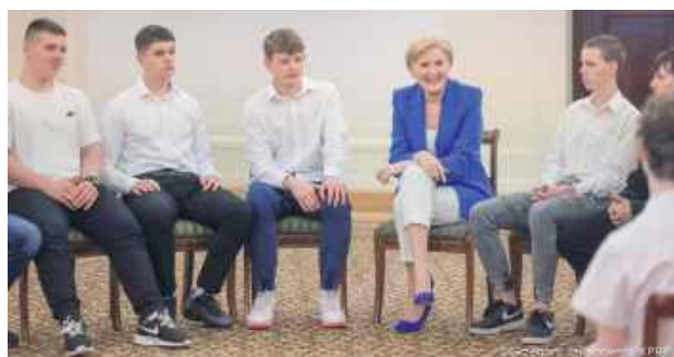
Spotkanie z Pierwszą Damą było okazją do rozmowy. Chłopcy opowiadali Agacie Kornhauser-Dudzie o swojej codzienności, zainteresowaniach