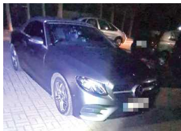
Kobieta kierowała nowym Mercedesem

Mężczyzna pojechał za autem sprawcy. W pewnym momencie