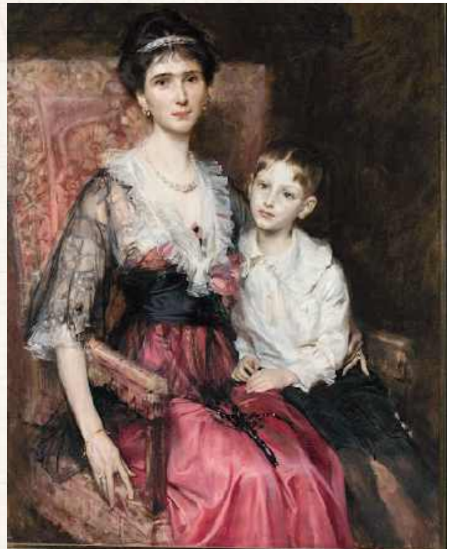
Księżna z synem Augustem, obraz Tadeusza Styki z 1914 roku w zbiorach Muzeum w Poznaniu

Majątek, jakim dysponowała w dwudziestolecu międzywojennym księżna Maria Ludwika Czartoryska, trudno było spisać. Jeszcze trudniej jest go sobie wyobrazić. W skład potężnych dóbr ziemskich i miejskich wchodziły też m.in. położone w powiecie łukowskim Gułów i Dębowica. Razem ponad 2000 hektarów.