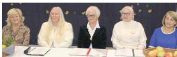
...oraz władze gminy

Rozstrzygnięty został również konkurs na fraszkę. Jury nagrodiło trzy prace: