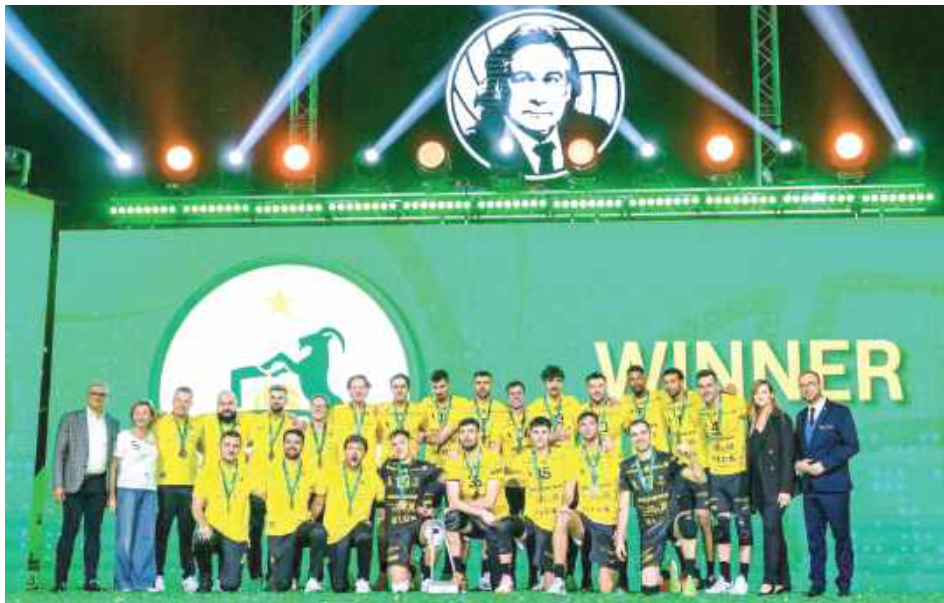
W Lublinie rozegrano Bogdanka Volley Cup im. Tomasza Wójtowicza!

W sobotę, 11 i niedzielę, 12 października w hali Globus odbył się Bogdanka Volley Cup im. Tomasza Wójtowicza, legendarnego siatkarza, którego imieniem nazwana jest również lubelska hala. Zmagania w sobotę otworzyli siatkarze Bogdanki LUK Lublin i JSW Jastrzębskiego Węgla. Lepszy w tym spotkaniu okazali się