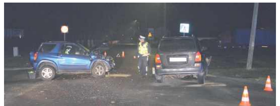
W chwili zdarzenia kierujący pojazdami byli trzeźwi

- Ze wstępnych ustaleń wynika, że podróżujący samochodem osobowym marki Hyundai 71-latek, wyjeżdżając z drogi podporządkowanej, nie ustąpił