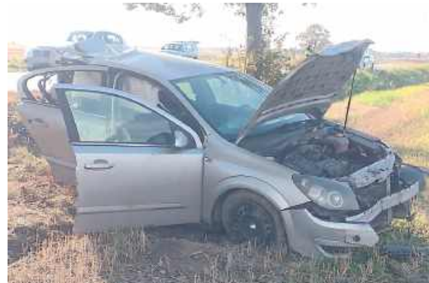
Do zdarzenia doszło w piątek, 10 października

Do tragicznego wypadku doszło w piątek, 10 października, po południu. Ze wstępnych ustaleń wynika, że kierująca