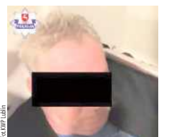
62-latek próbował ukryć się w szafie

„Łowcy głów” z Komendy Wojewódzkiej Policji w Lublinie odnaleźli 62-latkę poszukiwanego za włamanie. Mężczyzna próbował przechytrzyć policjantów i ukrył się w szafie.