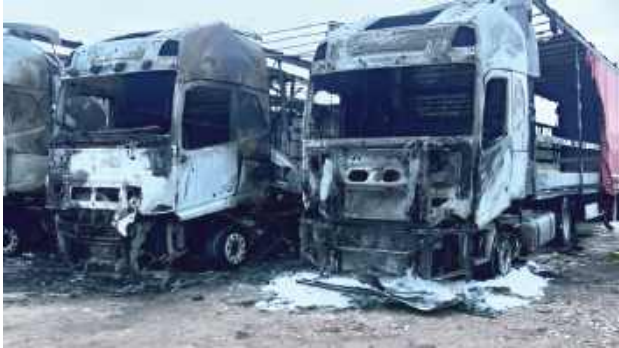
Według krewnego właściciela firmy pożar zaczął się od dwóch skrajnych ciężarówek. Jest pewien, że to było podpalenie

- To był dorobek życia, który właściciel budował latami razem z trzema braćmi i dwoma bratanekami, kierowcami pomagającymi w prowadzeniu firmy. Na szczęście ogień nie zajął pobl-