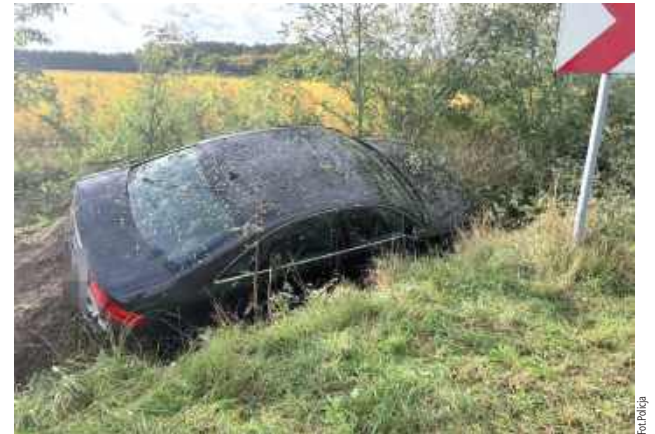
Auto zatrzymało się w rowie

Groźne zdarzenie w Karczmiskach. 19-letnia kierująca audi na zakręcie straciła panowanie nad pojazdem. Samochód wjechał do przydrożnego rowu zatrzymując się w gęstwinie krzewów.