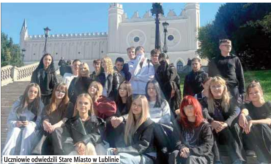
Uczniowie odwiedzili Stare Miasto w Lublinie