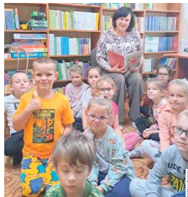
Nauczyciel bibliotekarz czytał legendę napisaną przez Annę Świerszczyńską pt. „Lech, Czech i Rus”

Uczniowie klas 1-3 z SP 2 im. Królowej Jadwigi w Parczewie uczestniczyli w zajęciach bibliotecznych. Miały one związek z Ogólnopolskim Dniem Głośnego Czytania.