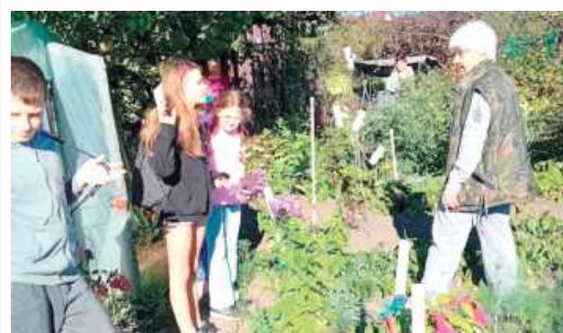
Uczniowie podziwiali ogródki działkowe

W SP 2 w Parczewie zostały zorganizowane zajęcia rozwijające dla uczniów z przedmiotów matematyczno-przyrodniczych pod hasłem „Laboratorium pod chmurką”.