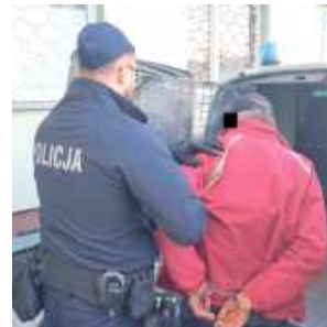
Styl jego jazdy mocno wskazywał, że jest nietrzeźwy

Do zdarzenia doszło w niedzielę (5 października) na