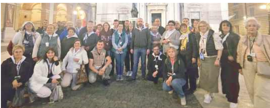
Pielgrzymi podziwiali włoską architekturę

Antoni to Święty, za którego wstawieniem codziennie niezliczone rzesze wiernych wypraszają wiele łask. Czasem oczekujemy