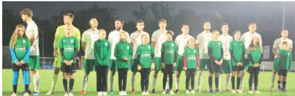
Piłkarze Podlasia nie mieli argumentów w meczu z Pogonią-Sokołem

Druga połowa nie przyniosła poprawy dla bialczan. Pogoń nie zwalniała tempa, a w 60. minucie Majda wykorzystał błąd Jarosława Kosieradzkiego, zdobywając trzecią bramkę dla przyjezdnych.