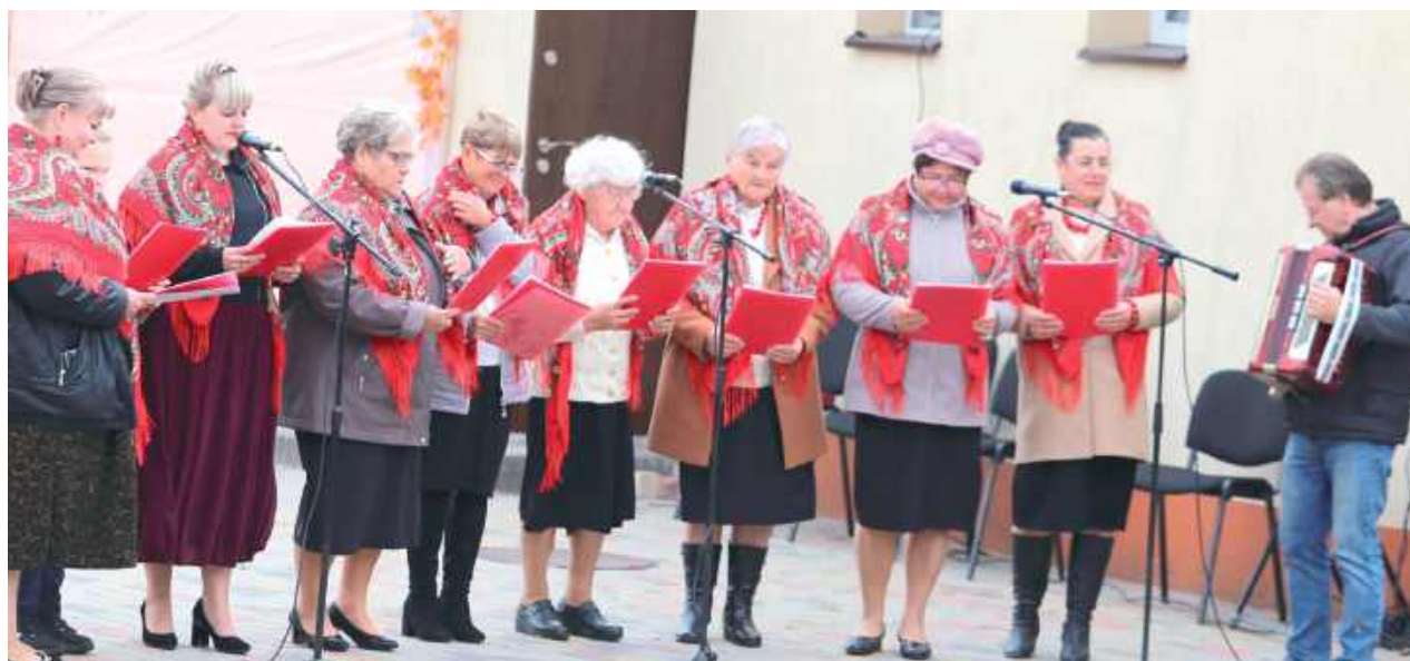
Na muzycznej scenie po latach nieobecności wystąpił miejscowy zespół ludowy „Aksamitki”, gościnnie podczas uroczystości zaśpiewały „Jezioranki”

Siemień: Mieszkańcy i goście wspólnie świętowali urodziny Żminnego. Nie zabrakło tortu, muzyki na żywo, atrakcji dla najmłodszych i dobrego jedzenia