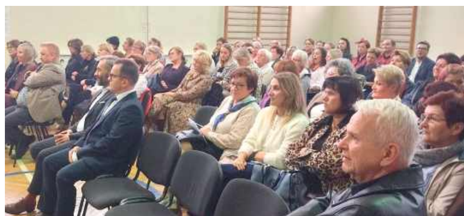
Wydarzenie cieszyło się sporym zainteresowaniem

W Zespole Szkół im. Stanisława Staszica w Parczewie zostało zorganizowane pierwsze Forum Kół Gospodyń Wiejskich Powiatu Parczewskiego.