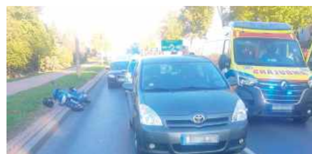
79-latek z obrażeniami ciała został przewieziony do szpitala, gdzie pobrano od niego krew do badań w celu ustalenia stanu trzeźwości

Do zdarzenia doszło we wtorek (7 października) w Radzynie Podlaskim na ulicy Wisznickiej.