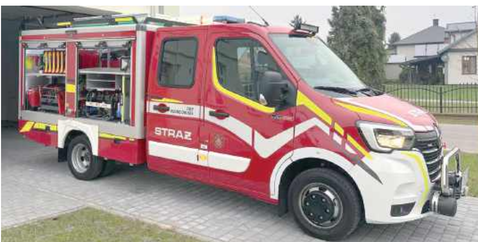
Wartość zakupu to 450.000 zł

Z przodu zamontowano wyciągarkę elektryczną o uciążu 5440 kg. Nadwozie posiada skrytki przystosowane do przewozu sprzętu i armatury wodno-pianowej. Samochód posiada zbiorniki na wodę o pojemności 1000 litrów