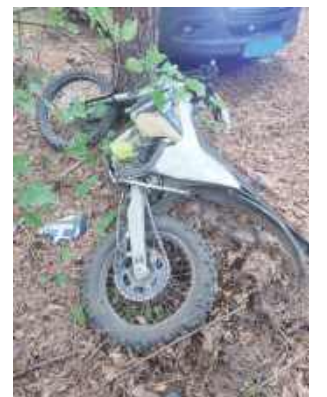
40-letni mężczyzna został przewieziony śmigłowcem LPR do szpitala

4 października na drodze gruntowej w Sobieszynie-Brzozowej doszło do wypadku 40-letniego motocyklisty na drodze gruntowej.