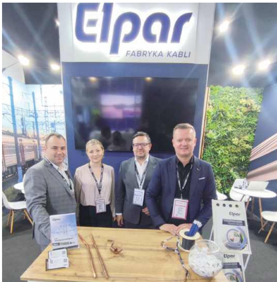
Stan zatrudnienia na 31 grudnia 2024 r. wyniósł 675 osób, a średnioroczne zatrudnienie w przeliczeniu na pełne etaty wyniosło 672 osoby

Działalność w 2024 roku zamknęła się zyskiem brutto wynoszącym 34 230 261 zł (mniej niż w 2023 roku, kiedy zysk brutto wyniósł 72 mln 977 tys. zł). Od 2022 roku spółka zadeklarowała opodatkowanie w formie ryczałtu od dochodów spółek. Podatek dochodowy CIT za 2024 rok to 39 848 zł. Zysk netto wyniósł zatem 34 190 413 zł.