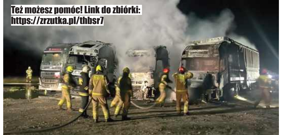
W pożarze zostały zniszczone wszystkie pojazdy należące do firmy