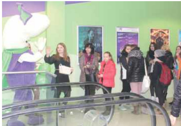
Na pierwsze seanse w białskim Multikinie w listopadzie 2014 roku przyszło wiele młodych widzów

Na forach internetowych rozpacz, hejt i lament o końcu atrakcyjności Białej Podlaskiej: