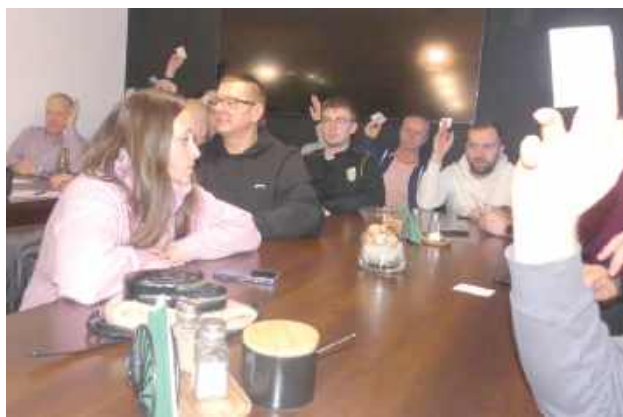
Zebrani jednogłośnie udzielili ustępującemu zarządowi absolutorium