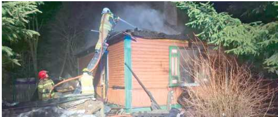
Drewniany dom spłonął doszczętnie. Czego nie strawił ogień, zostało zalane wodą podczas akcji gaśniczej

Po przybyciu na miejsce zdarzenia strażacy zastali pożar domu jednorodzinnego drewnianego, jednokondygnacyjnego. W pożarze poszkodowana została właścicielka, która doznała poparzeń przy próbie samodzielnego gaszenia pożaru - informuje bryg. Emil Głogowski, rzecznik prasowy Komendy Powiatowej Państwowej Straży Pożarnej w Puławach.