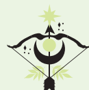
Strzelec (22 XI – 21 XII)

2026 rok przyniesie Ci intensywność i pasję w sporcie. Wiosną spróbuj sportów wymagających siły i determinacji. Sztuki walki czy treningi siłowe będą odpowiednie. Lato sprzyja wytrzymałości. Biegi długodystansowe lub rowerowe wycieczki pozwolą Ci sprawdzić granice możliwości. Twoja silna wola pomoże pokonać słabości i wytrwać w treningach. Jesień będzie czasem eksperymentów. Sporty wodne lub wspinaczka mogą przynieść nowe doświadczenia. Uważaj na przeciążenia pleców i stawów. Zimą znajdziesz siłę w treningach w domu i ćwiczeniach relaksacyjnych. Motywację znajdziesz w rywalizacji i wyzwaniach, które sam sobie wyznaczysz. Twoja intensywność i determinacja przyniosą widoczne efekty. Pod koniec roku poczujesz dumę z własnej siły i wytrwałości. Twoja energia będzie zaraźliwa dla bliskich i znajomych. 2026 zakończysz silniejszy, pewniejszy siebie i gotowy na nowe sportowe przygody.