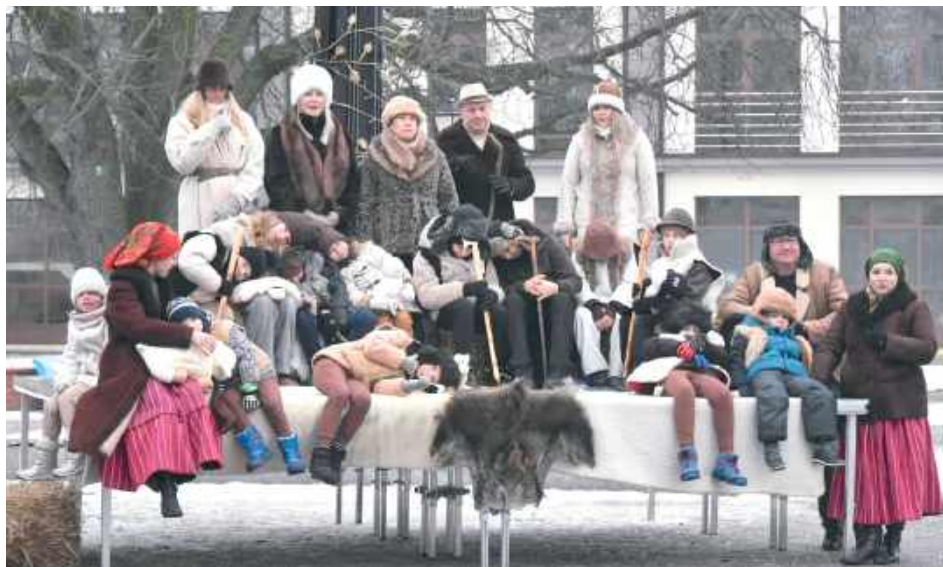
Na jednej ze scen licznie wystąpili pasterze