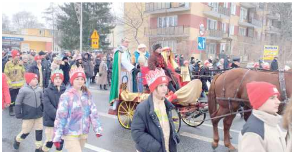
Królowie-magowie-mędrzy jechali bryczką w orszaku

We wtorek białskie wydarzenie rozpoczęła uroczysta msza święta koncelebrowana w kaplicy Parafii św. Michała Archa-