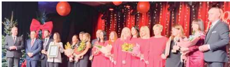
Laureaci wyróżnień „Dobre bo Bialskie”

- To najwyższa kwota inwestycyjna w historii naszego powiatu. Planujemy wydać na inwestycje drogowe niemal 142 mln zł, z tego niemal 125 mln zł stanowią środki zewnętrzne pochodzące z różnych funduszy oraz z pomocy finansowej gmin