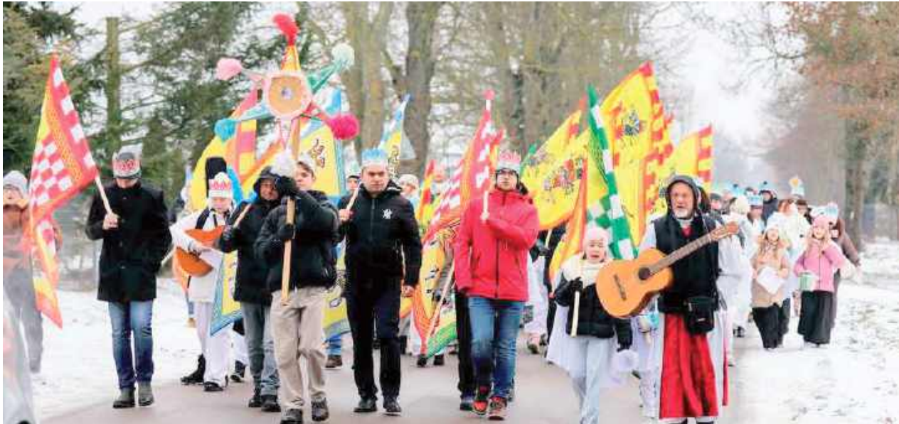
Po nabożeństwie uczestnicy, prowadzeni przez Gwiazdę Betlejemską, Trzech Króli oraz Świętą Rodzinę, wyruszyli w radosnym pochodzie ulicami Drełowa