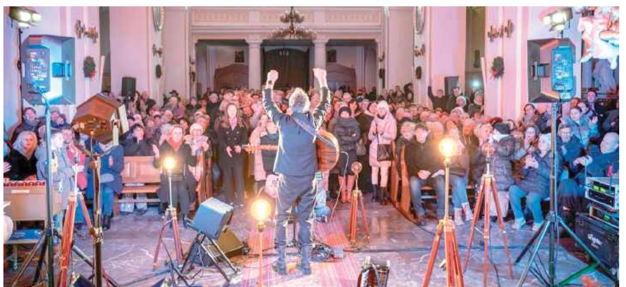
Koncert przyciągnął tłumy – kościół wypełnił się po brzegi