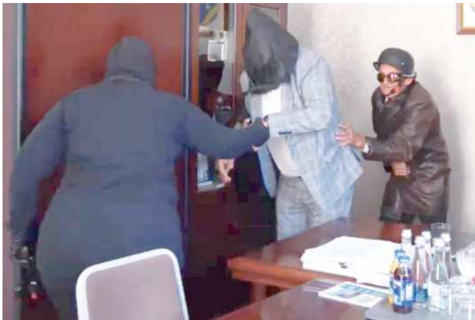
Jeden ze spektakli opowiada o brawurowej akcji porwania wójta gminy Międzyrzec Podlaski

Niedawno zakończyły się Multimedialne Spotkania Teatralne Seniorów, realizowane w ramach cyklu „Cała prawda o Południowym Podlasiu”. W projekt zaangażowanych było blisko sto osób – seniorów, młodzież, dzieci, lokalnych artystów, trzy zespoły śpiewacze oraz przedstawiciele samorządów.