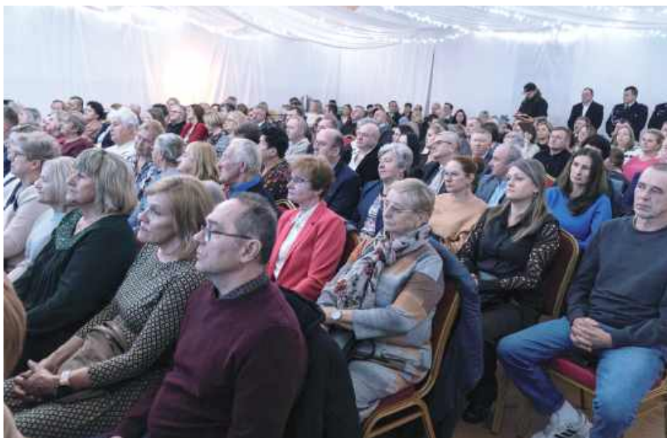
Główna część spotkania miała miejsce w Tuliowie i przyciągnęła wielu mieszkańców oraz osób związanych z gminą Międzyrzec Podlaski

Szczególnym punktem programu był klimatyczny koncert kołed w wykonaniu znanego wo-