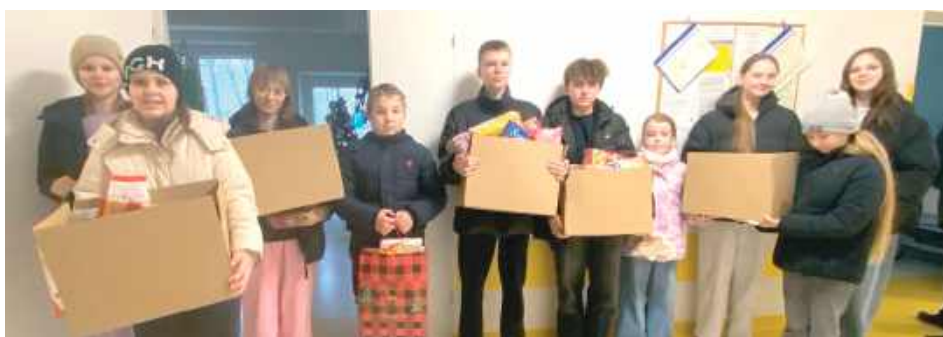
W przekazaniu darów uczestniczyli uczniowie zaangażowani w działalność Samorządu Uczniowskiego, Szkolnego Koła Wolontariatu oraz Koła Dziennikarskiego

Dzięki ogromnemu zaangażowaniu darczyńców udało się zebrać wiele potrzebnych rzeczy: materiały kreatywne (koraliki, włóczki, pomoce do ćwiczenia sprawności manualnej), produkty spożywcze