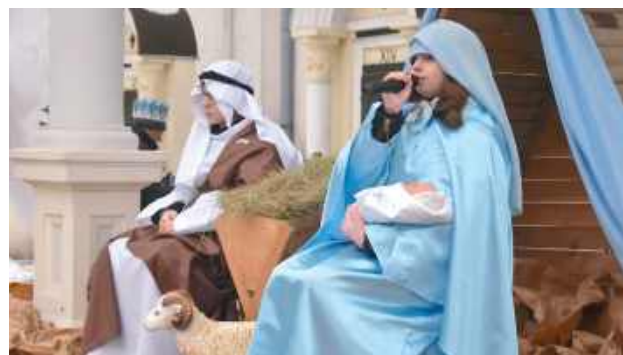
Kulminacyjnym punktem orszaku był pokłon Trzech Króli