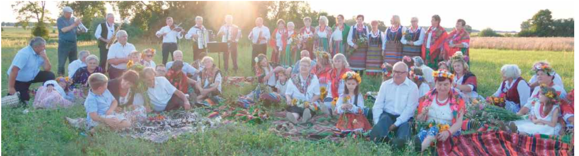
W scenie finałowej spektaklu „Wesele z lata 50-tych i obrzędy przedweselne” wzięło udział ponad 50 aktorów!