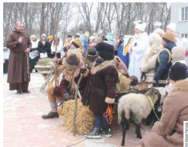
„Św. Franciszek” grał i śpiewał także w jasełkach...

nicy przemarszu. „Świętemu” towarzyszyły zwierzęta: - żywe kozy, owce, osiołek i owczarek afgański oraz ciągnana na kółkach przez harcerzy makieta wielbłąda. Mędrzy-królowie jechali bryczką. Na Placu Wolności złożyli pokłon Dzieciątku Jezus. Efektownie