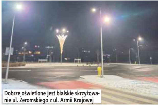
Dobrze oświetlone jest bialskie skrzyżowanie ul. Żeromskiego z ul. Armii Krajowej

Dzięki zakupom dla miasta tańszego prądu Biała Podlaska oszczędzi ok. 4 mln zł. Bialski prezydent z satysfakcją poinformował, że w 2026 roku miasto zapłaci za energię elektryczną ponad 6,3 mln zł, gdy w 2025 roku ten koszt wyniósł ponad 10,5 mln zł.