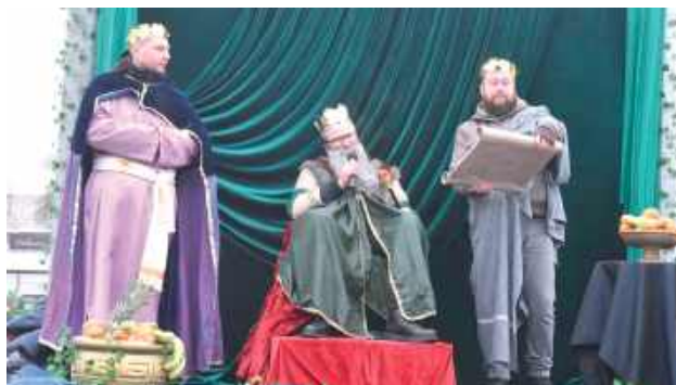
Nie mogło zabraknąć króla Heroda