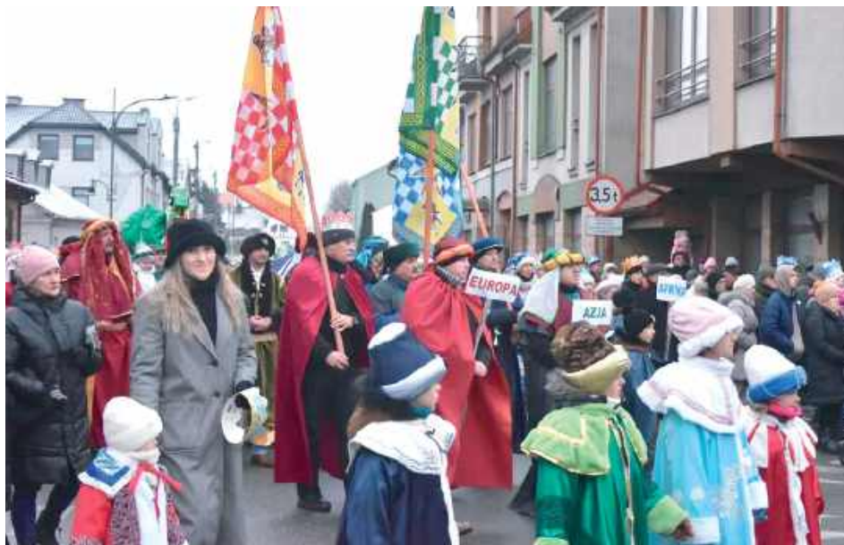
W orszaku wzięły udział setki mieszkańców miasta i okolic