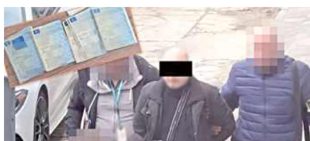
Sprawa prowadzona pod nadzorem Prokuratury Okręgowej w Lublinie jest rozwojowa i planowane są kolejne zatrzymania

- Z ustaleń wynika, że pracujący na stacji diagnostycznych w Lublinie i w powiecie białskim 67-latek potwierdzał wykonanie badania technicznego w dowodach rejestracyjnych oraz dokonywał wpisów do ogólnopolskiego systemu informatycznego,