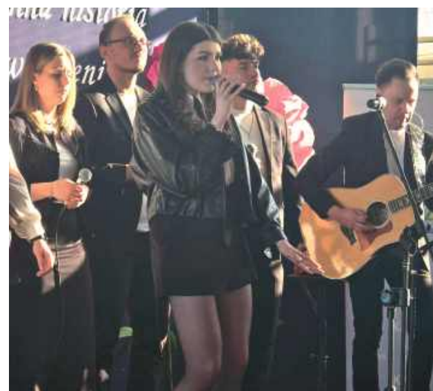
Artyści zostali nagrodzeni brawami