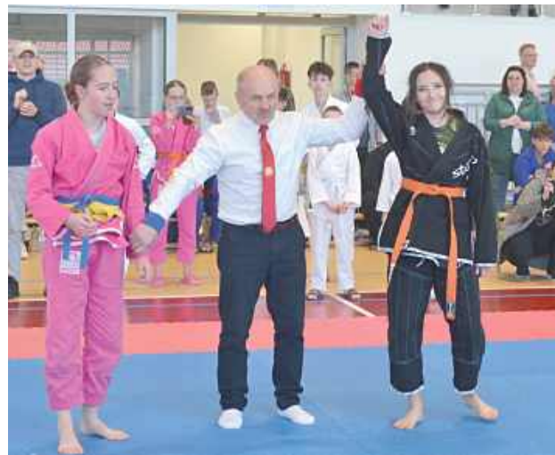
To był test charakteru dla zawodników