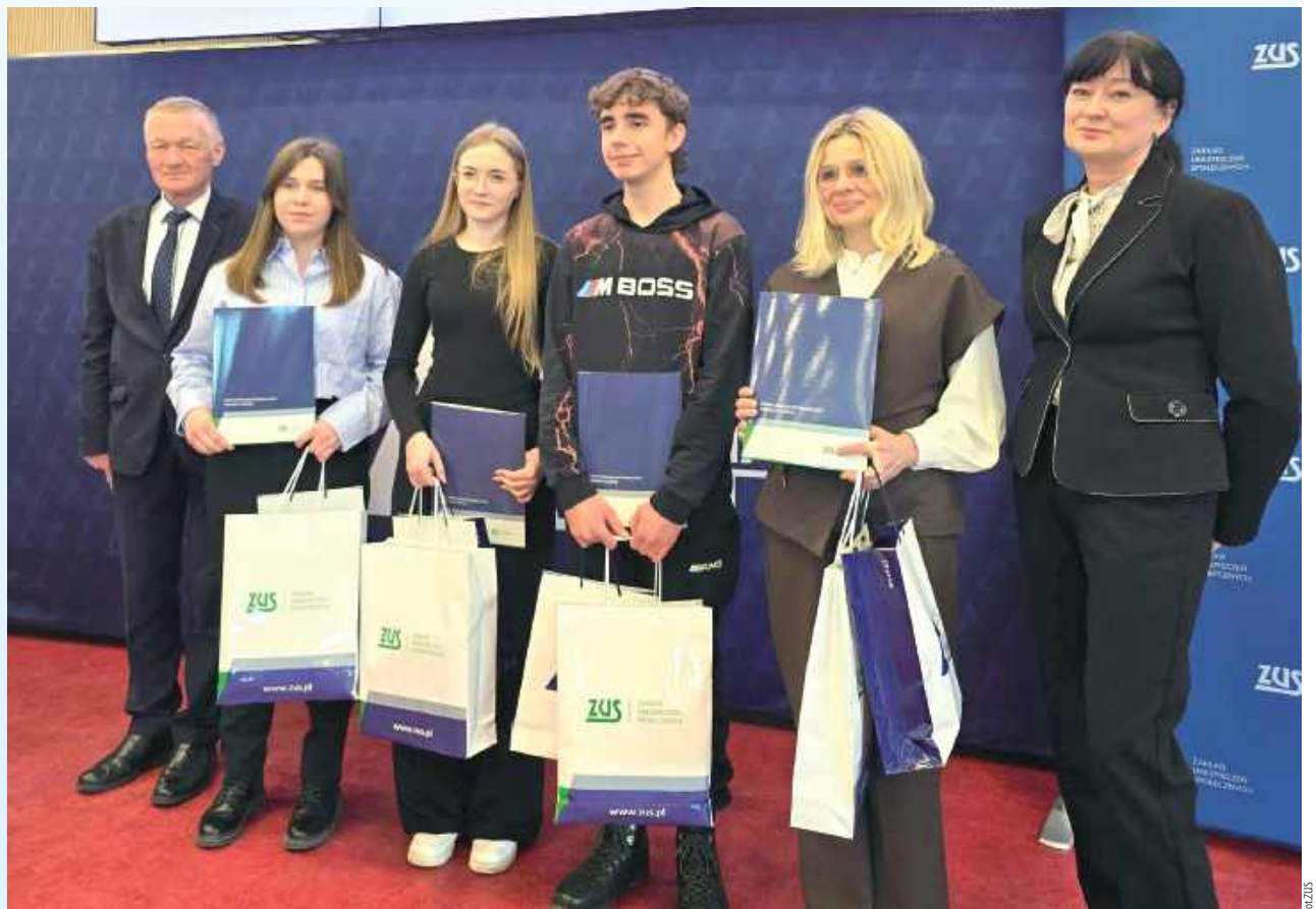
Uczniowie Technikum nr 1 w Zamościu nie dali szans rywalom w wojewódzkim etapie olimpiady organizowanej przez ZUS

Uczniów przygotowała do olimpiady ich nauczycielka, Edyta Łój.