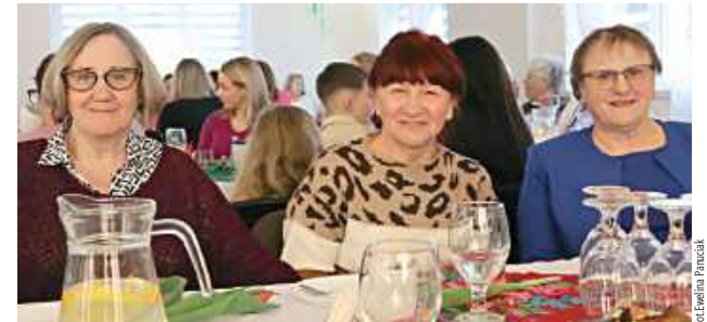
Spotkanie zakończyło się poczęstunkiem oraz rozmowami