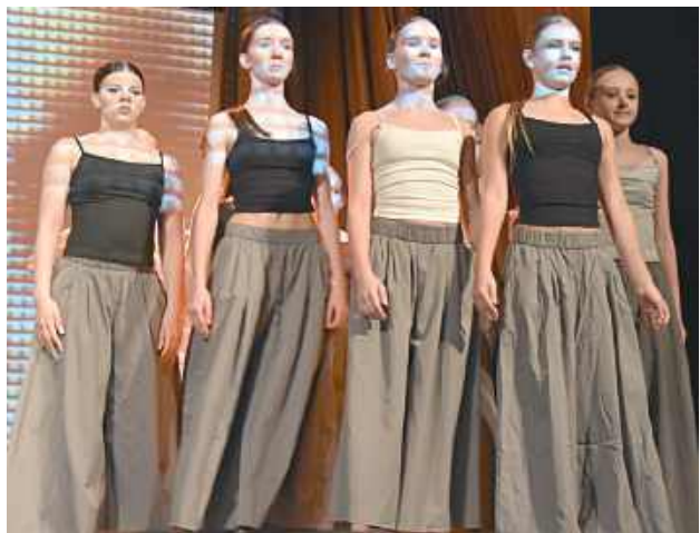
Tancerki zaprezentowały różne oblicza kobiecości

Druga część koncertu nosiła nazwę „Liryczne”. – Kobiety mają dużo twarzy. W zaprezentowanych choreografiach kobiety będą bardziej zamyslane, zwiewne, delikatne – mówiła instruktorka.