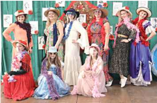
Wydarzenie integrowało całą społeczność Lipowca