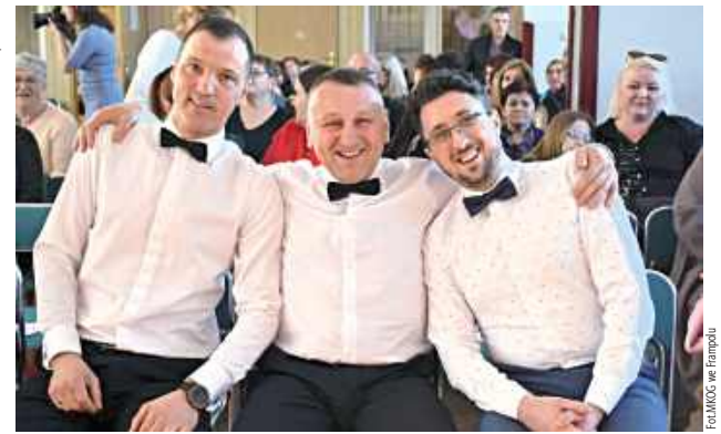
Panowie zadbali, aby każda z pań czuła się w tym dniu wyjątkowo