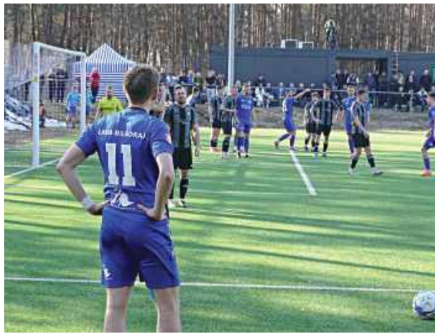
Pierwszy domowy mecz rundy wiosennej Łada musiała rozegrać na boisku w Majdanie Starym