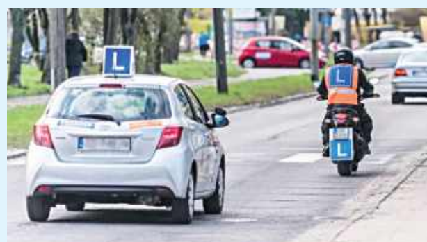
Od 1 kwietnia w Zamościu i Biłgoraju wracają praktyczne egzaminy na motocyklowe prawo jazdy

Zaskoczenia wielkiego nie było, bo zimą w wielu woje-