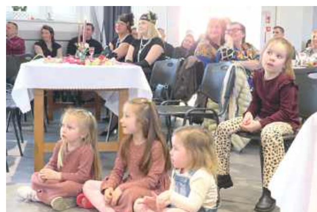
Sala widowiskowa Gminnego Ośrodka Kultury, Sportu i Rekreacji w Biszczy wypełniła się mieszkankami gminy, które wspólnie świętowały Gminny Dzień Kobiet