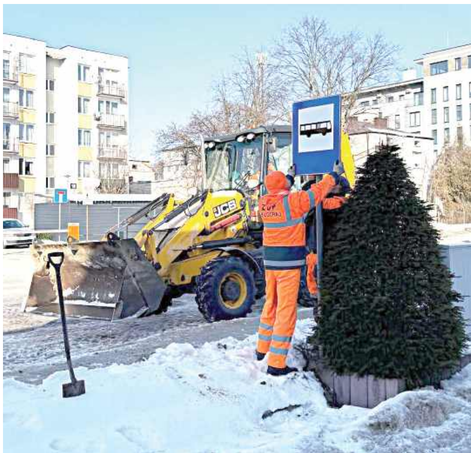
30 grudnia do wicestarosty Strzałki zgłosili się przedstawiciele przewoźników, którzy dotychczas mieli swoje miejsce postojowe przy ul. Cichej. Poinformowali, że zostali oni usunięci całkowicie z tego miejsca. Po naradzie padł wniosek, aby wydać zgodę na tymczasowe korzystanie z nieruchomości powiatu przy ul. Boh. Monte Casino w celu wykorzystania zatrzymania się pojazdów przewożących pasażerów

dług niego nie jest to przystanek, został postawiony nieopodal ruchliwego skrzyżowania, ścieżki rowerowej i wyjazdu z parkingu galerii handlowej. Zwrócił również uwagę na fakt, że zlokalizowany jest tam parking.