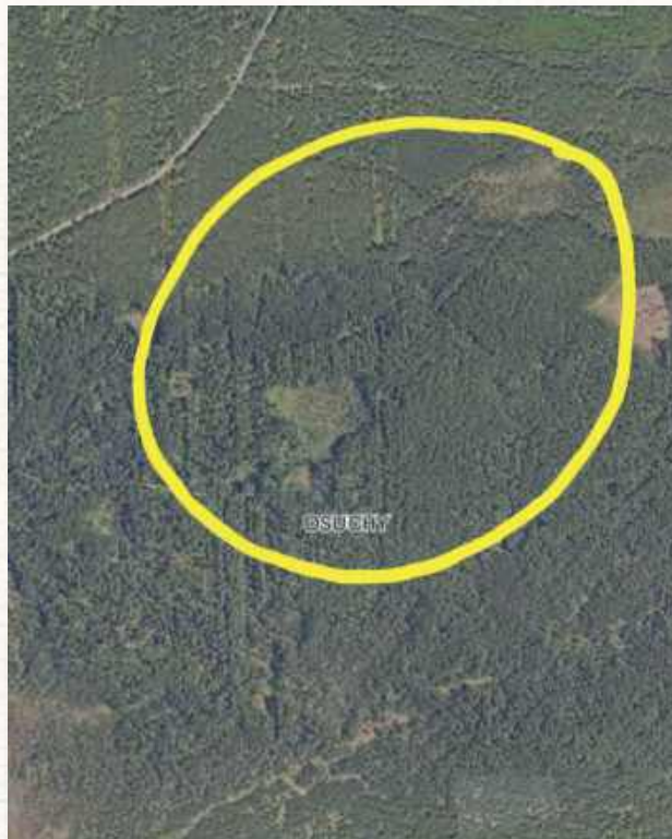
Położenie rezerwatu „Długie Bagno”

„Wśród zbiorowisk leśnych dominują bory bagiennie i bory wilgotne. Wydmę porastają bory świeże Leucobryo-Pinetum z dominacją sosny w drzewostanie i borówki czarnej Vaccinium myrtillus w runie. Wraz z obniżaniem się terenu bór świeży przechodzi w bór trzęślicowy Moliniocaeruleae-Pinetum z kruszyną pospolitą Frangula alnus w warstwie krzewów oraz trzęślicą modrą Molinia caerulea w runie, a następnie w bór bagienny Vaccinio uliginosi-Pinetum sylvestris z borówką bagienną Vaccinium uliginosum i bagnem zwyczajnym Ledum palustre w warstwie krzewów oraz wełnianką pochwowatą Eriophorum vaginatum i żurawiną błotną Oxycoccus palustris w warstwie zielnej. Obniżenia zajmują torfowiska wysokie z klasy Oxycocco-Sphagnum spp. żurawiną błotną, modrzewnicą pospolitą Andromeda polifolia (gatunek objęty ochroną częściową), rosiczką okrągłolistną Drosera rotundifolia (gatunek objęty ochroną ścisłą), miejscami z przy-