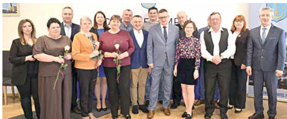
W gminie Frampol jest łącznie 16 sołtysów i sołtysów

Burmistrz podziękował sołtysom za codzienną pracę,