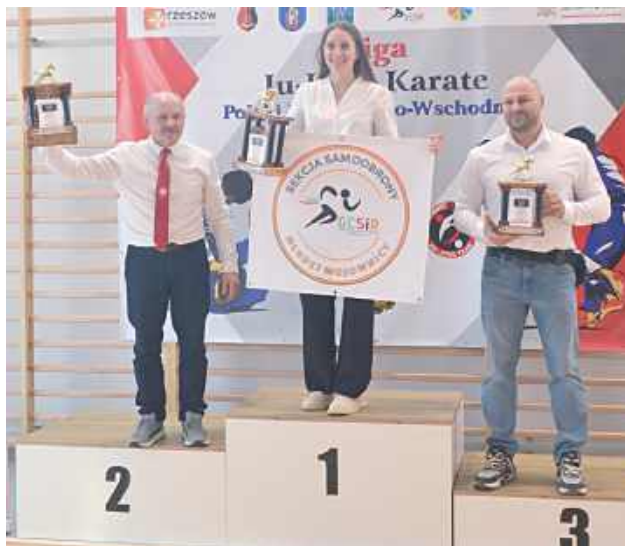
Pierwsze miejsce w kategorii drużyna zajęła Sekcja Młodzi Wojownicy działająca w strukturach GCSiR w Potoku Górnym

7 marca Gminne Centrum Sportu i Rekreacji w Potoku Górnym stała się areną Ligi Ju-Jitsu i Karate Polski Południowo-Wschodniej.