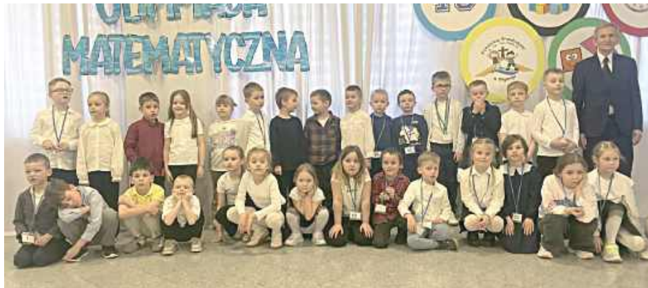
W Katolickim Przedszkolu im. św. Jana Pawła II w Biłgoraju już po raz dziesiąty odbyła się dziś (czwartek 12 marca) cykliczna Międzyprzedszkolna Olimpiada Matematyczna, która zgromadziła 34 najmłodszych miłośników królowej nauk z całego powiatu biłgorajskiego

najmłodszych lat. Głównym wspólną zabawą.