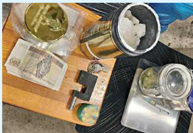
Policjanci zabezpieczyli blisko 900 gramów mefedronu oraz ponad 100 gramów marihuany

Kryminalni w domu 31-latka odnaleźli i zabezpieczyli również