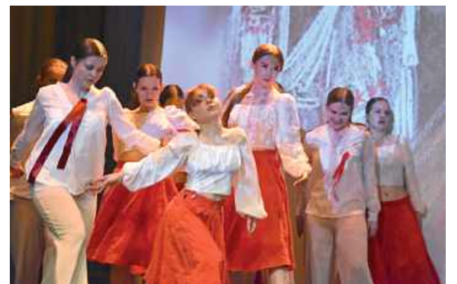
Dziewczęta zaprezentowały się w choreografii folkowej