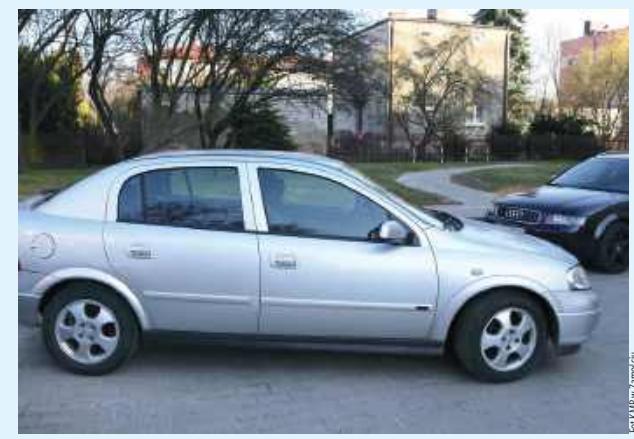
Mamusia z 2,5 promila alkoholu, bez żadnych skrupotów wsiała za kierownicę. Jechała z kilkuletnim dzieckiem

Szokująca informacja od zamojskich policjantów. Nietrzeźwa 44-latką kierując Oplem, podróżowała z kilkuletnim dzieckiem. Mundurowi sprawdzili jej stan trzeźwości, kobieta miała w organizmie ponad 2,5 promila alkoholu.