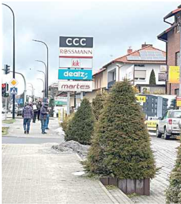
Przystanek miał być zlokalizowany przy ul. Bohaterów Monte Cassino w Biłgoraju. Po tym, jak rada powiatu odmówiła wydania zgody, znak został zdemontowany