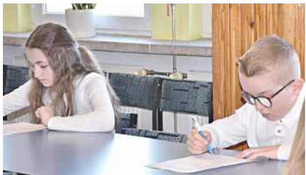
Test dotyczył również znajomości pierwszej pomocy przedmedycznej