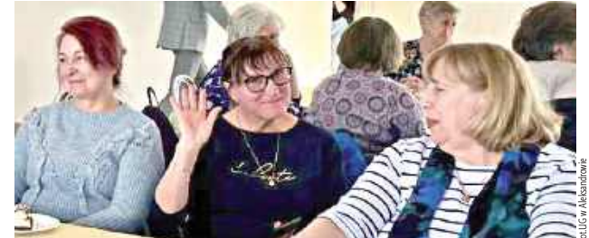
W spotkaniu udział wzięło kilkadziesiąt osób