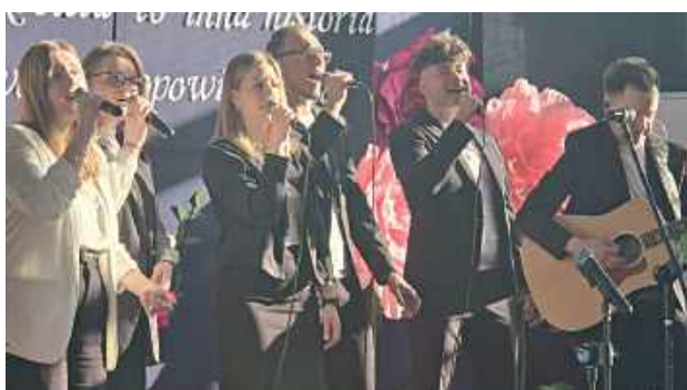
Koncert zespołu GOSPEL RAIN

W tym roku na zgromadzonych czekała wyjątkowa niespodzianka muzyczna - koncert zespołu GOSPEL RAIN w koncercie pt. „Jedno słowo wystarczy”. Zespół zaprezentował autorskie aranżacje piosenek z pięknym przesłaniem. Koncert zakończył się owacjami na stojąco.