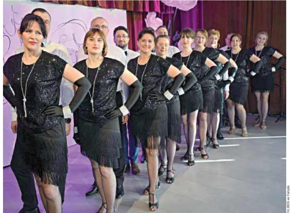
Zaprezentowany taniec zachwycił publiczność

GM. FRAMPOL: 8 marca w sali konferencyjnej Miejsko-Gminnego Ośrodka Kultury we Frampolu odbyły się obchody Gminnego Dnia Kobiet. Wydarzenie zgromadziło liczne mieszkanki gminy.