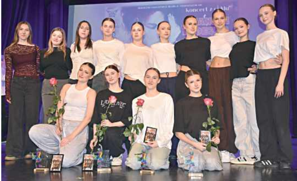
Grupa ADA Starsza z byłym tancerkami, które zawsze chętnie przychodzą na koncert