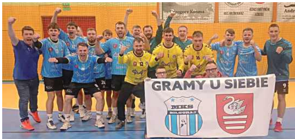
Odległy Konstantynów Łódzki zdobyty!

- W odległym Konstantynowie Łódzkim rozegraliśmy kolejne ligowe spotkanie. Pierwsza połowa w naszym wykonaniu, piorunująca. Gramy jak z nut co pozwala nam zejść na przerwę z wynikiem 7:16. Przeciwnik nie zamierzał odpuszczać, a nasz zespół zaczęły dopadać chwile słabości, nieskuteczność czy błędy.