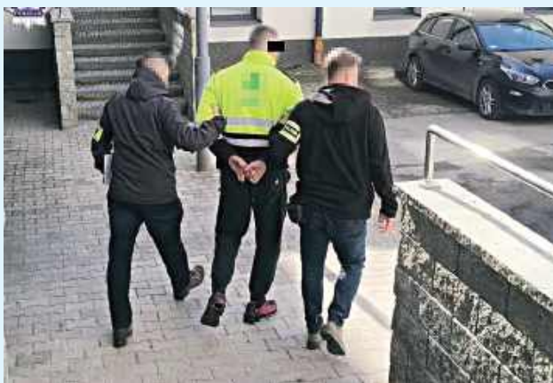
31-latek z powiatu zamojskiego został tymczasowo aresztowany na okres 3 miesięcy

Kryminalni z zamojskiej komendy, którzy zajmują się zwalczaniem przestępczości narkotykowej, ustalili, że 31-latek z powiatu zamojskiego może posiadać narkotyki. Aby zweryfikować uzyskaną informację, pod koniec minionego tygodnia pojechali do miejsca jego zamieszkania.