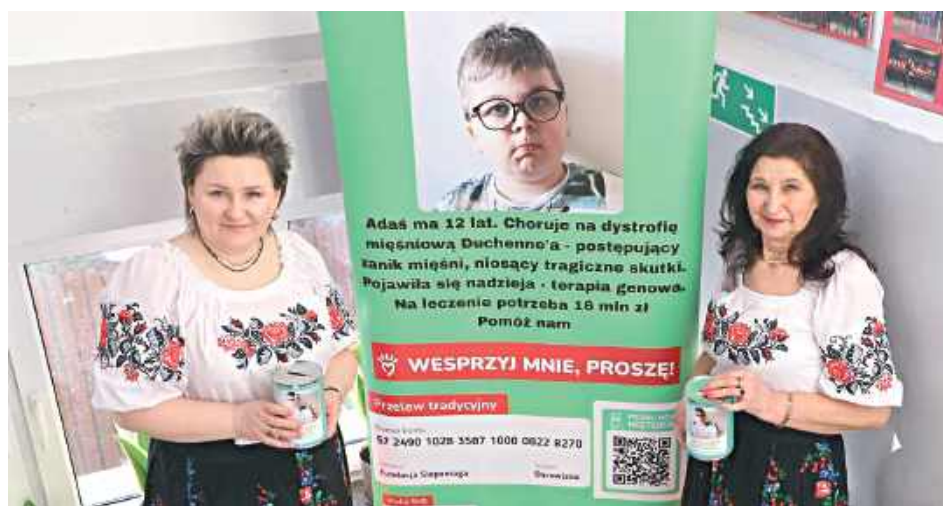
W organizację wydarzenia zaangażowało się KGW Allibabki z Pulczynowa