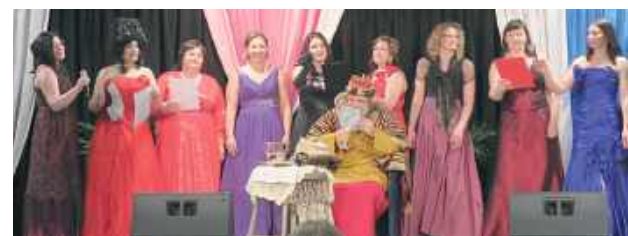
Szczególnie ciepło przyjęty został występ Koła Gospodyń Wiejskich „Ale Biszczanki”, które jak zawsze zaprezentowało się z dużą energią i humorem