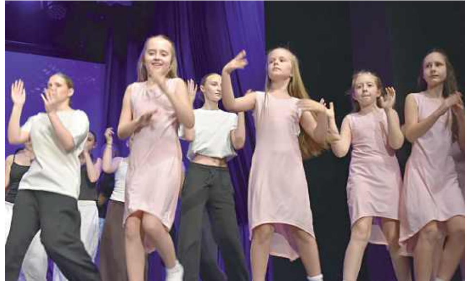
Na scenie wystąpiły zarówno młodsze, jak i starsze tancerki

BIŁGORAJ: 8 marca w Biłgorajskim Centrum Kultury odbył się koncert z cyklu Taniec i Poezja „Kobiety i Kobiety”. Na scenie wystąpiły tancerki grup ADA, które za pomocą tańca zaprezentowały różne oblicza kobiecości.