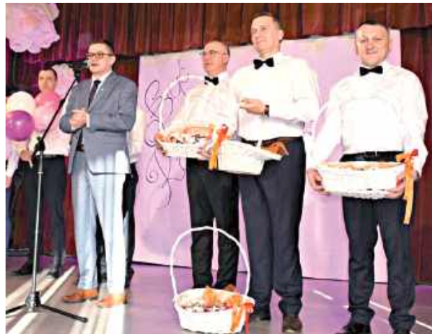
Nie zabrakło życzeń od mężczyzn