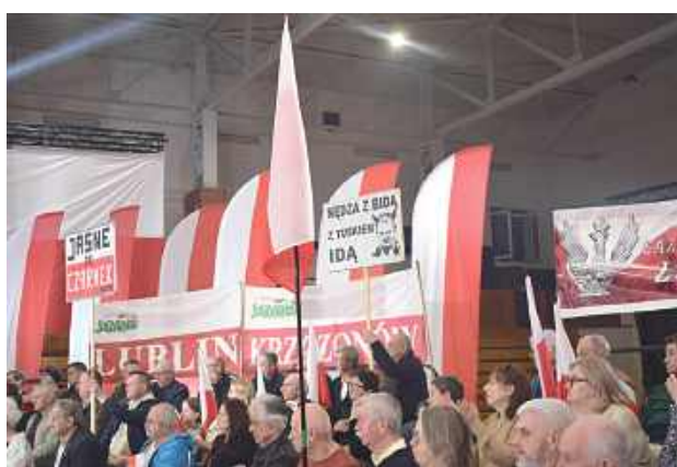
Uczestnicy spotkania przynieśli transparenty z hasłami: „Jasne, że Czarnek” czy „Nęcza z bidą z Tuskiem idą”