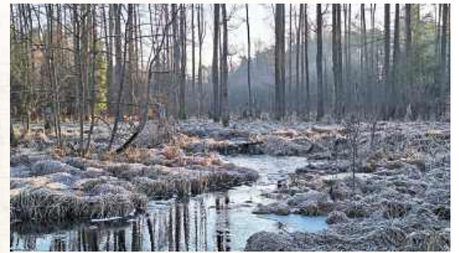
Uroczysko w Puszczy Solskiej. Autorem zdjęć jest Grzegorz Michalski, społecznik i popularyzator dzikiej przyrody