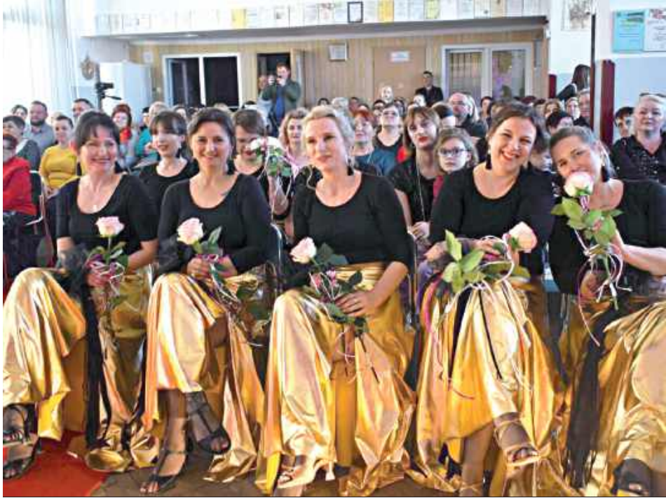
Dla pań przygotowane były upominki