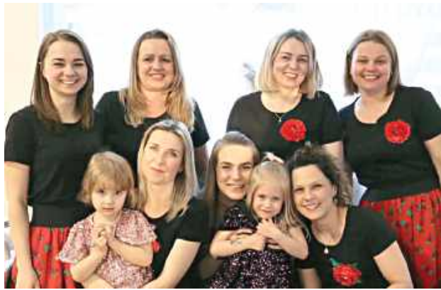
Organizatorem wydarzenia było Koło Gospodyń Wiejskich „Ostoja Lipowiec”