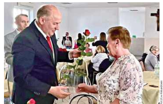
Spotkanie było wyrazem uznania i podziękowania za codzienny trud