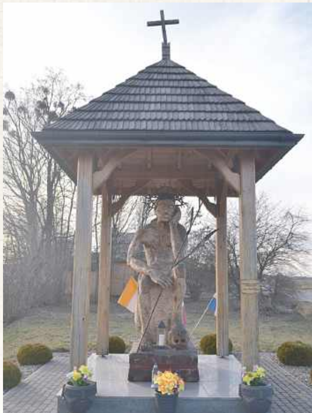
Olszanka. Największa w powiecie biłgorajskim rzeźba Frasobliwego (ponad 2 m wysokości), wyrzeźbiona przez Aleksandra Zyško i Jerzego Zyško (2021 r.)