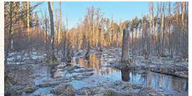
Uroczysko w Puszczy Solskiej. Autorem zdjęć jest Grzegorz Michalski, społecznik i popularyzator dzikiej przyrody