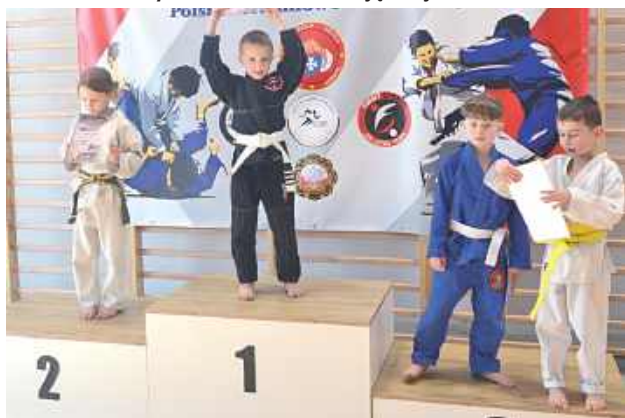
Startowały dzieci już od kategorii U6 (poniżej 6. roku życia)