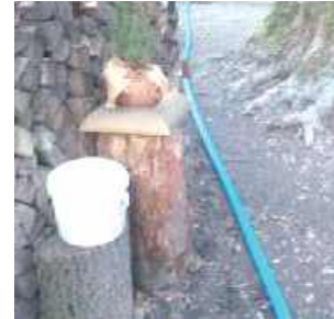
Mieszkańcy mogą korzystać z wody poprowadzonej węzłem, nie wiadomo jednak, jak długo potrwa ten luksus...

Lubelskie Centrum Innowacji i Technologii informuje więc, że po stwierdzeniu nieprawidłowości podjęto decyzję o wyłączeniu zasilania w budynku. O sprawie poinformowano wójta gminy Milejów, wskazując na potrzebę objęcia mieszkańców wsparciem