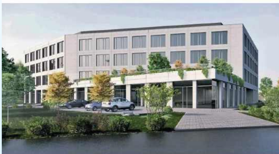
Budynek zlokalizowany został u zbiegu ul. Prymasa Stefana Wyszyńskiego i ul. Legionów w Zamościu. Czy i kiedy doczeka się otwarcia?

- Czym jest Fabryka Zamość? To nowoczesny obiekt biurowy o imponującej powierzchni ponad 8000 m 2 , z czego aż 6000 m 2 przeznaczonych jest na wynajem. Inwestycja zaoferuje 128 miejsc parkingowych, w tym 46 w garażu podziemnym, a także 5 stanowisk do ładowania samochodów elektrycznych. Inwestycja oficjalnie ruszyła we wrześniu 2023 roku. Początek prac wyglądał bardzo obiecująco. Na placu budowy szybko pojawił się ciężki sprzęt i żurawie, a fundamenty oraz pierwsze kondygnacje zaczęły piąć się w górę - za-