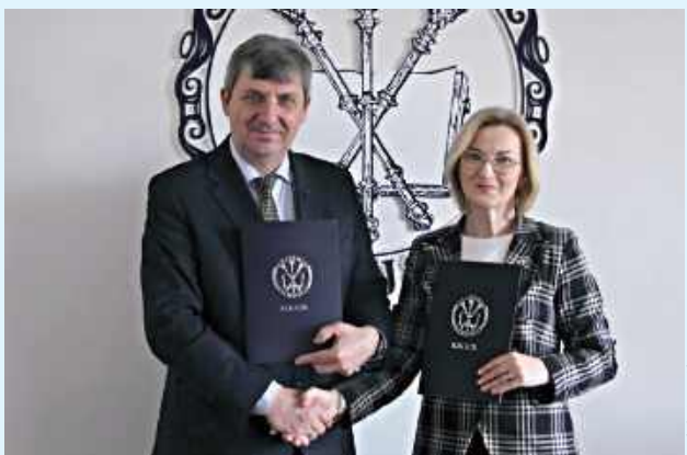
Akademia Zamojska nawiązuje ścisłą współpracę z „Ekonomikiem”

To historyczny moment dla uczniów popularnego „Ekonomika” z Zamościa. Akademia Zamojska oficjalnie bierze pod swoje skrzydła klasy technikum. Co to oznacza w praktyce? Koniec z teorią. Czas na wykłady z naukowcami, warsztaty i nowoczesne technologie, które otworzą młodzieży drzwi do wielkiej kariery.