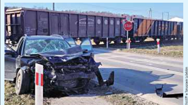
19-letni kierowca z niewyjaśnionych powodów uderzył w lokomotywę pociągu towarowego znajdującą się na przejeździe

O włos od wielkiego nieszczęścia na przejeździe kolejowym na Zamojszczyźnie. W Lubyczy Królewskiej (pow. tomaszowski) 19-letni mieszkaniec gminy Lubycza Królewska z niewyjaśnionych dotąd przyczyn uderzył w lokomotywę pociągu towarowego znajdującą się na przejeździe.