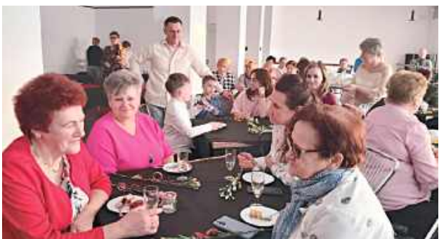
Panie chętnie skorzystały z zaproszenia organizatorów

Gmina Józefów: „Muzyczne listy pełne wdzięczności” - taki tytuł nosił koncert przygotowany specjalnie dla Pań z okazji ich święta. Na scenie Miejskiego Ośrodka Kultury w Józefowie wystąpił Dziecięcy Zespół „Głosik na fule” oraz Męski Tercet KKD.