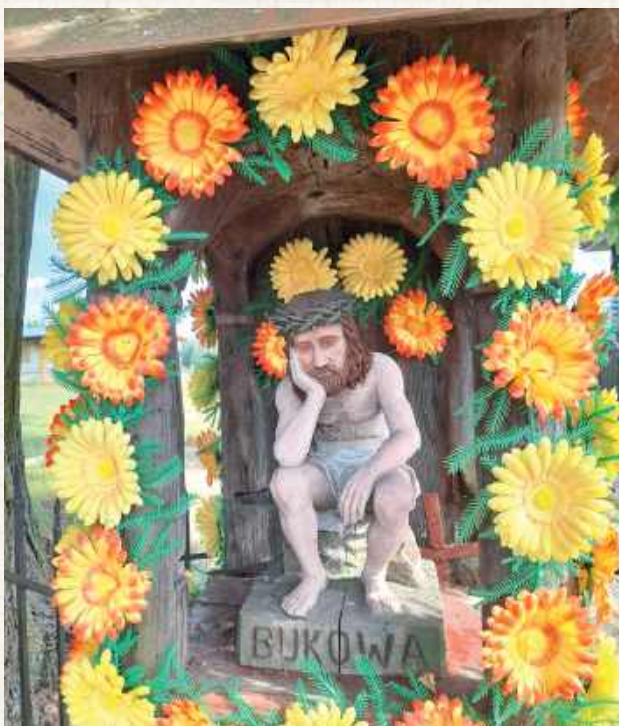
Bukowa. Rzeźba Frasobliwego z 1996 roku w kapliczce z 1838 roku