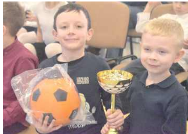
Na zwycięzców czekały nagrody i puchary