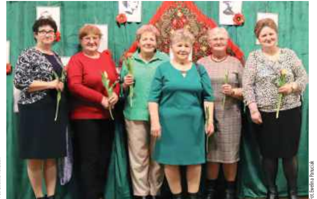
Dla mieszkańców to okazja do spotkania i integracji

Gmina Tereszpol: Koło Gospodyń Wiejskich „Ostoja Lipowiec” z Lipowca zaprosiło do wspólnego świętowania Dnia Kobiet. Były tańce, śpiewy i spektakl, który rozbawił publiczność do łez.