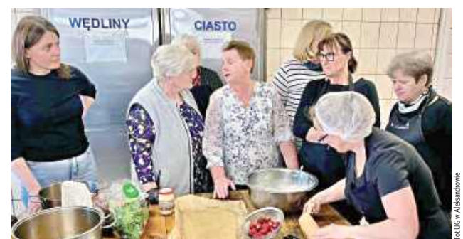
Panie chętnie skorzystały z zaproponowanych warsztatów