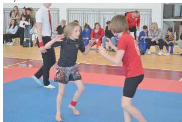
Zawodniczki były maksymalnie skupione