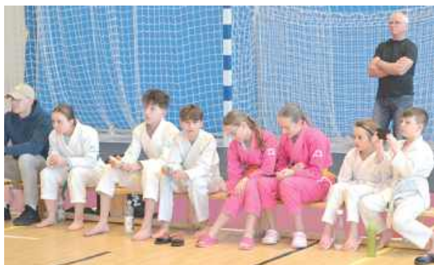
Młodzi zawodnicy w oczekiwaniu na swoją kolej