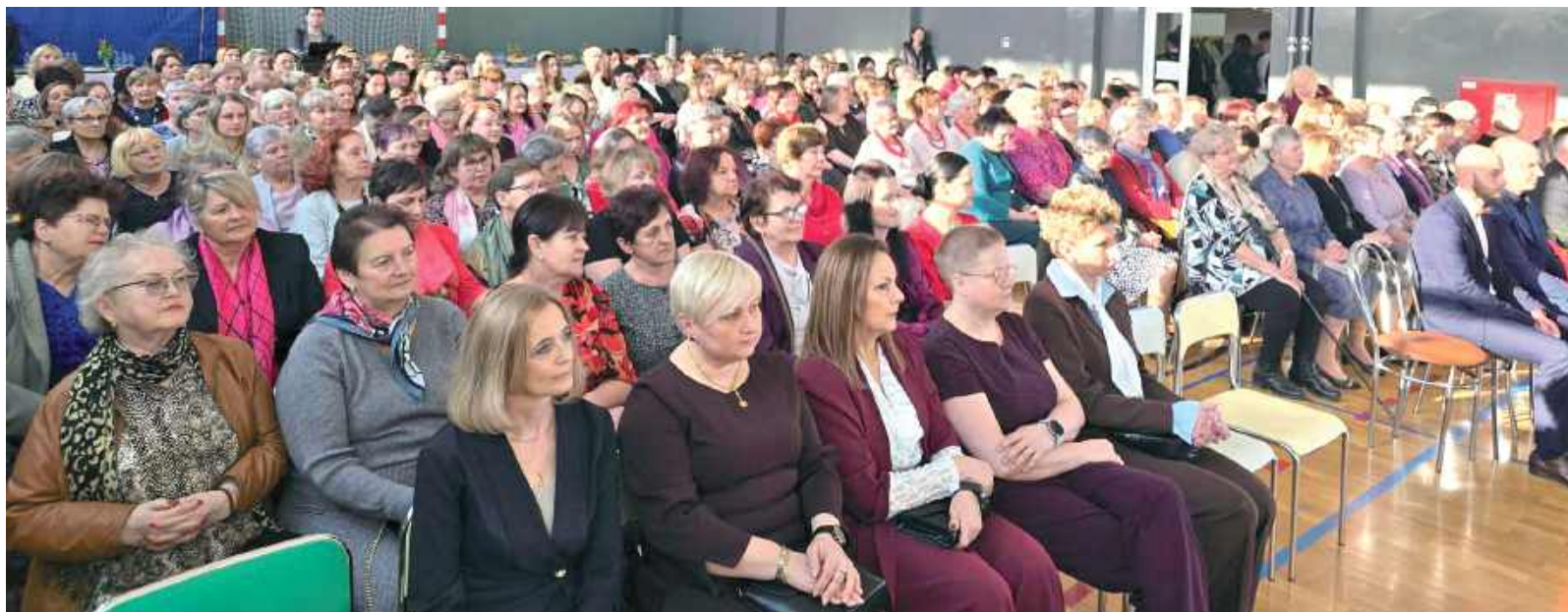
Sala szkoły wypełniona była po brzegi