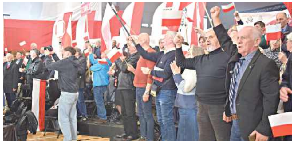
Powitanie Przemysława Czarnka

Przemysław Czarnek do Lubartowa przyjeżdża często, ale gościł tu jako poseł. W sobotę po raz pierwszy przyjechał jako kandydat PiS na premiera.