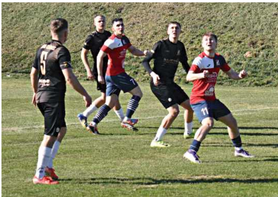
W arcyważnym domowym meczu z sąsiadem w tabeli - Spartą Łabunie - Grom Różaniec bez punktów