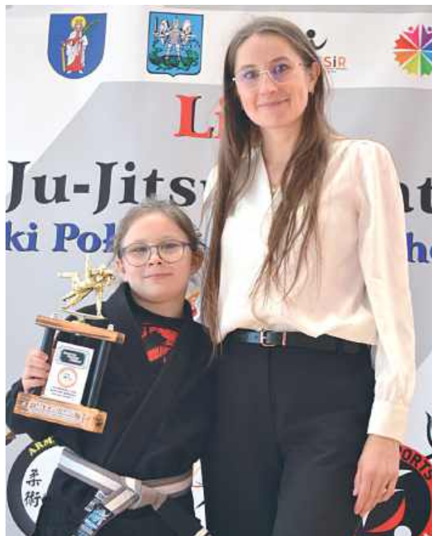
Na najlepszych czekały nagrody i puchary