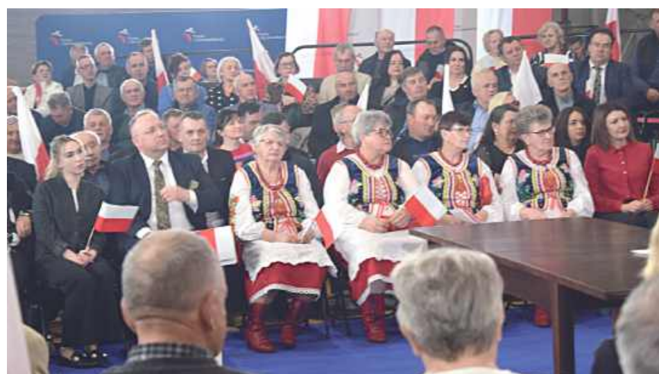
Przybyła grupa w strojach ludowych

- Kto do ciebie dzwonił Tusku? Oni? Friedrich? Ursula? Do ciebie powinni dzwonić Polacy, zwykli, prości, którzy stanęli wczoraj pod Pałacem Prezydenckim i bronili