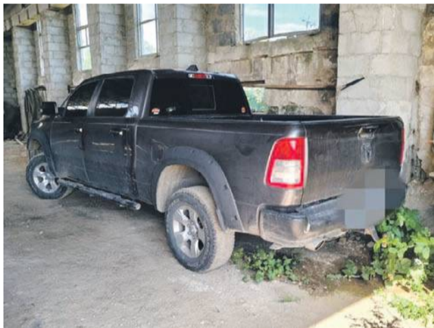
Odnalezione auto, które - jak się ;potem okazało - wcale nie było skradzione