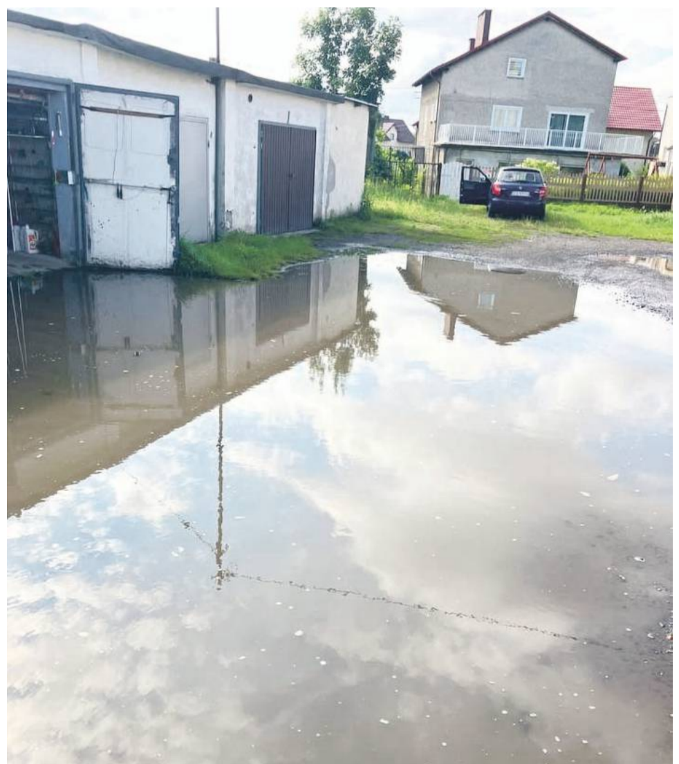
Tak po deszczu wygląda plac przed wejściem do garaży przy ul. Oleśnickiej