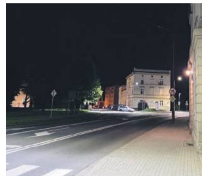
4 sierpnia, ul. 11 Listopada obok sądu

zdrowiu i życiu. Liczymy, że sprawa zostanie potraktowana priorytetowo. Jeśli nic się nie zmieni podejmiemy kolejne kroki prawne - dodał.