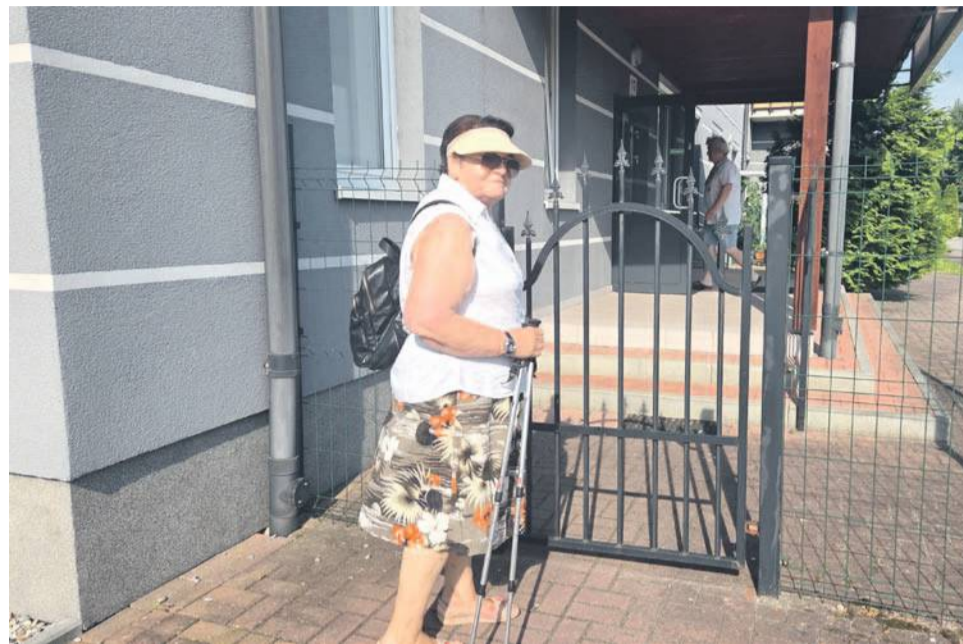
Przez tę furtkę nie można wejść do Centrum Rehabilitacji, bo jest zamknięta na klucz