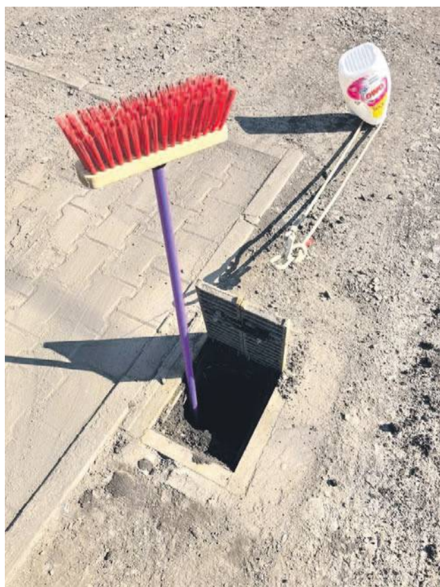
Kratka do studzienki przed garażami jest i... na tym się kończy

formował, że miasto wspólnie z zakładem wodociągów opracowuje koncepcję odwodnienia podwórza w rejonie garaży i zawiadomi właścicieli o terminie rozpoczęcia prac niezwłocznie po „dokonaniu uzgodnień w przedmiotowym zakresie”.