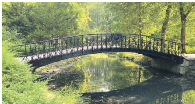
Mostek w Parku Szczytnickim