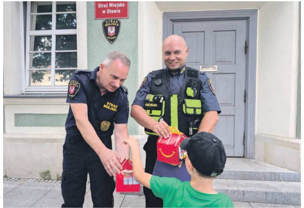
Mały uciekinier strażnikom podziękował za to, że go odnaleźli