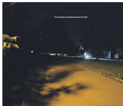
4 sierpnia. Skwer przy ul. Sienkiewicza (obok kortów)