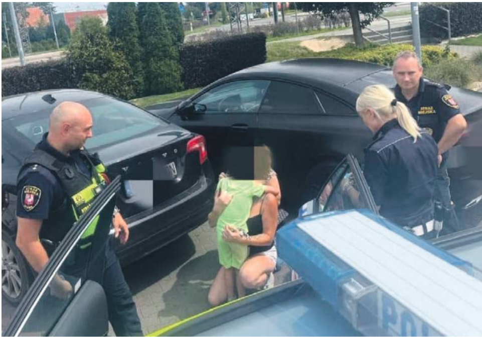
Moment przekazania syna mamie