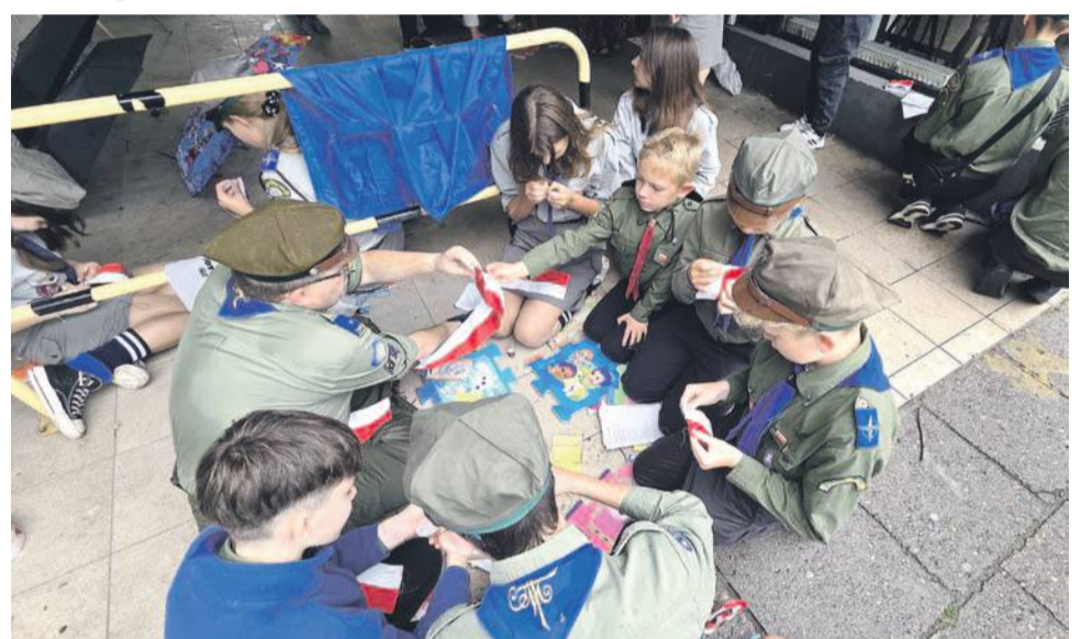
Nie miejsce jest ważne, a cel

To, że dbają o tożsamość narodu, że wracają pamięcią do roku 1944, by oddać cześć tamtym Dziewczętom i Chłopcom, którzy stanęli do walki, bo w ich sercach była wolna Polska - jak napisali na swoim profilu społecznościowym - kolejni raz udowodnili oławscy harcerze i zuchy z 2. WDH Wiercipięty im. Adama Mickiewicza oraz 1. Gromady Zuchowej „Sprytnie Plastusie”. Najpierw przy Pomniku Losów Ojczyzny zabrzmiały gitary i patriotyczne piosenki. Gdy jednak deszcz mocno się rozpadał, schronili się w przejściu pod pobliskim blokiem, zmieniając je w warsztat patriotycznych symboli - szyli biało-czerwone opaski, robili zawieszki ze znakiem Polskiej Walczącej, malowali gliniane odlewy patriotycznych symboli. Z pomocą rodziców przygotowano też kartki do Powstańców: „Drodzy Powstańcy, dziękujemy Wam za Waszą służbę, poświęcenie, bohaterstwo” - czytamy na jednej z nich,