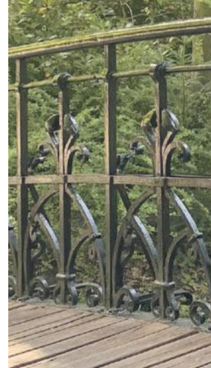
Wycinek kształtu balustrad ze zdjęcia mostku w Parku Szczytnickim we Wrocławiu, które zrobiłem w 2025 roku, aby porównać je ze zdjęciem z 1952 roku