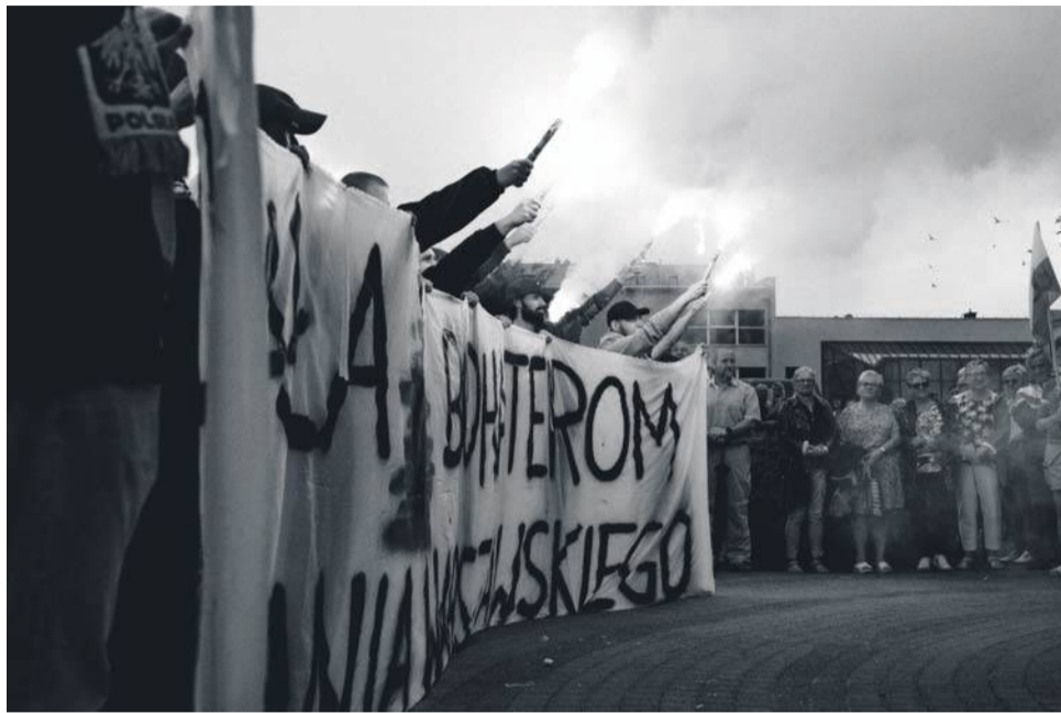
W Godzinę „W” wybrzmiały syreny alarmowe, a część zebranych odpaliła race