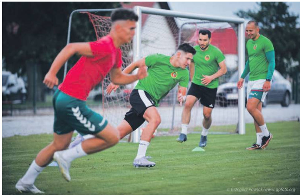
„Błyskawicy” zabrakło skuteczności w starciu z „Łużycami” Lubań i ostatecznie przegrywają na start ligi 1-0

Lepiej zaczęła drużyna z Gaci - już w drugiej minucie, po dośrodkowaniu Bogdanika, świetną okazję miał Draczyński, ale bardzo dobrze interweniował bramkarz. Obie drużyny „badały się” aż do 26. minuty, kiedy to po strzale