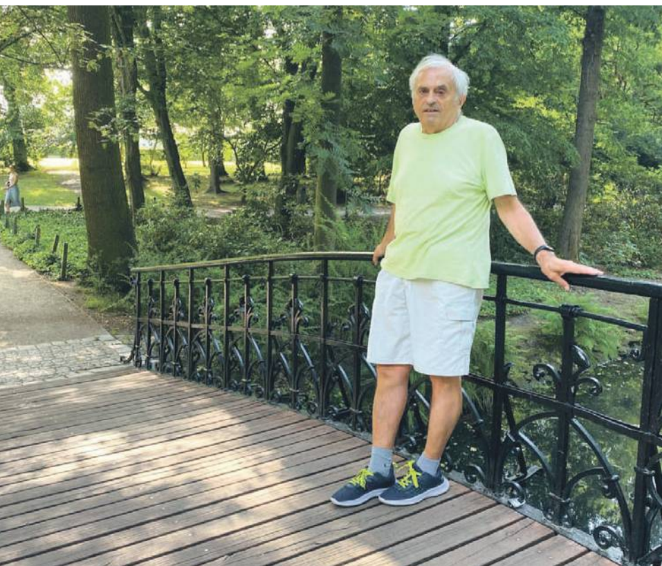
Autor przy mostku w Parku Szczytnickim