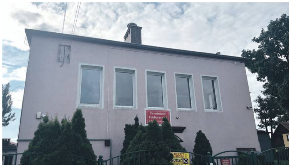
Przedszkole Publiczne nr 1 w Jelczu-Laskowicach