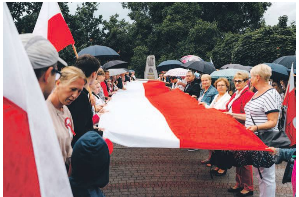
Podobnie jak przed rokiem, rozwinięto długą flagę