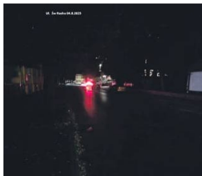
4 sierpnia. Ulica św. Rocha