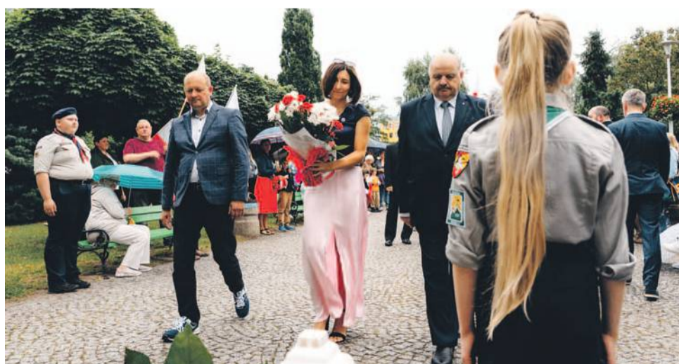
Delegacje składały kwiaty

TEKST I FOT.: KAMIL TYSA ktysa@gazeta.olawa.pl