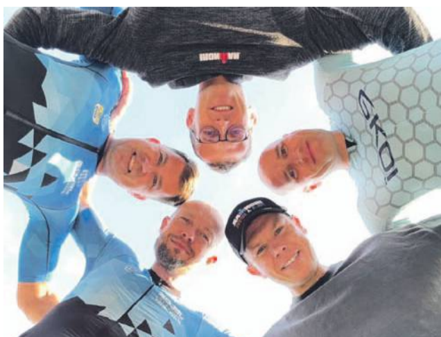
Spisali się świetnie