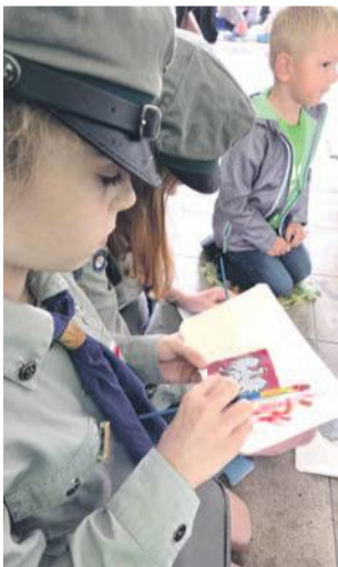
Malowali narodowe symbole

- 1 sierpnia 1944 roku o godzinie 17.00 rozpoczął się jeden z najbardziej dramatycznych