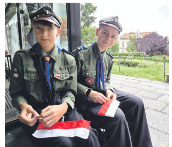
Szyli powstańcze opaski

TEKST I FOT.: WIOLETTA KAMIŃSKA wkaminska@gazeta.olawa.pl