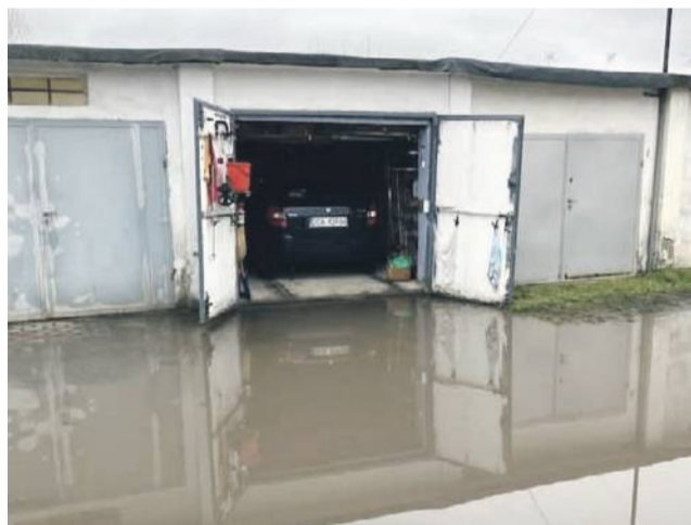
Jak to dojdź, żeby wyjechać?