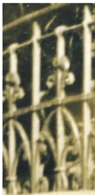
Wycinek kształtu balustrad ze zdjęcia z 1952