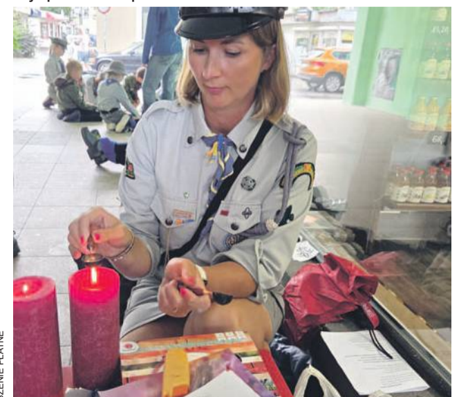
Harcerze są przygotowani do pracy w każdych warunkach