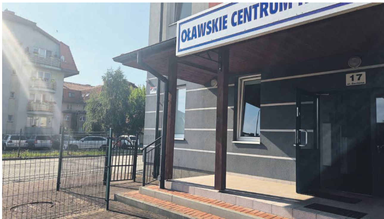
Teren wokół budynku wspólnoty jest przedzielony ogrodzeniem. Jest furtka, ale zamknięta