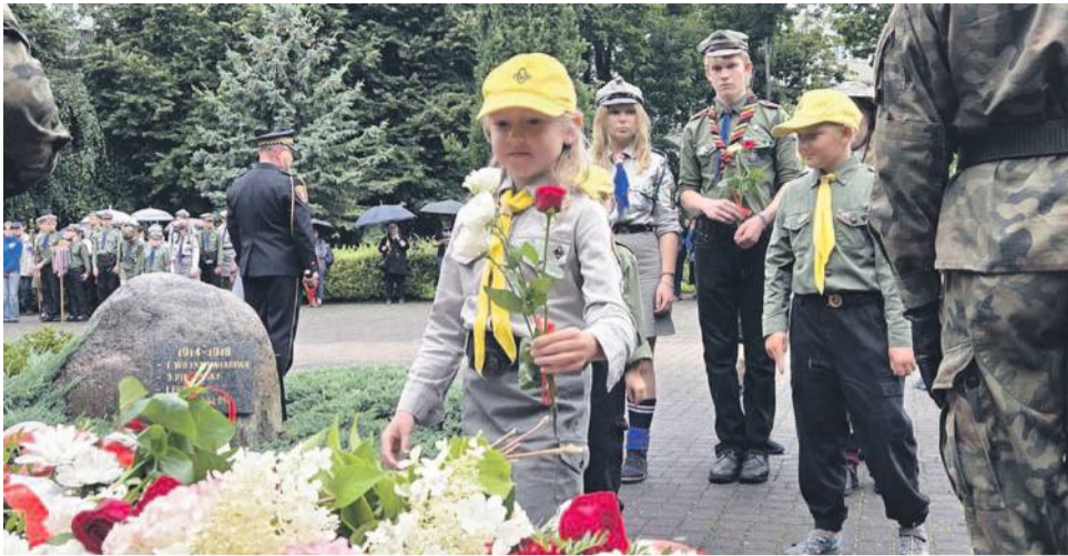
I ten mały kwiatek dla Powstańców od tych młodych...