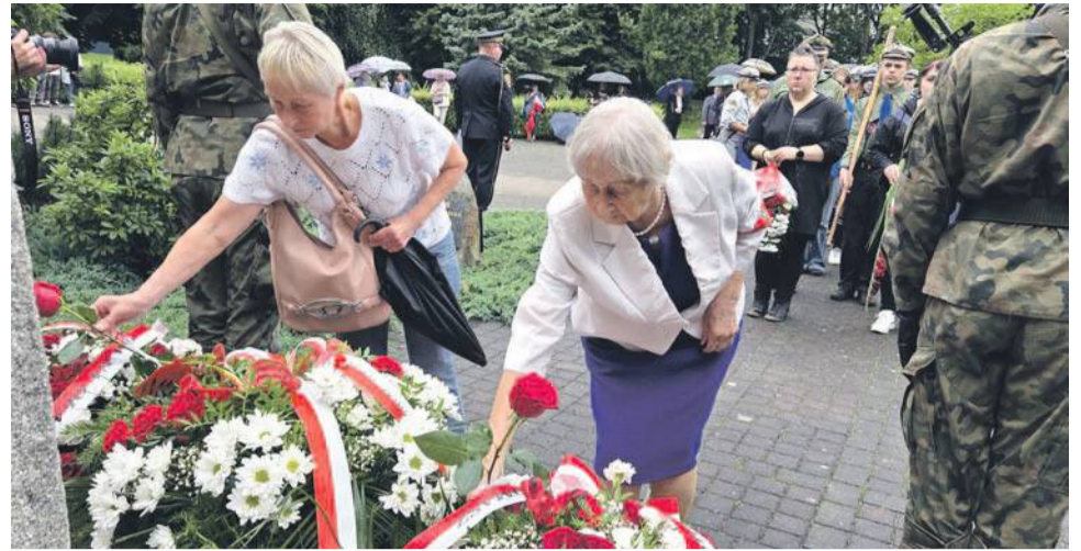
... i od tych starszych