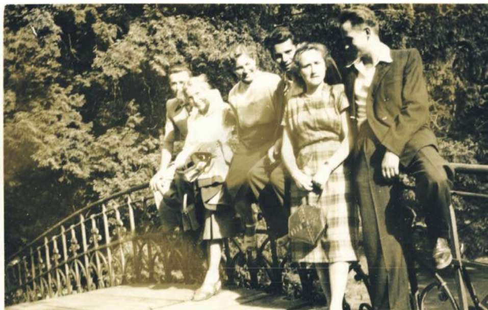
Całe zamieszanie jest właśnie o to zdjęcie. Młodzież z klasy maturalnej rocznika 1952 na pięknym żeliwnym moście - do tej pory twierdzono, że ten most był w oławskim parku

Porównując zdjęcie tego mostu z mostkiem, na którym stoją oławscy uczniowie z 1952 roku z dzisiejszym mostem zrobionym w Parku Szczytnickim we Wrocławiu, wyraźnie widać, że jest to ten sam most. Myślę, że ta odpowiedź powinna zakończyć dyskusję.