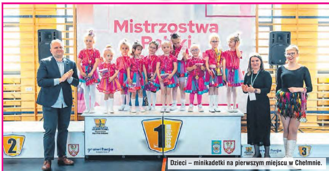
Dzieci – minikadetki na pierwszym miejscu w Chełmnie.

Baton, czyli pałeczka mażoretkowa nie ma nic wspólnego z czekoladką. Nazwa może być myląca, ale właśnie ten element prezencji mażoretek jest ich atrybutem. W Bysławiu tradycje mażoretkowe są już spore, bo zespół istnieje ponad dziesięć lat. W bieżącym roku było sporo sukcesów.