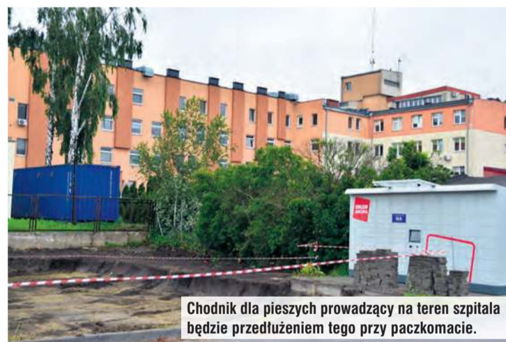
Chodnik dla pieszych prowadzący na teren szpitala będzie przedłużeniem tego przy paczkomacie.

Na działce usytuowanej pomiędzy Biedronką a terenem tucholskiej lecznicy ruszyły prace ziemne. Prywatny inwestor realizuje tutaj inwestycję polegającą na budowie trzykondygnacyjnego budynku usługowo-mieszkalnego o łącznej powierzchni ponad 2000 m 2 . W ramach partnerstwa prywatno-publicznego (porozumienia zawartego przez tucholskie samorządy z właścicielem działki) przez nieruchomość będzie przebiegał chodnik, prowadzący na teren szpitala. Takie rozwiązanie ma ułatwić szybsze dotarcie do lecznicy m.in. osobom starszym czy niepełnosprawnym (po wybudowaniu przejścia nie trzeba będzie iść aż do ul. Krzywej, żeby dostać się do szpitala). Niejednokrotnie