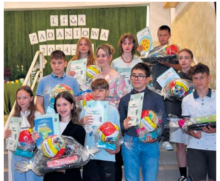
Młodzi mieli powody do zadowolenia. Okazali się najlepsi w ogólnej klasyfikacji z rejonu.