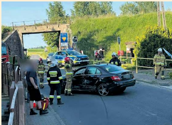
Niedzielne wydarzenie w Przyrowie wyglądało niebezpiecznie. Na szczęście obyło się bez osób rannych.