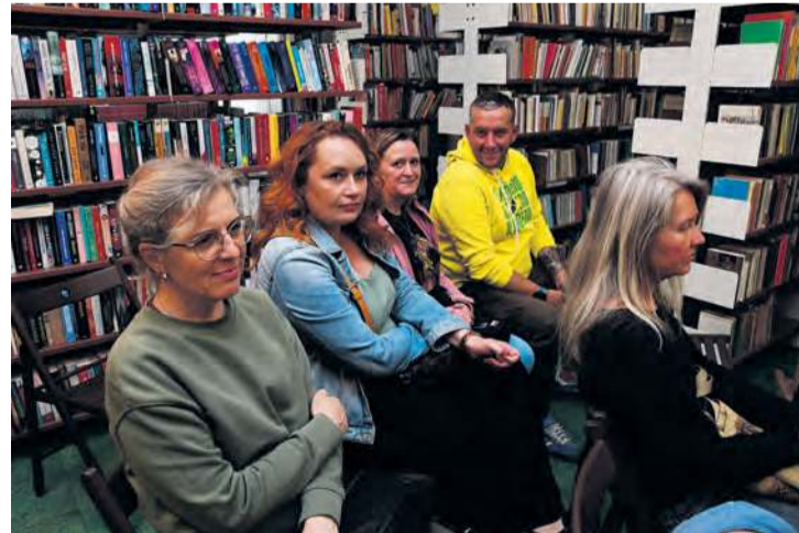
Goście środowego recitalu w bibliotece.