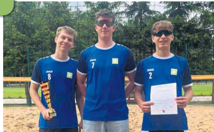
Siatkarze – licealiści zajęli miejsca zaraz za podium.