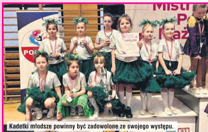
Kadetki młodsze powinny być zadowolone ze swojego występu.

Mimo natłoku spraw, terminów, zadań i pracy występ w Chełmnie był ukoronowaniem całych starań w nieustannym dążeniu do perfekcji. Ale Bysławskie Mażoretki nie tylko trenują z myślą o zawodach. Istnienie grupy