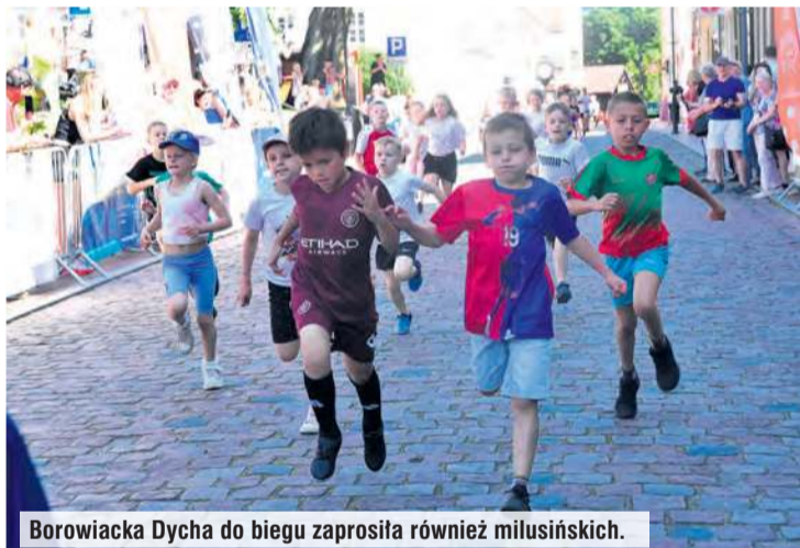
Borowiacka Dycha do biegu zaprosiła również milusińskich.