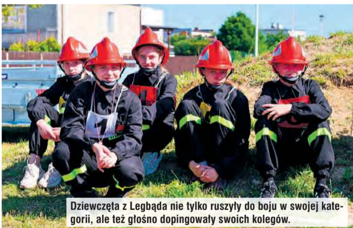
Dziewczeta z Legbąda nie tylko ruszyły do boju w swojej kategorii, ale też głośno dopingowały swoich kolegów.

krotnie, także podczas samego podsumowania zawodów.