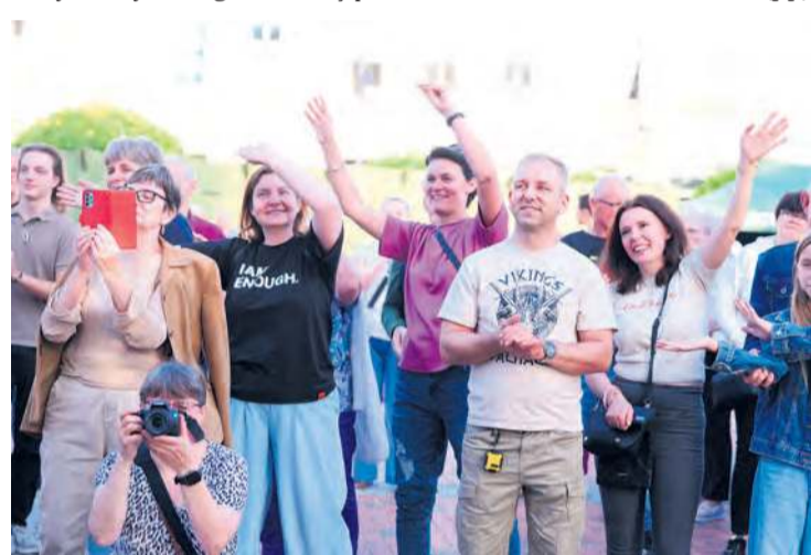
Pierwsza publiczność zespołu TOK'n'ROCK.