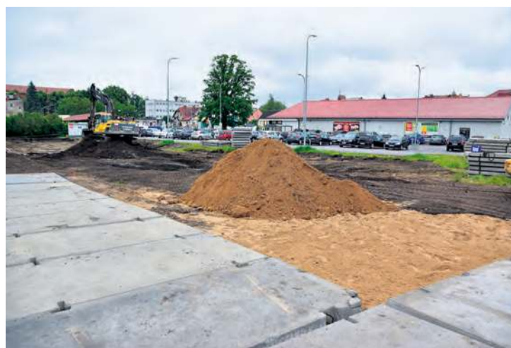
Inwestycja praktycznie dopiero co ruszyła. Zgodnie z założeniem trzykondygnacyjny obiekt ma zostać pobudowany do końca roku.