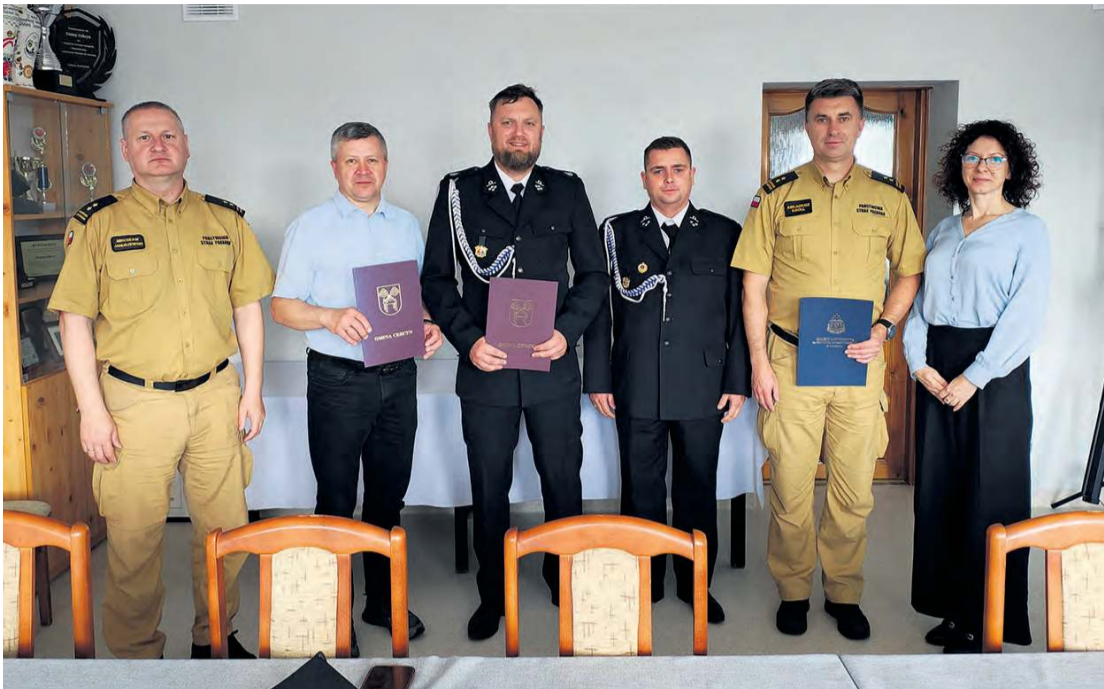
Trójstronne porozumienie 9 czerwca (poniedziałek) w Urzędzie Gminy w Cekcynie.

Ochotnicza Straż Pożarna w Zielonce sformalizowała swoje starania o włączenie do Krajowego Systemu Ratowniczo-Gaśniczego. Teraz pozostaje czekać na decyzję, ale zdaniem rzeczownika tucholskiej KP PSP nic nie stoi na przeszkodzie, aby jednostka dołączyła do Krajowego Systemu Ratowniczo-Gaśniczego.