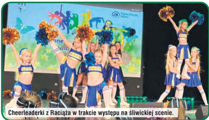
Cheerleaderki z Raciąża w trakcie występu na śliwickiej scenie.

– Wszystkie sukcesy skutkujące dekoracją na podium są cenne i jedyne, ale szczególnie chcę