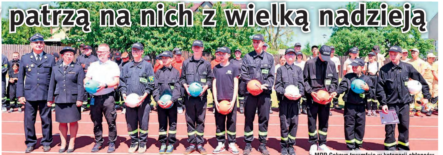
MDP Cekcyn tryumfuje w kategorii chłopców.

Bezsprzecznie bardzo cieszył widok dzieci i młodzieży, która stawia na takie spędzanie czasu. Ten fakt był podkreślany wielo-