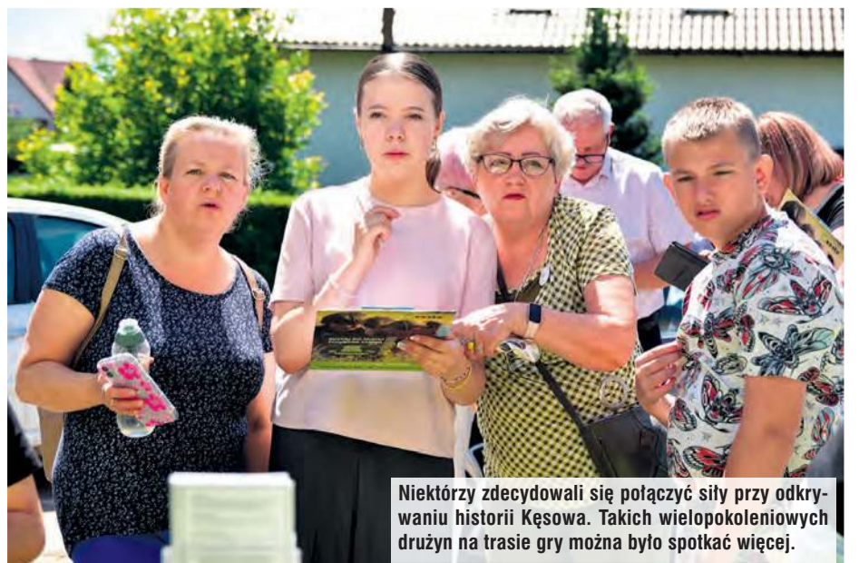
Niektórzy zdecydowali się połączyć siły przy odkrywaniu historii Kęsowa. Takich wielopokoleniowych drużyn na trasie gry można było spotkać więcej.