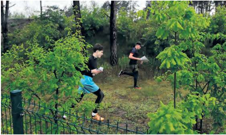
Zawodnicy mimo obfitych opadów deszczu, które rozpoczęły się zaraz po starcie, nie tracili werwy i szukali kolejnych punktów z mapy.

Na terenie Centrum Szkolenia Strzeleckiego Lasów Państwowych w Plaskoszu przeprowadzono trzecią edycję Powiatowego Biegu na Orientację. To dyscyplina, w której nie tylko liczy się sprawność fizyczna, ale przede wszystkim umiejętność posługiwania się kompasem i mapą.