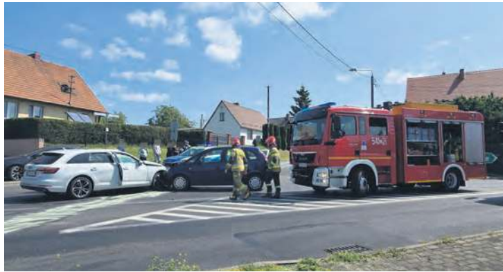
Piątkowe zdarzenie na skrzyżowaniu w Tucholi, w pobliżu wjazdu na napoleonkę.

W piątek (13.06) około godziny 10:30 w Tucholi doszło do zderzenia dwóch pojazdów osobowych na ul. Głównej w obrębie skrzyżowania na Śliwice.