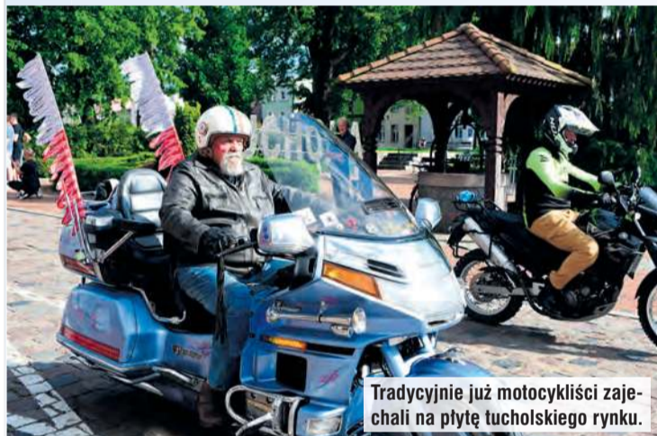
Tradycyjnie już motocykliści zajechali na płytę tucholskiego rynku.