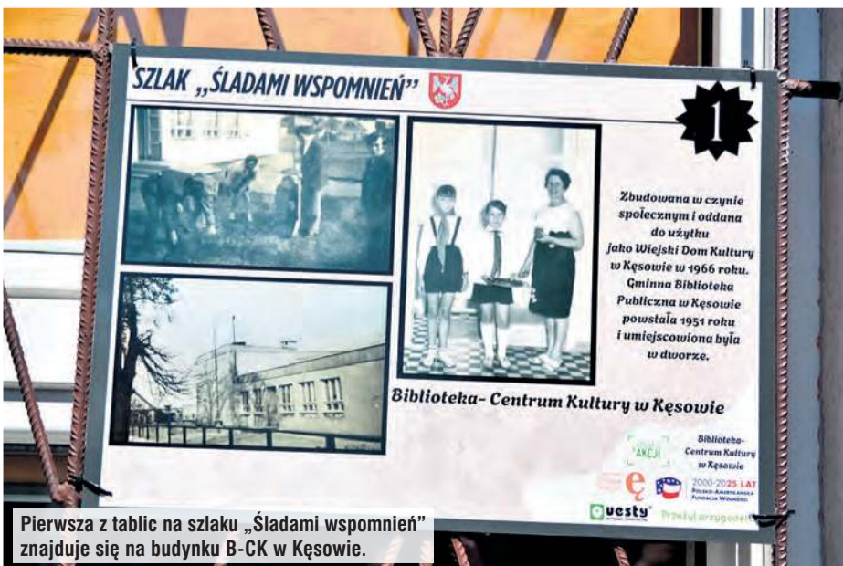
Pierwsza z tablic na szlaku „Śladami wspomnień” znajduje się na budynku B-CK w Kęsowie.