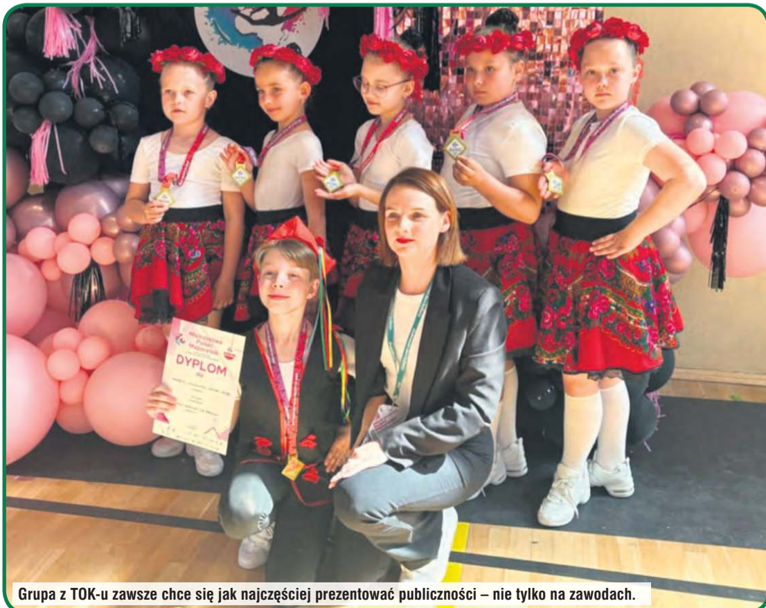
Grupa z TOK-u zawsze chce się jak najczęściej prezentować publiczności – nie tylko na zawodach.