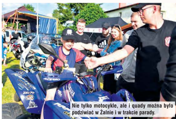
Nie tylko motocykle, ale i quady można było podziwiać w Żalnie i w trakcie parady.