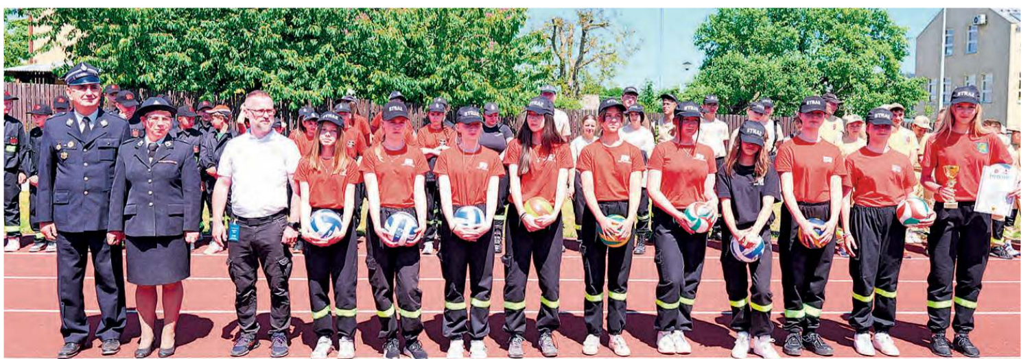
Zwycięska drużyna dziewcząt z Cekcyna.