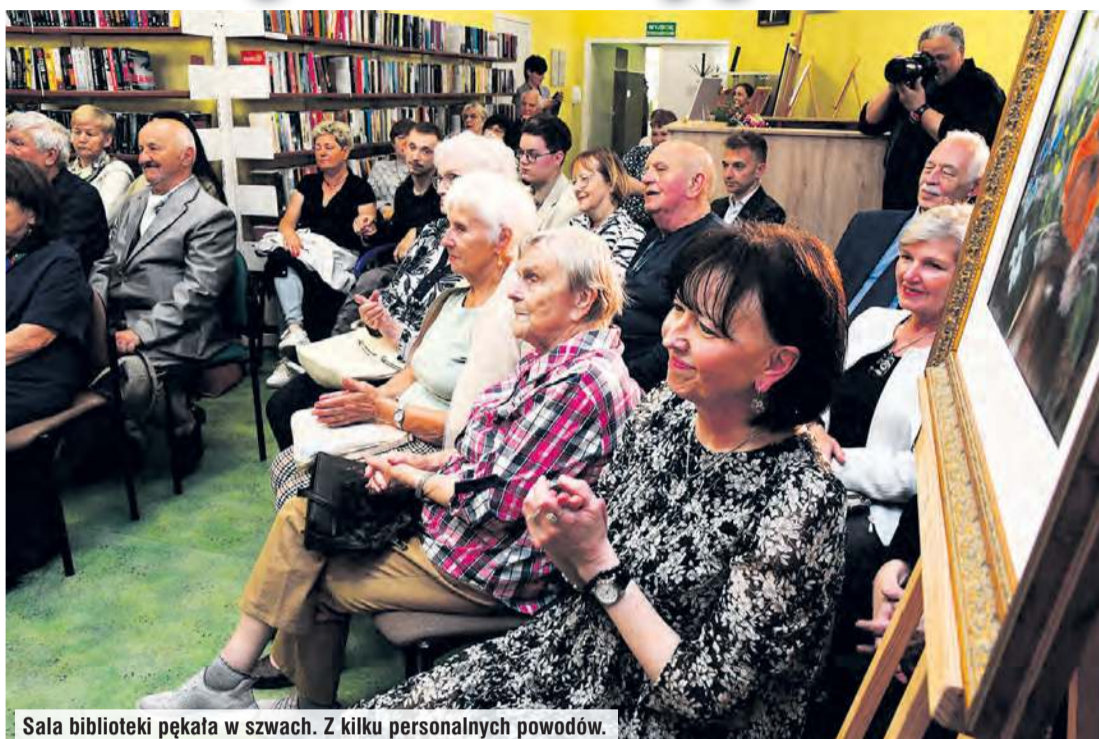
Sala biblioteki pękała w szwach. Z kilku personalnych powodów.