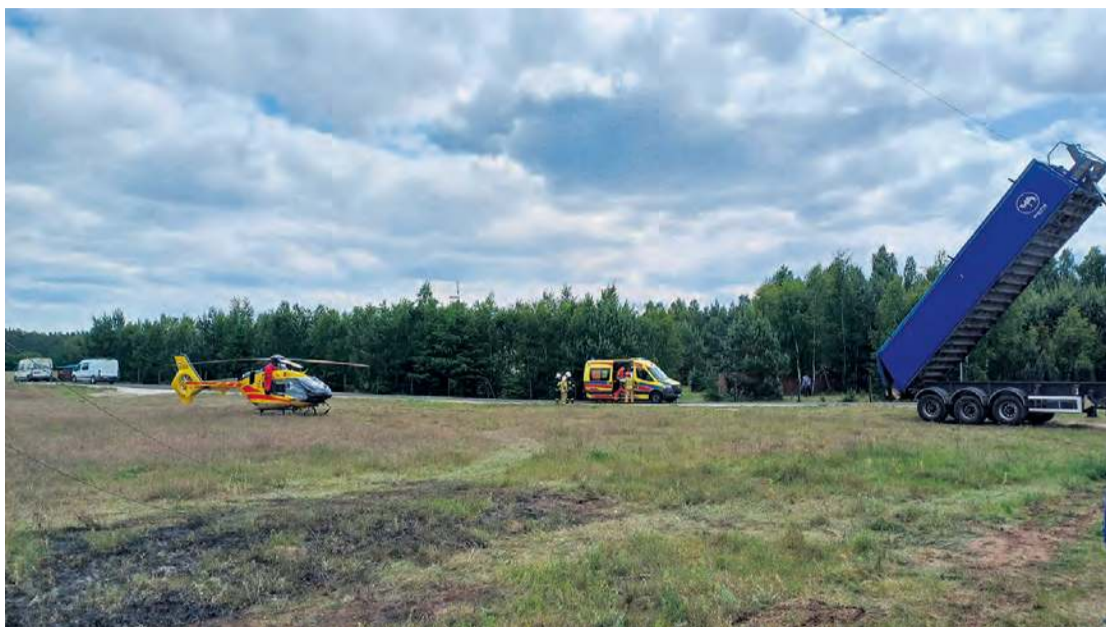
Poszkodowanego kierowcę z bolesnymi poparzeniami przetransportowano śmigłowcem LPR do szpitala w Bydgoszczy.

Do niebezpiecznego zdarzenia z udziałem ciągnika siodłowego doszło w Pile (gm. Gostycyn) w piątek (13.06) po południu.