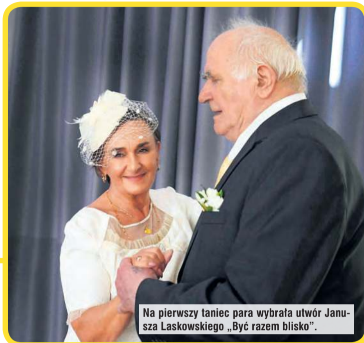
Na pierwszy taniec para wybrała utwór Janusza Laskowskiego „Być razem blisko”.