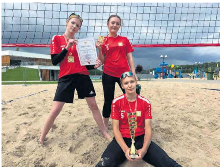
Dziewczęta, grając na piasku, mają zapowiedź wakacji, choć do letniej aury daleko.

Licealiada daje pole do popisu uczennicom szkół średnich, które na co dzień są jednocześnie uczennicami, nierzadko wzorowymi, i równie świetnie trenują w lokalnych klubach sportowych. Na tym polu nie pierwszy raz sukces odniosły uczennice tucholskiego liceum. Są najlepsze w województwie.