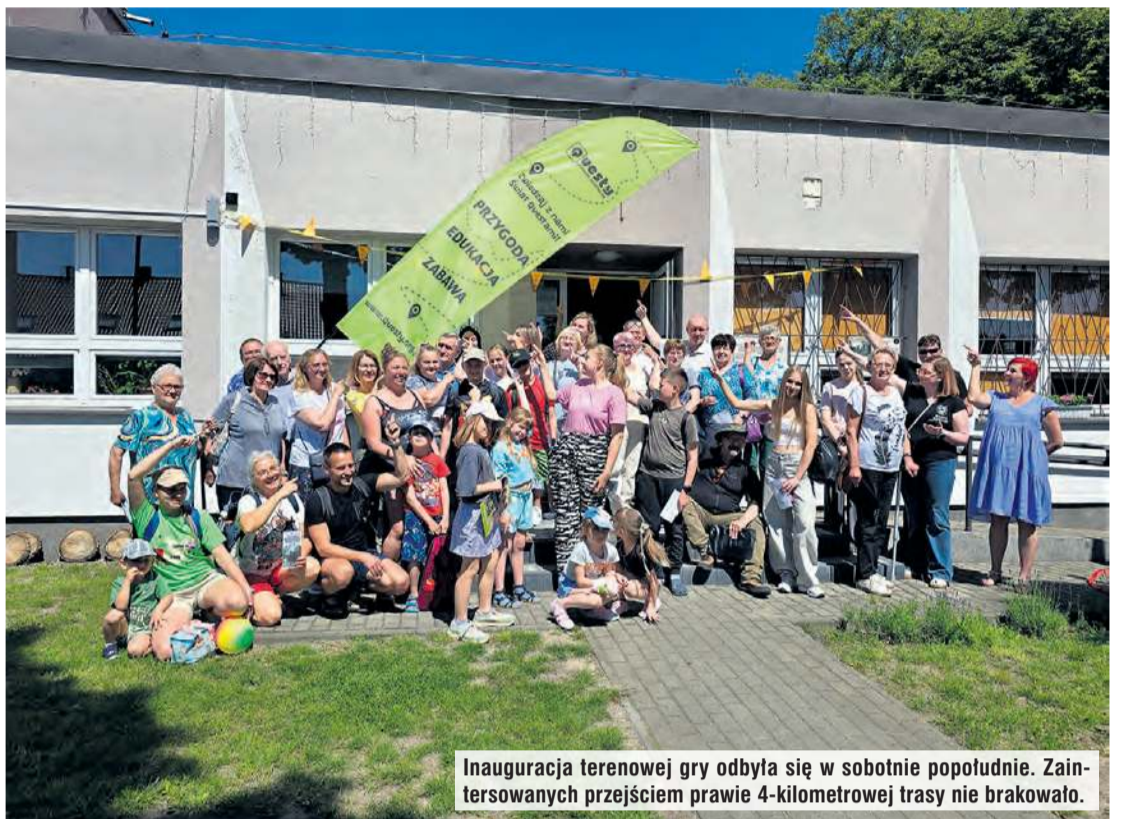
Inauguracja terenowej gry odbyła się w sobotnie popołudnie. Zainteresowanych przejściem prawie 4-kilometrowej trasy nie brakowało.

Podczas sobotniej inauguracji animatorki projektu „Ocalić ślady wspomnień” dziękowały serdecznie wszystkim osobom, które w taki czy inny sposób włączyły się w realizację projektu. Mowa tutaj o wspomnianych wcześniej seniorach i młodzieży, ale i chociażby twórcach ludo-