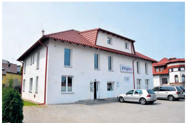
Spółdzielnia Socjalna Progres mieści się w Tucholi przy ul. Wałowej 9.

Spółdzielnie Socjalną Progres konkurs na półroczną terapię. Zwycięzca będzie mógł bezpłatnie skorzystać z wybranej przez siebie terapii dostępnej w placówce. Są to: terapia psychologiczna, biofeedback, integracja sensoryczna, logopedyczna, fizjoterapia czy terapia pedagogiczna.