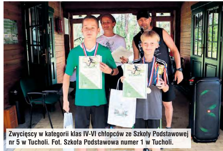
Zwycięzcy w kategorii klas IV-VI chłopców ze Szkoły Podstawowej nr 5 w Tucholi.