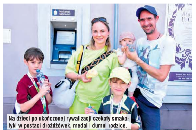
Na dzieci po ukończonej rywalizacji czekały smakołyki w postaci drożdżówek, medal i dumni rodzice.

– Jestem urodzony do biegania, bo jak sięgam tylko pamięcią, zawsze lubiłem być czynny ruchowo. Od dziecka na podwórku były: piłka, badminton, siatkówka, piłka nożna itd. Moja szkoła średnia to Liceum Pedagogiczne w Tucholi w latach 1964-1966. W Brodnicy zrobiłem maturę i później studia, podczas których także biegałem, bo poszedłem na wychowanie fizyczne z biologią. (...)