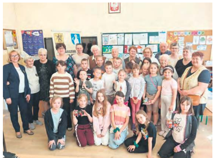
Zadowoleni uczestnicy warsztatów i ich prowadzący w Szkole Podstawowej nr 5 w Tucholi.

Agata Wiśniewska