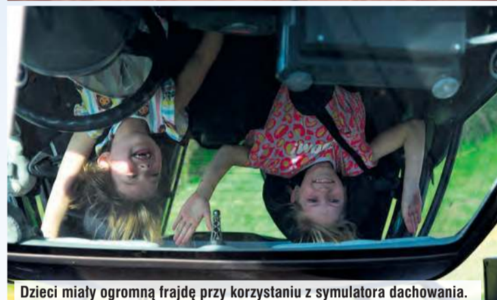
Dzieci miały ogromną frajdę przy korzystaniu z symulatora dachowania.