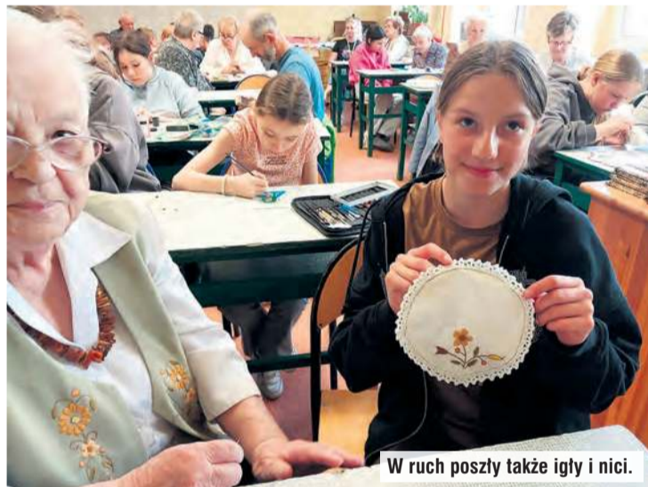
W ruch poszły także igły i nici.