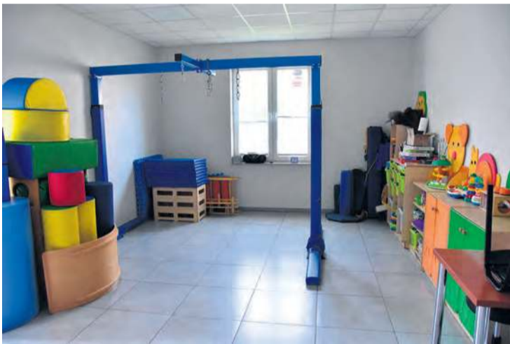
Pracownicy Spółdzielni Socjalnej Progres pragną wesprzeć dzieci i młodzież oraz ich rodziny borykające się z kryzysem psychicznym m.in.: depresją, zaburzeniami o podłożu lękowym, ADHD, trudnościami w budowaniu relacji społecznych. Pomoc ta ma być dostępna bezpłatnie przez okres minimum dwóch lat.

– My, jako pracownicy Spółdzielni Socjalnej Progres liczymy na duże zainteresowanie konkursem, co znacznie przyspieszy osiągnięcie naszego celu, jakim jest wykończenie budynku i wyposażenie sal. To przyspieszy proces i da znacznie większą możliwość bezpłatnego wspar-