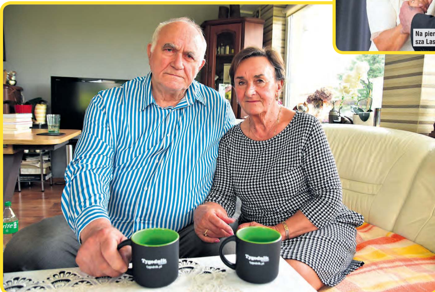
Do nowożeńców wybraliśmy się z upominkiem. Jednym z jego elementów były kubki z logo „Tygodnika”.

z młodą parą dwa dni po ślubie, to jest we wtorek (10.06).