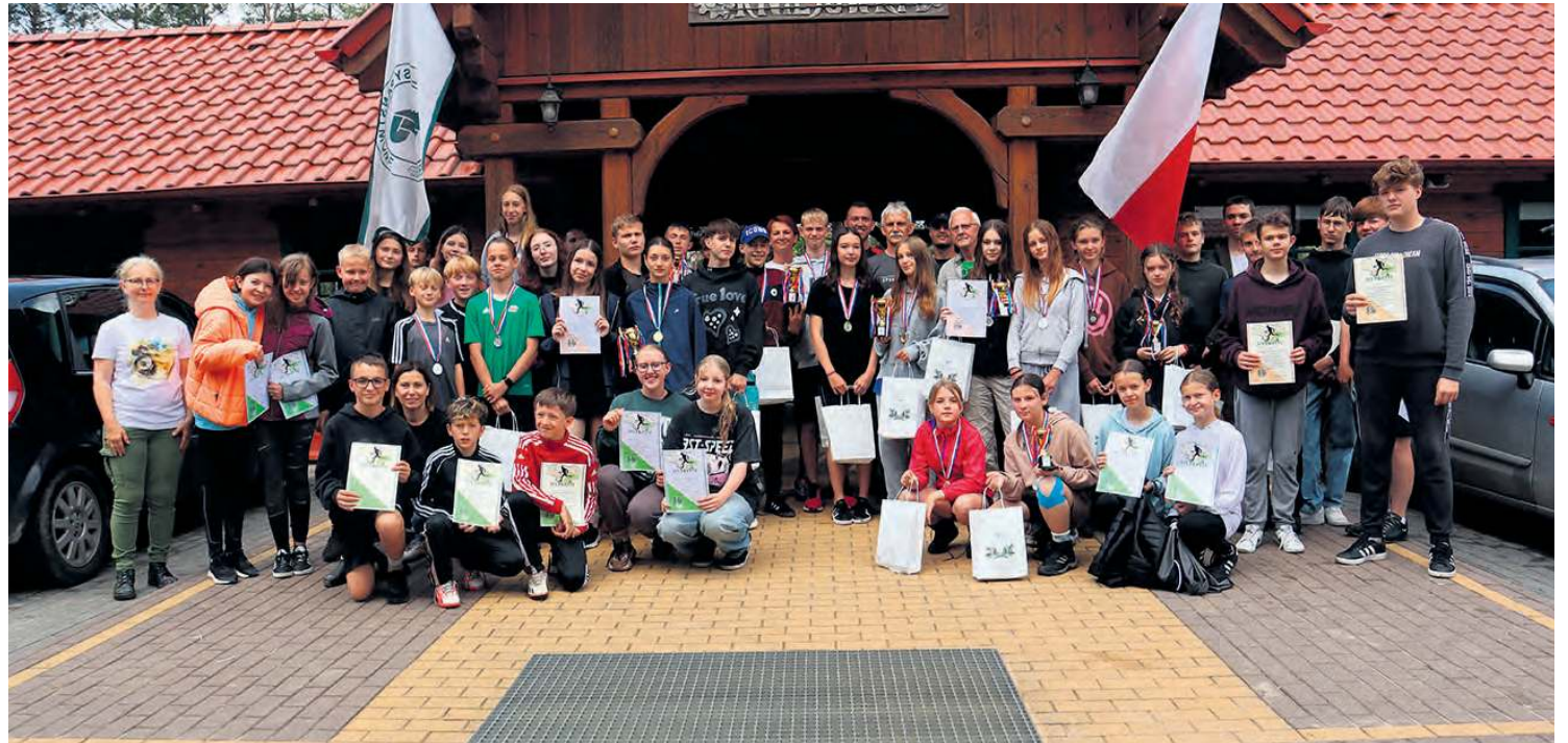
Pamiątkowa fotografia uczestników i ich opiekunów oraz organizatorów III edycji Powiatowego Biegu na Orientację „Jedynka z mapą w terenie”.