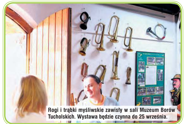
Rogi i trąbki myśliwskie zawisły w sali Muzeum Borów Tucholskich. Wystawa będzie czynna do 25 września.