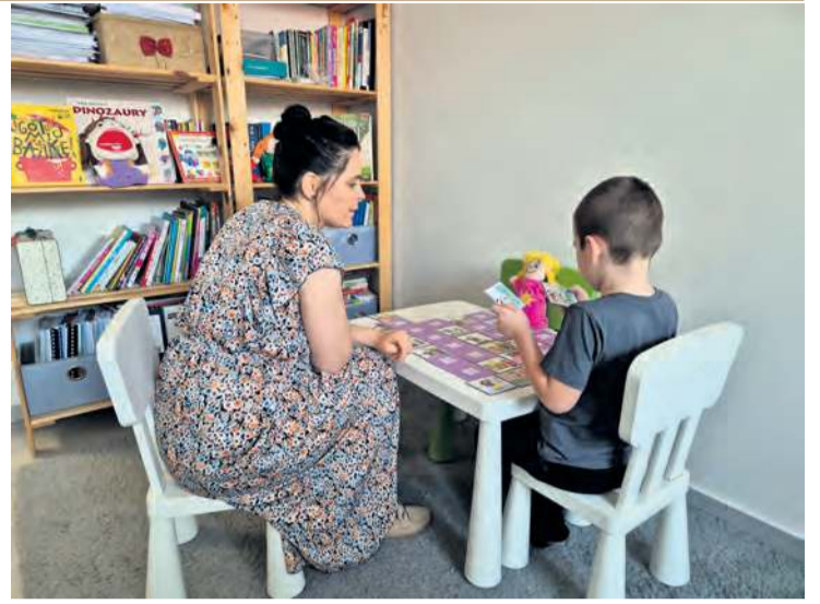
Spółdzielnia Socjalna Progres zapewnia bezpieczną przestrzeń do terapii, wzmacniania kompetencji społecznych i przeciwdziałania wykluczeniu.

Teraz przed załogą Spółdzielni Socjalnej Progres stoi ważne zadanie – zbieranie środków na wyposażenie sal terapeutycznych, aby stworzyć kolejne przestrzenie do jeszcze bardziej zaangażowanej pracy z potrzebującymi. W tym celu utworzono zbiórkę na portalu siepomaga.pl, której zadaniem jest pozyskanie środków na wykończenie pierwszego piętra budynku i kompleksowe wyposażenie nowych sal w odpowiednie sprzęty oraz pomoce terapeutyczne. Potrzebne są m.in. meble, sprzęt multimedialny, materiały do terapii oraz specjalistycznych pomocy dydaktycznych. Przewidywany koszt to około 200.000 zł. Zbiórka trwa od maja 2024 roku. Obecnie kwota nieznacznie przekracza 31 tys. zł.