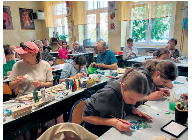
W trakcie zajęć panowała dobra atmosfera, a towarzyszyła jej wręcz mrówcza praca.

ska Zrzeszenia Kaszubsko-Pomorskiego Oddział Tuchola.