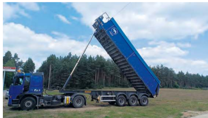
Do zerwania linii energetycznej doszło przy podnoszeniu naczepy ciągnika siodłowego.