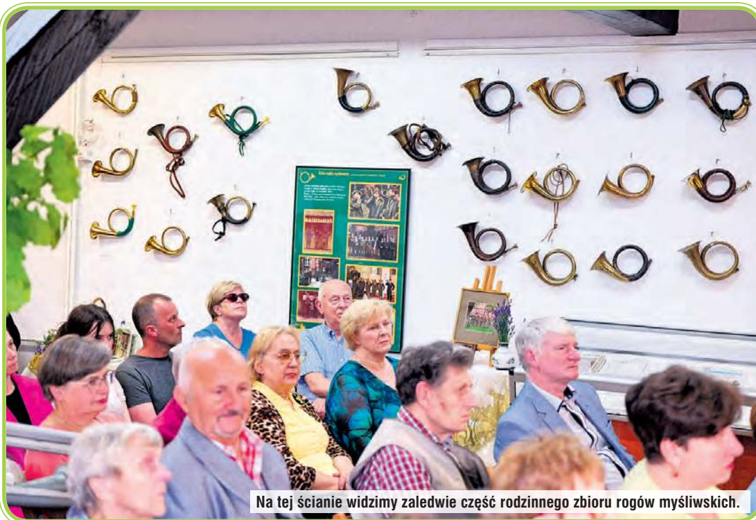
Na tej ścianie widzimy zaledwie część rodzinnego zbioru rogów myśliwskich.