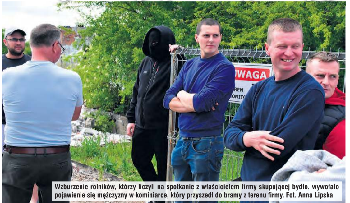
Wzburzenie rolników, którzy liczyli na spotkanie z właścicielem firmy skupującej bydło, wywołało pojawienie się mężczyzny w kominiarce, który przyszedł do bramy z terenu firmy.

– Apelujemy do wszystkich rządzących – posłów i nie tylko. Gdyby ta sytuacja spotykała rolników przed wyborami, to oni by tu byli. Teraz nie ma nikogo. Zwracamy się do was z uprzejmą prośbą. Wspomóżcie nas. Róbcie jakieś konferencje. Cokolwiek. Przyjdźcie tutaj na miejsce. (...) Nas nie interesuje, z jakiej frakcji oni [politycy – przyp. redakcji]