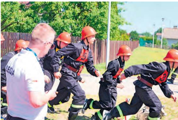
Dobrze wypadła w zawodach ekipa z Iwca.