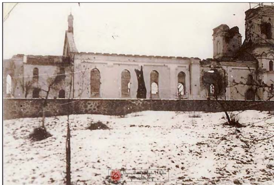
➤ Są piękne zdjęcia z historii Łaskarzewa, ale są też obrazujące ogromniszyszczeń z września 1939 roku. Na zdjęciu kościół parafialny w grudniu 1939.

Łśniące w słońcu, pokryte miedzianą blachą kopuły dumnie zwieńczają wieże kościoła parafialnego pw. Podwyższenia Krzyża Świętego w Łaskarzewie. To symboliczny punkt powojennej odbudowy świątyni i widoczny znak obchodów 700-lecia istnienia parafii. Zdjęcia ze strony „Łaskarzew na starej fotografii” przedstawiają świątynię przed tragicznym zniszczeniem we wrześniu 1939 roku, jak również pokazują ogromniszyszczeń dokonanych przez Niemców