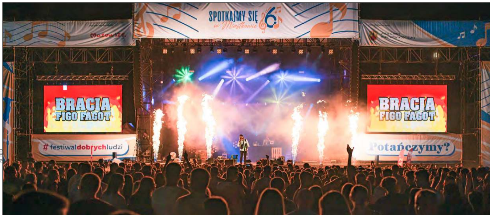
» Ponad 20 tysięcy osób przewinęło się przez Miastków podczas szóstej edycji charytatywnego wydarzenia „Spotkajmy się w Miastkowie”

To już sześć lat. Wydarzenie ma ugruntowaną pozycję w powiecie i w regionie. Jak możesz podsumować to, co działo się w niedzielę i to, co jeszcze dzieje się w tej