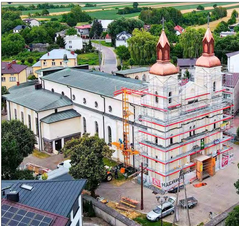
Wokół wież kościoła wciąż stoi rusztowanie, na którym trwają prace wykończeniowe. Nowe kopuły, zwłaszcza w słoneczne dni, robią duże wrażenie, odbijając światło od miedzianej blachy i połączonych zwieńczeń.

- Niewiele znamy faktów historycznych dotyczących pierwszych stu lat naszej parafii. Brak materiałów pisanych uniemożliwia nam dotarcie do początkowych dziejów naszej parafii. Pierwsze udokumentowane informacje dotyczą działalności biskupa poznańskiego Andrzeja, który przynosi parafię ze wsi Gorceycowo pod wezwaniem Podwyższenia Krzyża Świętego do diecezji poznańskiej, na teren obecnego Łaskarzewa.