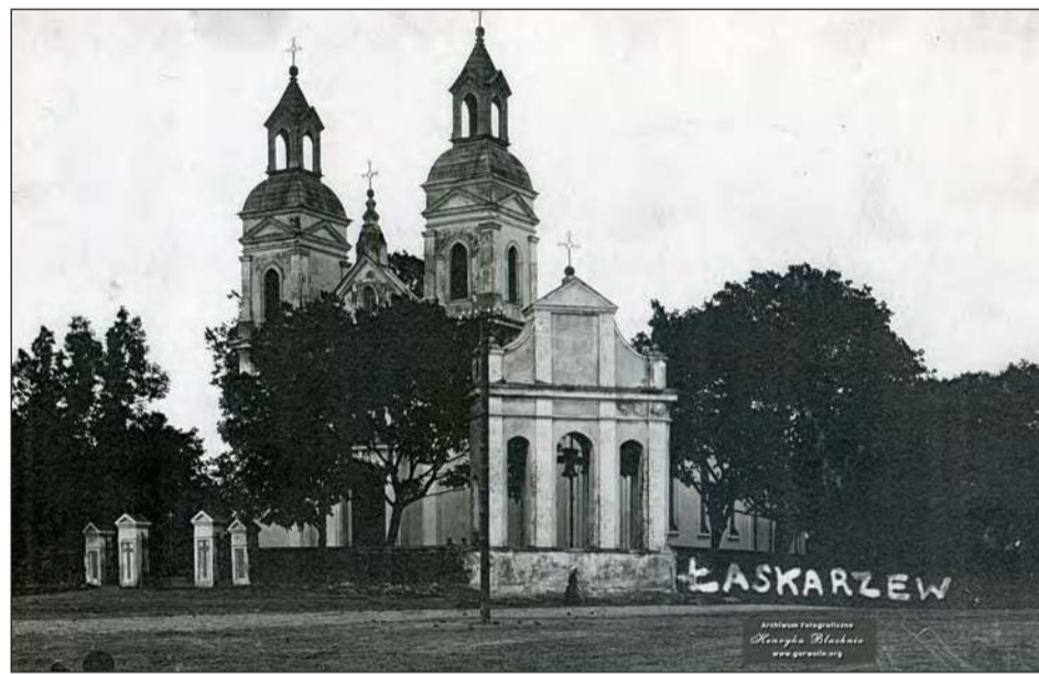
➤ Łaskarzew - 1936 rok. Kościół parafialny i dzwonnica. W roku 1915 kościół został uszkodzony przez pocisk artyleryjski, a doszczętnie spalony w dniu 17 września 1939 roku. Został odbudowany i powiększony w stylu „modern” w 1946 roku. Zdjęcie z Archiwum Fotograficznego Pana Henryka Błachnio. Udostępnione przez Panią Hanię Sereję