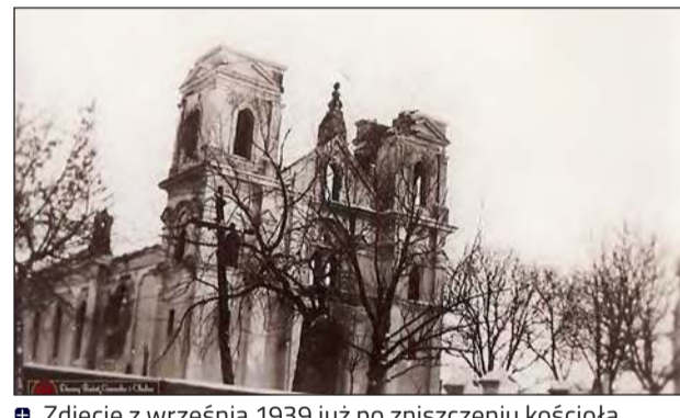
➤ Zdjęcie z września 1939 już po zniszczeniu kościoła. Kiedy ołtarz i cały kościół uległ całkowitemu zniszczeniu, front i wejście główne ocalało. Zniszczeniu uległy wieże i dach. Widok na kościół od frontu - zniszczony podczas obrony Łaskarzewa. Zdjęcie wykonane 25.09.1939 r. - 8 dni po bombardowaniu.