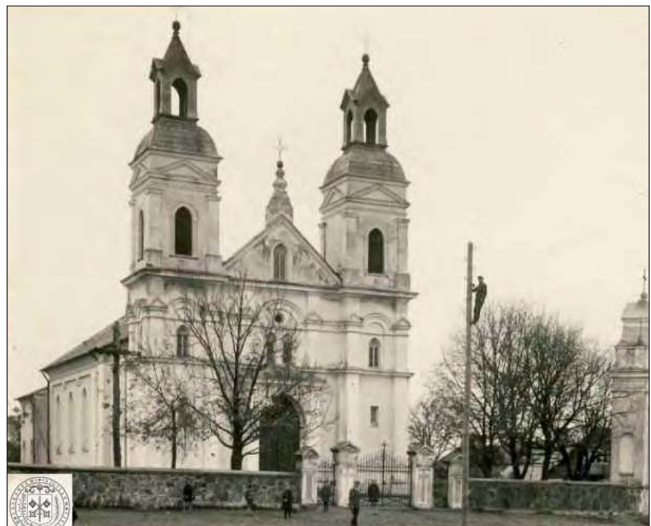
➤ Zdjęcie przedwojennego Łaskarzewa znalezione na białoruskim forum dotyczącym przedwojennej architektury w Polsce.