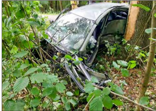
■ Kierowca toyoty, który miał 2 promile alkoholu w organizmie, zjechał z drogi i uderzył w drzewo. On i jego pasażer trafili do szpitala