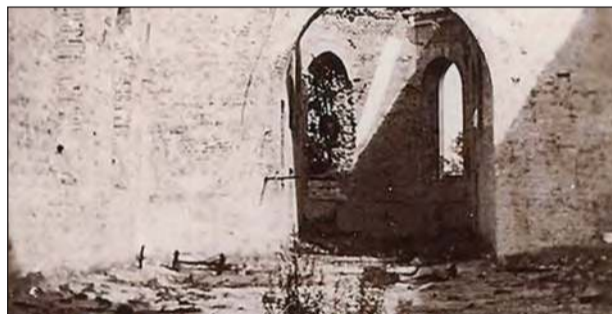
➤ Łaskarzew - Wrzesień 1939 r. Dni 15-17 września 1939 roku to jedno z najtragiczniejszych dni w historii Łaskarzewa. Miasto zostało spalone praktycznie w całości (pozostały nieliczne budynki). Najważniejszy budynek - kościół został zbombardowany i spalony doszczętnie. W tych dniach pełnił przez jakiś czas punkt obronny. Na wieży kościoła umieszczony był karabin CKM, z którego broniono barykady na ul. Warszawskiej. Na zdjęciu widok ze środka kościoła, zanim został on odbudowany.