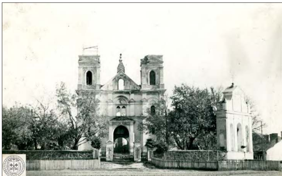
➤ 17 września 1939 roku. Na łaskarzewskim Rynku od rana, z dwóch stron słyhać było przeplatające się nawzajem śpiewy... Jedne płynęły z parafialnego kościoła, gdzie trwała jeszcze poranna Msza Św., a drugie słyhać było z wieży kościoła, gdzie polscy żołnierze śpiewali „Ostatnią niedzielę”. Po godzinie 7:00 rano, gdy trwała jeszcze Msza Św. niemieckie siły uderzyły na Łaskarzew. Zacięte walki trwały do godzin popołudniowych. Nie było 3 sekund bez strzału... Mimo bohaterskiego oporu, mimo męstwa wszystkich mieszkańców i żołnierzy Wojska Polskiego na wspólnie wzniesionych barykadach po 3 dniach walk Łaskarzew dostał się w ręce wroga. Zginęło ponad 100 osób. Zagłada i zniszczenie było całkowite. Przetrwało jedynie kilka budynków z 250! Zniszczony został kościół parafialny.