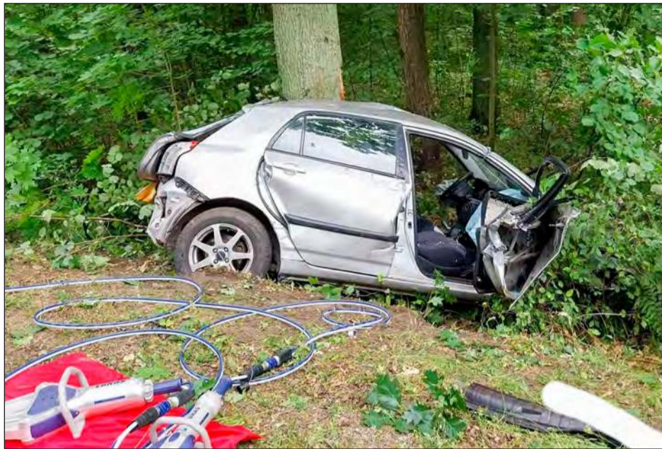
■ Aby uwolnić zakleszczonych w pojeździe podróżnych, konieczne było użycie narzędzi hydraulicznych

W sobotę przed południem w miejscowości Zakręty doszło do groźnego wypadku. Kierowca toyoty, który miał 2 promile alkoholu w organizmie, zjechał z drogi i uderzył w drzewo. On i jego pasażer trafili do szpitala