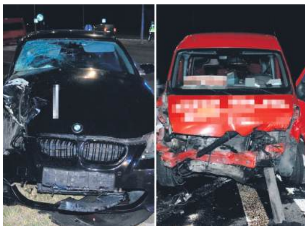
BMW uderzyło w busa, którego kierowca przewoził 10 pasażerów.

Podkomisarz Dorota Krukowska-Bubiło z Komendy Miejskiej Policji w Zamościu przekazała, że ze wstępnych ustaleń policjantów wynika, iż kierujący busem jechał ulicą Legionów od Lublina w kierunku Tomaszowa Lubelskiego. Z naprzeciwka poruszał się kierujący BMW, który na wysokości ulicy Starowiejskiej zamierzał skręcić w lewo. Wykonując ten manewr, nie ustąpił pierwszeństwa kierującemu