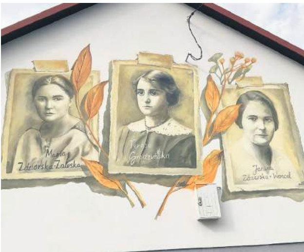
Mural powstał z okazji 105. rocznicy bitwy pod Stefankowicami.

Mural z wizerunkami trzech bohaterskich sanitariuszek – uczestniczek wojny polsko-bolszewickiej w 1920 r. – ozdobił ścianę wiejskiej świetlicy w Stefankowicach (Gmina Hrubieszów). Oficjalne odsłonięcie malowidła zaplanowano na 21 września – będzie głównym punktem obchodów 105. rocznicy bitwy pod Stefankowicami.