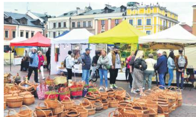
Dużą popularnością wśród zwiedzających cieszyły się stoiska z rękodziełem.

wiło się około 40 wystawców z województwa lubelskiego. Chętni mogli skorzystać z degustacji lokalnych produktów, w tym przygotowanych przez panie z kół gospodyń wiejskich. Można było porozmawiać o recepturach i poznać historie kryjące się za lokalny-