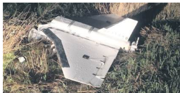
Dron znaleziony w Przymiarkach w powiecie biłgorajskim.

– Wszystkie zdarzenia będą przedmiotem jednego śledztwa prowadzonego przez 8 Wydział do Spraw Wojskowych Prokuratury Okręgowej w Lublinie – zapewnia Beata Syk-Janowska, rzecznik prasowy Pro-