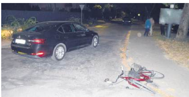
26-latek z gminy Telatyn, kierując skodą, nie ustąpił pierwszeństwa przejazdu i skręcając w lewo, najechał na jadącą jednoślądem 71-latkę.

– Ze wstępnych ustaleń policjantów wynika, że na ulicy Wyzwolenia kierujący Skodą