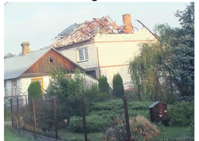
W Wyrkach został zniszczony dom.

Zakaz lotów wzdłuż granic z Białorusią i Ukrainą obowiązuje od 10 września do 9 grudnia br. Oprócz zakazu lotów cywilnych dronów przewidziano też ograniczenia dla lotnictwa cywilnego, z wyjątkiem pogotowia lotniczego, lotów państwowych oraz działań związanych z ochroną infrastruktury krytycznej. Jak podkreślają wojskowi, decyzja ma charakter prewencyjny i służy zwiększe-