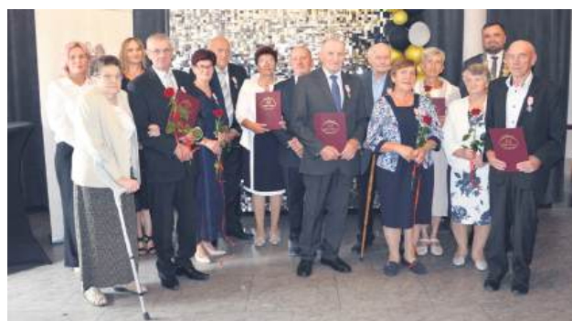
Sześć par świętujących 50-lecie małżeństwa.