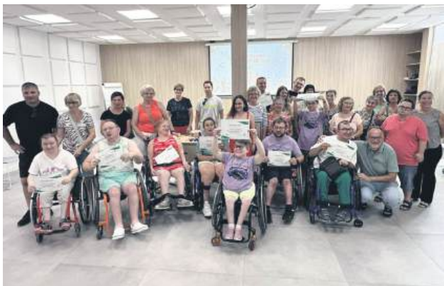
Wyjazd został zorganizowany w ramach programu „Grupowa mobilność Erasmus+ »Niezależne życie« Reus”.

Była terapia w morzu i miejskich basenach oraz inne aktywności sportowe, a spotkanie z prezesem fundacji sportowej dla osób z niepełnosprawnościami „Costa Dorada” dostarczyło inspiracji i motywacji. Nasi reprezentanci mieli też okazję poznać tradycyjną hiszpańską muzykę w wykonaniu osób