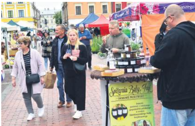
Chętni mogli skorzystać z degustacji lokalnych produktów.

To była 10. edycja Festiwalu Żywności Wolnej od GMO prosto od Polskiego Rolnika. W dniach 13-14 września w Zamościu można było posmakować zdrowych produktów, nie zabrakło też konkursów, występów i innych atrakcji.