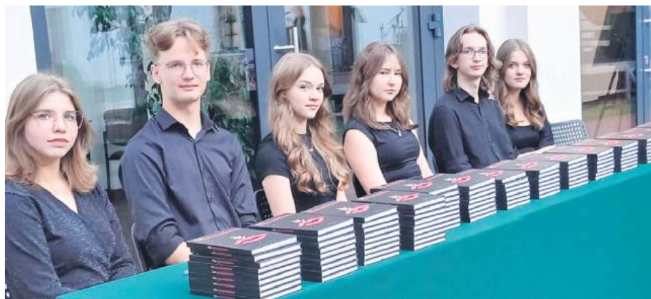
Po sukcesie wydanego w zeszłym roku tomiku, przyszła kolej na zbiór wierszy „NIEwypowiedziane”.