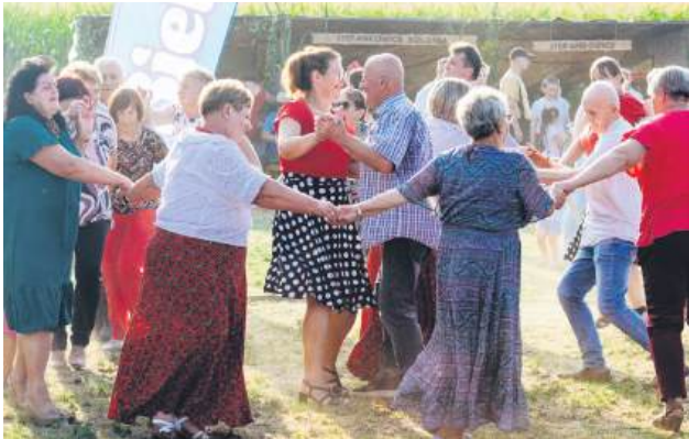
Po oficjalnych dożynkowych uroczystościach rozpoczęła się wspólna zabawa.