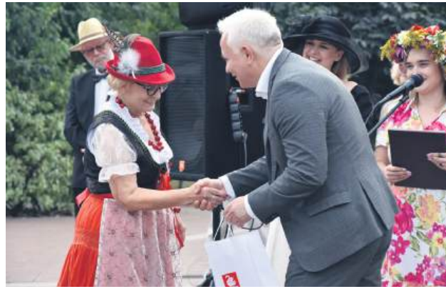
Rozstrzygnięcie konkursu na najlepsze przebranie.