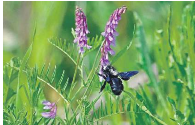
Czarna pszczoła.

lat. – Zjawiały się około godziny 10, gdy było już ciepło, słonecznie i bezwietrznie – kontynuuje pan Tadeusz. – Zwykle przylatywały