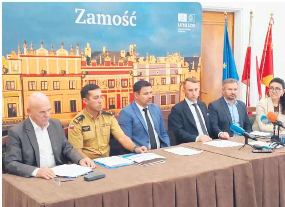
Konferencja odbyła się 4 września.

radiotelefonów w obsłudze cyfrowej, które w razie kryzysu będą przeznaczone do wykorzystania i zachowania łączności np. z rezerwowym, zastępczym miejscem pracy prezydenta.