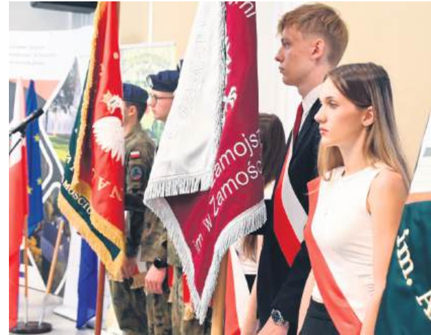
BCU w Zwierzyńcu jest przykładem inwestycji, która realnie wspiera proces kształcenia i przygotowuje uczniów do wejścia na rynek pracy.

W wydarzeniu uczestniczyli m.in. wiceprzewodniczący Sejmiku Województwa Lubelskiego – Krzysztof Gałaszkiwicz,