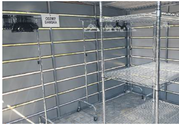
PGKiM we współpracy z władzami miasta uruchomiło w Tomaszowie Lubelskim Punkt Obrótu Dobrymi Ubraniem.

Nasze miasto wraz z Przedsiębiorstwem Gospodarki Komunalnej i Mieszkaniowej od początku reformy systemu gospodarki odpadami, czyli od 1 lipca 2013 roku, stworzyło taką możliwość, że mieszkańcy mogli przywozić tekstylia do Punktu Selektywnej Zbiórki Odpadów Komunalnych. Spodziewaliśmy się jednak, że z zagospodaro-