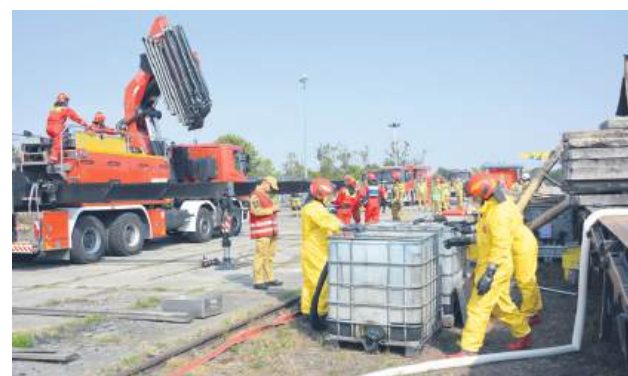
Grupa chemiczna i techniczna.

zaangażowanych było około 70 strażaków i 20 pojazdów pożarniczych (PSP, OSP KSRG