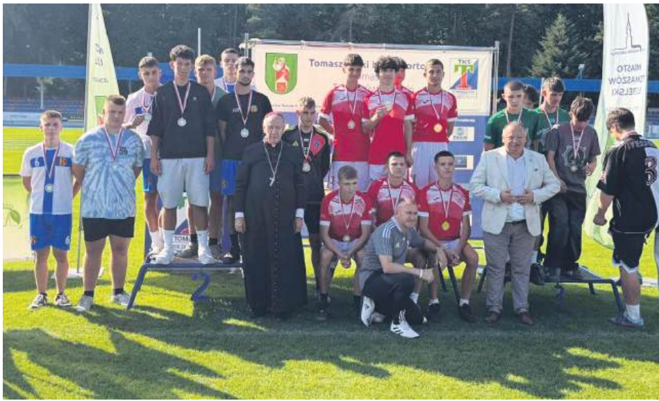
Dekoracja zwycięzców poszczególnych konkurencji na Diecezjalnym Dniu Sportu w Tomaszowie Lubelskim.

10 września, w zorganizowanym po raz siódmy Diecezjalnym Dniu Sportu, wzięły udział łącznie z opiekunami aż 634 osoby z 25 szkół i parafii: SP Babice, par. Białopole, par. Dub, par. Dubienka, par. Górecko Kościelne, par. Krasnobród Sanktuarium, par. Łabunie, SP Majdan Górny, par. Majdan Stary, par. Moniatycze, par. Rachanie, SP Stefankowice, SP Little Oxford z Tomaszowa Lubelskiego, Tomaszów