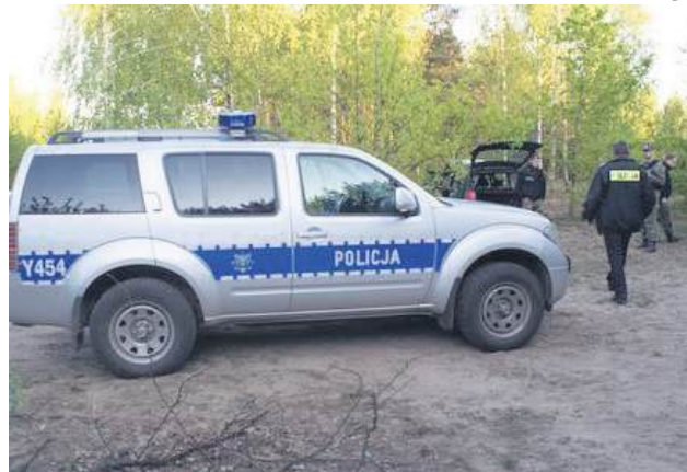
41-latek z gminy Horodło odnaleziono w lesie na terenie powiatu chełmskiego. Mężczyzna siedział w swoim aucie. Miał ponad 1 promil alkoholu w wydychanym powietrzu.

41-latek z gminy Horodło oznajmił swojej siostrze, że zamierza popełnić samobójstwo, po czym wsiadł do samochodu i odjechał w nieznanym kierunku. Nie można było się do niego dodzwonić, ponieważ wyłączył telefon. Siostra zawiadomiła policję. Wszyscy policjanci z komendy rozpoczęli poszukiwania.