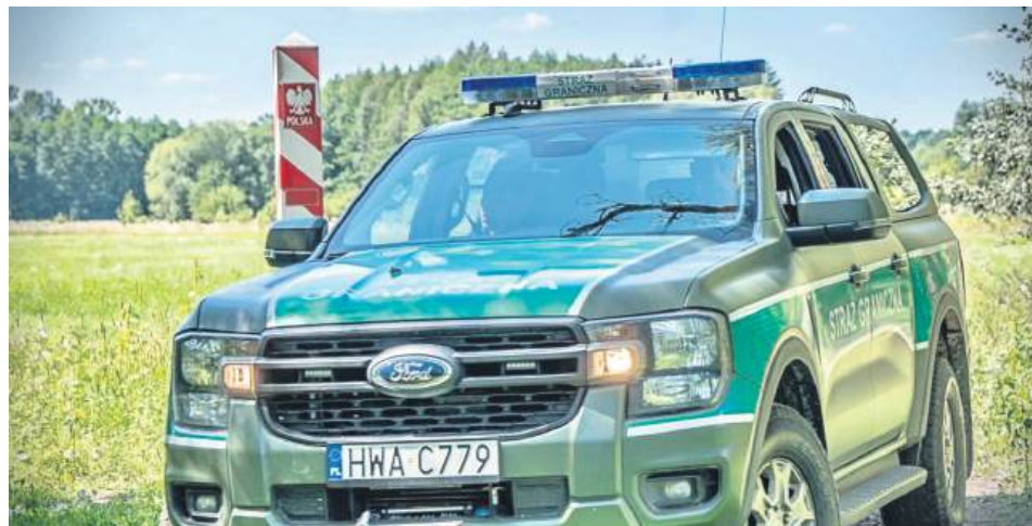
Ukraińiec dopuścił się wielu włamań i kradzieży, odsiedział wyrok w więzieniu w Hrubieszowie, a po wyjściu z zakładu karnego został deportowany na Ukrainę.