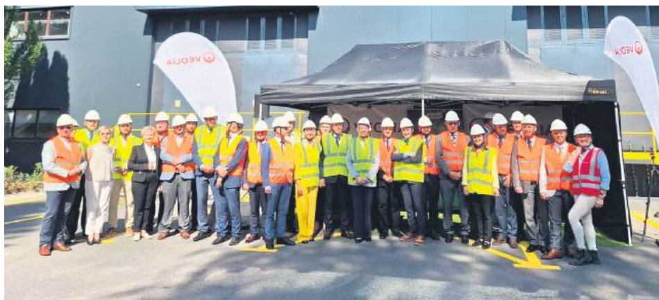
Projekt Rubin zainaugurowano 10 września.

Kilka lat temu Veolia planowała w Zamościu budowę