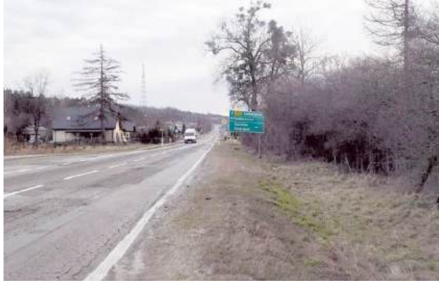
Stan drogi stwarza zagrożenie dla kierowców.