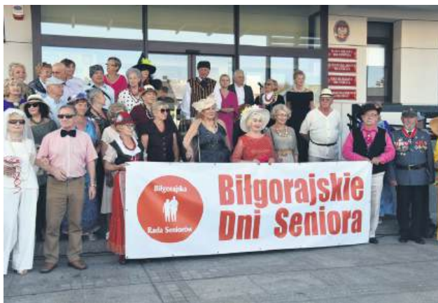
Wydarzenie zorganizowano po raz trzeci.