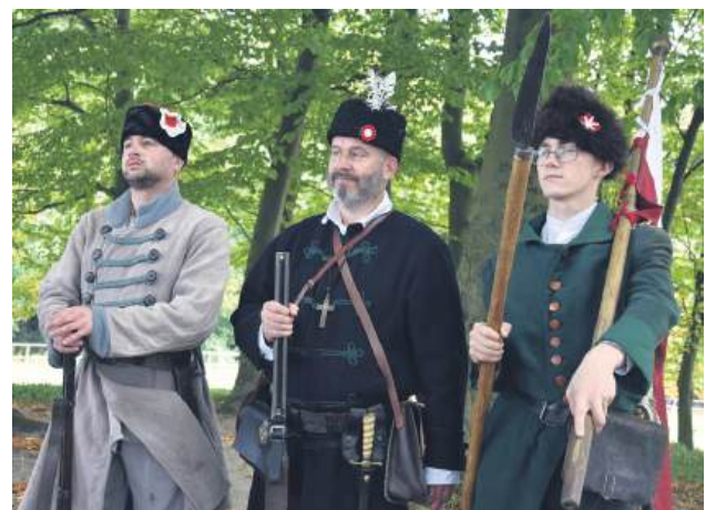
Tradycyjnie w obchodach brała udział Biłgorajska Grupa Rekonstrukcji Historycznej Powstania Styczniowego .

Organizatorami rajdu byli: PTTK Oddział Biłgoraj , Gmina