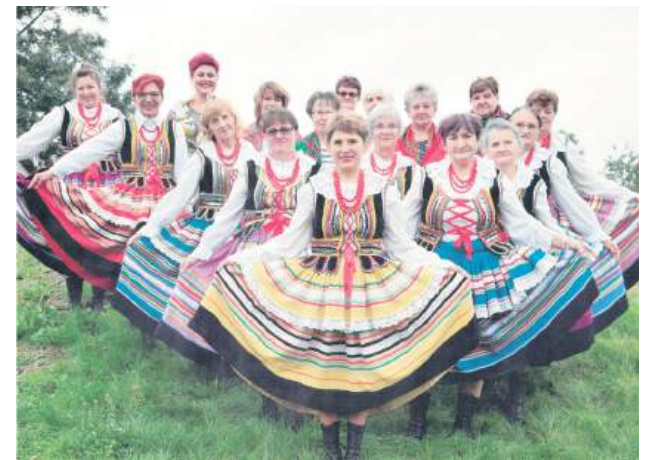
KGW w Horyszowie Polskim słynie z pięknych strojów ludowych, które pierwotnie służyły zespołowi Jutrzenka.