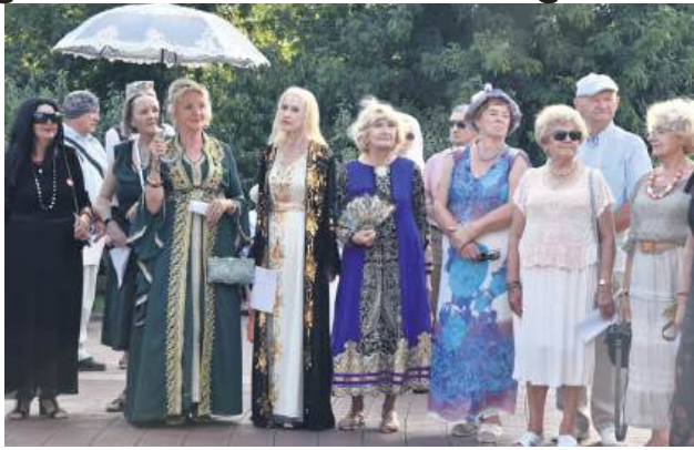
Seniorzy wzięli udział w narodowym czytaniu.

Od 5 do 7 września w Biłgoraju odbywały się III Biłgorajskie Dni Seniora. Było to trzydniowe wydarzenie przygotowane z myślą o seniorach, lecz otwarte dla wszystkich mieszkańców Biłgoraja i okolic.