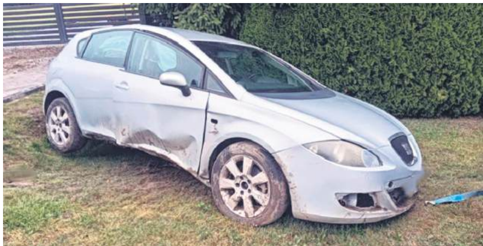
Kierujący miał prawo jazdy pół roku i już je stracił.