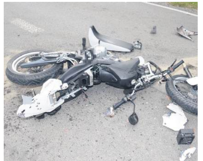
W zderzeniu z samochodem ucierpiał motocyklista.

– W Sitnie rozpoczęła manewr skrętu w lewo na teren parkingu. Skręcając, nie ustąpiła pierwszeństwa przejazdu jadącemu z naprzeciwka motorowerzyście. Kierujący jednoślądem nie zdążył za-