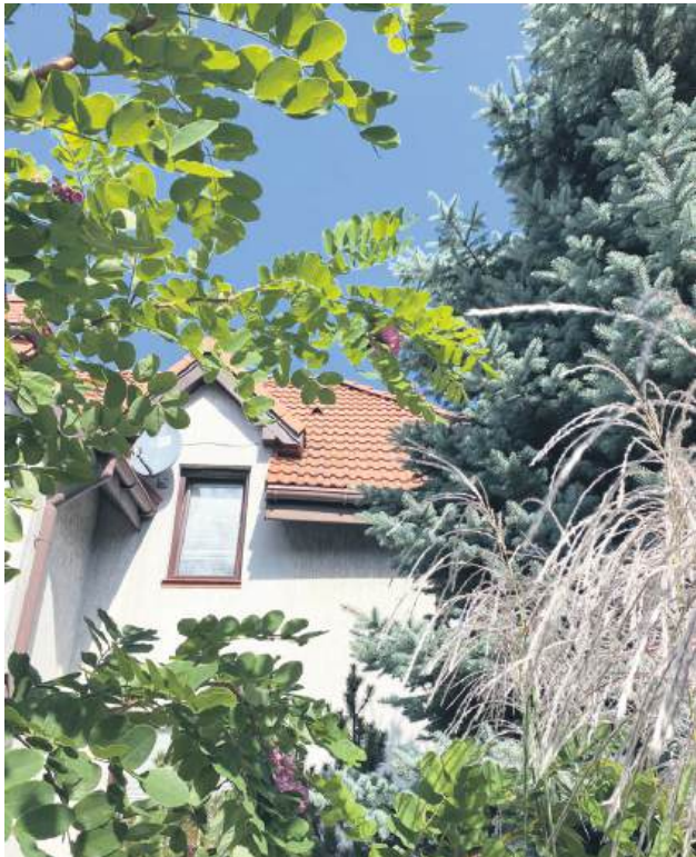
Na os. Powiatowa pszczołom przypadła do gustu akacja.

Te wspaniałe, niemal bajkowe owady odwiedzały naszą posesję od 27 sierpnia do 6 września, posilając się na kwitnącej robinii szpeciniastej (to akacja – przyp. red.) – wspomina z ekscytacją Tadeusz Parasiewicz, który mieszka przy dość ruchliwej ulicy na osiedlu Powiatowa w Zamościu.