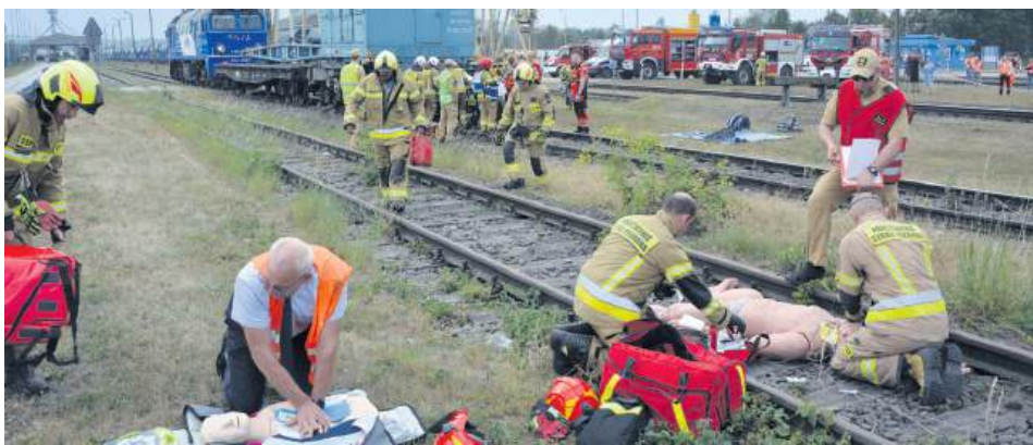
Wypadek z udziałem pociągu.

W pierwszym epizodzie ćwiczebnym, w związku z rozszczelnieniem substancji podczas rozładunku na bocznicę kolejowej, strażacy ze Specjalistycznej