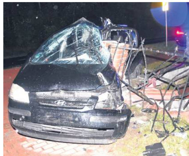
Kobieta została przetransportowana do szpitala.

14 września, po godzinie 12, oficer dyżurny biłgorajskiej komendy policji otrzymał zgłoszenie o zdarzeniu drogowym w Niemirowie. Skierowani na miejsce policjanci wstępnie ustalili, że 19-letnia mieszkanka gminy Frampol, kierując osobowym Hyundaiem, na łuku drogi straciła panowanie nad pojazdem i uderzyła w ogrodzenie posesji.