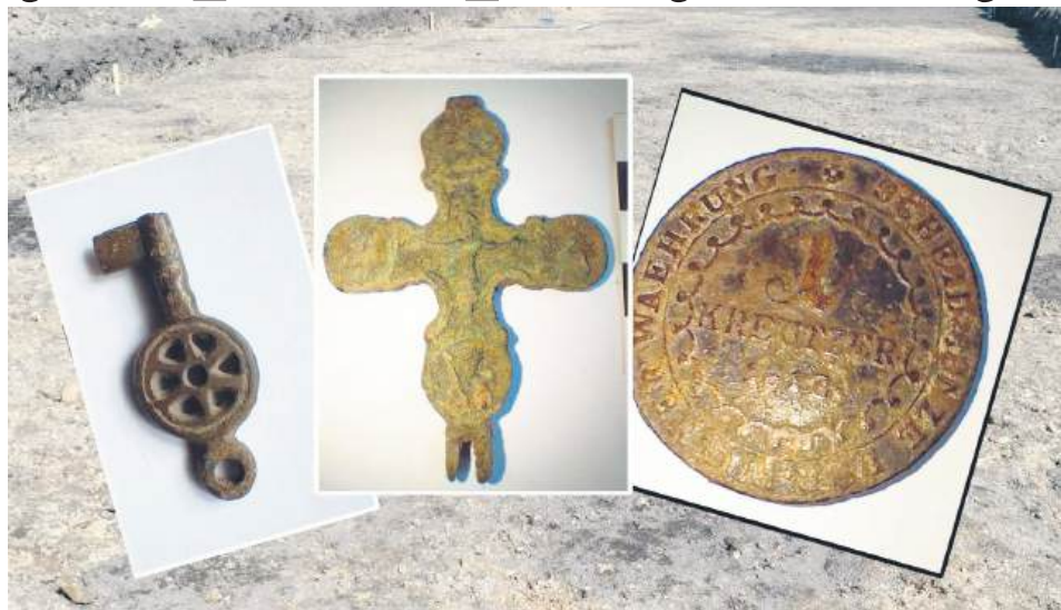
Kluczyk z brązu do szkatułki, enkolpion wczesno-średniowieczny i krajcar z 1812 r.