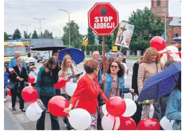
„Przyszłość dzieci w naszych rękach” – to hasło X Marszu dla Życia i Rodziny.

Przypomniał, że Polska się starzeje, a władze „zamiast wspierać rodziny, proponują zastępowanie populacji”. – W tym roku jest to problem edukacji zdrowotnej, która została narzucona rodzicom – powiedział