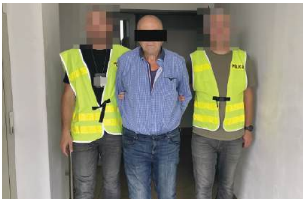
Za popełnione czyny mężczyźni grozi do 8 lat pozbawienia wolności.

mieszkania 72-latkę podczas przeszukania funkcjonariusze ujawnili ponad 50 porcji dilerkich marihuany, prawie 90 kilogramów suszu tytoniowego oraz amunicję. Policjanci zabezpieczyli nielegalny towar.