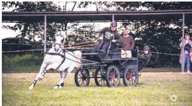
Zawody cieszą się dużą popularnością.

W niedzielę (21 września), o godz. 11, odbędą się zawody zaprzęgowe jednokonne, natomiast o godz. 12.30 planowane jest rozpoczęcie zawodów zaprzęgowych parokonnnych. Około godz. 13.30 można spodziewać się pokazu kadryla w wykonaniu Damskiej Sekcji Szwadronu Ka-