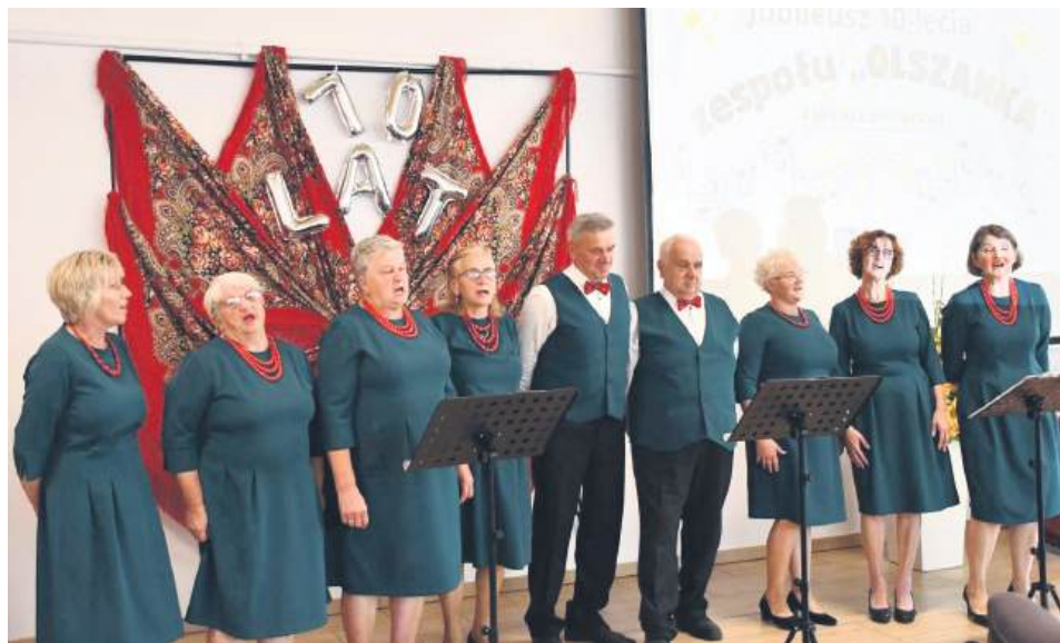
Zespół Olszanka zaśpiewał dla swoich gości.

Grupę utworzono na bazie miejscowego zespołu śpiewaczego istniejącego od 2008 r., który swymi występami uświetniał