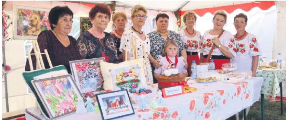
Przez kilka godzin na dożynkowym placu otwarte były stoiska z potrawami regionalnymi oraz rękodziełem.