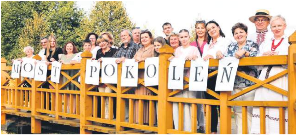
Pierwszym krokiem nowego zarządu jest projekt „Most Pokoleń TMZ”.

Za dwa lata Towarzystwo Miłośników Zwierzynca obchodzić będzie 50-lecie działalności. Działacze liczą na aktywny udział mieszkańców zarówno w działaniach na rzecz lokalnego dziedzictwa, jak i w przygotowaniach do jubileuszu.