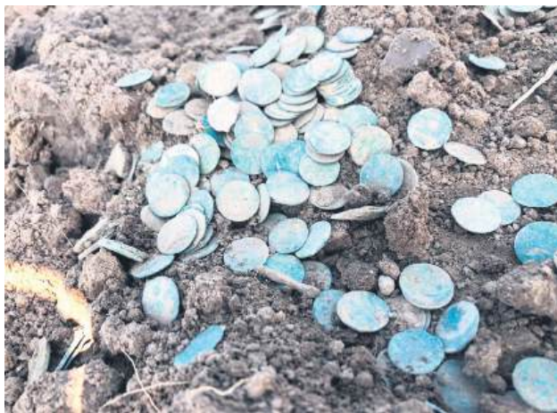
Skarb ze Świerszczowa waży około 4,7 kg i liczy od 4,5 do 5 tysięcy monet.

Odkrycia dokonał Grzegorz Panek , który natrafił na ogromną ilość monet rozciągnię-