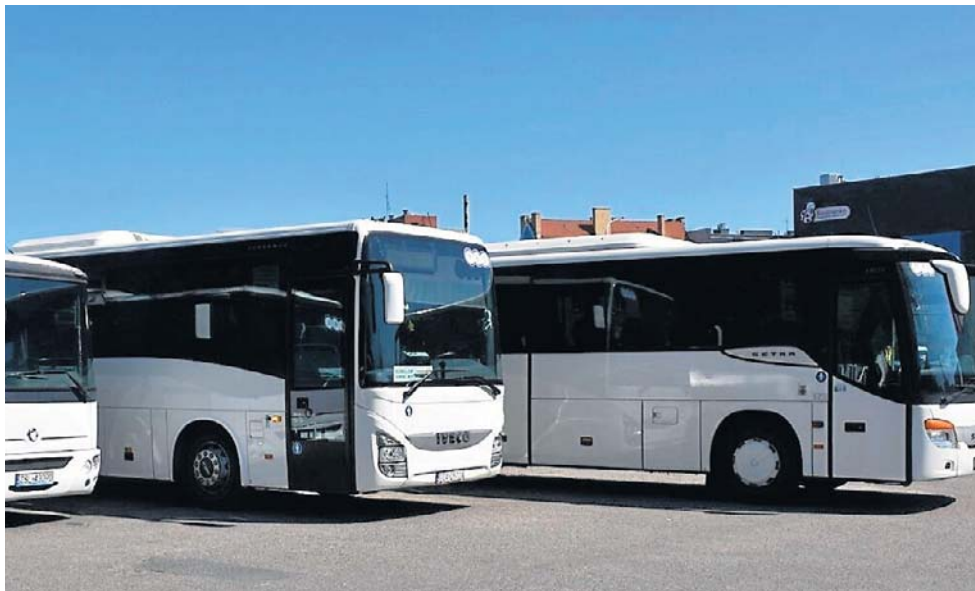
Nowe trasy będą obsługiwać autobusy należące do PKS Koszalin i lokalnych przewoźników

Wniosek do wojewody złożył powiat koszaliński - zrobił to w imieniu pięciu gmin, które podpisały z nim umowę (te gminy to Będzino, Biesiekierz, Manowo, Świeszyno i Sianów). Zgodnie z założeniami pierwsza nowa linia miała zostać uruchomiona w czerwcu tego roku, pozostałe 36 we wrześniu.