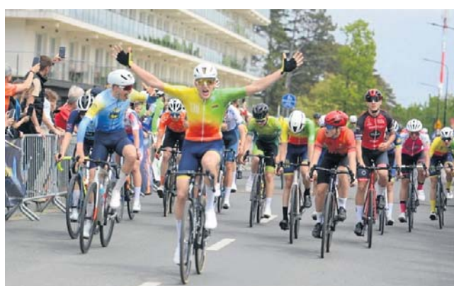
Wyścigi ze startu wspólnego kończyły się w Jarosławcu. KK Ziemia Darłowska wygrała klasyfikację klubową