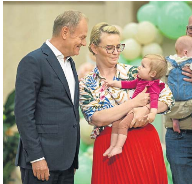
Donald Tusk na spotkaniu z okazji drugiej rocznicy przywrócenia rządowego programu in vitro

- Żeby były bezpieczne, żeby rodzice mieli poczucie