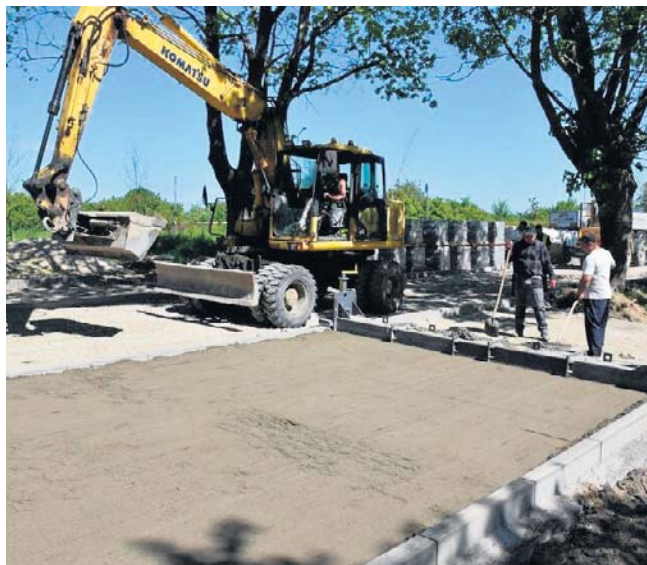
Prace przy budowie parkingu obok przystanku kolejowego Koszalin Wschodni (przy ul. Na Skwierzynkę).

Zakończenie prac planowane jest do końca czerwca tego roku.