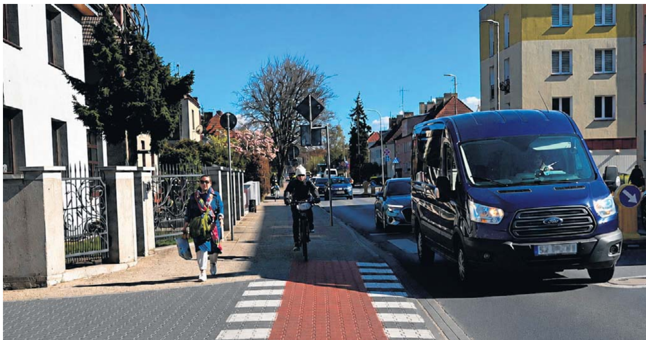
Łączna długość ścieżek rowerowych w Koszalinie wynosi dziś 115,676 km.

Ścieżek ma przybywać. W ramach zadania „Usprawnienie układu dróg rowerowych na terenie miasta Koszalina”, ujętego w Wieloletniej Prognozie Finansowej, planowana jest realizacja sześciu nowych odcinków dróg rowerowych o łącznej długości 8,22 km. Projekt przygotowywany jest do dofinansowania z programu Fundusze Europejskie dla Po-