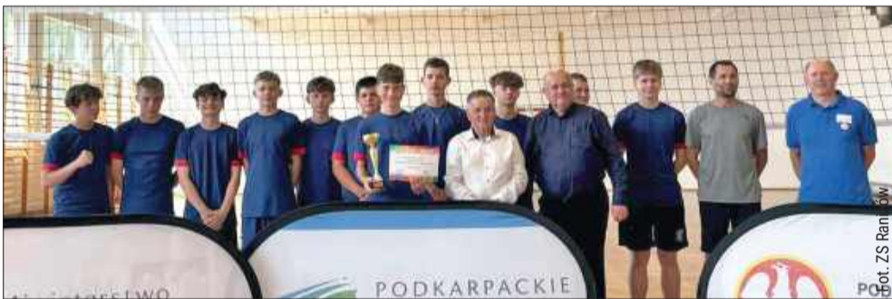
Siatkarze z Raniszowa zajęli czwarte miejsce w województwie,

Dziewiątego czerwca 2026 roku w Szkole Podstawowej im. św. Jana Pawła II w Raniszowie odbył się Finał Wojewódzkiego Igrzysk Młodzieży Szkolnej w siatkówce chłopców. Były to pierwsze zawody tej rangi zorganizowane przez tę placówkę.