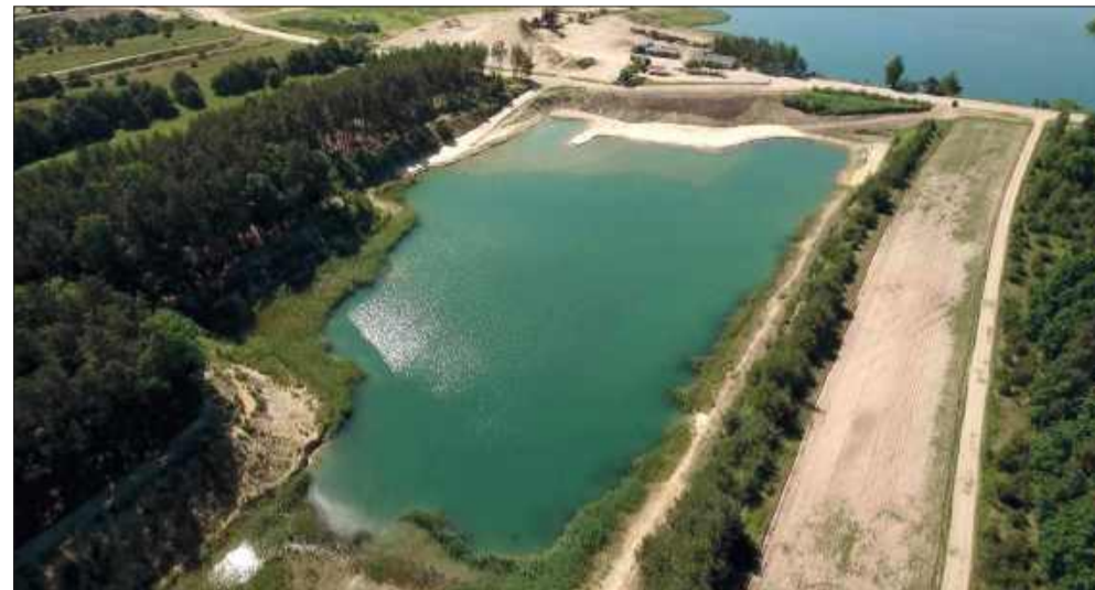
Tak wygląda obiekt z lotu ptaka. Zdjęcie wykonano tuż przed jego otwarciem, w 2023 roku.