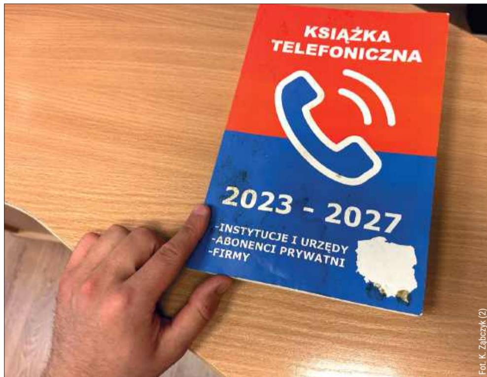
Taką „książkę telefoniczną” przekazała nam jedna z mieszanek.

Nasza Czytelniczka zamówiła książkę za 60 zł. Po jej doręczeniu „kurier” natychmiast