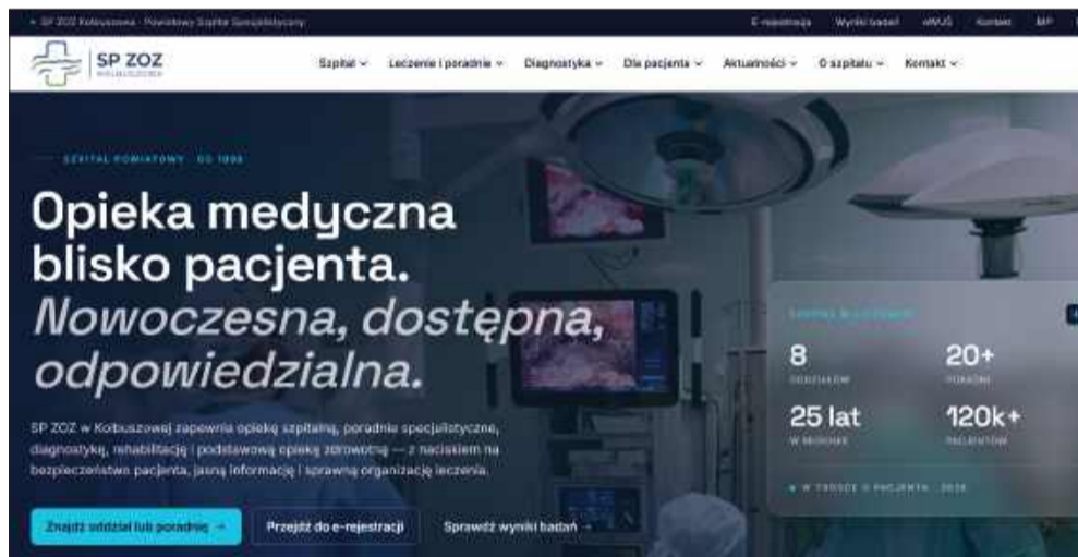
Tak obecnie wygląda strona internetowa kolbuszowskiego SP ZOZ.

online po zalogowaniu kodem otrzymanym przy rejestracji.