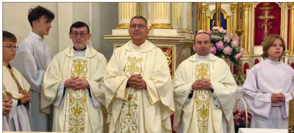
Księża świętowali swoje jubileusze.