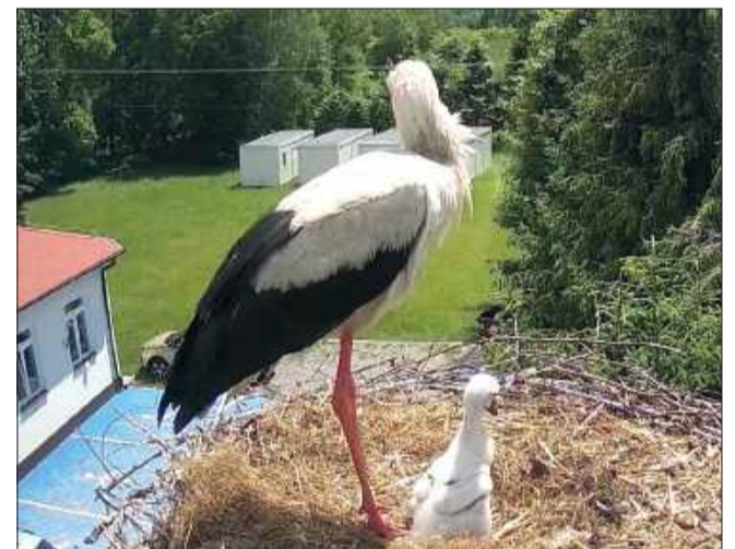
Oczy całego powiatu zwrócone na niezwyklego bocianiego jedynaka.

Ograniczona liczba potomstwa ma jednak swoją dobrą stronę. Jedynak stał się absolutnym oczkiem w głowie swoich rodziców. Oglądając transmisję online, można na własne oczy przekonać się, jak niezwykle pieczołowicie, z pełnym poświęceniem i czułością dorosłe ptaki zajmują się swoim jedynym potomkiem. Na ekranach komputerów i smartfonów zobaczymy m.in. momenty karmienia, osłaniania malucha przed deszczem czy słońcem, a także pierwsze, nieporadne