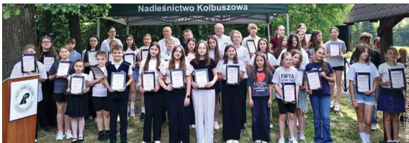
Uczniowie odebrali nagrody za udział w konkursie.

Organizatorzy serdecznie dziękują wszystkim utalentowanym uczestnikom, a także nauczycielom i opiekunom, którzy czuwali nad artystycznym procesem powstawania tych niesamowitych dzieł. Choć ta edycja dobiegła końca, leśnicy już teraz zapraszają do udziału w przyszłym roku. W końcu podkarpacka knieja skrywa w sobie nieskończenie wiele historii, które tylko czekają na przelanie na papier. bp