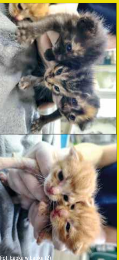
Fot. Łapka w Łapkę (2)

Malenistwa nie są jeszcze do adopcji, mają troszkliną mamusię, która jeszcze chętnie je powychowuje, ale powoli już możecie się psychicznie nastawić na adopcję.