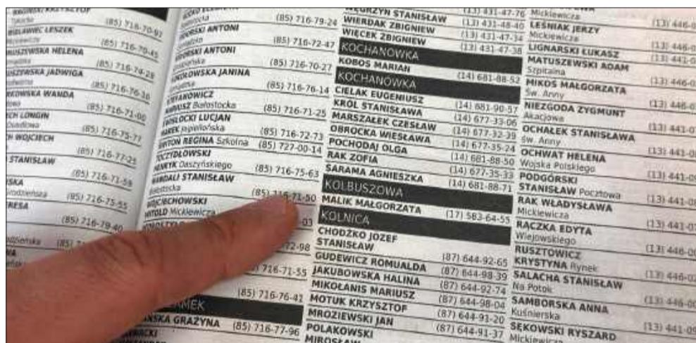
Tak wygląda książka wewnątrz. Z samej Kolbuszowej uwzględniono tylko jeden numer.

odjechał, co wzbudziło jej podejrzenia. Dopiero po otwarciu publikacji okazało się, że spis