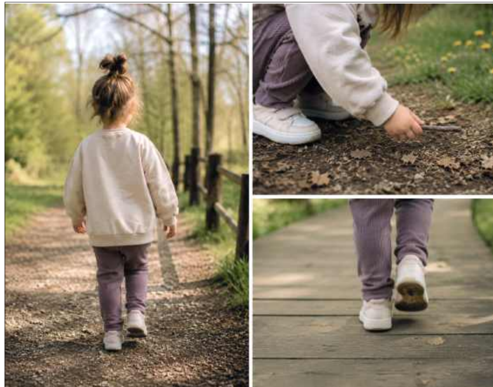
Zwykły spacer może być dla dziecka niezwykle wartościową lekcją.