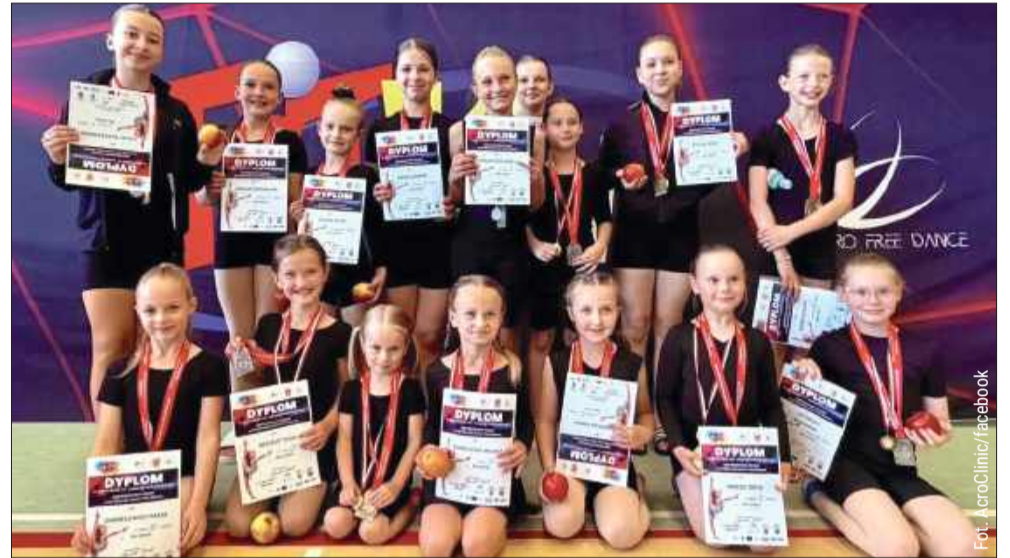
Kolbuszowskie akrobatki polecą na Euro.

To był weekend, który zapisze się w historii lokalnego sportu. Reprezentantki Kolbuszowej i okolic zdominowały Mistrzostwa Polski Fit Kid / Acro Free Dance, które odbyły się w Przemyślu. Dziewczęta z Acro Clinic oraz zawodniczki z regionu dosłownie „rozbili bank” z medalami, meldując się na podium kilkadziesiąt razy. Dla najlepszych z nich to nie koniec tej pięknej przygody – wywalczone awanse oznaczają, że już wkrótce będą reprezentować Polskę na Mistrzostwach Europy we Włoszech!