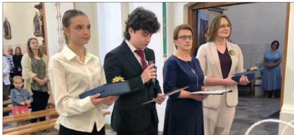
Wybrzmiały słowa wdzięczności.