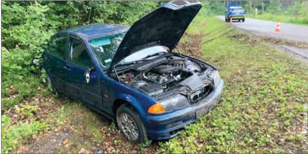
Policjanci pracowali m.in. w Nowej Wsi, gdzie doszło do zdarzenia z udziałem BMW.

Przez jakiś czas ruch na tym wyjątkowo ruchliwym odcinku „krajówki” był wstrzymany, a następnie odbywał się wahadłowo, co błyskawicznie doprowadziło do powstania sporych korków. Obecnie sytuacja na DK9 wraca już do normy, jednak policjanci apelują do kierowców o ostrożność i dostosowanie prędkości do warunków panujących na drodze. bp