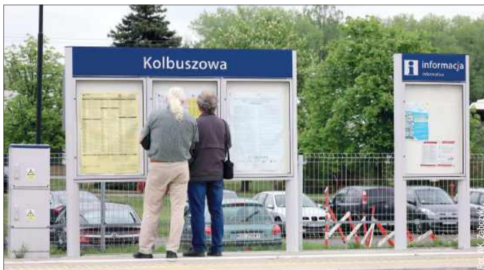
Rząd ogłasza gigantyczny plan na kolej. W planie nowe linie z Mielca do Polańca i Kolbuszowej.

Zachęcamy wszystkich do włączenia się w akcję! Nakrętki można zostawiać w redakcji naszego tygodnika przy ul. Obrońców Pokoju 20 w Kolbuszowej (pierwsze piętro).