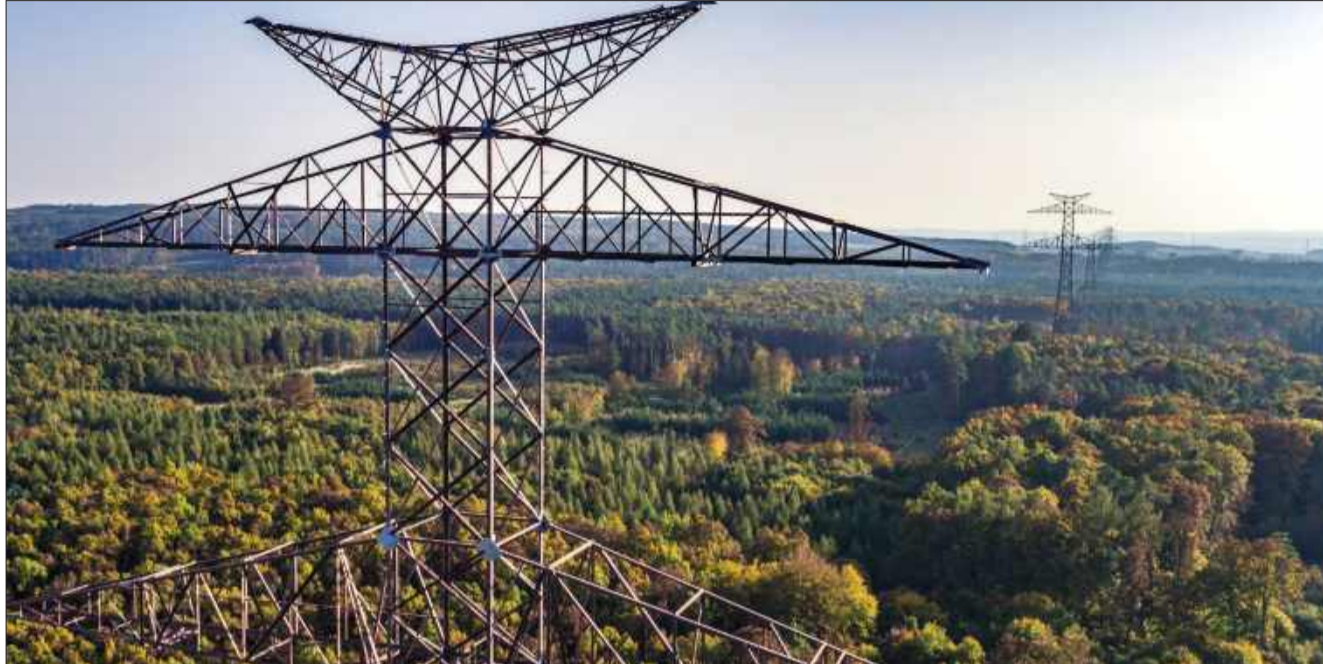
Linia 400 kV przejdzie przez powiat kolbuszowski. Padły pytania o odszkodowania i ograniczenia dla właścicieli.

Konsultacje z mieszkańcami jeszcze będą Linia wysokiego napięcia o napięciu 400 kV łączy Elektrownię Kozienice ze stacją w rejonie Stalowej Woli. Projekt ma strategiczne znaczenie dla stabilności Krajowego Systemu Elektroenergetycznego i umożliwia pewne zasilanie stref przemysłowych, w tym Euro-Park Stalowa Wola. Trasa biegnie m.in. przez teren województwa podkarpackiego, w tym okolice Kolbuszowej, dokładniej przez lasy i tereny pozamiejskie, a jej realizacja odbywa się na podstawie ustawy o przygotowaniu i realizacji strategicznych inwestycji w zakresie sieci przesyłowych. Obecnie trwają