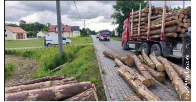
Tak wyglądało miejsce zdarzenia.