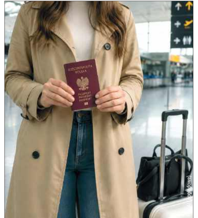
- Planując zagraniczny wyjazd, warto już teraz sprawdzić termin ważności swojego paszportu i w razie potrzeby odpowiednio wcześniej wystąpić o nowy dokument. Im bliżej wakacji, tym więcej będzie wniosków, a co za tym idzie wydłuży się czas oczekiwania - uczuła PUW.