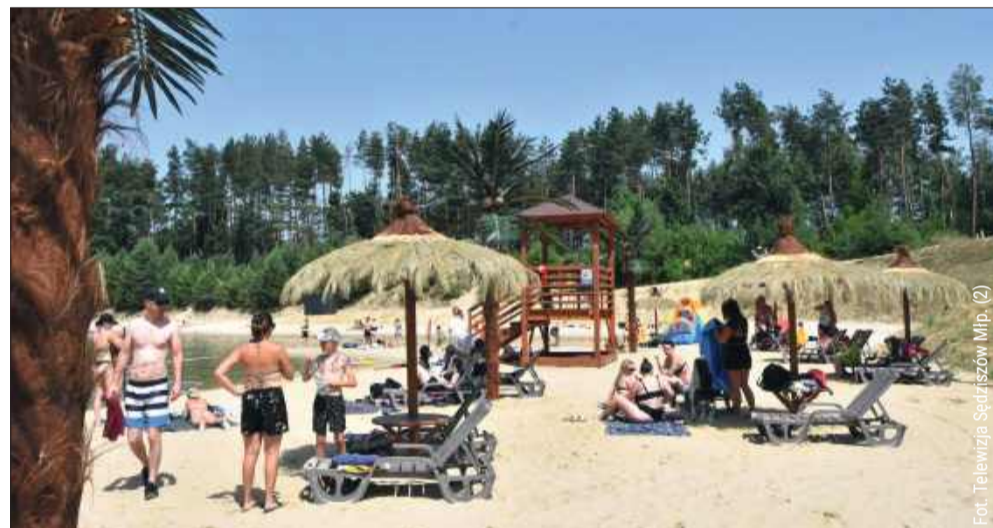
Kąpielisko przyciąga wielu miłośników odpoczynku nad wodą. To idealne miejsce dla osób, które nie lubią tłoku.

trzeba umieszczać wydrukowanego biletu w samochodzie – ważne jest jego zachowanie na wypadek wyjaśnień. Opłata dzienna oznacza, że w ramach jednej opłaty można wielokrotnie wjeżdżać i wyjeżdżać