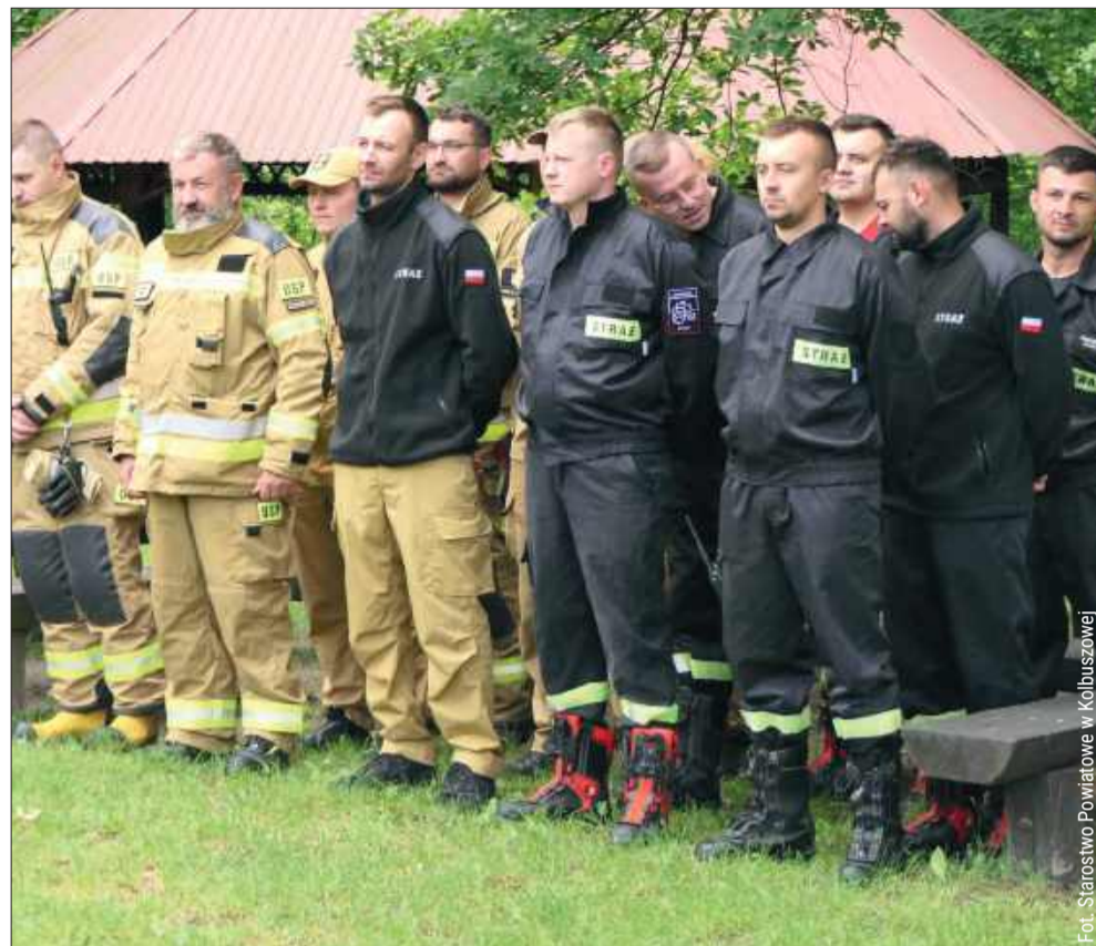
Na terenie powiatu przeprowadzono szeroko zakrojone ćwiczenia z zakresu ochrony ludności i obrony cywilnej pod kryptonimem „KOLBUSZOWA 2026”.

fundament bezpieczeństwa nas wszystkich. Jak podkreślają organizatorzy, głównym celem ćwiczeń było utrwalenie procedur współdziałania pomiędzy gminnymi centrami zarządza-