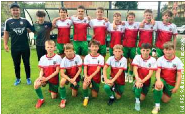
Młodziki Kolbuszowianki awansowali do 1. Ligi

Zespół z Kolbuszowej po jedenastu spotkaniach miał komplet punktów. Zgodnie z regulaminem, prawo startu w wyższej