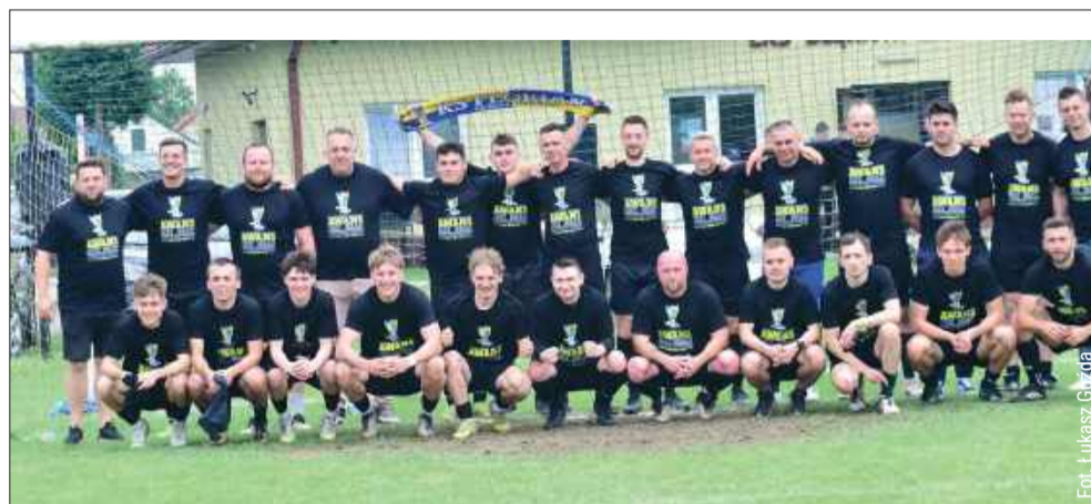
Florian Ostrowy Tuszowskie po raz pierwszy w historii awansował do klasy okręgowej

Zakończyły się zmagania w trójboju lekkoatletycznym w ramach Igrzysk Dzieci. Reprezentantki Szkoły Podstawowej nr 1 w Kolbuszowej zajęły dziesiąte miejsce w finałowym etapie wojewódzkim, który zorganizowano w Strzyżowie.