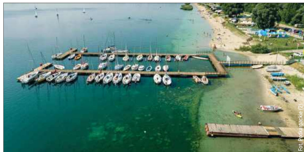
Jezioro Tarnobrzekskie nazywane jest „Podkarpackimi Malediwami”.

Dojazd i parkowanie – dojazd samochodem z Rzeszowa w 75 minut, z Kolbuszowej – 45 minut, opłatyienne i abonamenty zapewniają wygodny dostęp bez stresu.