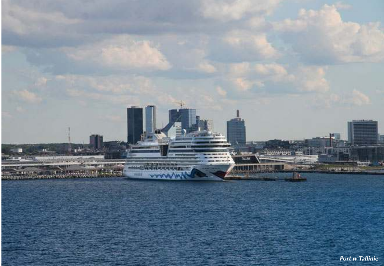
Port w Tallinie