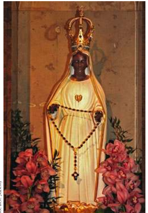
fol. arch. „Izbiemy”