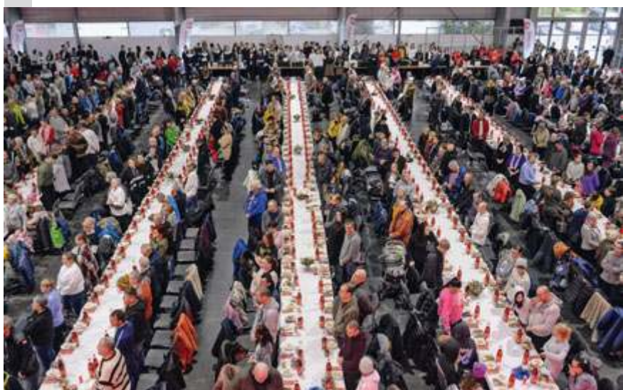
fol. materiały prasowe

rusów, pojawiło się ponad 7,5 tony karpia i 28 tys. litrów barszczu czerwonego. To największe tego typu wydarzenie świąteczne w kraju, możliwe dzięki darczyńcom i partnerom biznesowym.