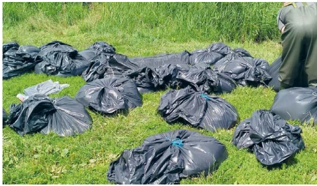
Ze zbiornika Stańków wyłowiono ok. 3,5 tony martwych ryb. Specjaliści szacują jednak, że skala zniszczeń była prawie dwukrotnie większa

skiego oraz mieszkańiec gminy Chełm, w sprawie katastrofy ekologicznej na rzece Uherce i zbiorniku wodnym Stańków, która miała miejsce w lipcu 2025 roku, a której skutki do dziś nie zostały w pełni rozliczone. W wyniku zrztu silnie zanieczyszczonych ścieków rzeką płynął czarny, cuchnący szlam, prowadząc w krótkim czasie do