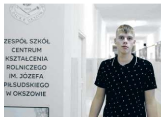
ZESPÓŁ SZKÓŁ CENTRUM KSZTAŁCENIA ROLNICZEGO IM. JÓZEFA PIŁSUDSKIEGO W OKSZWIE

„Liczymy, że filmy o wsi zachęcą potencjalnych beneficjentów do korzystania ze wsparcia oraz potwierdzą pozytywny wpływ członkostwa Polski w Unii Europejskiej dla rozwoju wsi. Dzięki tej inicjatywie chcemy wpłynąć na ożywienie życia społecznego i gospodarczego na obszarach wiejskich, poprawiając tym samym jego