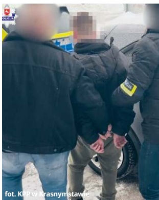
fol. KMP w Krasnymstawie

Młody wiek nie uchronił go przed surowymi konsekwencjami. 17-letni mieszkaniec regionu trafił do tymczasowego aresztu po tym, jak brutalnie napadał na 15-latków. Agresor nie tylko okradał swoje ofiary, ale również stosował wobec nich przemoc fizyczną. Dzięki sprawnej akcji krasnostawskich kryminalnych nikomu już nie zagraża.