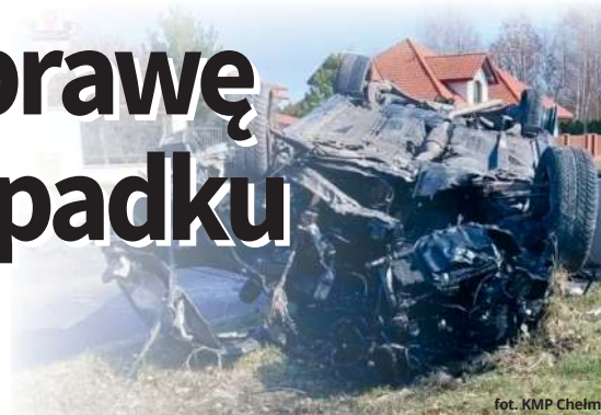
fol. KMP Chełm

Rozpoczął się proces 20-latka oskarżonego o spowodowanie śmiertelnej katastrofy drogowej. Młody kierowca był pod wpływem alkoholu i wioził w samochodzie 9 osób. Zginęło dwóch 18-latków.