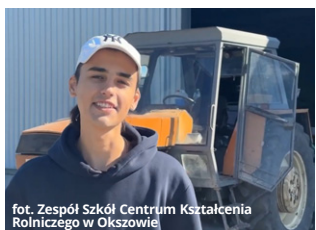
fot. Zespół Szkół Centrum Kształcenia Rolniczego w Okszwie

● GM. CHEŁM Znane są już wyniki piątej edycji niezwykłego, filmowego konkursu „Świat się kręci wokół wsi”. Miejsca drugie i dziewiąte w rywalizacji, którą proponuje Ministerstwo Rolnictwa i Rozwoju Wsi, zajęli uczniowie klasy IV Technikum Mechanizacji Rolnictwa i Agrotechniki w Zespole Szkół Centrum Kształcenia Rolniczego w Okszwie.