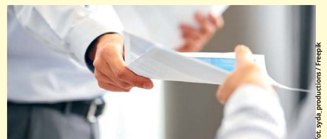
Starosta zapewnia, że do zwolnienia wytypowane zostały przede wszystkim osoby, które mogą nabyć świadczenia emerytalne i rentowe oraz ci, którzy nie spełniają oczekiwań jako pracownicy

„Rozwiązania umów nie dotyczyły pracowników w wieku przedemerytalnym, w okresie ciąży lub urlopu macierzyńskiego oraz pracowników na stanowiskach kierowniczych.