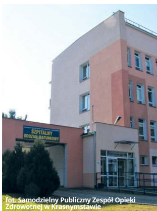
Nowoczesny SOR – lepsza organizacja i bezpieczeństwo

Nowoczesny Szpitalny Oddział Ratunkowy oraz zmodernizowane pracownie diagnostyczne to realna poprawa jakości opieki medycznej w szpitalu w Krasnymstawie. Zakończona w grudniu 2025 roku inwestycja w SPZOZ oznacza szybszą diagnostykę, większe bezpieczeństwo pacjentów i lepsze warunki pracy personelu.