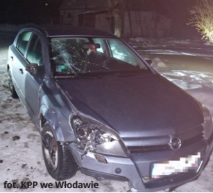
fol. KPP we Włodawie

Tragiczna śmierć 54-letniego rowerzysty na drodze w gminie Hańsk. Mężczyzna został potrącony przez sanochód osobowy w miejscowości Kulczyn-Kolonia. Kierowca nie udzielił mu pomocy i odjechał z miejsca zdarzenia. Policja szybko zatrzymała dwóch pijanych mężczyzn, którzy mogą mieć związek z tym wypadkiem.