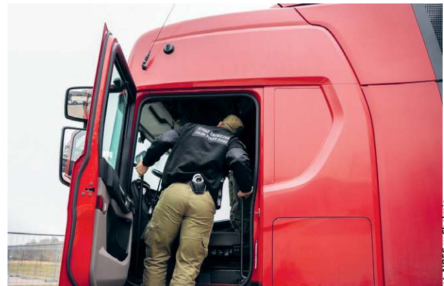
fol. NOSP w Chełmie

Prowadzenie pojazdu mechanicznego w stanie nietrzeźwości jest przestępstwem, za które grozi wysoka grzywna, a nawet kara pozbawienia wolności do lat 3. W przypadku kierowców zawodowych wiąże się to również z bezpowrotną utratą uprawnień do wykonywania zawodu. (apm)