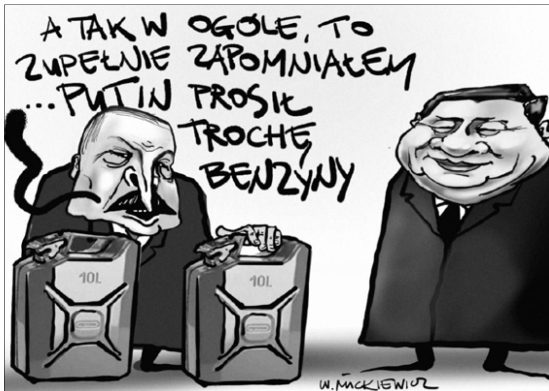
■ Rys. Władysław Mickiewicz