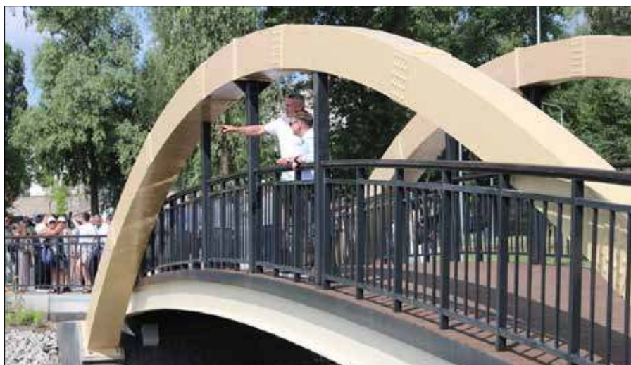
Merowie Wilna i Kijowa podczas otwarcia Skweru Wileńskiego