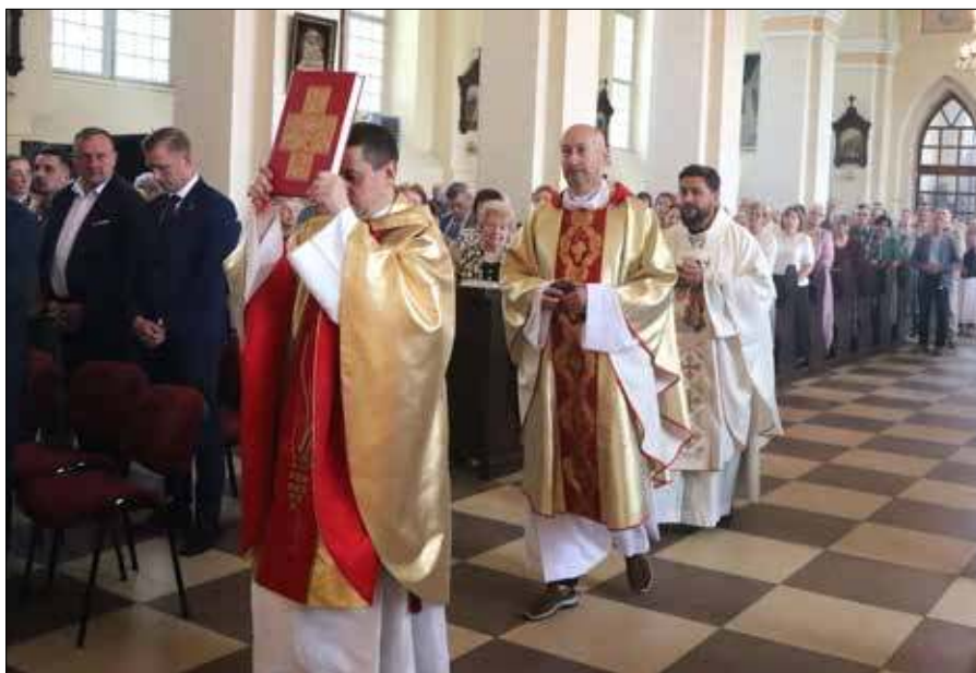
Święto rozpoczęło się uroczystą Mszą św. w Kościele pw. św. Jana Chrzciciela w Ławaryszkach

Podczas koncertu uhonorowano Janów i Janiny. Solenizantów zaproszono na scenę, gdzie z rąk