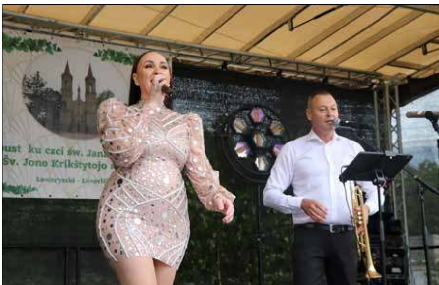
■ W Centrum Kultury w Ławaryszkach odbył się świąteczny koncert