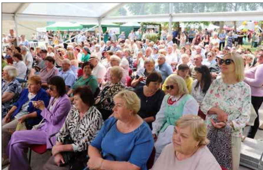
■ Organizatorzy zaprosili mieszkańców i gości do wspólnego świętowania w atmosferze muzyki, tradycji i radości