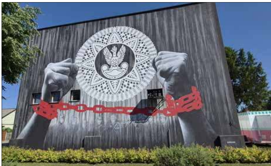
■ Mural poświęcony żołnierzom AK w centrum Myszynca