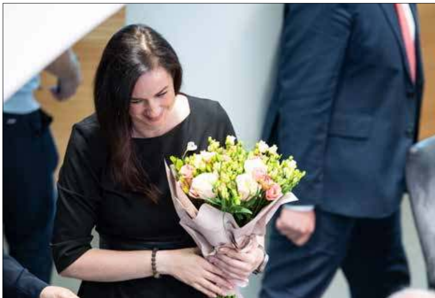
Nowym ministrem opieki społecznej i pracy ma zostać była premier Inga Ruginienė