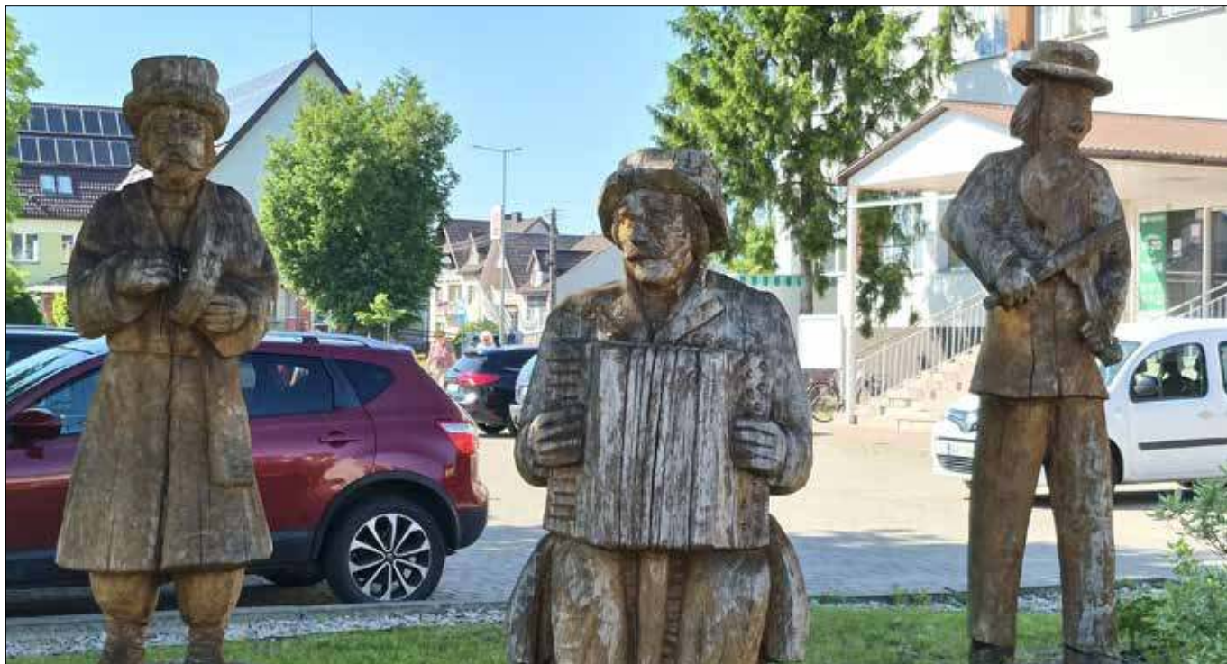
Figury muzykantów kurpiowskich w centrum Myszynca