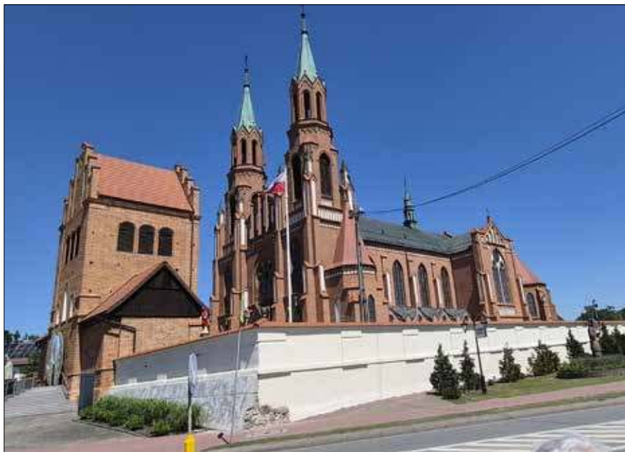
■ Nad Myszyńcem góruje Bazylika Trójcy Przenajświętszej