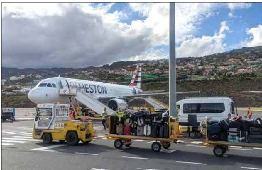
Samolot to najszybszy sposób podróżowania, ale także jeden z najbardziej emisyjnych środków transportu pasażerskiego

Jak podkreśla, rozwój połączeń kolejowych sprawia, że podróże pociągiem stają się coraz wygod-