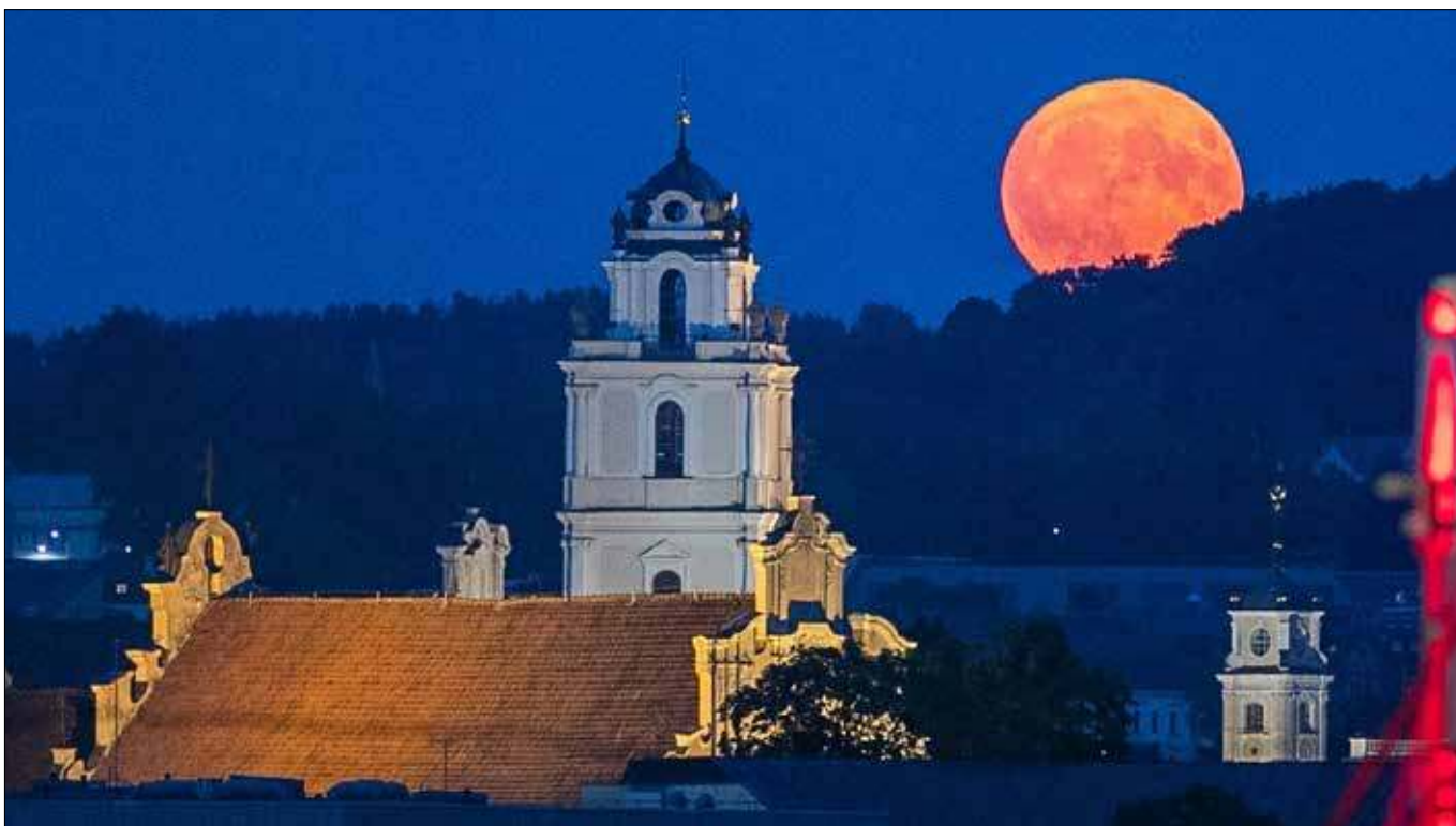
Truskawkowy księżyc nad Wilnem