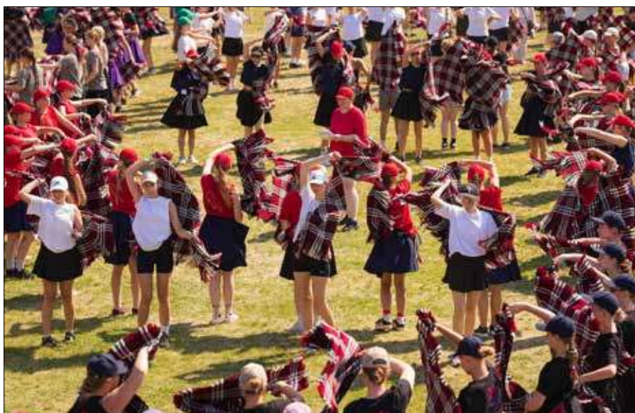
■ Święto Pieśni Uczniów zgromadzi 24 tysiące uczestników