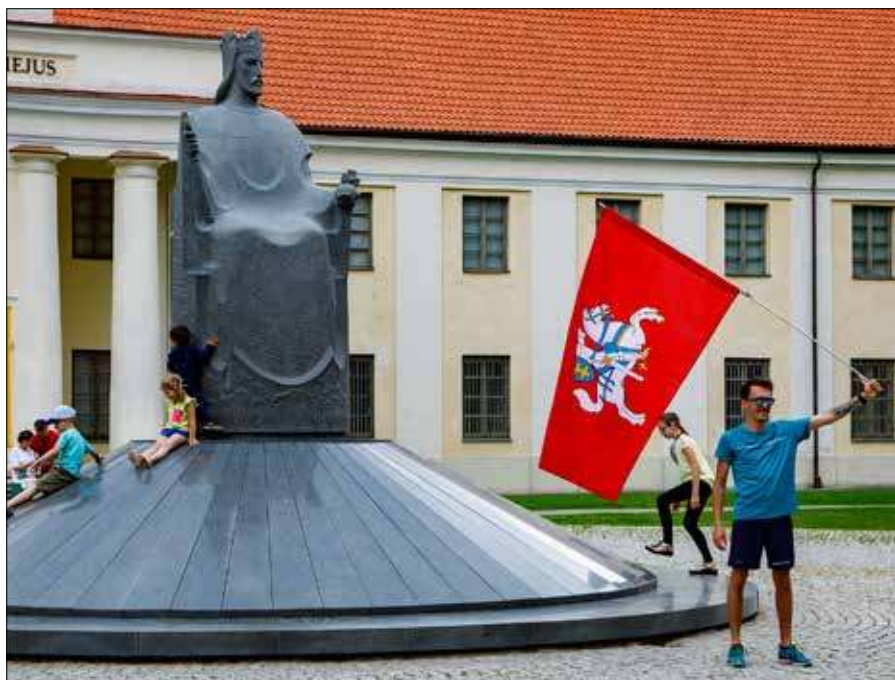
■ Mendog przyjął chrzest w 1251 r., a koronował się dwa lata później