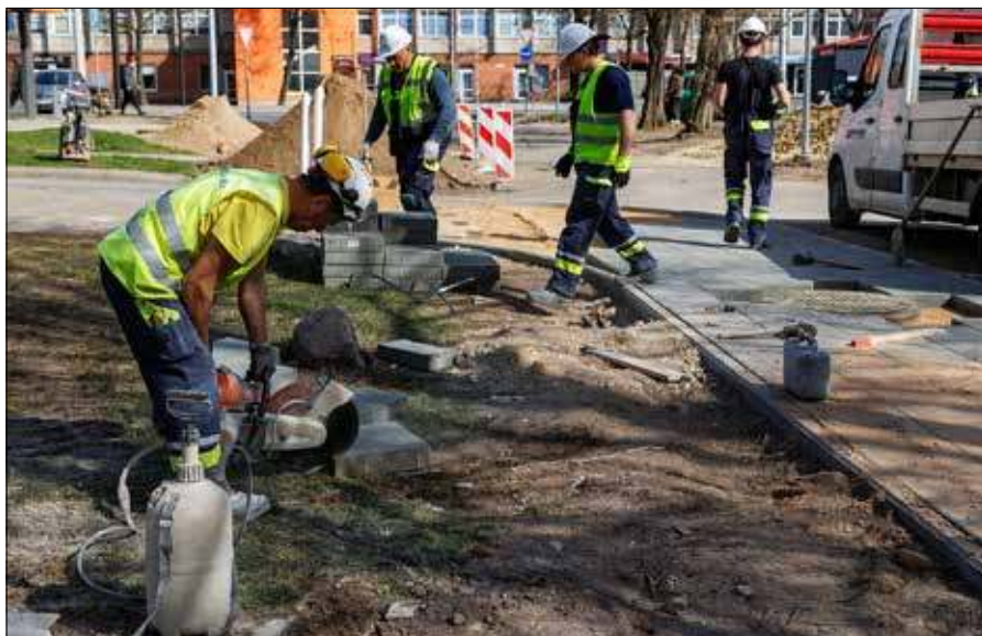
W II filarze środki na przyszłą emeryturę nadal gromadzi około 860 tys. osób

Podobne obserwacje ma także Sodra. Jak zauważyła jej przedsta-