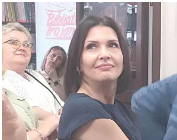
W czwartek, 11 czerwca, w Gminnej Bibliotece Publicznej w Trojanowie odbyło się spotkanie autorskie poświęcone pierwszej książce o gminie Trojanów. Przybyli autorzy, zaproszeni goście oraz pasjonaci lokalnej historii z terenu całego powiatu garwolińskiego

w tym miejscu i w takim położeniu. Jednocześnie chciałem podzielić się tym, co teraz nam się udało przez te dwa lata w trakcie tej kadencji zrealizować.