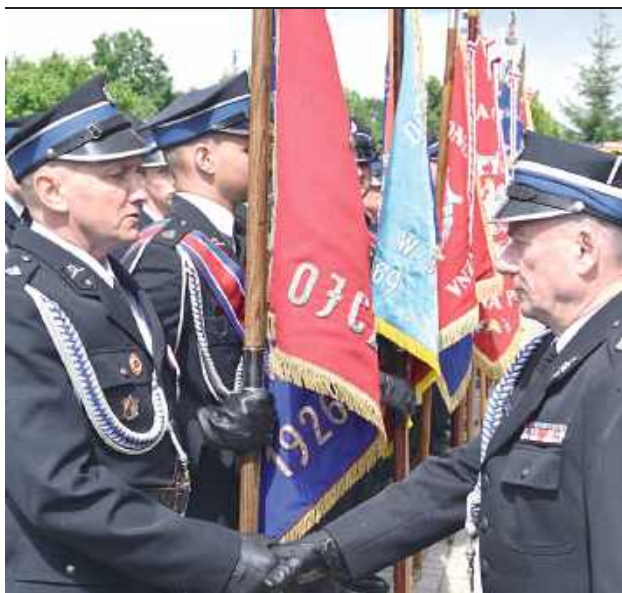
Zasłużonym strażakom wręczono okolicznościowe odznaczenia