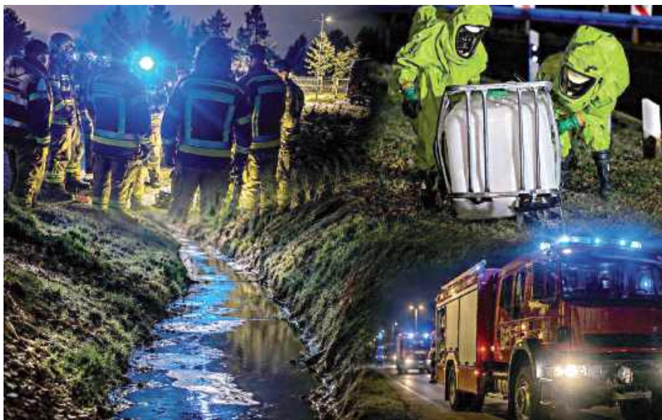
Ostateczne odpowiedzi mają przynieść badania i ustalenia Wojewódzkiego Inspektoratu Ochrony Środowiska

Jak wynika z raportu, po zmianach przepisów oraz uruchomieniu rządowego systemu wsparcia dla samorządów zmagających się z nielegalnymi składowiskami, Garwolin dwukrotnie skła-