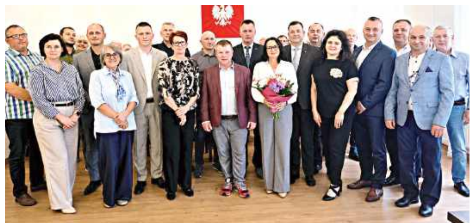
Decyzję podjęli radni podczas XXX sesji Rady Miejskiej w Żelechowie

ny, szkół, przedszkola, Miejsko-Gminnego Ośrodka Kultury, Miejsko-Gminnego Ośrodka Pomocy Społecznej, sołtysów oraz wszystkich osób aktywnie uczestniczących w życiu lokalnej społeczności.