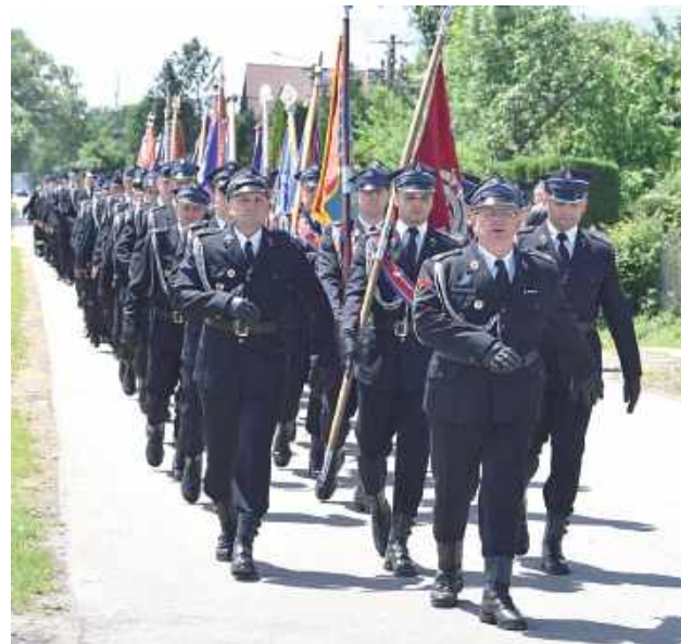
Główną część obchodów zakończyła defilada pododdziałów