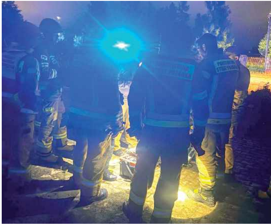
W piątkowy wieczór, 5 czerwca w rowie melioracyjnym przy ul. Stacyjnej w Garwolinie stwierdzono obecność substancji chemicznej

- Dziś wieczorem w rowie melioracyjnym na ulicy Stacyjnej stwierdzono obecność substancji chemicznej - przekazała w mediach społecznościowych. Jak poinformowała, na miejscu pracowała policja, straż pożarna oraz specjalistyczna grupa ratownictwa chemicznego z Warszawy. Teren został za-