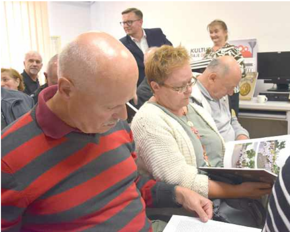
Do Trojanowa przybyli lokalni pasjonaci historii, dyrektorzy szkół i przedszkola, czytelnicy biblioteki oraz goście z bliższej i dalszej okolicy

- Mielśmy taki pomysł, aby ta książka była o każdym z nas, o wszystkich miejscowościach, o ważnych wydarzeniach, które gdzieś historycznie przyczyniły się, że ta gmina Trojanów jest