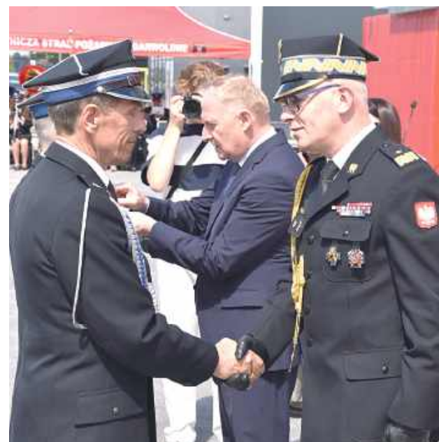
W czasie obchodów Dnia Strażaka druhowie otrzymali odznaczenia państwowe i resortowe, a także awanse na wyższe stopnie służbowe

W piątek, 12 czerwca odbyły się obchody Dnia Strażaka w powiecie garwolińskim połączone z poświęceniem Komendy Powiatowej Państwowej Straży Pożarnej w Garwolinie.