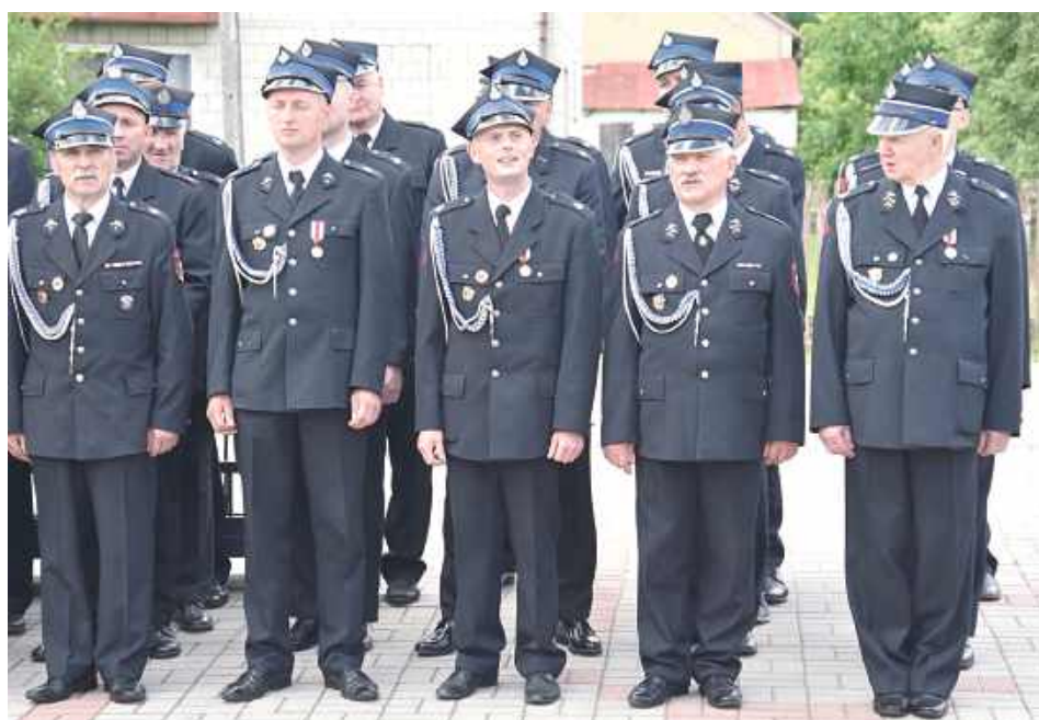
Jubileusz rozpoczął się o godzinie 12.30 zbiórką pododdziałów przy Domu Strażaka

W niedzielę, 14 czerwca w Zwoli odbyły się uroczystości 100-lecia miejscowej Ochotniczej Straży Pożarnej.