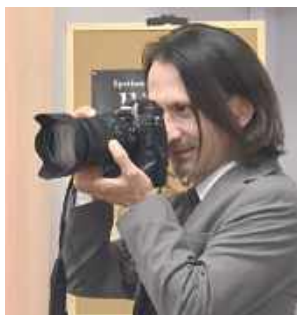
Praca wydana pod redakcją Przemysława Piątkowskiego, współpracownika PAP, przedstawia rys historyczny gminy i poszczególnych sołectw, charakteryzuje każdą z dzisiejszych wsi, ukazuje historię parafii w Korytnicy Łaskarzewskiej i Życzynie, dzieje szkolnictwa na terenie gminy oraz walory przyrodnicze i turystyczne tego miejsca