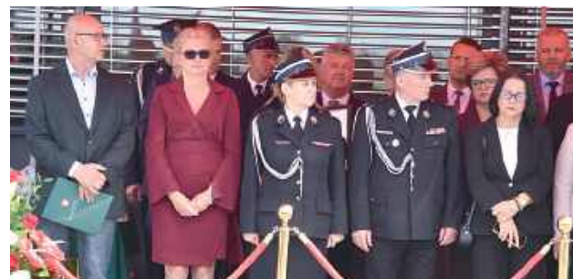
W uroczystości udział wzięli przedstawiciele władzy samorządowej z terenu powiatu garwolińskiego, komendanci z jednostek ościennych, komendanci emerytowani komendy Garwolin oraz delegaci firm realizujących kontrakt budowlany