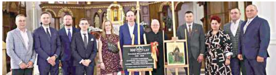
Podczas wydarzenia wielokrotnie podkreślano, że za sukcesem marki SM Ryki stoją przede wszystkim ludzie – rolnicy, pracownicy i partnerzy biznesowi, którzy przez dekady budowali pozycję firmy

– Sto lat Spółdzielni Mleczarskiej Ryki to historia tysięcy ludzi i milionów godzin ciężkiej pracy.