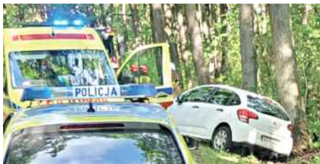
19-letnia kobieta ratowała się, zjeżdżając do rowu

Chwile grozy w Sławinach. Młoda kierująca próbowała uniknąć zderzenia z pojazdem jadącym z naprzeciwka. Zjechała na pobocze, straciła panowanie nad autem i uderzyła w drzewo.