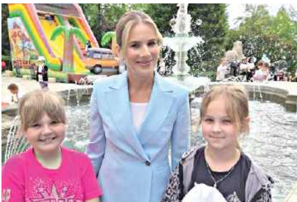
Na zaproszenie Pierwszej Damy Marty Nawrockiej dzieci uczestniczyły w wyjątkowych obchodach zorganizowanych w Ogrodach Pałacu Prezydenckiego w Warszawie