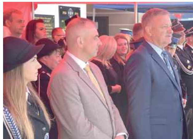
Na uroczystość przybyli przedstawiciele władz państwowych, samorządowych i jednostek pożarniczych