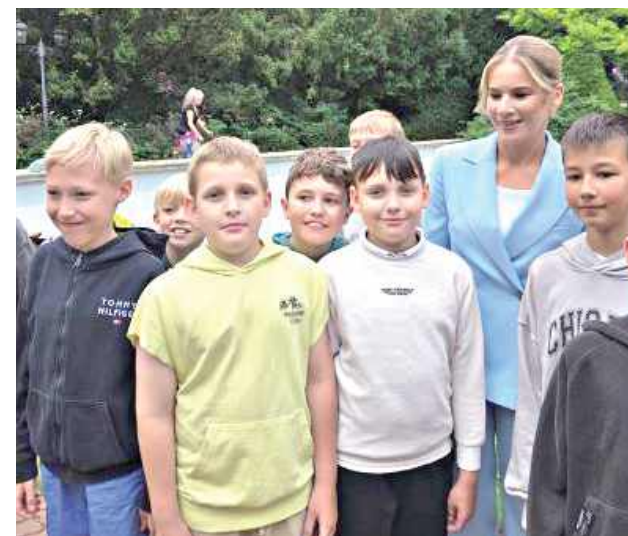
Piękna pogoda oraz radosna atmosfera sprawiły, że wydarzenie stało się prawdziwym świętem najmłodszych