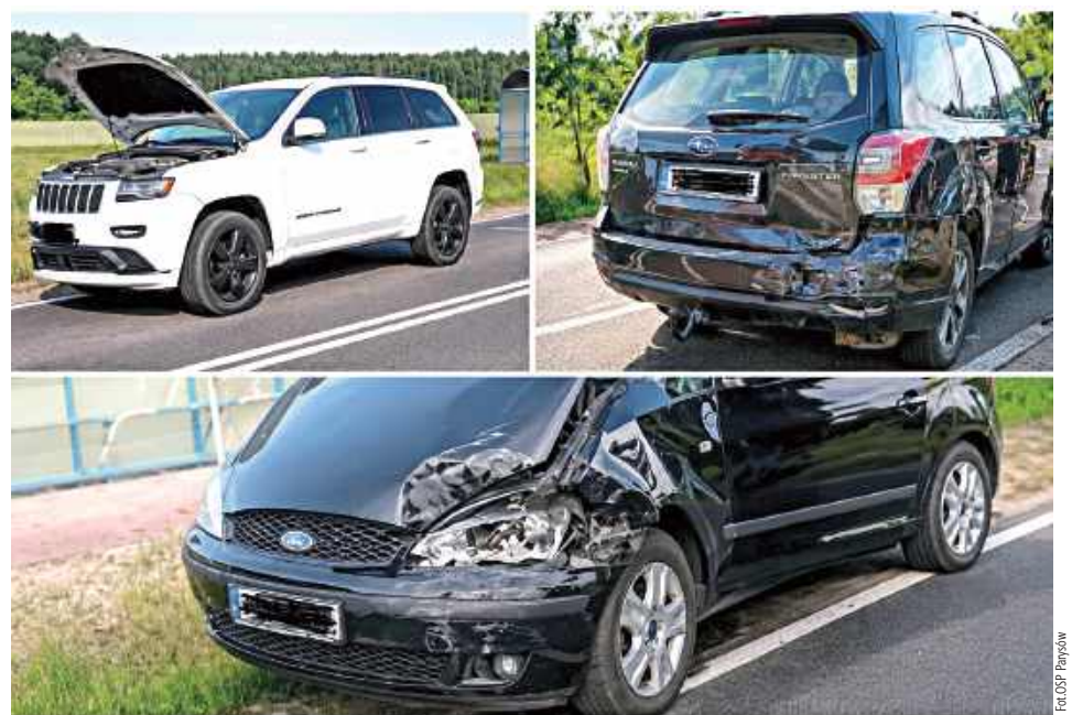
Do groźnie wyglądającego zdarzenia drogowego doszło we wtorek na drodze wojewódzkiej nr 805