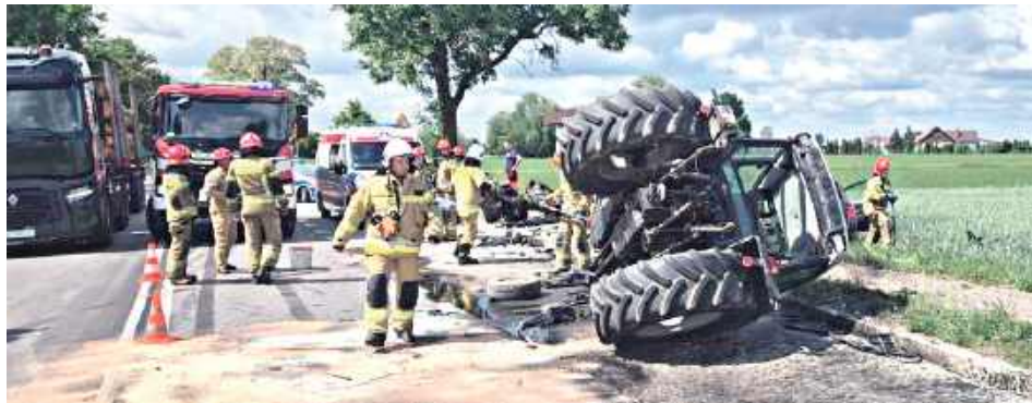
W Rąbieżu doszło do zderzenia ciągnika rolniczego z samochodem osobowym, w wyniku którego dwie osoby trafiły do szpitala

W wyniku zdarzenia obie osoby podróżujące samochodem osobowym zostały prze-