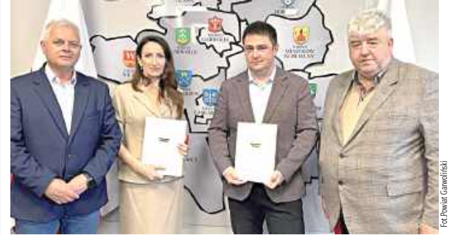
To długo wyczekiwana przez mieszkańców inwestycja

To dobra wiadomość dla kierowców korzystających z drogi prowadzącej od wiaduktu nad trasą S17 w kierunku granicy powiatu garwolińskiego. Powiat Garwoliński podpisał umowę na przebudowę ponad 600-metrowego odcinka drogi powiatowej nr 1363W na terenie gminy Trojanów. Wartość inwestycji zbliża się do miliona złotych.