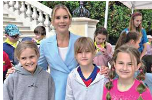
To był Dzień Dziecka, którego uczniowie klasy 3b ze Szkoły Podstawowej im. Orła Białego w Michałówce z pewnością nie zapomną przez długie lata

To był Dzień Dziecka, którego uczniowie klasy 3b ze Szkoły Podstawowej im. Orła Białego w Michałówce z pewnością nie zapomną przez długie lata. Na zaproszenie Pierwszej Damy Marty Nawrockiej dzieci uczestniczyły w wyjątkowych obchodach zorganizowanych w Ogrodach Pałacu Prezydenckiego w Warszawie.