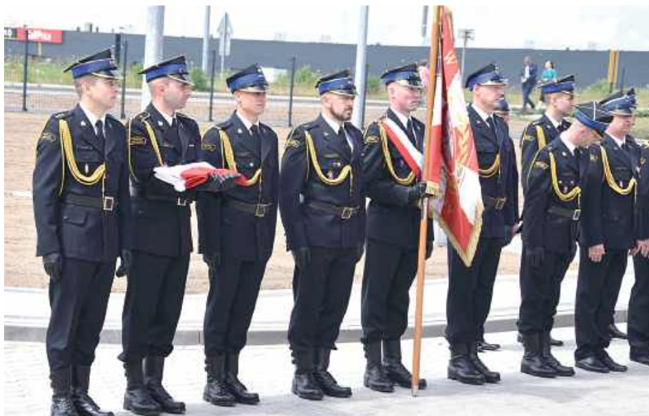
Obchody Dnia Strażaka w powiecie garwolińskim zostały połączone z poświęceniem Komendy Powiatowej Państwowej Straży Pożarnej w Garwolinie

W obchodach Dnia Strażaka uczestniczył wiceminister Spraw Wewnętrznych i Administracji Czesław Mroczek, który w swoim wystąpieniu zwrócił uwagę na nakłady finansowe państwa na modernizację służb mundurowych i tworzenie systemu ochrony ludności oraz obrony cywilnej. Sekretarz stanu w MSWiA mówił: Zarówno Państwowa Straż Pożarna, jak i Ochotnicze Straże Pożarne, tworzą Krajowy System Ratowniczo-Gaśniczy, z którego możemy być dumni. System wielozadaniowy, wielofunkcyjny, od gaszenia pożarów, poprzez ratownictwo drogowe, chemiczne, wodne, wielowymiarowe. Mielśmy okazję obserwować działanie tych systemów przy okazji licznych pożarów, z jakimi mieliśmy do czynienia w ostatnich miesiącach.