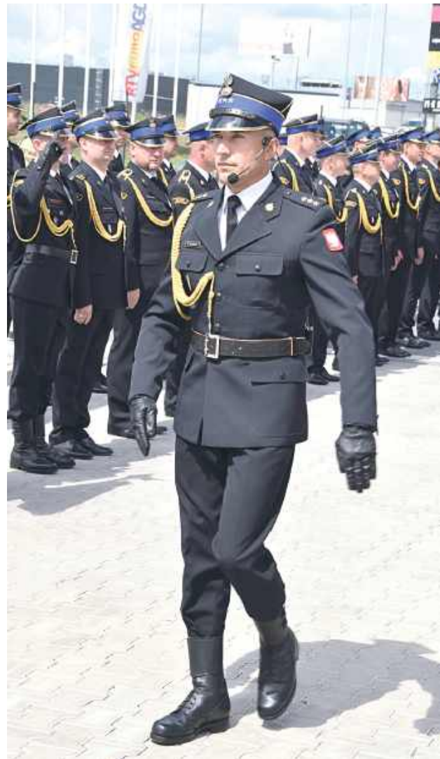
Obchody rozpoczął uroczysty apel strażacki. Złożony został meldunek o rozpoczęciu uroczystości, nastąpił przegląd i przywitanie pododdziałów