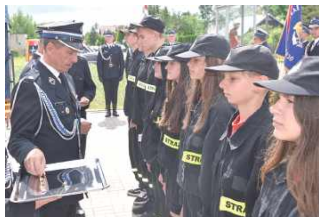
Okolicznościowymi odznaczeniami uhonorowani zostali także członkowie młodzieżowych drużyn pożarniczych