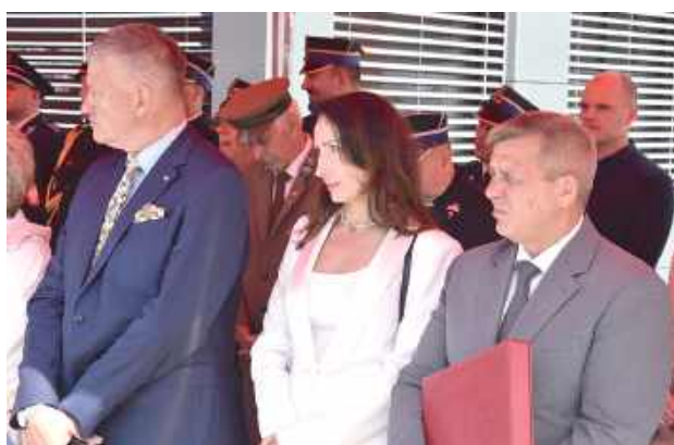
W wydarzeniu udział wzięli przedstawiciele władzy parlamentarnej i powiatowej

Przypomnijmy: Nowo wybudowany budynek Komendy Powiatowej Państwowej Straży Pożarnej i Jednostki Ratowniczo-Gaśniczej w Garwolinie stanowi jedną z kluczowych