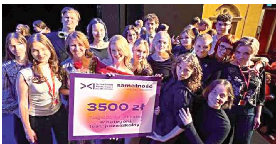
To ogromny sukces garwolińskiego zespołu!

Finał XI Festiwalu Teatrów Młodzieżowych na Mazowszu odbył się 10 i 11 czerwca w Teatrze Polskim im. Arnolda Szyfmana w Warszawie. W wydarzeniu, organizowanym przez Teatr Polski i Samorząd Województwa Mazowieckiego, zaprezentowały się grupy szkolne i pozaszkolne z całego regionu. Tegoroczna edycja festiwalu przebiegała pod hasłem „Samotność – cóż po ludziach?”, które stało się inspiracją dla przygo-