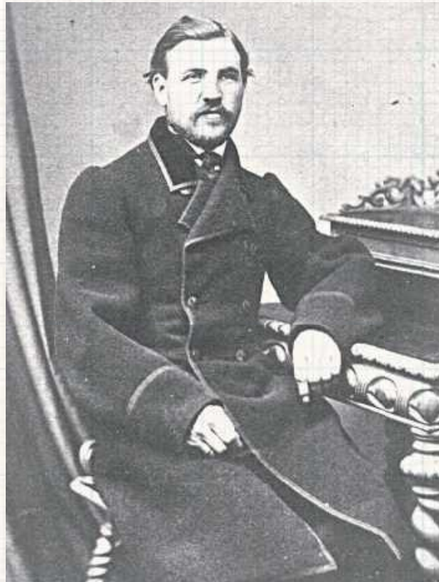
W czasie Powstania Styczniowego dwór w Ksawerynowie stał się schronieniem dla jednostki powstańczej Józefa Jankowskiego (Wikipedia)

„Wspomnienia dziecka 1861-1864” – „Franek”