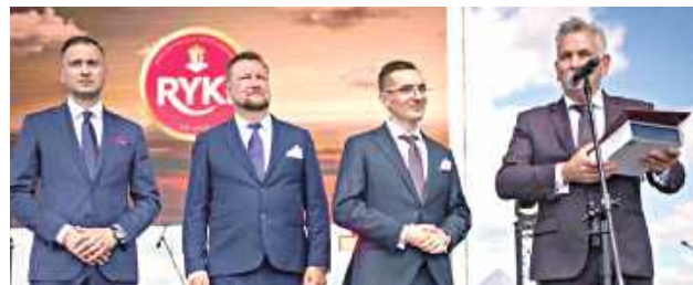
Zakład produkuje około 45 ton sera dziennie, a jego wyroby trafiają nie tylko na polski rynek, ale również do wielu krajów za granicą

Szczególnym powodem do dumy jest fakt, że aż siedmiu producentów z powiatu garwolińskiego znajduje się w gronie największych dostawców mleka