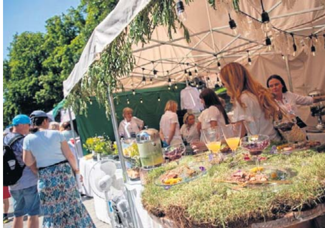
Tak wyglądał piknik nad Wisłą podczas ubiegłorocznych Dni Torunia

Najwięcej sił należy jednak przygotować na sobotę. A czemu? Odpowiedź jest prosta. To właśnie 20 czerwca zaplanowano wielki Piknik Wiślany z dziesiątkami aktywności i at-