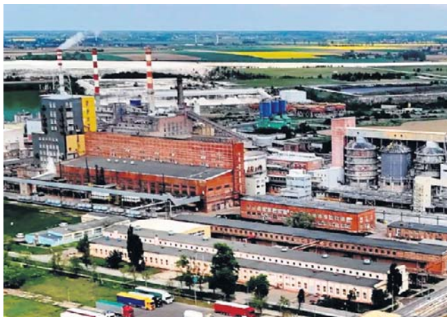
Zawarcie przedwstępnej umowy sprzedaży na rzecz niemieckiej grupy nie oznacza sfinalizowania transakcji

W piśmie skierowanym do premiera związki zawodowe przypominają, że obecny kryzys to efekt błędów sprzed lat. Cho-