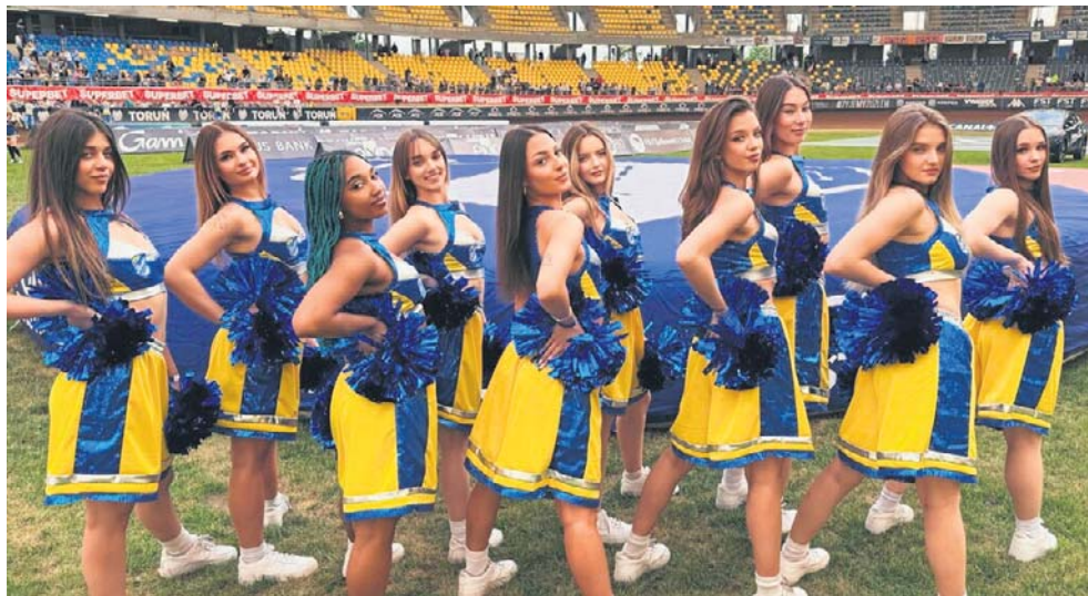
Cheerleaders Toruń są świetnie znane kibicom koszykówki. Od obecnego sezonu dbają także o oprawę meczów żużlowych na Motoarenie

Także w sezonie 2025/2026 jej występy były nieodłącznym elementem koszykarskiego wi-