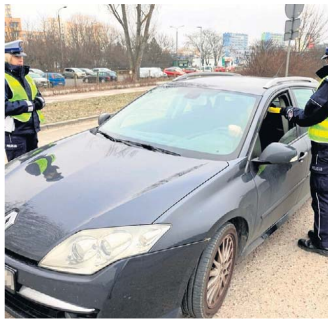
Pijani kierowcy to wciąż ogromny problem w naszym kraju i regionie

Nakazał mu również wpłacić 7 tysięcy złotych na rzecz Funduszu Pomocy Pokrzywdzonym oraz Pomocy Postpe-