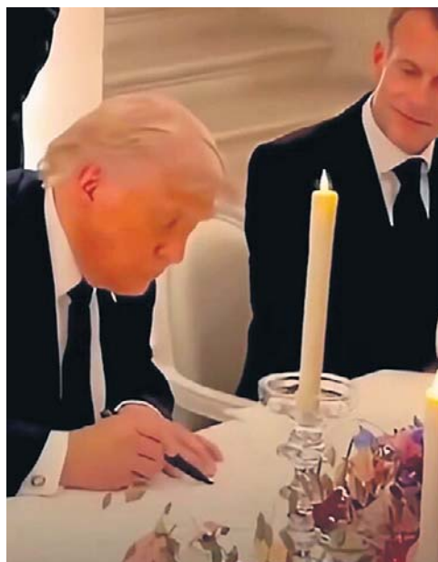
Trump złożył podpis w Wersalu w obecności Macrona. Pezeszkian pokazał podpisany dokument w telewizji

- Memorandum między Iranem a USA zostało już oficjalnie