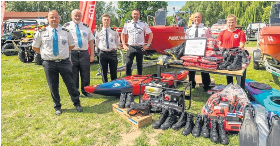
Zakupiony z Funduszy Europejskich dla Kujaw i Pomorza nowoczesny sprzęt, w tym samochody, quady, kajaki, łodzie i defibrylatory, kosztował blisko 7 milionów złotych

- Kolejnym etapem wsparcia finansowanego ze środków unijnych będzie modernizacja stanic WOPR. W ten sposób kompleksowo wzmacniamy potencjał ratownictwa wodnego w naszym regionie, zapewniając ra-