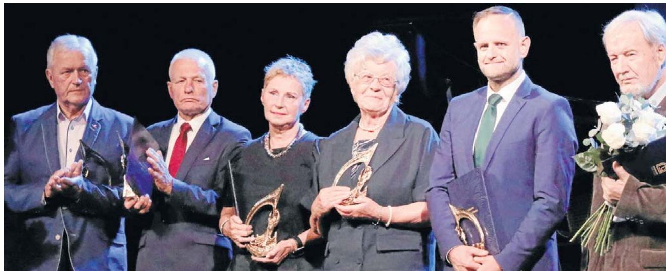
Wzruszenie i radość. Takie emocje towarzyszyły laureatom podczas wręczenia Nagrody Grudziądzkiego Flisaka 2026

Aleksandra Pasis aleksandra.pasis@polskappress.pl