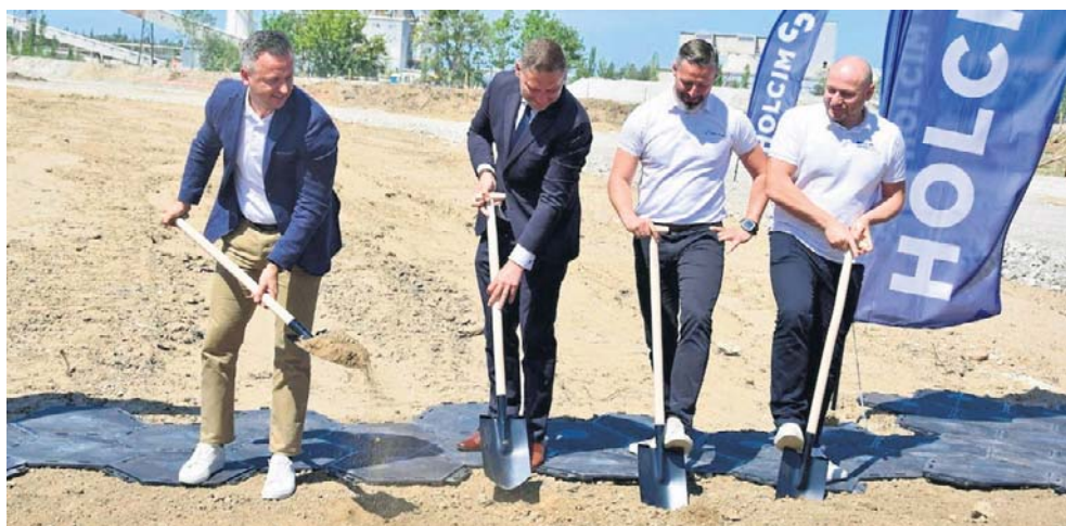
W miejscu, gdzie powstanie nowy zakład, symbolicznie pierwsze łopaty wbili przedstawiciele administracji publicznej, samorządu oraz spółki Holcim Polska

Holcim od blisko 30 lat rozwija działalność w Polsce, inwestując lokalnie i współpracując z krajowymi partnerami. ©