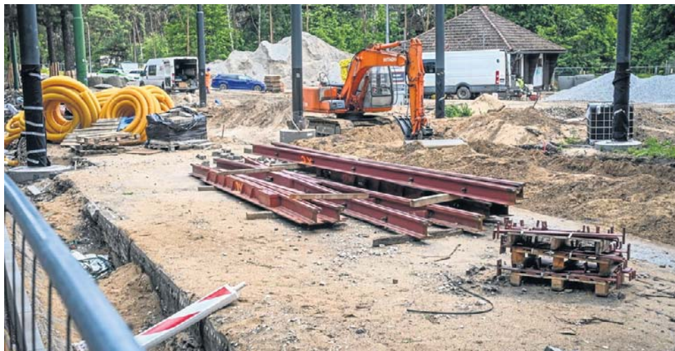
Trwa przebudowa pętli tramwajowej Las Gdański. Wykonawca zamontował już też część słupów trakcyjnych i rozpoczął montaż torów oraz rozjazdów najazdowych

Na pętli zaplanowano zielone torowiska, a także wiaty