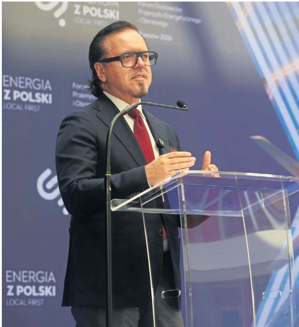
Wojciech Balczun, minister aktywów państwowych, podkreślił, że local content to szansa na wzmocnienie przemysłu dzięki rekordowym inwestycjom w energetykę

W trzeciej edycji wydarzenia, po spotkaniach w Warszawie i Szczecinie, w Rzeszowie wzięło udział kilkuset uczestników z całej Polski. Rozmowy dotyczyły nie tylko transformacji energetycznej, ale również – po raz pierwszy tak wy-