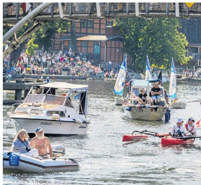
Parada jednostek pływających to jeden ze stałych punktów programu Steru na Bydgoszcz. Tak było w zeszłym roku.

Festiwal rozpocznie się w sobotę, 20 czerwca, o godz. 12. Od południa (także w niedzielę, 21 czerwca) na Wyspie Młyńskiej na mieszkańców będą czekały: strefa relaksu, Strefa Wodnych Atrakcji (w niej baseny i tory skimboard) i strefa grill&foodtruck. O godz. 13 z nabrzeża Wyspy Młyńskiej wystartuje Wyścig Smoczyc Łodzi, a godzinę później z Młynówki - Charytatywny Wyścig Kaczek - Rotary Bydgoszcz (początek przy Moście Klenczonia). Tego dnia organizatorzy zaproszą na Paradę Jednostek Pływających, której towarzyszy konkurs na najpiękniej