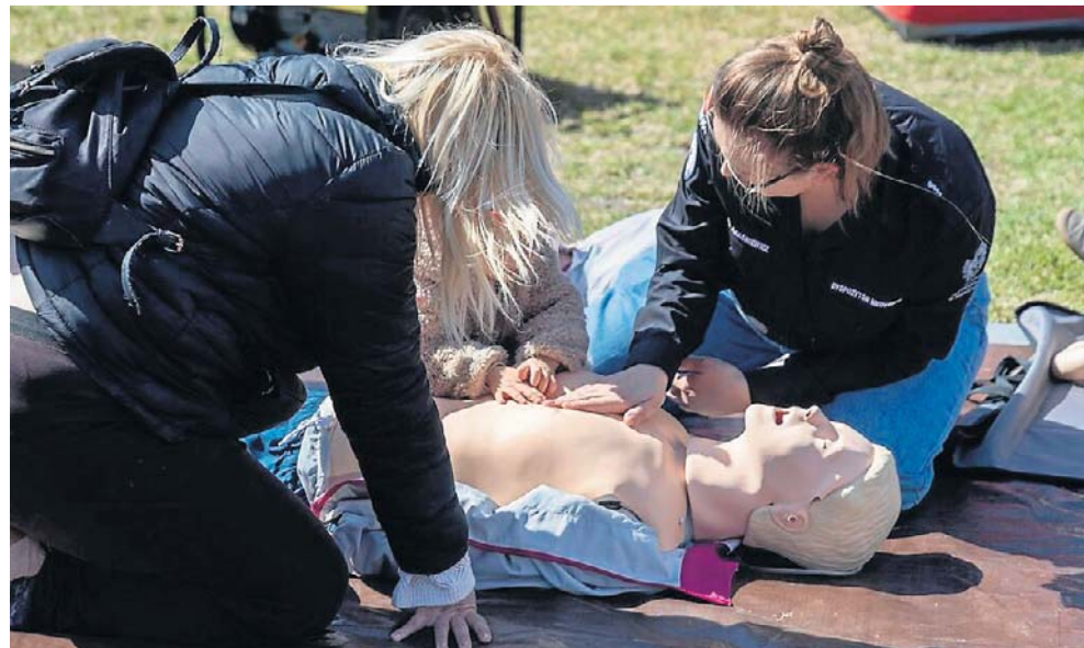
W sobotę i niedzielę można nauczyć się udzielania pierwszej pomocy. Za darmo!

Krajowy Trening Pierwszej Pomocy to przede wszystkim praktyka. Pod okiem ratowników medycznych i strażaków uczestnicy dowiedzą się i samodzielnie przećwiczą m. in.: