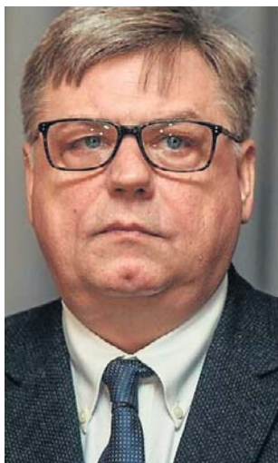
Nasi europosłowie. Od lewej Kosma Złotowski (PiS), Joanna Scheuring-Wielgus (Nowa Lewica) oraz Krzysztof Brejza (KO)

Zacznijmy od posłanki Nowej Lewicy, którą mieszkańcy Torunia najlepiej znają. Stąd pochodzi, stąd wcześniej startowała do Sejmu, tutaj jest centrum życiowe jej rodziny (ma