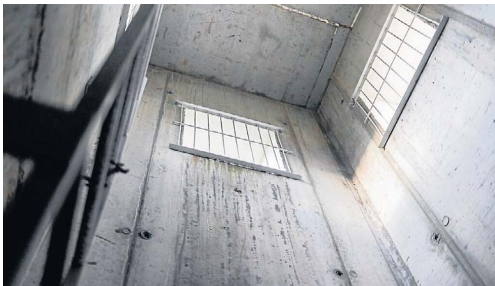
W najbliższych trzech latach sama Bydgoszcz otrzyma z budżetu państwa co najmniej 100 milionów złotych między innymi na budowę schronów

29 maja 2026 roku w życie weszła nowelizacja ustawy o ochronie ludności i obronie cywilnej, która po raz pierwszy nakłada na samorządy konkretny, terminowy obowiązek. Nowy artykuł 95a tego dokumentu mówi, że inwestor planujący budowę budynku uży-