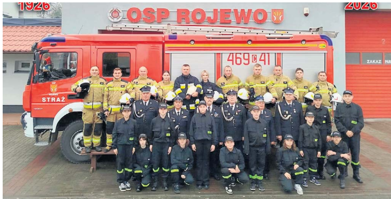
Wśród druhów Ochotniczej Straży Pożarnej w Rojewie są seniorzy, nazywani „oldbojami”, ratownicy, członkowie czynni, wspierający i honorowi. Jest również Młodzieżowa Drużyna Pożarnicza, duma i przyszłość jednostki

Wśród strażaków wiadomo, że zawsze można na nich liczyć, służą dobrą radą i od razu są, gdy tylko ich potrzeba.