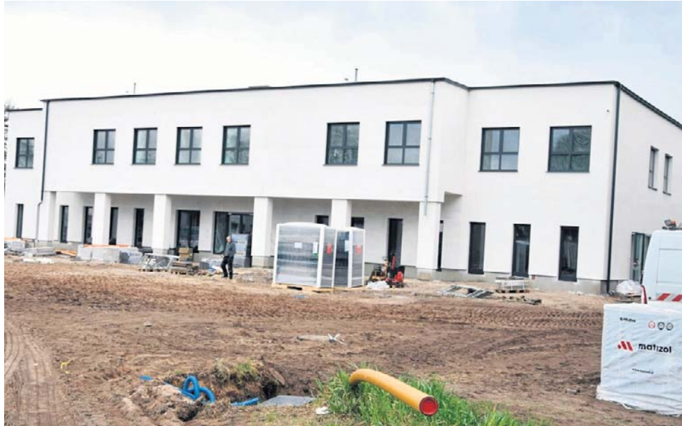
Budynek przedszkola w Cielu niemal gotowy, choć trzeba jeszcze ogarnąć teren wokół. Jak wynika z zapowiedzi władz gminy - oficjalne otwarcie przedszkola już we wrześniu

Stąd podjęta przez samorząd rozbudowa Szkoły Podstawowej w Przyłękach, a także tworzenie nowych miejsc dla maluchów w budowanym w Cielu komple-