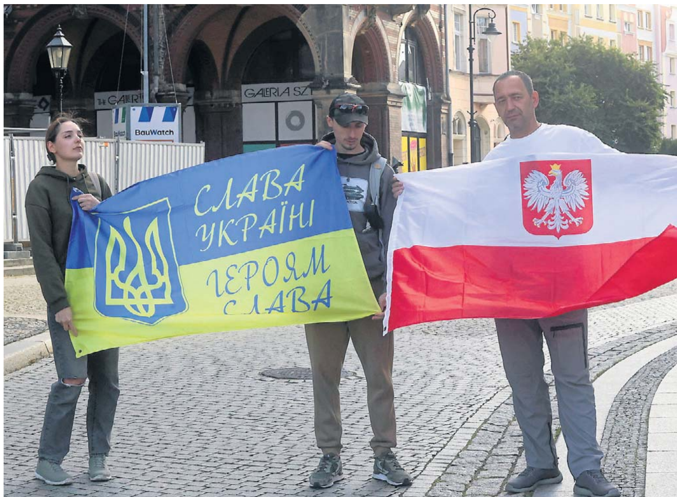
Stosunek Polaków do Ukraińców zmienia się z każdym rokiem. Także strona ukraińska zaczyna inaczej postrzegać Polaków