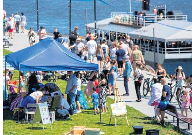
Nad Wisłę w czerwcu 2025 roku przysły całe tłumy mieszkańców i turystów. Pogoda była piękna

Druga ze stref będzie artystyczna. Tu odbędą się warsztaty z tworzenia toreb z toruńskimi motywami oraz z plecenia wianków świętojańskich. Warto dodać, że liczba uczestników jest ograniczona i decyduje kolejność zajęcia miejsc. Aktywna tu będzie także Galeria Sztuki Wozownia, której przedstawiciele poprowadzą warsztaty w klimacie sztuki ulicznej pt. „Toruńska Streetówka”. Obejmą one tworzenie banerów graffiti, name tagów oraz toruńskich pocztówek. Oto szczegó-