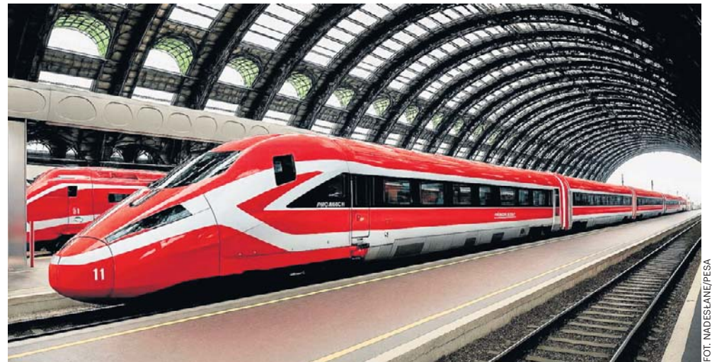
Pesa i Hitachi planują zaoferować PKP IC flagowy pociąg Hitachi Rail - ETR1000, który świetnie sprawdził się na europejskich trasach kolei dużych prędkości

W ramach konsorcjum partnerzy planują zaoferować polskiemu przewoźnikowi flagowy pociąg Hitachi Rail - ETR1000, który w ciągu minioniej dekady świetnie sprawdził się na euro-