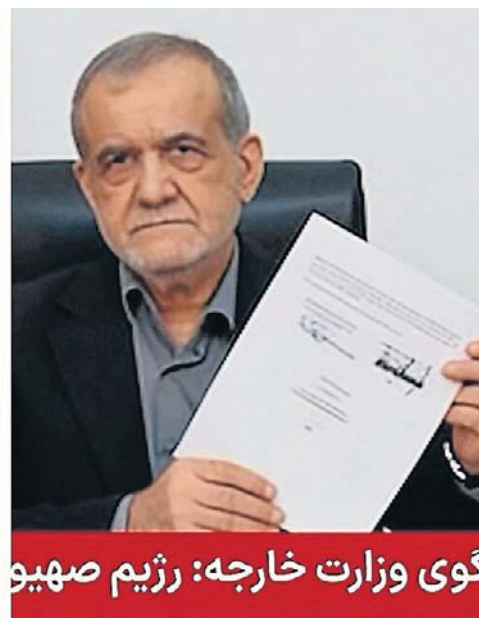
گوی وزارت خارجه: رژیم صهیونیستی

sfinalizowane, ponieważ obie strony złożyły pod nim podpisy - oznajmił Baghaei.