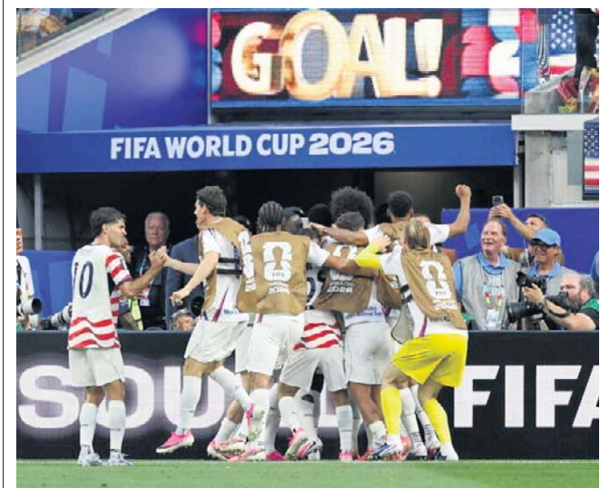
W pierwszym meczu Amerykanie zaprezentowali efektywny i efektywny futbol w meczu z Paragwajem

Grupa C 20.06, 0:00 Szkocja - Maroko (TVP2, TVP Sport) 20.06, 2:30 Brazylia - Haiti (TVPI, TVP Sport) Grupa D 19.06, 21:00 USA - Australia (TVPI, TVP Sport) 20.06, 5:00 Turcja - Paragwaj (TVP2, TVP Sport) Grupa E 20.06, 22:00 Niemcy - WKS (TVPI, TVP Sport) 21.06, 2:00 Ekwador - Curaçao (TVP2, TVP Sport) Grupa F 20.06, 19:00 Holandia - Szwecja (TVPI, TVP Sport) 21.06, 6:00 Tunezja - Japonia (TVP2, TVP Sport) Grupa G 21.06, 21:00 Belgia - Iran (TVP2, TVP Sport) 22.06, 3:00 N. Zelandia - Egipt (TVPI, TVP Sport) Grupa H 21.06, 18:00 Hiszpania - Arabia S. (TVP2, TVP Sport) 22.06, 0:00 Urugwaj - WZP (TVP2, TVP Sport) ©