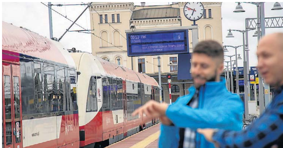
W podróż na Hel zabierze nas z Bydgoszczy pociąg „Latarnik”. Cieszące się co roku powodzeniem połączenie obsługuje pociągi Arrivy. Startują 27 czerwca

W pierwszy dzień wakacji zostaną uruchomione, cieszące się dużym zainteresowaniem podróżnych, letnie pociągi do popularnych miejscowości wypoczynkowych nad Bałtykiem i w Borach Tucholskich. 27 czerwca z dworców w Bydgoszczy