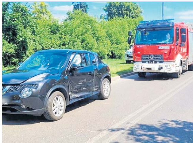
Kolizja na skrzyżowaniu ulic Barskiej i Żytniej we Włocławku