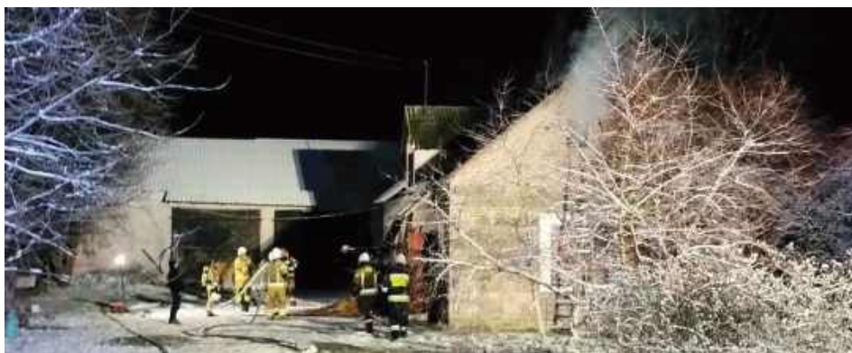
Pożarem objęte było poddasze budynku. Działania trwały do późnych godzin nocnych

O godzinie 21.44 31 grudnia 2025 roku zastępy Ochotniczej Straży Pożarnej zostały zadysponowane do pożaru budynku gospodarczego w miejscowości Celiny.