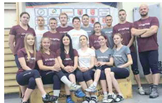
I Ty możesz zostać mistrzem! Olimpijczyk Łuków zaprasza do wspólnego treningu

Klub Sportowy Olimpijczyk Łuków ogłasza nabór do sekcji wieloboju atletycznego, która stanowi doskonałe przygotowanie do uprawiania podnoszenia ciężarów oraz innych dyscyplin siłowych.