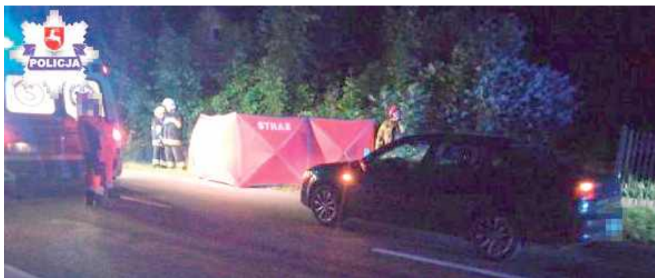
W tym roku od tragedii miną cztery lata. Kierujący Seatem, mieszkaniec powiatu lubartowskiego, na prostym odcinku drogi w terenie zabudowanym najechał na 42-latkę niosącego na rękach 58-latkę