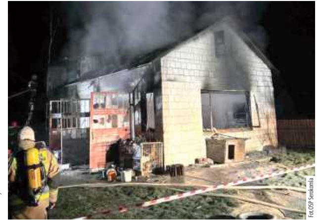
25 grudnia przed godz. 3 nad ranem w miejscowości Czarna zapalił się garaż