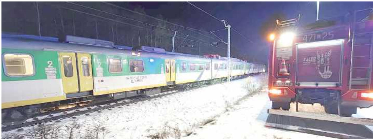
Strażacy oświetlili teren oraz zadbali o bezpieczeństwo podróżnych podczas przechodzenia do podstawionego pociągu

Jak wynika z informacji przekazanych przez straż po-