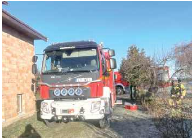
25 grudnia, godz. 9.23 pożar sadzy w kominie w miejscowości Wola Bobrowa