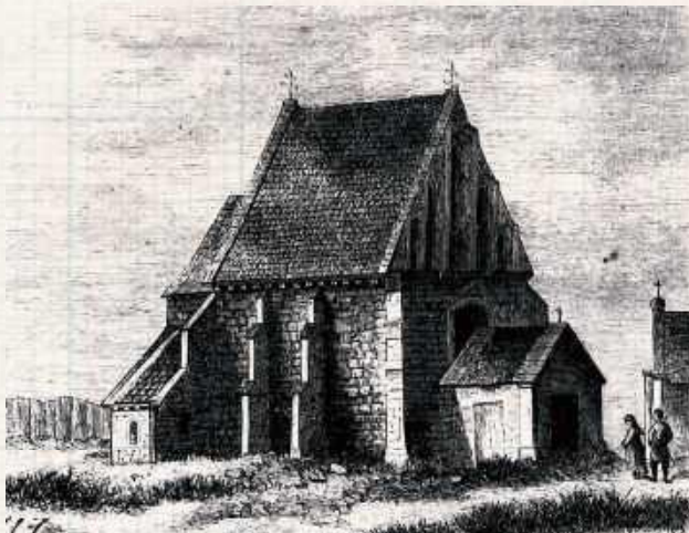
Kaplica pw. św. Stanisława wzniesiona ok. 1440 roku przez biskupa Zbigniewa Oleśnickiego nad grobem Piotra Strzemięńczyka. Grafika z Tygodnika Ilustrowanego z 1869 roku

Oczywiście musi paść pytanie, dlaczego tę historię opisano tak późno. Wbrew pozorom sam upływ czasu jej wiarygodności zupełnie nie dyskwalifikuje. Polska jest, najprzejmiej mówiąc, krajem „rozwinętej kultury oralnej”, czyli załatwiania nawet najpoważniejszych spraw wyłącznie „na gębę”. Cały dorobek