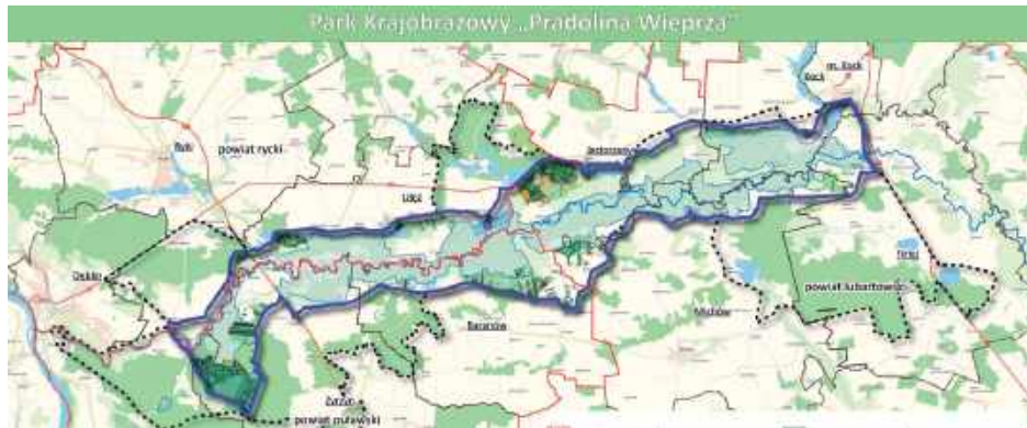
Tak miałyby przebiegać granice nowego Parku Krajobrazowego Pradolina Wieprza

Zespół Lubelskich Parków Krajobrazowych chce na terenie trzech powiatów - puławskiego, ryckiego i lubartowskiego utworzyć nowy park krajobrazowy - Pradolina Wieprza. Przyrodnicy przekonują, że przyciągnąłby do regionu turystów m.in. z okolic, Lublina czy Warszawy.