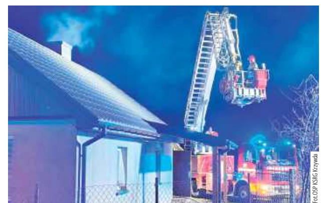
28 grudnia po godz. 19 zapaliła się sadza w kominie domu jednorodzinnego w Radoryżu Smolanym