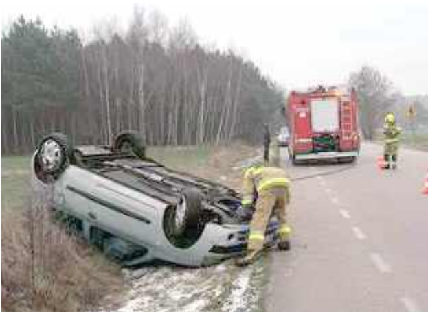
26 grudnia około godz. 14 strażacy zostali wezwani do dachowania pojazdu osobowego w miejscowości Szczatb