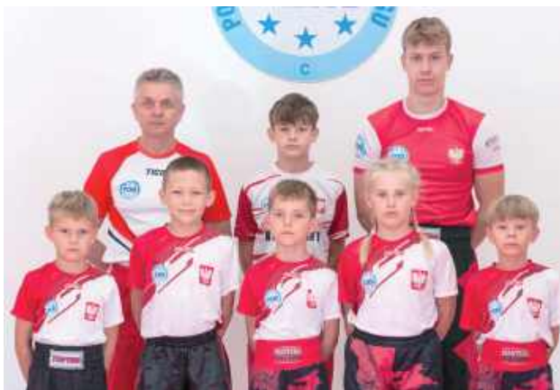
KSW Łuków został sklasyfikowany jako najlepszy klub kickboxingu w województwie lubelskim w 2025 roku

Ranking ten jest jednolity dla wszystkich dyscyplin sportowych i obejmuje rywalizację prowadzoną przez Polskie Związki Sportowe. Wyniki udostępniane są publicznie na stronie ssm.insp.waw.pl i stanowią jedyne ogólnopolskie zestawienie podsumowujące osiągnięcia LUK