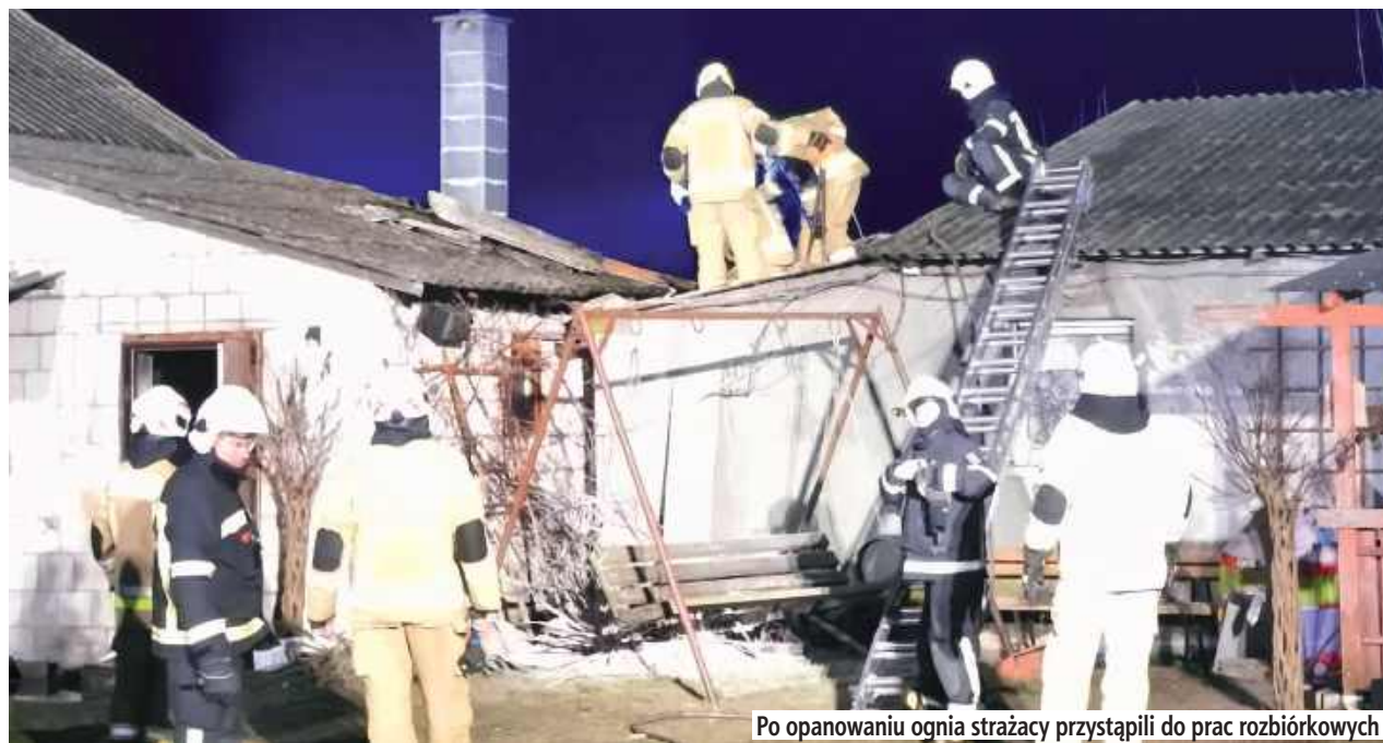
Po opanowaniu ognia strażacy przystąpili do prac rozbiórkowych

Po przybyciu na miejsce strażacy zabezpieczyli teren zdarzenia, a następnie wprowadzili do wnętrza budynku rotę ratowników wyposażonych w aparaty ochrony dróg oddechowych. Działania gaśnicze prowadzone były z wykorzystaniem linii gaśniczej. Po opanowaniu ognia strażacy przystąpili do prac