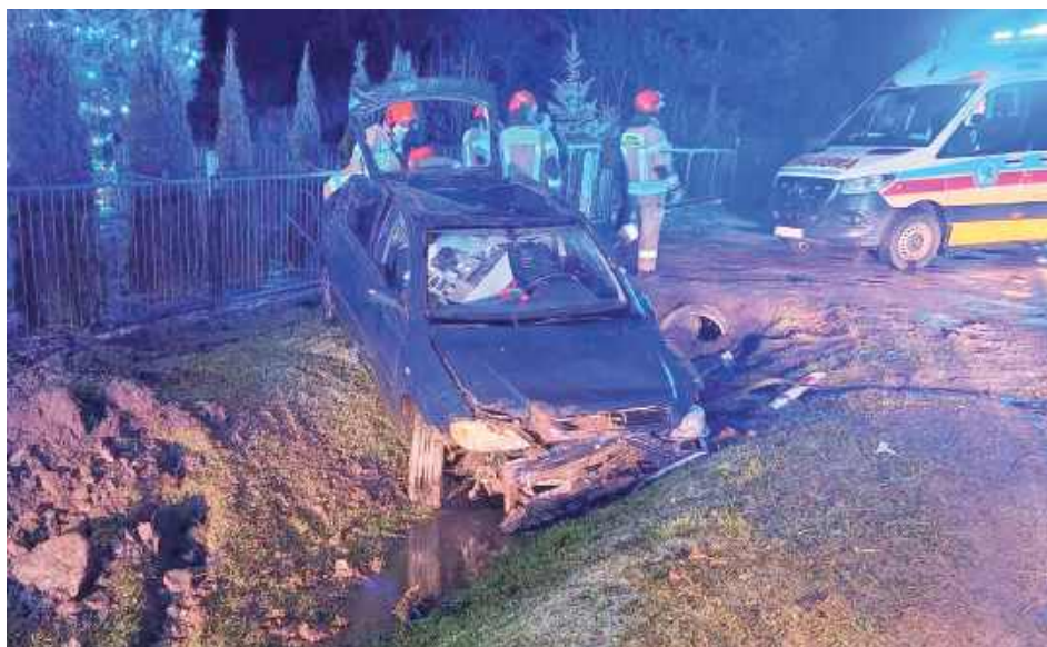
Auto zostało znacznie uszkodzone

Oprócz druhów interweniowały dwa zastępy Jednostki