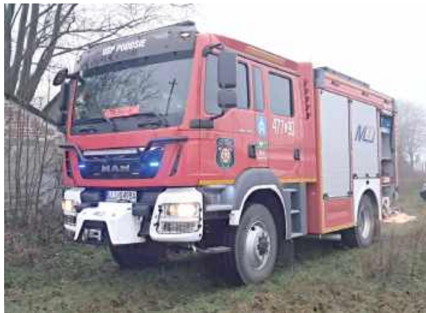
27 grudnia przed godz. 14 strażacy zostali wezwani do otwarcia domu w Podosiu