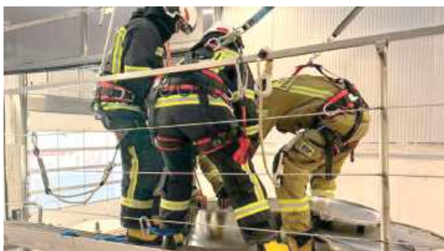
30 grudnia zostały przeprowadzone ćwiczenia z zakresu ratownictwa technicznego oraz wysokościowego na terenie firmy Agro-Top w Grzędówce

30 grudnia w Grzędówce przeprowadzono ćwiczenia z zakresu ratownictwa technicznego oraz wysokościowego, zorganizowane przez Państwową Straż Pożarną we współpracy z jednostkami Ochotniczych Straży Pożarnych.