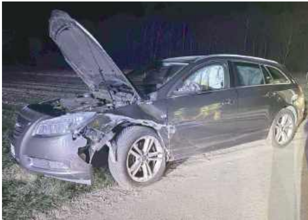
Wyjazd do wypadku drogowego, godz. 17.04, Okrzeja, 24 grudnia