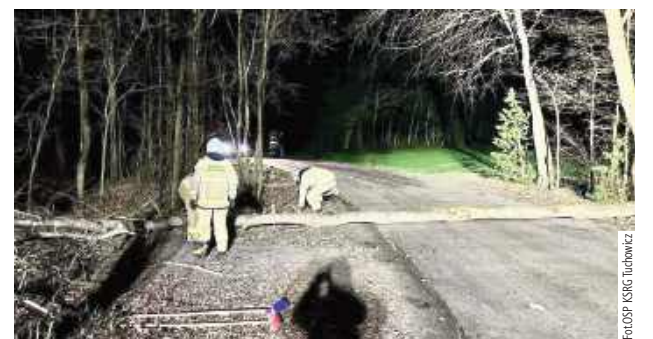
28 grudnia po godz. 18 straż została zadysponowana do pochylonego drzewa w miejscowości KIJ