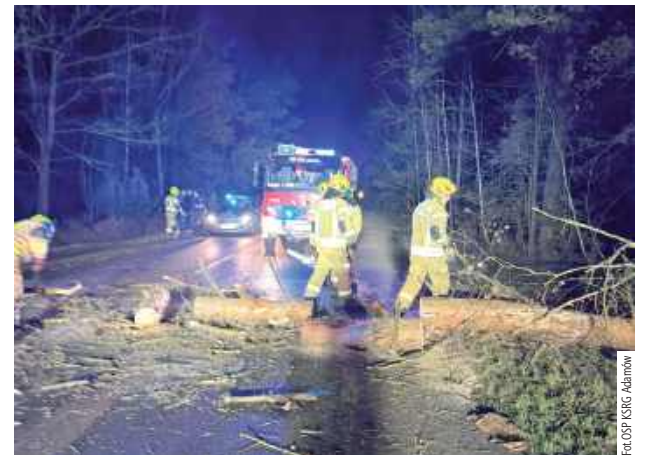
28 grudnia, godz. 16.46 - powalone drzewo na trasie Adamów-Krzywdą