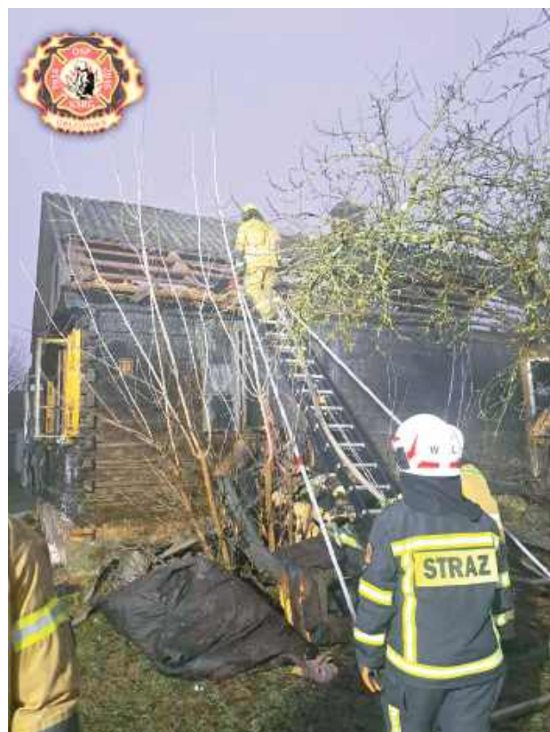
27 grudnia. Pożar budynku mieszkalnego