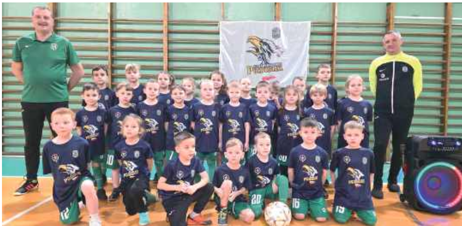
Po raz pierwszy oficjalnie zarejestrowanych zostało 30 najmłodszych zawodników - sześciolatków „Skrzatów”, którzy stali się pełnoprawnymi piłkarzami AR-TIG-u Huta Dąbrowa

KS AR-TIG Huta Dąbrowa to klub z długą i bogatą tradycją.