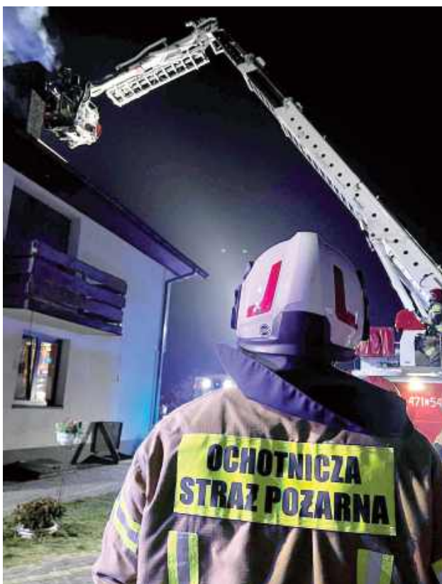
26 grudnia straż została wezwana do pożaru sadzy w przewodzie kominowym w domu jednorodzinnym w miejscowości Krynka