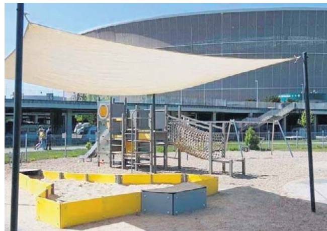
Żagle zamontowane na wrocławskich placach zabaw mają chronić dzieci przed słońcem