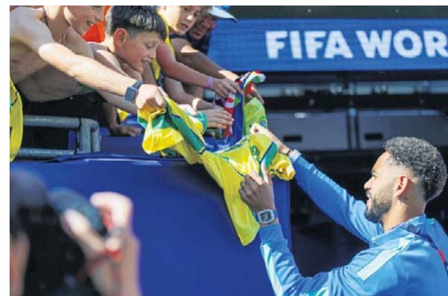
W MUNDIALOWYM OBIEKTYWIE GRZEGORZA WAJDY. W starciu Brazylii z Marokiem pojawiły się magiczne momenty. Na cudowną bramkową akcję zespołu z Afryki – asysta: Brahim Diaz, podcinka: Ismael Saibiri – Canarinhos odpowiedzieli trafieniem Viniciusa. Na stadionie w New Jersey pojawił się Neymar, a show skradli kibice z Ameryki Południowej

Mundial 2026 W amerykańskim turnieju zaczęły się nocne maratony. Kibice muszą szykować kondycję