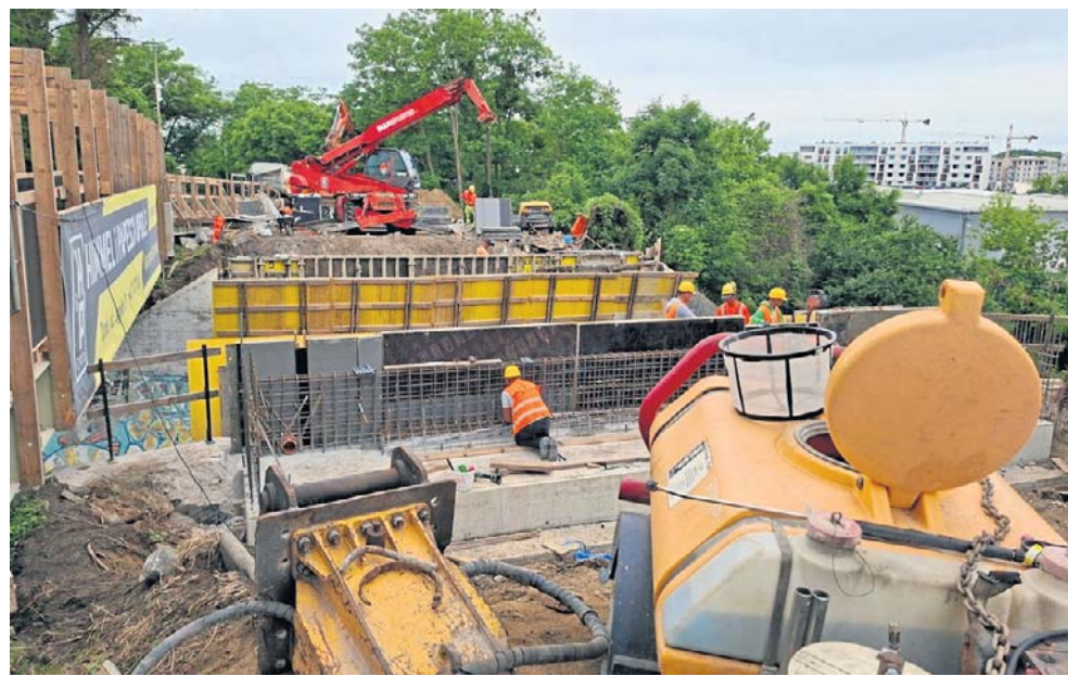
Pod konstrukcją przygotowujemy są fundamenty, a wykonawca czeka na osiągnięcie przez beton odpowiedniej wytrzymałości.

Powstanie także nowa droga rowerowo-pieszna na odcinku Gazowa - Karwińska, a po zachod-