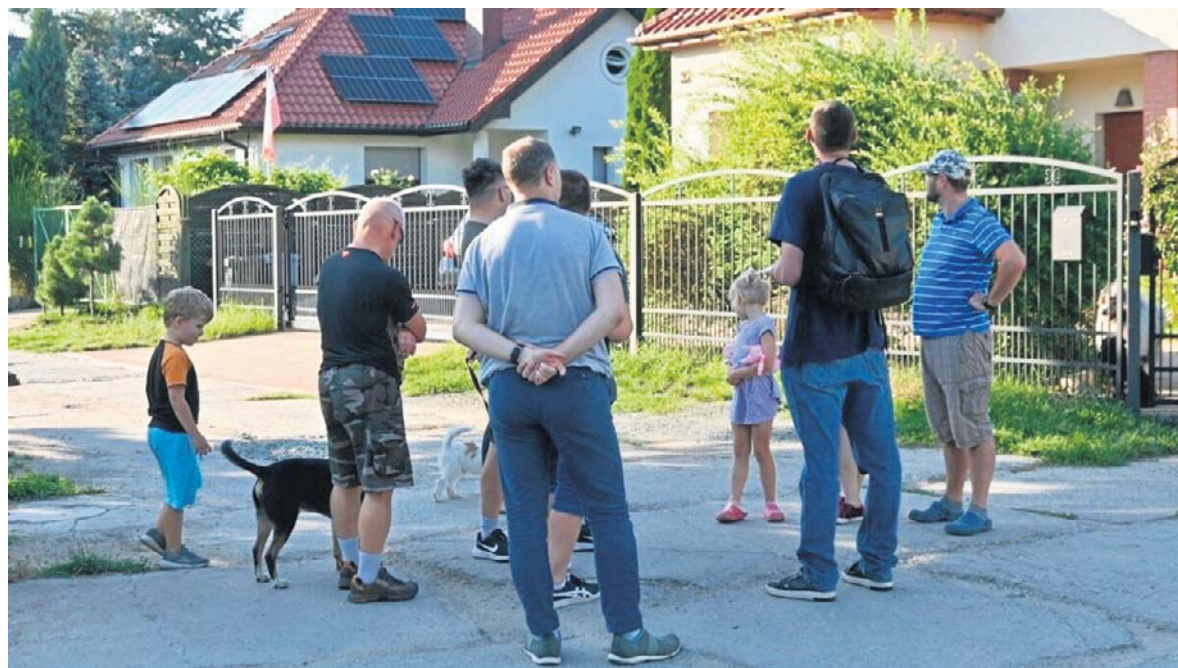
Mieszkańcy czekali na to od ponad 20 lat. Zapadła oficjalna decyzja o remoncie ul. Będkowskiej.