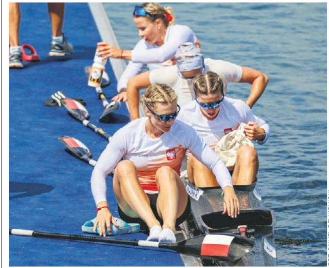
Polscy kajakarze zdobyli sześć medali podczas mistrzostw Europy. Żeńska czwórka sięgnęła po srebro