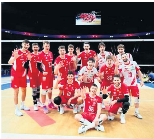
Reprezentacja Polski na turnieju Ligi Narodów w Linyi w Chinach wygrała dwa mecze i poniosła dwie porażki

Początek drugiej partii wyglądał podobnie jak w pierw-