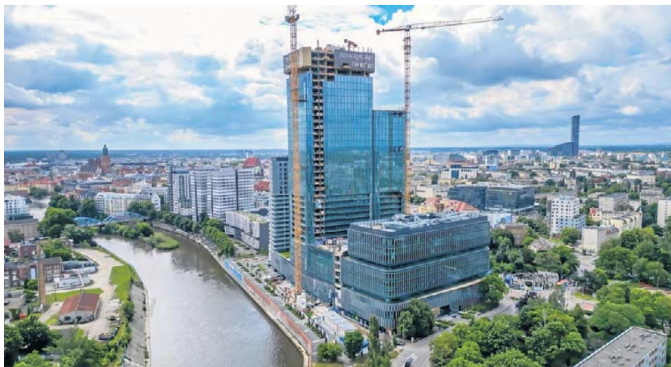
137 metrów i 37 pięter. Tak prezentuje się obecnie budynek Quorum Tower na zdjęciach z drona.

Na placu budowy trwają teraz intensywne prace wykończeniowe wewnątrz budynku. Jednocześnie realizowana jest jego elewacja ze