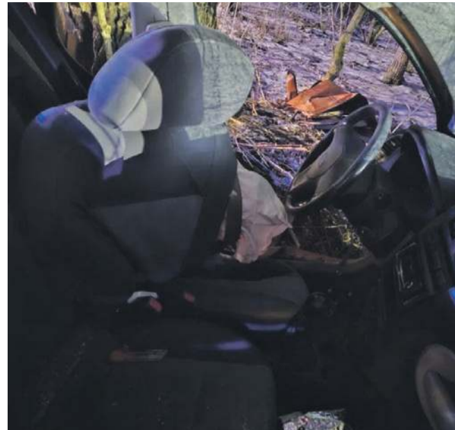
fol. Państwowe Ratownictwo Medyczne w Opcznie