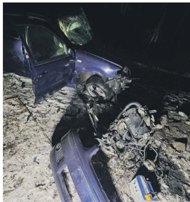
fol. OSP Lubień