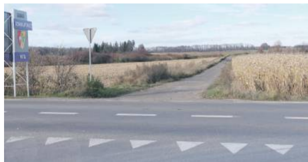
Droga, prowadząca na bocznice w Górce Sobockiej