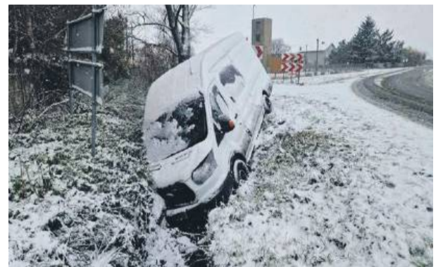
Nagle pogorszenie warunków atmosferycznych sprawiło, że doszło do kilku zdarzeń drogowych. Między innymi na zakręcie w Ośnie, miejscu szczególnie niebezpiecznym.