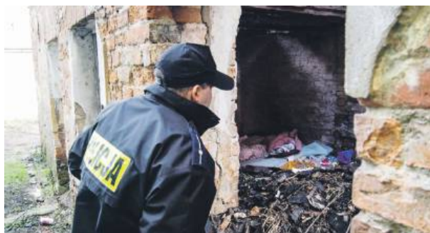
Policjanci i strażnicy miejscy sprawdzają okolice dworca, pustostany i ogródki działkowe, w których przebywają bezdomni