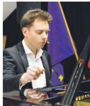
Pianista przed wiązowską publicznością zagrał kilkanaście różnych utworów Fryderyka Chopina