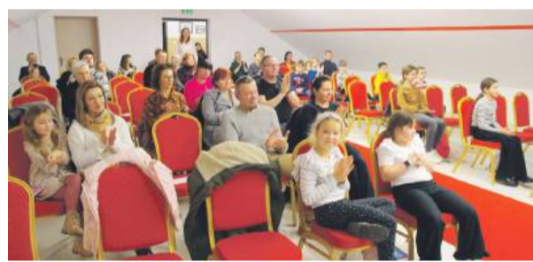
W wydarzeniu uczestniczyli nie tylko mieszkańcy Wiązowa