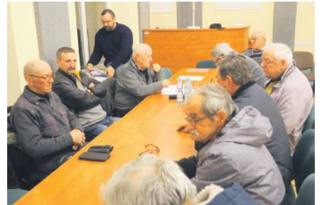
Zarządowi koła nr 21 udzielono absolutorium i przyjęto terminarz na 2026 rok. Nie było oficjalnych przemówień, a spotkanie miało charakter kameralny

– Karpia nie hodujemy od trzech lat. Dlaczego?