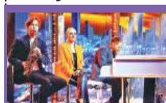
17:30 Jaka to melodia? - teleturniej muzyczny

05:25 Wichrowe wzgórze - serial 06:10 Akacja 38 - serial, 2017 07:00 Transmisja Mszy Świętej 07:30 Dobre historie - magazyn 08:00 Serwis Info 08:10 Pogoda Info 08:20 Zaraz wracam - serial, 2025 09:00 Ranczo - serial TVP, 2007 10:00 Komisarz Alex - serial krym. 11:00 Ojciec Mateusz - serial 12:00 Serwis Info 12:10 Agrobiznes 12:35 To się opłaca - magazyn 12:50 Świat dzikiej przyrody - Góra lodowa. Znikający olbrzym - dok., Franc., 2024 14:00 Wichrowe wzgórze - serial 15:00 Serwis Info 15:15 Reportery - magazyn 15:35 Gra słów. Krzyżówka - teleturniej 16:05 Dziedzictwo - serial, Turcja 17:00 Teleexpress 17:20 Pogoda