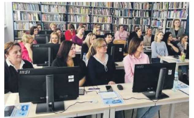
W szkoleniu udział wzięli nauczyciele i bibliotekarze z powiatu strzeńskiego.

szkolenia było przybliżeniem uczestnikom podstawowych pojęć oraz zasad funkcjonowania sztucznej inteligencji. W spotkaniu uczestniczyli wicemarszałek