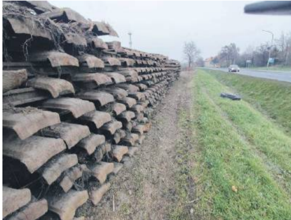
Prace na remontowanej linii są widoczne. Przy ul. Dzierżoniewskiej w Strzelinie ustawione są pryzmy z kilkoma tysiącami zdemontowanych betonowych i stalowych podkładów oraz starymi szynami

program rewitalizacji linii kolejowej. Efektem prac ma być zmniejszenie uciążliwości ruchu ciężarówek i reaktywacja terenów leżących przy linii, a w przyszłości uruchomienie połączeń pasażerskich. Już załatwiono niezbędne formalności w urzędach gmin w zakresie pozwoleń na wycinki i zgłoszenia realizacji prac ziemnych. Linia ma kluczowe znaczenie dla południowej części województwa. Łączy Strzelin – leżący na między-