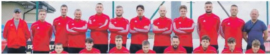
LKS Brożec wywalczył punkt w ostatnim pojedynku w roku 2025