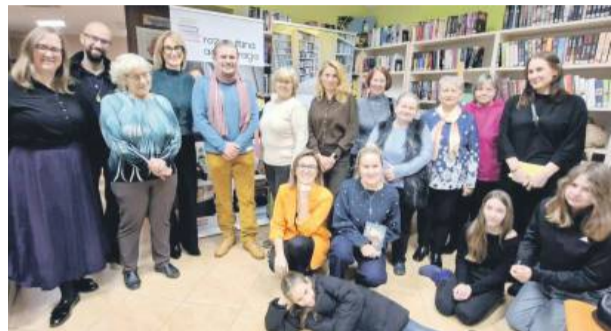
Uczestnicy spotkania z autorem (piąty od lewej).

Czy książki mogą zabrać nas w podróż? Czy wszystko, co niezwykle da się wytłumaczyć? Czego boimy się najbardziej?