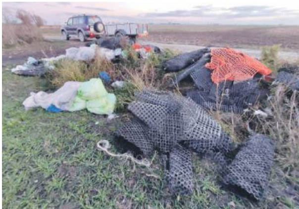
Jak duża jest ilość wyrzuconych śmieci pokazuje to zdjęcie, na którym widzimy dysproporcję pomiędzy odpadami a samochodem z towarową przyczepką w tle. Tak sytuacja wyglądała w minioną sobotę