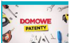
15:50 Domowe patenty - felieton