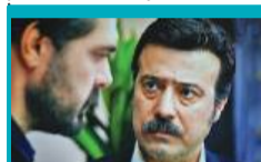
16:05 Dziedzictwo - serial, Turcja

05:00 Rodzinka.pl - serial komediowy 05:35 M jak miłość - serial obyczajowy, 2022 06:25 Pożyteczni.pl - magazyn 06:55 Dla niesłyszących - Barwy szczęścia - serial obycz., 2025 07:30 Pytanie na śniadanie - magazyn poranny 11:50 Gwiazdorska kuchnia Ani - zanurzamy się w świecie kulinarnych inspiracji, poznajemy tajniki wyjątkowej kuchni 12:30 Koło fortuny - teleturniej 13:15 Miłość i nadzieja - serial obycz., Turcja, 2022 14:05 Va Banque - teleturniej 14:35 Na sygnale - serial fabularyzowany 15:05 La Promesa - pałac tajemnic - serial, Hiszp., 2023