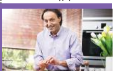
20:10 Doradca smaku - program kulinarny

05:40 Uwaga! - program interwencyjny 05:55 Ukryta prawda - program obyczajowy 06:50 Kuchenne rewolucje - program kulinarno-rozrywkowy 07:45 Dzień Dobry TVN - magazyn poranny 11:40 Kuchenne rewolucje - program kulinarno-rozrywkowy 13:55 Kobieta na krańcu świata - program Martyny Wojciechowskiej 14:35 Ukryta prawda - program obyczajowy 16:50 Szpital św. Anny - program obycz. 17:55 Detektywi - program kryminalny 19:00 Fakty 19:35 Sport 19:45 Pogoda 19:55 Uwaga! - program interwencyjny