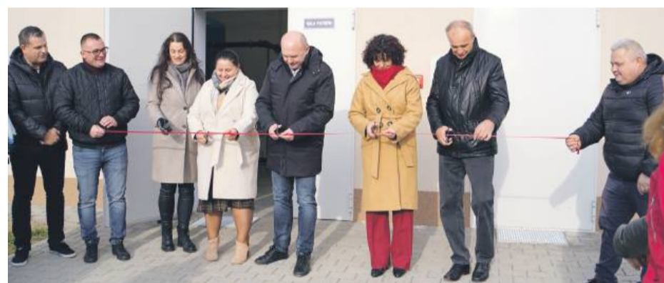
Uroczyste przecięcie wstęgi. W wydarzeniu brali udział samorządowcy gminni, powiatowi i dolnośląscy, a także pracownicy byłego ZGK.