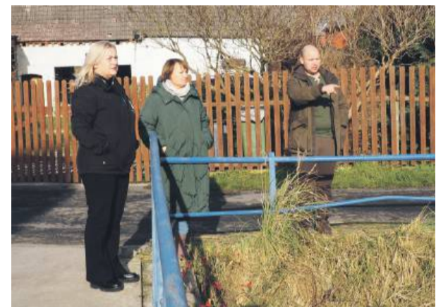
Samorządowcy sprawdzają postępy inwestycji w Nieszkowicach.

Na początku listopada w Urzędzie Miasta i Gminy Strzelin podpisano umowy na realizację dwóch zadań, które poprawią bezpieczeństwo i gospodarkę wodną w sołectwach w naszej gminie.