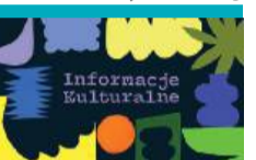
18:30 Informacje kulturalne - magazyn

06:15 Muzyczne poranki 07:00 Tamte lata, tamte dni - Marian Opania - magazyn 07:35 Podróż z historią - Słodki smak historii - dok., Polska, 2017 08:20 W poszukiwaniu dobrego filmu - magazyn 09:00 Noce i dni - serial, 1977 10:05 Siekierza - dram., Polska, 1985 11:35 Film dla kosmitów - fab., Polska, 2022 13:00 Reformatory teatru polskiego - Aleksander Zelwerowicz - dok., Polska, 1998 13:40 Film jest bajką - dok., Polska, 2005 14:30 Tygodnik Kulturalny - dokument fabularny, Hiszp., 2016 17:05 Noce i dni - serial, 1977 18:10 Którędy po sztuce - Sara Lucas - Rzymianie - mag.