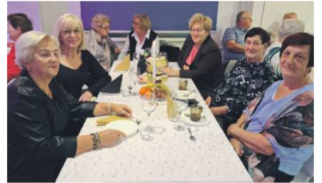
W wydarzeniu wzięło udział wielu mieszkańców gminy Kondratowice.

się wielu mieszkańców, dla których przygotowano szereg atrakcji. Występ kabaretu Jurki rozbawił pu-