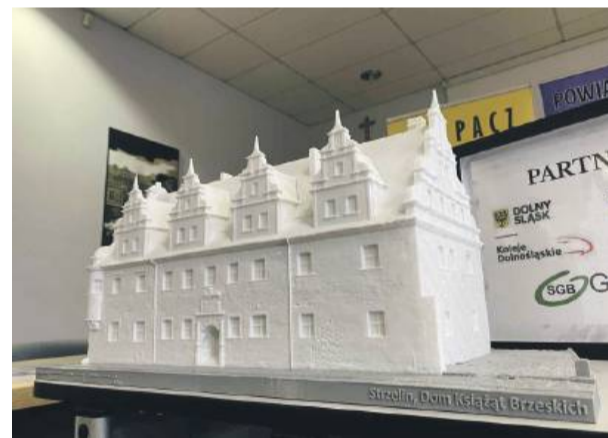
Makieta Domu Książąt Brzeskich, ufundowana przez darczyńców