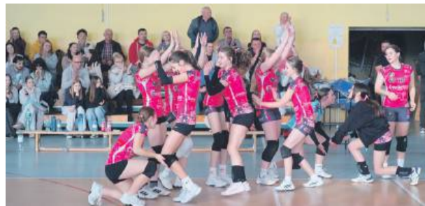
Tygrysy Strzelin wygrały dwa pojedynki