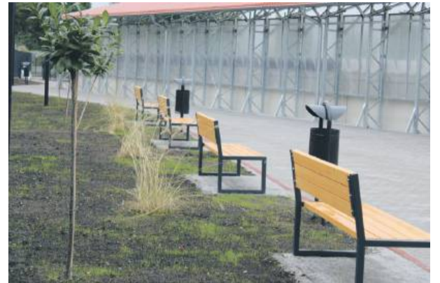
W ramach inwestycji zamontowano także nowe ławki i kosze na śmieci.