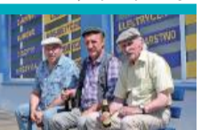
15:50 Ranczo - serial kom., Polska