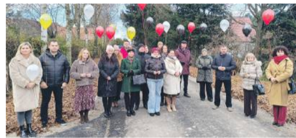
W kameralnej uroczystości w Księżycach udział wzięli przedstawiciele samorządu gminnego, powiatowego i wojewódzkiego, a także wykonawcy zadań.