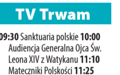
09:30 Sanktuaria polskie 10:00 Audycja Generalna Ojca Św. Leona XIV z Watykanu 11:10 Mateczniki Polskości 11:25 Jestem mamą 11:40 Mysiąc Historia 11:50 Krótką Historia Zbawienia - Bóg spotyka się z człowiekiem 12:00 Anioł Pański 12:03 Inf. dnia 12:20 Wypaczone sumienia 13:00 Zostaliśmy z Bogiem , Panie Pułkowniku 13:30 Msza św. 14:30 Ukrzyżowanie 15:00 Katowice 15:50 Ma się rozumieć 16:00 Inf. dnia 16:10 Na zdrowie 16:30 Cud prawdy 17:00 Po stronie prawdy 17:55 Poczet Wlk. Polaków 18:00 Jubileusz 75-lecia parafii pw. św. Józefa 20:00 Inf. dnia 20:20 Różaniec 20:50 Mysiąc 21:00 Apel Jasnog. 21:20 Inf. dnia 21:40 Polski Punkt Widzenia 22:00 Przetrawiliśmy 22:30 Gorzki to chleb jest polskość Cyprian Kamil Norwid

06:00 Łowcy skarbów . Kto da więcej? 07:55 Bogaty Dom - Biedny Dom - program paradok. 08:55 Policjantki i Policjanci - serial paradok. 10:55 Na Ratunek 112 - serial obyczajowy 11:55 Trudne sprawy - program obyczajowy 14:55 Ktoś tu kłamie? Kto da więcej? 18:00 Policjantki i Policjanci - serial paradok. 20:00 Uroczysko - serial krym. 21:00 Sprawiedliwi - Wydział Kryminalny - serial policyjny 22:00 Sprawiedliwi . Trójmiasto 23:00 Battleship: Bitwa o Ziemię - sens., USA, Jap., 2012 01:45 Love Island . Wyspa miłości - reality show 03:00 Interwencja - magazyn reporterów 03:10 Cudownych rodziców mam 03:25 Lubię disco! 04:25 Top 10 - Lista Przebojów 05:30 Telezakupy TV Okazje