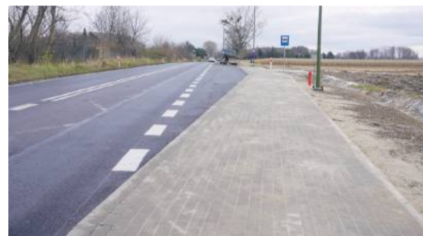
W Biedrzychowie przy drodze krajowej powstała nowa zatoczka autobusowa