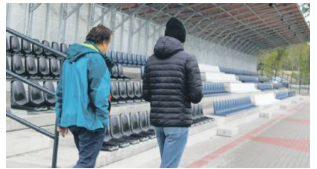
Zadaszone trybuny pomieszczą teraz większą liczbę kibiców.