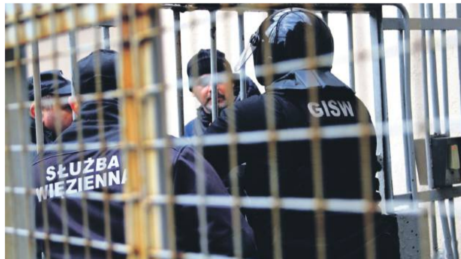
Skargi osadzonych z zakładu karnego dotyczą wielu spraw. Zasypywana jest nimi prokuratura i sądy.