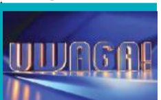
19:55 Uwaga! - program interwencyjny

05:40 Uwaga! - program interwencyjny 05:55 Ukryta prawda - program obyczajowy 06:50 Kuchenne rewolucje - program kulinarno-rozrywkowy 07:45 Dzień Dobry TVN - magazyn poranny 11:40 Kuchenne rewolucje - program kulinarno-rozrywkowy 13:55 The Floor - teleturniej 14:35 Ukryta prawda - program obyczajowy 16:50 Szpital św. Anny - program obycz. 17:55 VIVA! People Power - zapowiedź 18:00 Detektywi - program kryminalny 19:00 Fakty 19:35 VIVA! People Power - zapowiedź 19:40 Sport 19:45 Pogoda