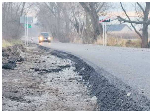
Na całym odcinku drogi położona jest już solidna warstwa asfaltu. W sobotę brakowało jeszcze tylko utwardzenia poboczy w niektórych miejscach

Wartość zadania to około 1,3 mln zł. Przypomnijmy, że inwesty-