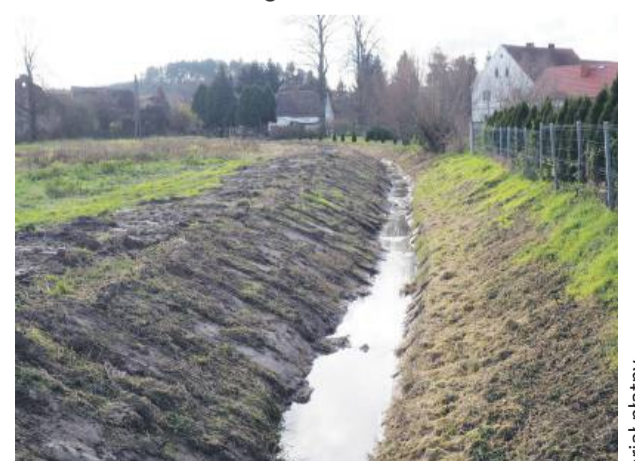
W Nieszkowicach widać już efekty prac.

ści ponad 3 kilometrów wykonane zostaną prace porządkowe: wykoszenie i usunięcie roślinności na całym tym odcinku, a na terenie sołectw odmulenie koryta. Koszt zadania to 153 000 zł. Zaznaczmy, że celem tych inwestycji jest poprawa odprowadzania wód opadowych, ochrona terenów rolnych oraz zwiększenie bezpieczeństwa mieszkańców. Prace już trwają i widać pierwsze efekty poprawy drożności cieków wodnych.