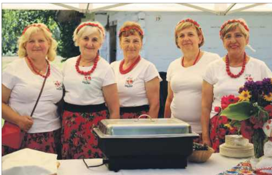
Panie z KGW z powiatu kolbuszowskiego zadbały o coś na ząb. Na zdjęciu KGW „Dworzanki” z Huty Komorowskiej.