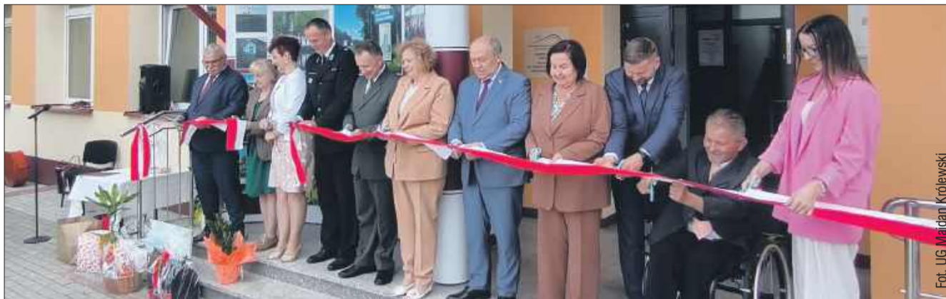
Lokalne władze wzięły udział w przecięciu wstęgi.

We wtorek (10 czerwca) w Brzostowej Górze odbyło się oficjalne otwarcie Centrum Opiekuńczo-Mieszkalnego „Brzostowe Wzgórze”. Nowa placówka w gminie Majdan Królewski przeznaczona jest dla dorosłych osób z niepełnosprawnościami, które wymagają stałego wsparcia - zarówno w trybie dziennym, jak i całodobowym.