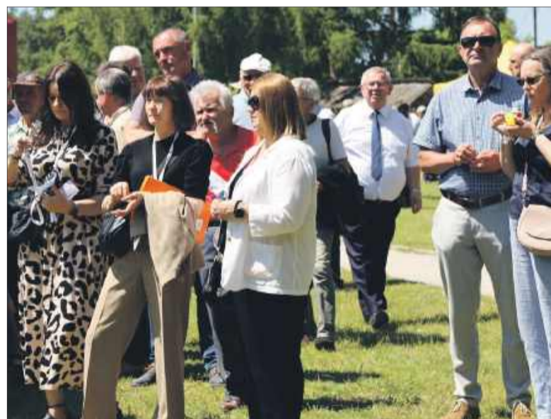
Ładna pogoda sprawiła, że na święcie zjawili się wielu mieszkańców.