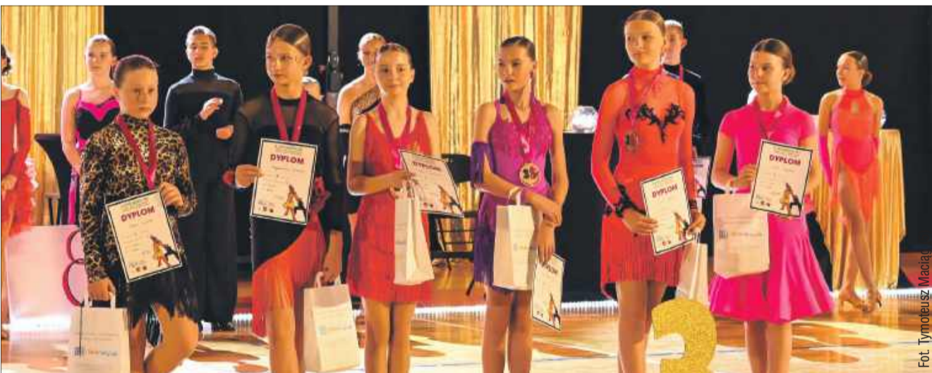
Nagrodzeni zostali najlepsi tancerze.