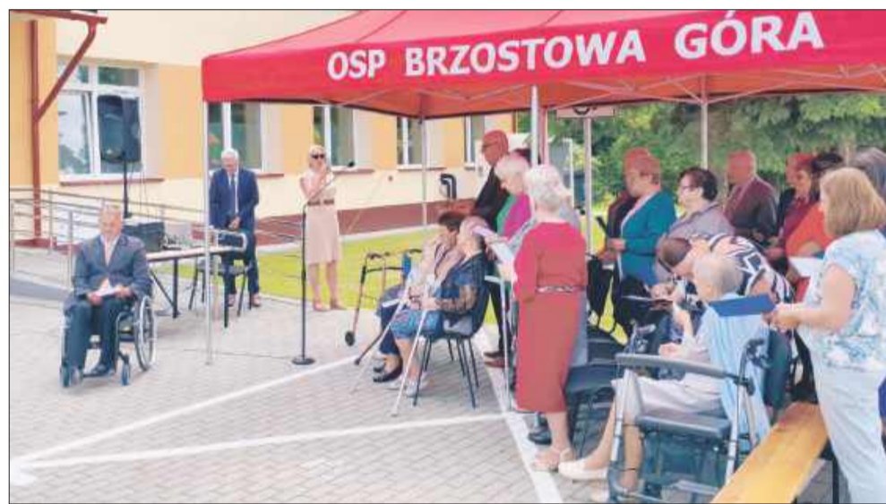
Nie zabrakło także lokalnej społeczności.