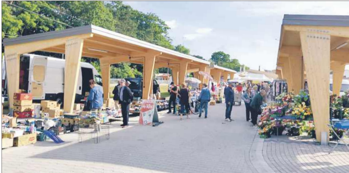
Nowe targowisko przy ul. Wolskiej w Kolbuszowej już działa.

Całkowity koszt budowy nowego placu targowego