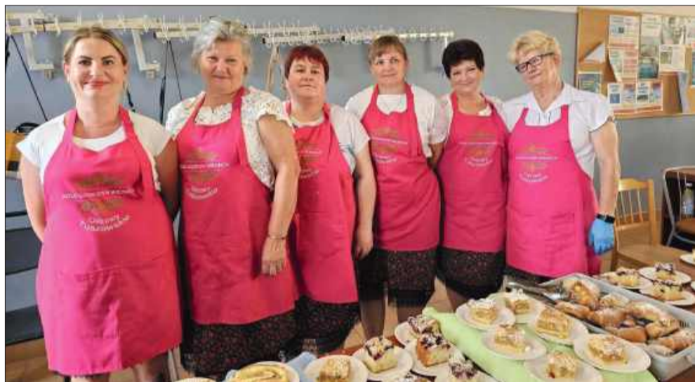
Gospodynie potrafią przygotować przeróżne smakołyki.