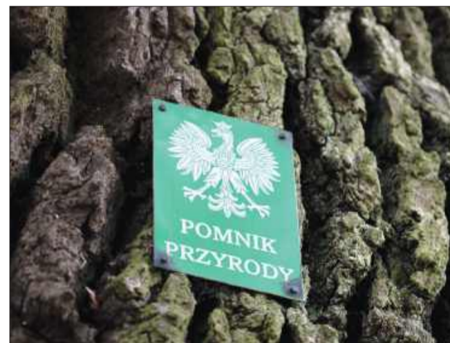
Pomniki przyrody są świadkami wielu wydarzeń.

W Widelce i Weryni pomnikami przyrody są kolejne dęby szypułkowe, a także cis pospolity – rzadki w stanie naturalnym, objęty ochroną gatunkową. Większość z tych drzew rośnie