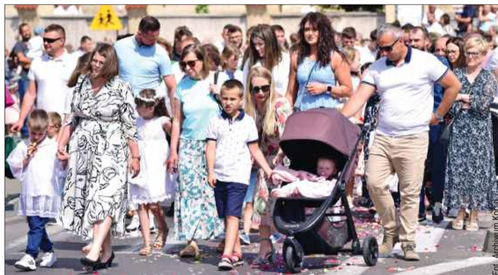
Na procesje zawsze tłumnie przybywają wierni, a dzieci odczują chęć do sypania kwiatami.

W parafii pw. Wszystkich Świętych, procesja wyruszy po mszy świętej o godzinie 9:00 i przejdzie przez cztery przygotowane ołtarze. Pierwszy ołtarz zostanie usytuowany przy Szkole Podstawowej nr 1. Kolejny - przy starostwie powiatowym, trzeci ołtarz znajdzie się na bocznej ścianie bloku przy ul. Tyszkiewiczów 12, w pobliżu ulicy Ruczki, a czwarty ołtarz będzie ustawiony przy pomniku bł. Ks. Kardynała Stefana Wyszyńskiego.