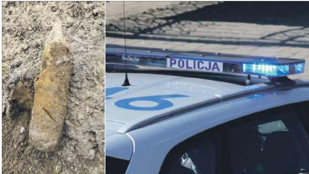
Pocisk, po dokładnym rozpoznaniu, został podjęty przez specjalistyczny patrol saperów.