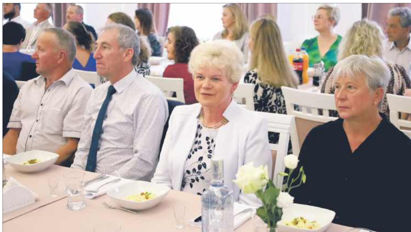
Goście zgromadzili się na wspólnym obiedzie.