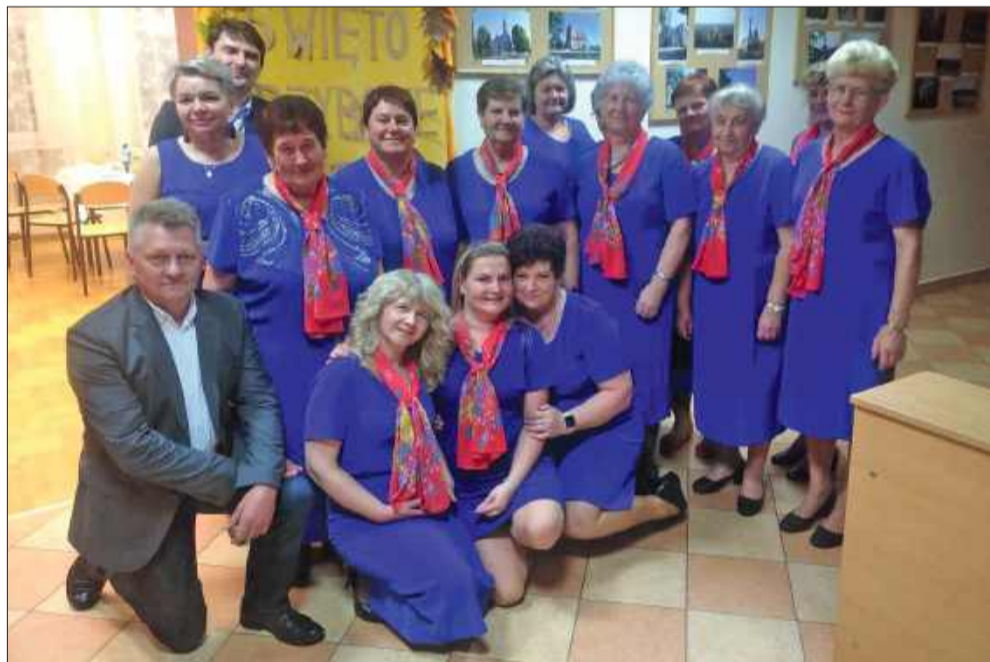
Wspólna integracja jest bardzo ważna dla KGW.