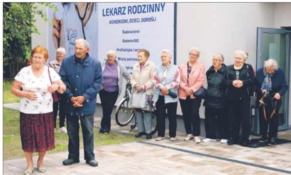
Na otwarciu nie zabrakło mieszkańców.