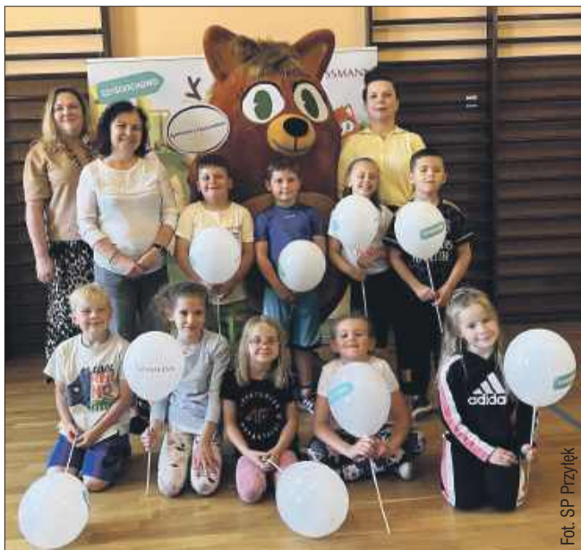
Uczniowie z Przylęka zgarnęli główną nagrodę.