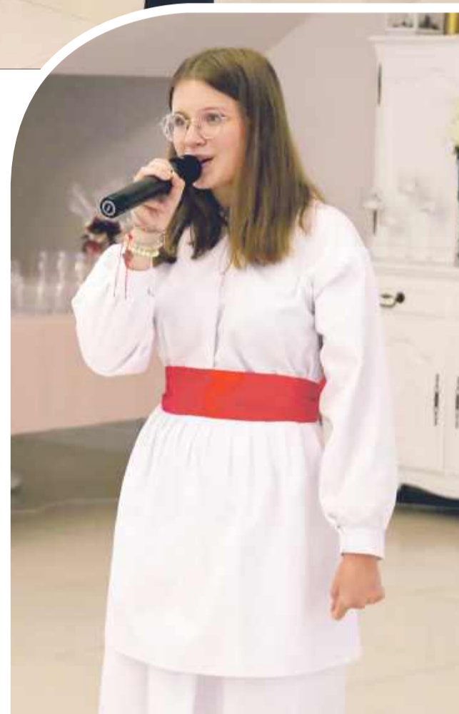
Były też występy wokalne.