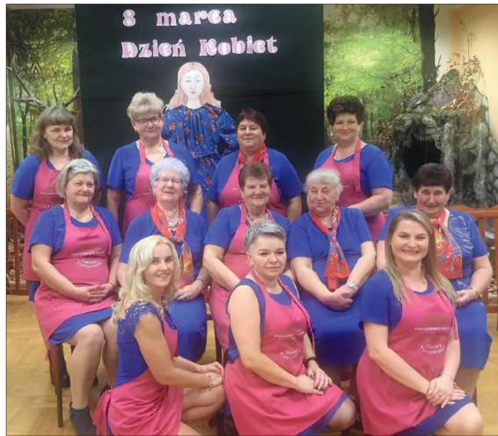
Koło liczy 19 członkiń i stale się rozrasta.