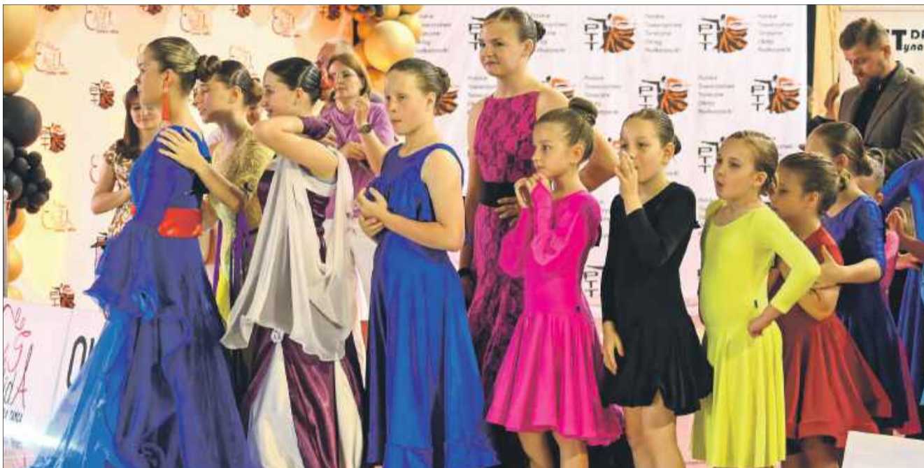
Swoich sił próbowali również młodszy tancerze.