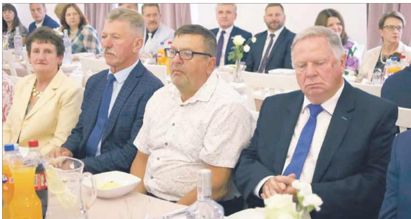
Ponad 100 osób zebrało się na wspólnym świętowaniu w Trzęsówce.