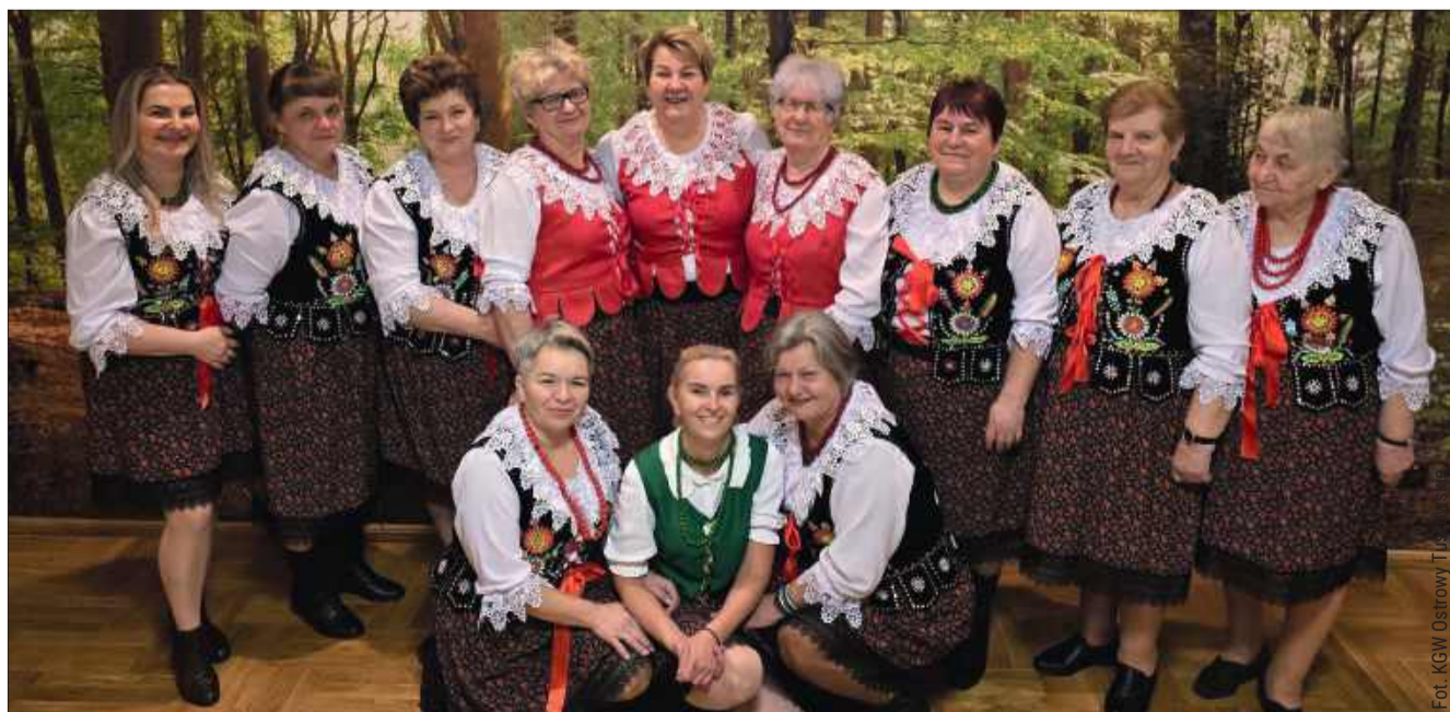
KGW z Ostrow Tuszowskich to koło, które podtrzymuje i pielęgnuje tradycje.