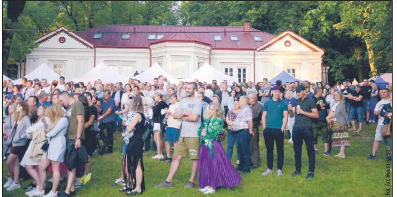
Frekwencja publiczności na Jagodowych Specjalech zawsze jest bardzo wysoka.

Organizatorzy zadbali także o najmłodszych uczestników wydarzenia. W specjalnie przy-