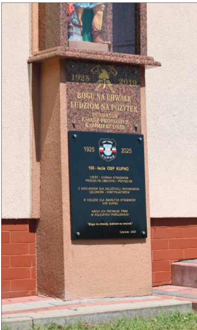
W 2025 roku, na cokole, u stóp figury Św. Floriana, pojawiła się jubileuszowa tablica. Możemy na niej przeczytać: „100-lecie OSP Kupno. Cześć i chwała strażakom – przeszłym, obecnym i przyszłym. Z szacunkiem dla założycieli, ratowników, członków i kontynuatorów. W hołdzie dla zmarłych strażaków OSP Kupno. Niech ich przykład trwa w kolejnych pokoleniach. „Bogu na chwałę, ludziom na ratunek”.