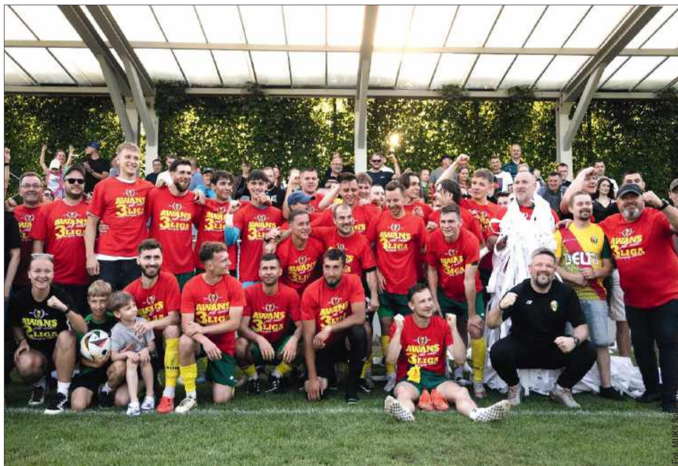
Drużyna z Kolbuszowej Dolnej zakończyła rozgrywki na szczycie tabeli.