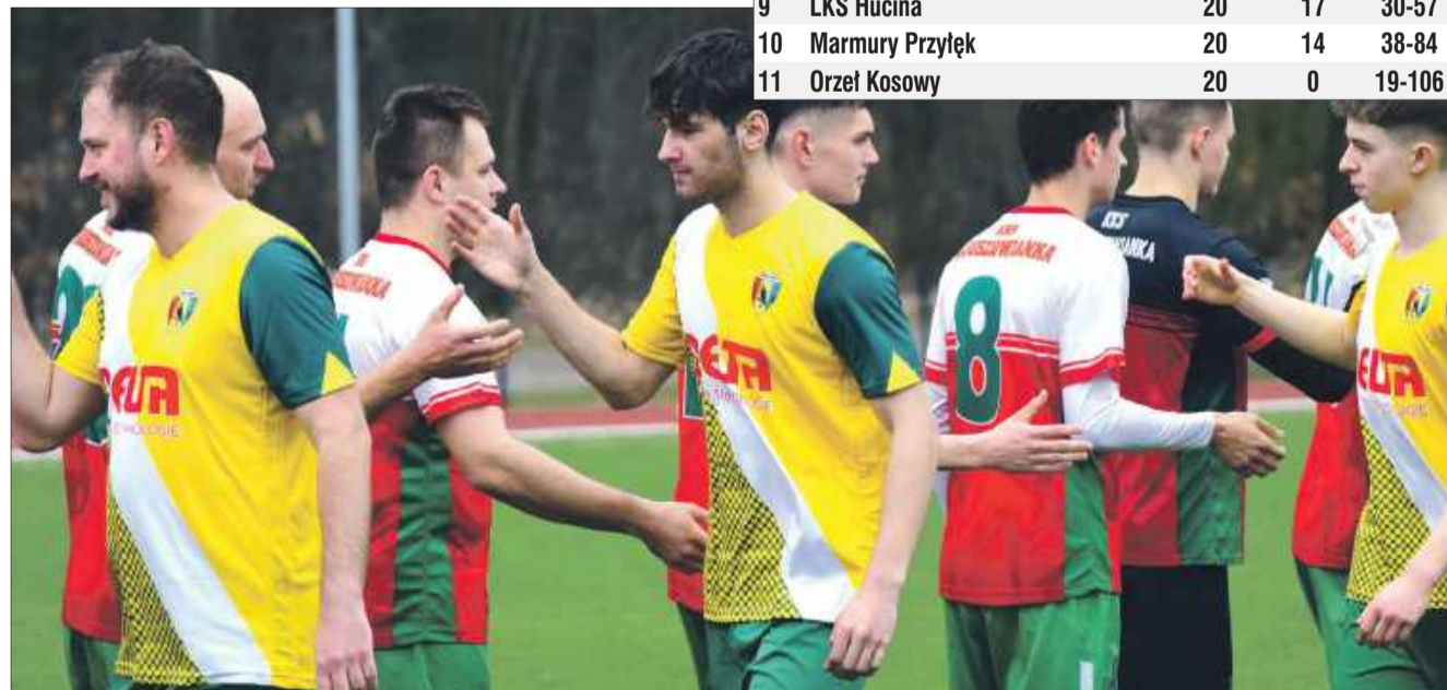
Jednym z najbardziej emocjonujących spotkań tego sezonu były derby Kolbuszowej. W niedzielę, 30 marca, KKS Kolbuszowianka stanęła do rywalizacji z MUKS Sokółem Kolbuszowa Dolna II."