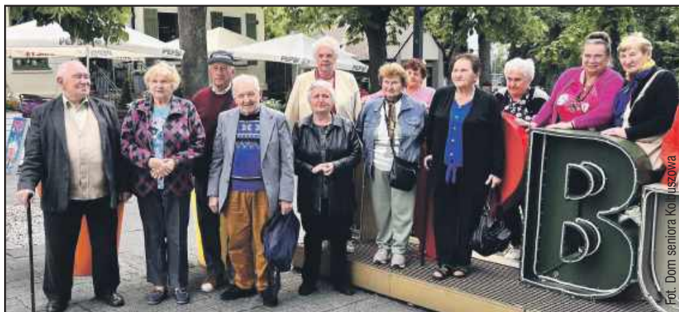
Seniorzy stanęli do wspólnego zdjęcia.

Aktywni, uśmiechnięci i pełni ciekawości świata – tak można opisać grupę seniorów z Domu Seniora Nad Nilem w Kolbuszowej, którzy we wtorek (11 czerwca) odwiedzili tętnie solankowe w Busku-Zdroju.