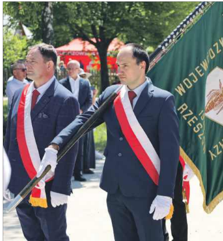
W przemarszu wzięły udział poczty sztandarowe z całego województwa.