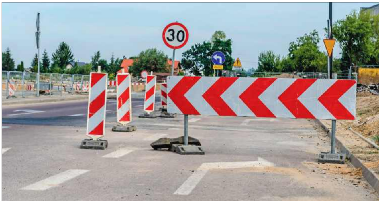
Mieszkańcy Krzątki i okolic są zaniepokojeni brakiem postępu prac na remoncie drogi wojewódzkiej nr 872. Co na to PZDW?

Zaniepokojeni mieszkańcy Krzątki od kilku miesięcy borykają się z wieloma trudnościami, związanymi ze wstrzymaniem prac remontowych na odcinku drogi wojewódzkiej nr 872. Jak podkreślają, choć w październiku 2024 roku ruszyły roboty przygotowawcze, od tego czasu nie widać żadnych postępów. Wstrzymanie robót na długie miesiące wzbudza wśród lokalnej społeczności frustrację, a także rodzi pytania o przyszłość remontu, który ma poprawić bezpieczeństwo i komfort podróży.