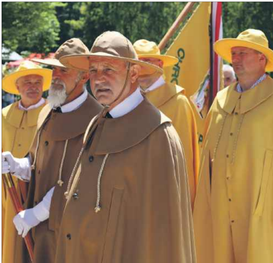
Koła pszczelarzy z całego Podkarpacia wystawiły swoje poczty sztandarowe.