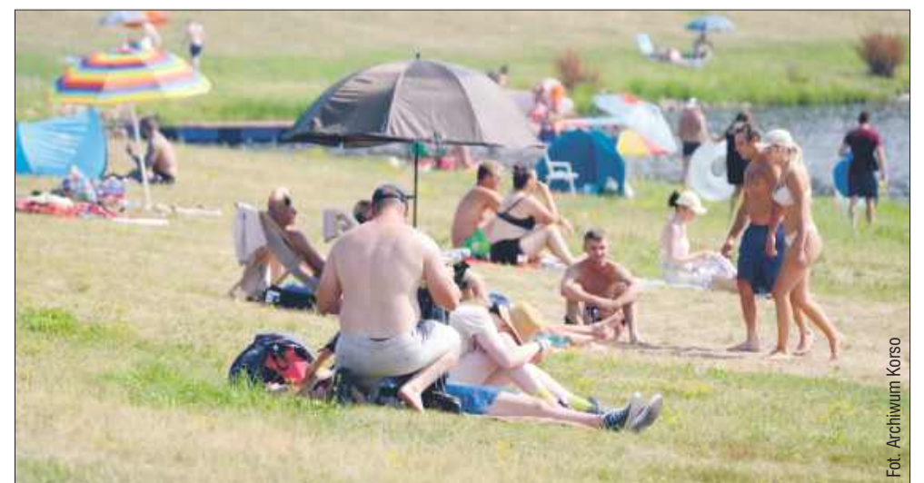
Rokrocznie Maziarnia cieszy się niemałym zainteresowaniem.