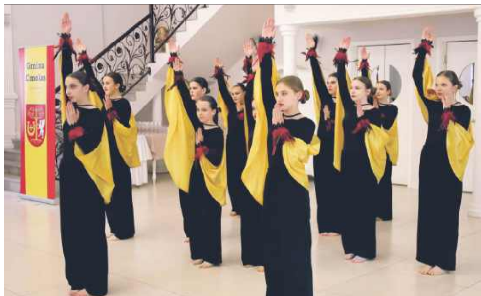
Młodzież ubarwiła czwartkowe świętowanie.