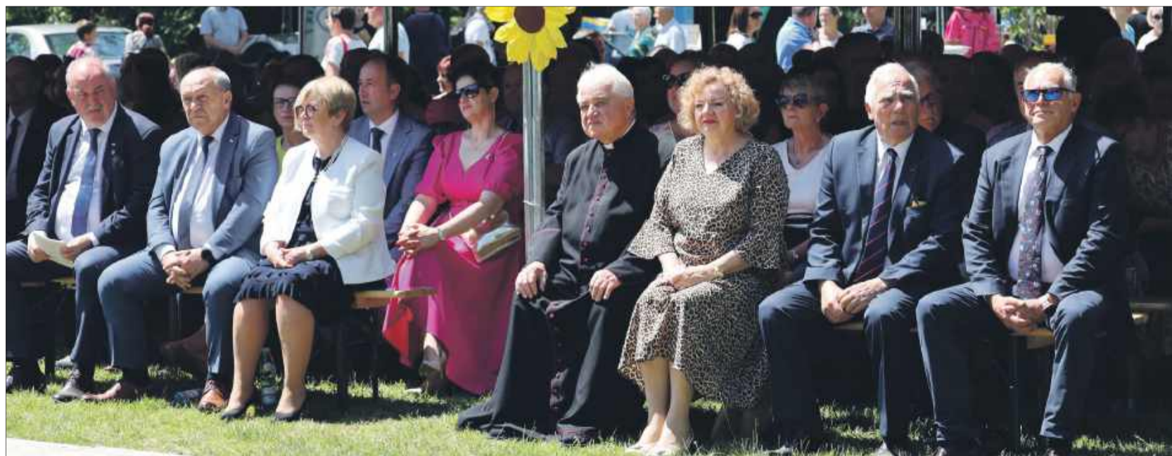
Na wydarzeniu nie zabrakło władz z Kolbuszowej i Rzeszowa.