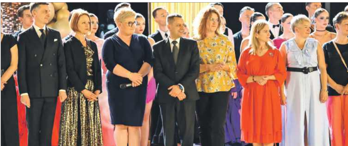
Przebieg konkursu obserwowali jurorzy i lokalne władze.