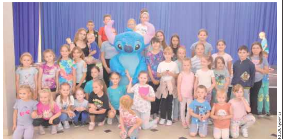
Najważniejsze podczas wakacyjnych pikników są dzieci. Trzeba przyznać, że w gminie Kąkolewnica nie mogą narzekać na nudę

W wydarzeniu wzięli udział goście z Dance&Fun z Białej Podlaskiej oraz ZZOK z Adamek. O poczęstunek zatroszczyły się Panie z KGW „Kąkolewianki”, które przygoto-