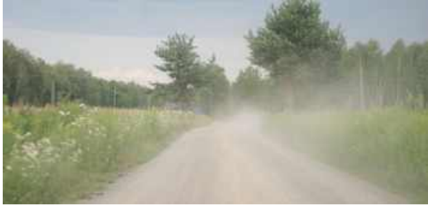
Po drodze trzeba jechać slalomem, by nie natknąć się na ubytki

KOLEMBRODY: W Kolembrodach, w dzielnicy Zakanale, znajduje się około półtorakilometrowy gruntowy odcinek drogi powiatowej, którego remontu od lat domagają się mieszkańcy. Droga łączy Kolembrody z miejscowością Mokre.