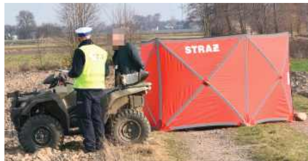
Dramat rozegrał się 21 marca tego roku w Kłębowie (gmina Ulan-Majorat)

Dramat rozegrał się 21 marca tego roku w Kłębowie (gmina Ulan-Majorat). Z ustaleń radzyńskich policjantów pracujących na miejscu zdarzenia wynikało, że kierujący quadem marki Suzuki na drodze gruntowej stracił panowanie nad czte-