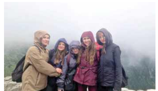
Wycieczka była bardzo udana – łączyła w sobie elementy edukacyjne, przyrodnicze, historyczne i rekreacyjne