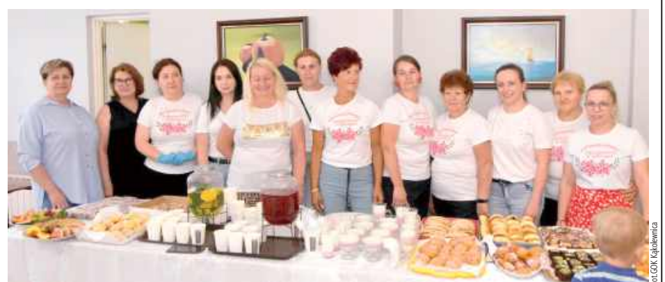
Drugi piknik to m.in. kulinarny popis pań z KGW „Kąkolewianki”