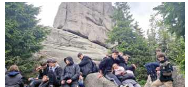
Na długo zapamiętamy te wspólne chwile