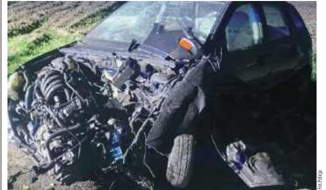
Auto zjechało z drogi, a następnie uderzyło w ogrodzenie posesji. Zostało poważnie uszkodzone

Pijany mężczyzna zakończył jazdę na ogrodzeniu. Stanie przed sądem