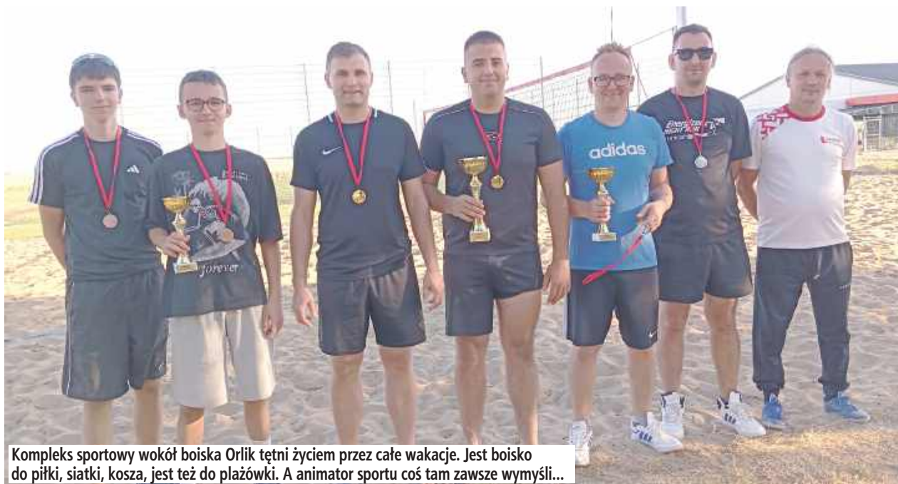
Kompleks sportowy wokół boiska Orlik tętni życiem przez całe wakacje. Jest boisko do piłki, siatki, kosza, jest też do plażówki. A animator sportu coś tam zawsze wymyśli...