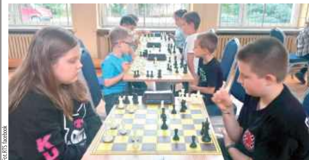
Może i pogoda w wakacje nie rozpieszcza, ale szachiści poradzą sobie przy każdej

Szachowa pasja w wakacje nie wygasa. W dniach 11-13 lipca w Radzynie rozegrano serię turniejów, w których zawodnicy Radzyńskiego Towarzystwa Szachowego (i nie tylko) mogli zrealizować normy na wyższe kategorie szachowe.