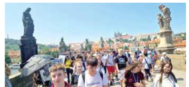
Choć trasa była wymagająca, widoki wynagrodziły wszelki wysiłek

Młodzież I LO w czerwcu pojechała na pięciodniową wycieczkę. Pod opieką nauczycieli i przewodnika uczniowie przemierzali setki kilometrów, by poznać historię, kulturę i przyrodę regionu Dolnego Śląska oraz części Czech