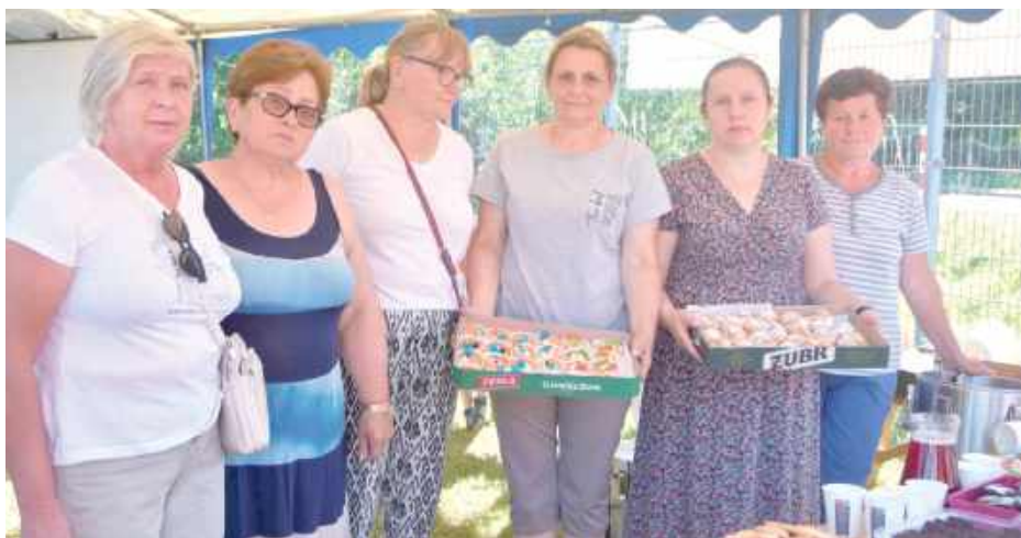
Podczas pierwszego pikniku, poczęstunek przygotowały panie z KGW ul. Południowa

Pierwsze wakacyjne pikniki w Kąkolewnicy już za nami. Premierowy odbył się na świeżym powietrzu, drugi z powodu nieprzyjemnej pogody został przeniesiony do budynku Gminnego Ośrodka Kultury.