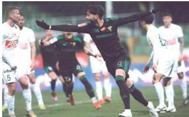
Piłkarze Górnika zanotowali ostatnio kilka zwycięstw. Ograli Wartę Poznań, Miedź Legnica czy Ruch Chorzów. W efekcie pozostają w walce o miejsce w barażach o PKO BP Ekstraklasę