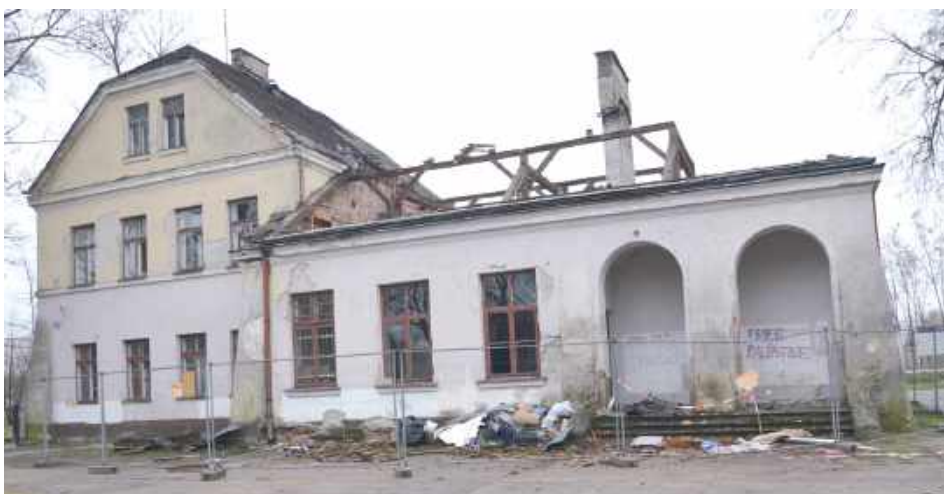
1993 roku stacja kolejowa Leopoldów została zamknięta.

- Budynek dworca w Leopoldowie jest pustostanem i brak jest zainteresowania jego komercyjnym zagospodarowaniem, a koszt ewentualnego remontu kilkakrotnie przewyższa koszt rozbiórki budynku. W związku z tym PKP S.A. wystąpiła z propozycją do Urzędu Miejskiego w Rykach nabycia przez gminę budynku przystanku osobowego w Leopoldowie. Tryb nabycia nie został określony, gdyż Urząd Miejski w Rykach dwukrotnie udzielił odpowiedzi, że nie jest zainteresowany przejęciem budynku dworca. W związku z tym PKP S.A. wystąpiła do