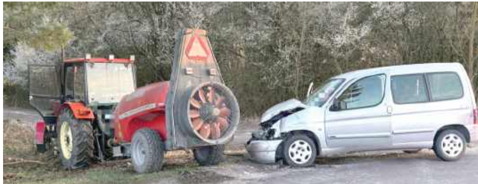
62-latek, jadąc ciągnikiem, nie ustąpił pierwszeństwa jadącemu drogą z pierwszeństwem przejazdu 35-latkowi

POWIAT OPOLSKI: Ciągnik zderzył się z Citroenem, bo jeden z kierowców nie ustąpił pierwszeństwa przejazdu. Dwie osoby wylądowały w szpitalu.