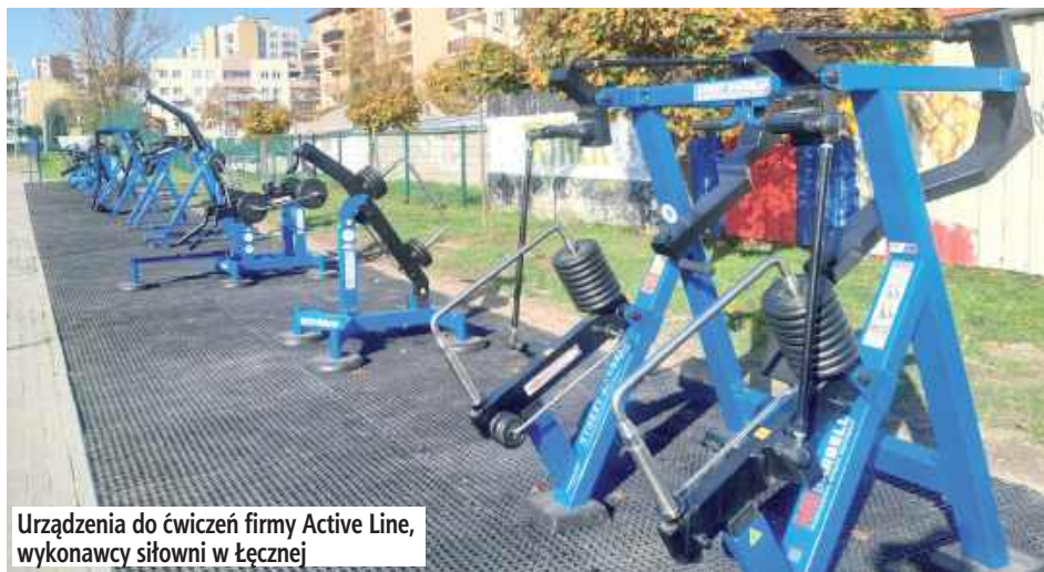
Urządzenia do ćwiczeń firmy Active Line, wykonawcy siłowni w Łęcznej

W ramach inwestycji powstanie nowoczesna siłownia plenerowa z regulowanym obciążeniem, pozwalająca dostosować intensywność ćwiczeń