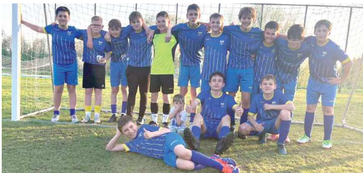
Młodzicy Ludwiniaka z kolejnymi trzema punktami. Tym razem wygrali w Piotrkowie 2:4

Młodzicy Ludwiniaka mieli do rozegrania zaległy mecz. W pierwszym terminie przeszkodził im zły stan murawy po opadach śniegu. W ubiegłą środę pogoda pozwoliła już jednak rozegrać im mecz z lokalną Piotrcovią. Po remisowej pierwszej połowie druga połowa należała już zdecydowanie do przyjezdnych, którzy ostatecznie wygrali 2:4 po dwóch golach Radosława Szurka, jednym trafieniem jego młodszego brata Wojtka i jednym trafieniem Miłosza Rzędziana. Cieszy dobra gra w wykonaniu chłopaków i łatwość w dochodzeniu do podbramkowych sytuacji. Niestety, wynik mógł