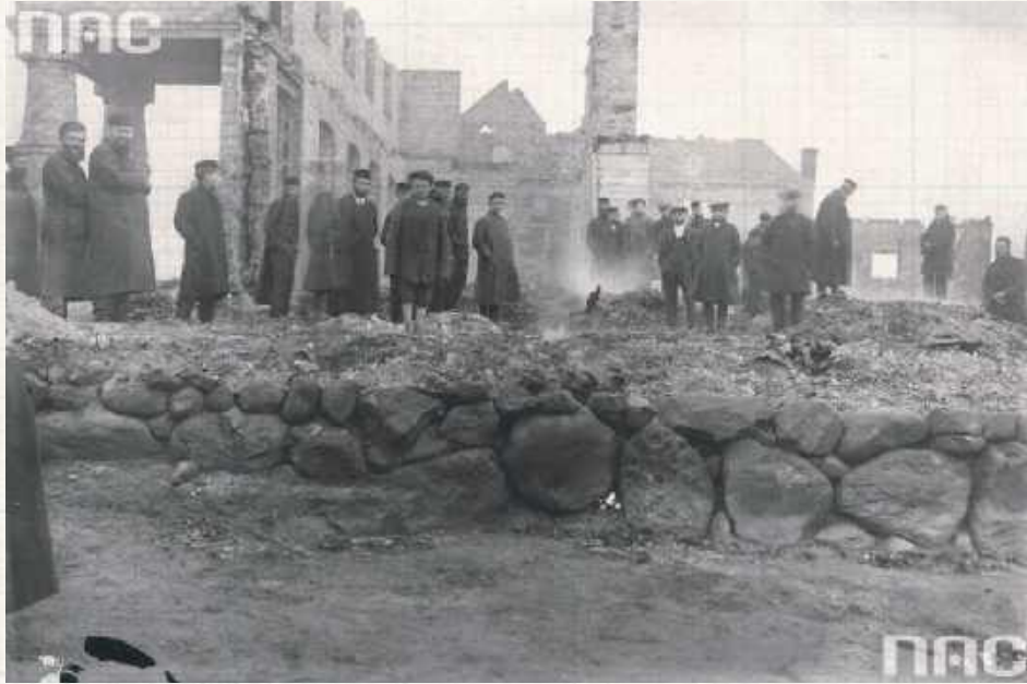
Ze zdjęcia znalezione w Narodowym Archiwum Cyfrowym, wykonanego tuż po pożarze w 1925 roku, możemy domniemywać, że rycka synagoga nie była zbyt wielka. Trudną, ale wartą przeanalizowania zagadką jest czy przy jej budowie uwzględniono też inne niż pionowe ustawienie bali wytyczne Księgi Wyjścia. Można by wtedy śmiało mówić o Rykach jako Małej Jerozolimie

Oryginalny kształt tej nowej jest dla nas mało czytelny: po tym, jak w czasie wojny została zdewastowana przez Niemców, nigdy nie odzyskała swojej funkcji religijnej. Została poważnie przebudowana, budynek powiększył gabaryty, żeby dostosować go do nowych, zupełnie świeckich potrzeb: znalazły