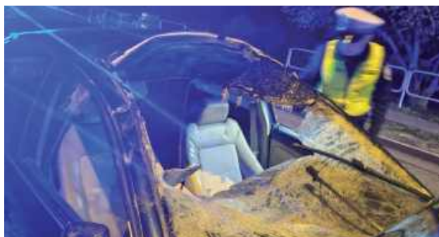
Zwierzę nie przeżyło, a pojazd uległ poważnemu uszkodzeniu

- Jako pierwsi na miejsce dotarli łączyńscy policjanci, którzy ustalili, że 45-letni mieszkaniec Białegostoku kierujący samochodem marki Volkswagen najechał na łośia, który wbiegł wprost pod nadjeżdżający pojazd. Wraz z kierującym podróżował 48-latek, który doznał poważnych obrażeń ciała i został przetransportowany do Szpitala Powiatowego w Łęcznej - informuje sierżant