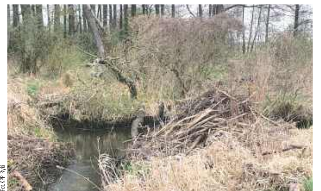
Bobry to zwierzęta objęte ochroną i niszczenie ich budowli bez zezwolenia jest zabronione

- Na miejsce interwencji skierowano policjantów z ryckiej prewencji, którzy na miejscu zastali uszkodzoną zaporę zrobotowaną przez bobry. W toku prowadzonych czynności funkcjonariusze ustalili sprawcę wykroczenia. Okazał się nim być 37-letni mieszkaniec powiatu ryckiego. Mężczyzna przyznał