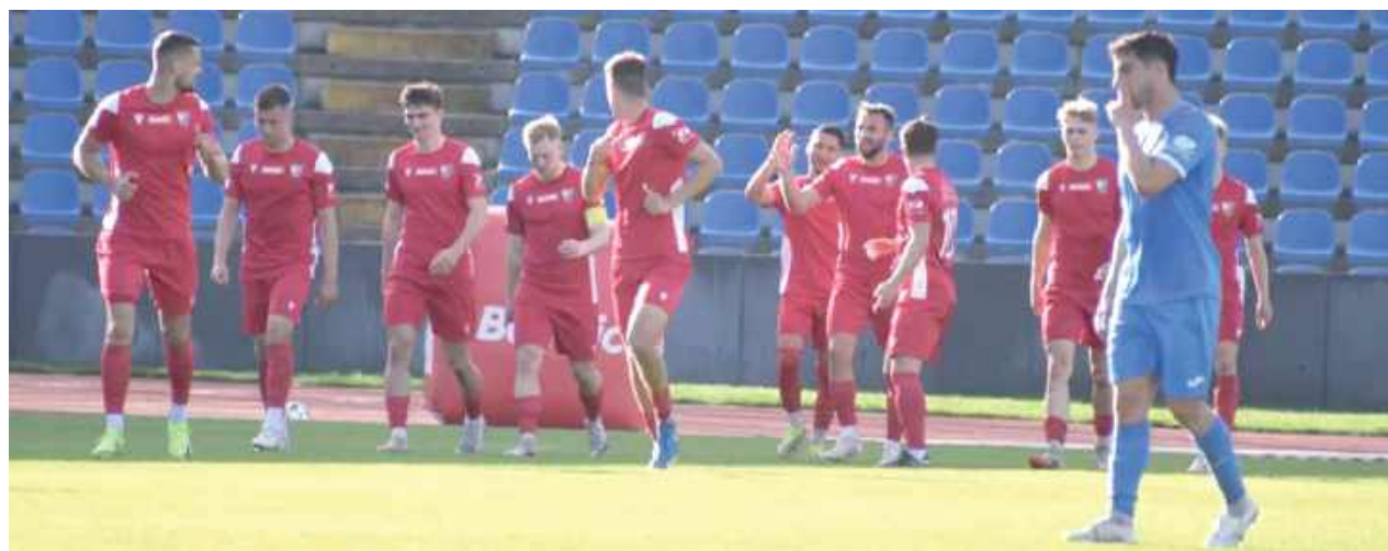
Radość puławian po голу z rzutu karnego