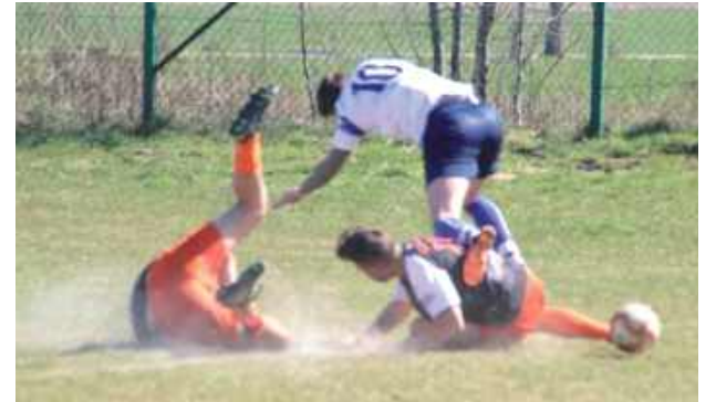
Fragment twardej walki

Nasutowianie mogli pochwalić się nowym zapleczem, które będzie służyło nie tylko seniorom, ale przede wszystkim grupom młodzieżowym, na które stawiają w KS. W siedmiu kontenerach są nowe szatnie, prysznice, toalety, łazienka dla osób niepełnospraw-