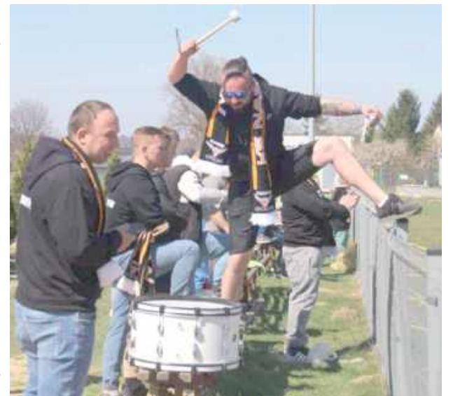
Najwierniejsi kibice KS Nasutów zagrzewali swoją drużynę do walki

nych. Jest też oświetlenie, dzięki któremu zajęcia mogą być prowadzone o każdej porze dnia.