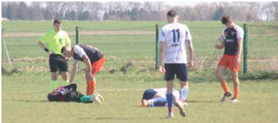
W meczu nie brakowało ostrych starć i poszkodowanych

Niecodzienny przebieg miała inauguracja nowego sezonu piłkarskiego w Nasutowie (KS przełożył pierwszy mecz). Już na początku konfrontacji z Albatrosem Świdnik groźnej kontuzji doznał bramkarz gości, a sędzia w całym spotkaniu pokazał aż trzy czerwone kartki.