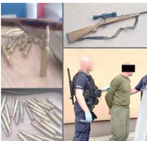
Okazało się, że 60-latek miałby narzędzie do tego, by spełnić swoje groźby. Policjanci znaleźli bowiem u niego broń palną typu sztucer Mauser z lunetą celowniczą oraz prawie 30 sztuk naboju

Sceny niczym z filmu akcji rozegrały się w ubiegłym tygodniu w gminie Puławy. Jednego dnia mężczyzna wszczął awanturę, w trakcie której popychał i szarpał kobietę. Kolejnego dnia było jeszcze gorzej. 60-latek, będąc pod wpływem alkoholu, dalej się awanturował, aż w pewnym momencie zagroził partnerce, że gdy ta go nie zamelduje w swoim mieszkaniu, spali dom, a jej odstrzeli głowę. Kobieta, obawiając się o swoje życie, powiadomiła policję. Funkcjonariusze zatrzymali agresora, ale zainteresowali się także tym, czym miałby odstrzelić kobietę. Okazało się, że 60-latek posiadał bez wymaganego zezwolenia, odziedziczoną po przodkach broń palną typu sztucer Mauser z lunetą celowniczą oraz prawie 30 sztuk naboju. Broń i amunicja zostały zabezpieczone przez funkcjonariuszy. Zostaną poddane badaniu przez biegłego z zakresu