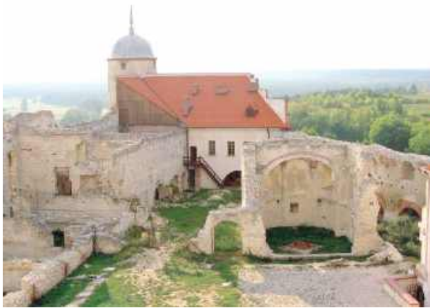
Dzięki 11-milionowej dotacji placówka muzealna w Janowcu przejdzie remont

Do przetargu przystąpiły cztery firmy, a wybrana została