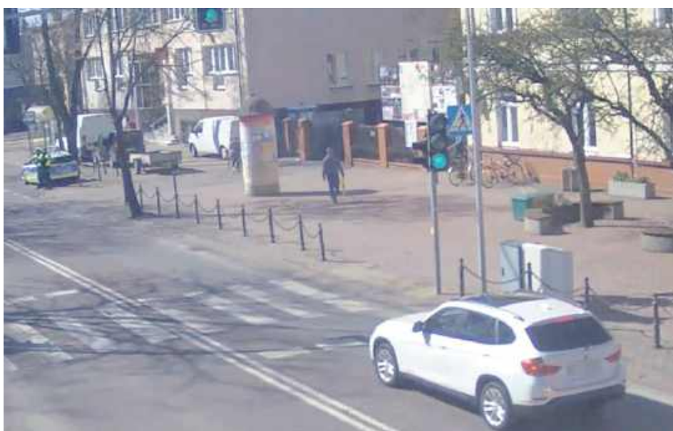
Mimo możliwości nie rozpoczęła jazdy, stojąc przed przejściem dla pieszych, zablokowała ruch znajdujących się za nią samochodów

- Przy zapalonym czerwonym świetle dla jej kierunku ruchu oczekiwała na zmianę „na zielone” i możliwość kontynuacji jazdy. Jednak po zmianie światła na sygnalizatorze, mimo możliwości nie rozpoczęła jazdy, stojąc przed przejściem dla pieszych „zablokowała” ruch znajdujących się za nią samochodów. Sytuację tą zauważyli znajdujący się w pobliżu policjanci z łukowskiej drogówki. Zatrzymana do kontroli drogowej 40-latka tłumaczyła mundurowym, że zamysliła się i nie