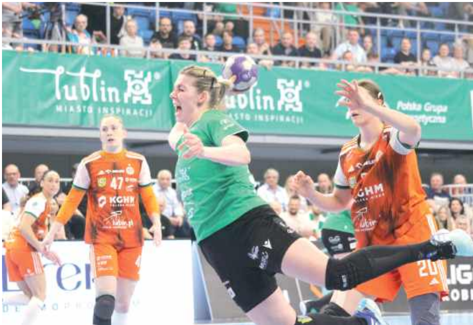
Biało-zielone zagrały jeden z najlepszych meczów w tym sezonie

Przed rozpoczęciem spotkania było jasne, że tylko zwycięstwo może podtrzymać nadzieje biało-zielonych na odebranie „Miedziowym” złotych medali. Ekipa z Dolnego Śląska wygrywała mistrzostwo Polski nieprzerwanie od 2021 roku i jest na dobrej drodze, by przedłużyć tę passę. Mimo wszystko PGE MKS FunFloor był już w stanie w obecnym sezonie pokonać Zagłębie na wyjeździe i teraz chciał dokonać tego przed własną publicznością. Zwłaszcza że ewentualny triumf skróciłby dystans pomiędzy obiema drużynami,