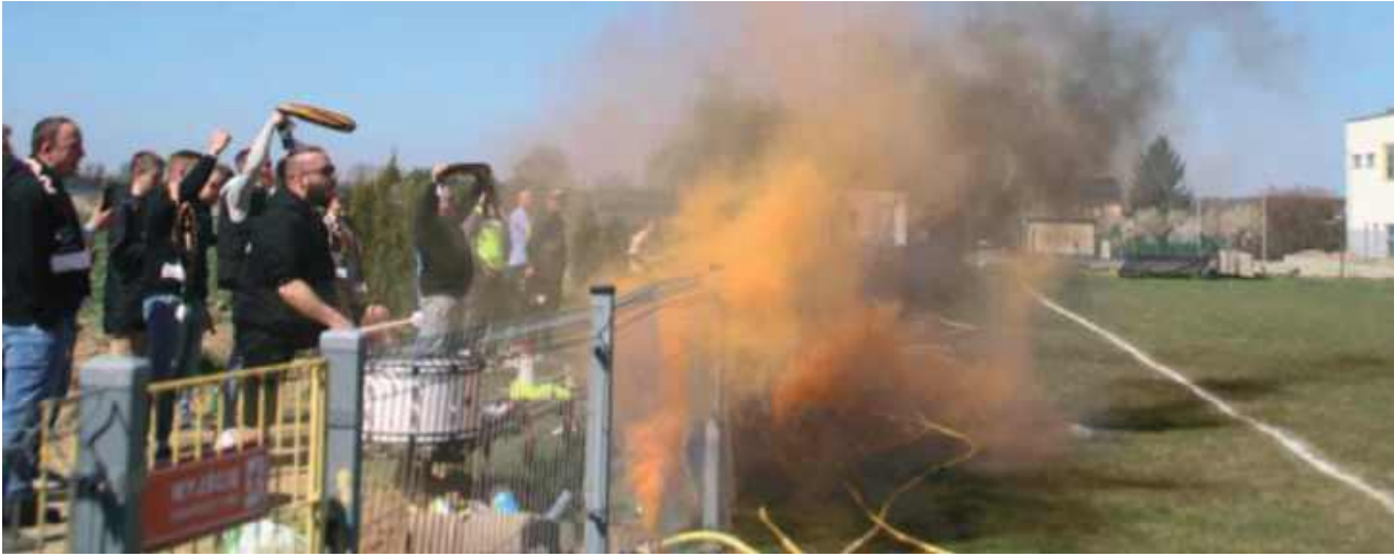
Kolorowy dym na boisku w Nasutowie

Niecodzienny przebieg miała inauguracja nowego sezonu piłkarskiego w Nasutowie (KS przełożył pierwszy mecz). Już na początku konfrontacji z Albatrosem Świdnik groźnej kontuzji doznał bramkarz gości, a sędzia w całym spotkaniu pokazał aż trzy czerwone kartki.