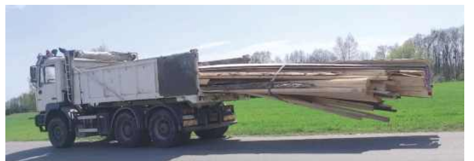
Obydwa stracili prawa jazdy, zaś pojazdy nie zostały dopuszczone do dalszego ruchu

Łęczna: Policjanci zatrzymali kierowcę, który przewoził niezgodnie z przepisami drewno. Na miejsce, pojazdem z pękniętą szybą przyjechał pracodawca. Obaj byli nietrzeźwi.