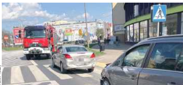
Kierowca Opla nie zachował bezpiecznej odległości i uderzył w tył Opla jadącego przed nim. Na szczęście nikomu nic się nie stało, ucierpiał jedynie pojazd

Niezachowanie należytej odległości od poprzedzającego pojazdu było przyczyną kolizji, do jakiej doszło w miniony poniedziałek (14 kwietnia) w Puławach. Ruch w centrum miasta przez kilka godzin był utrudniony.