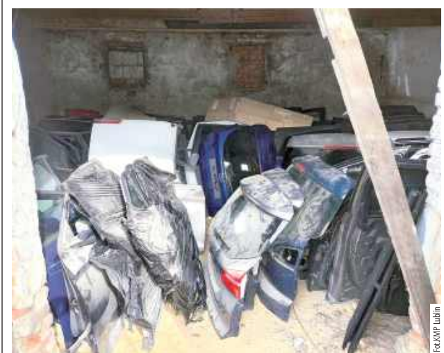
Funkcjonariusze odnaleźli elementy karoserii, silniki, skrzynie biegów, podzespoły z 8 samochodów skradzionych w Polsce oraz za granicą

Kilka tygodni temu doszło do kradzieży samochodu marki Iveco z ul. Metalurgicznej. Właściciel wartość auta wycenił na kwotę 130 tys. zł.