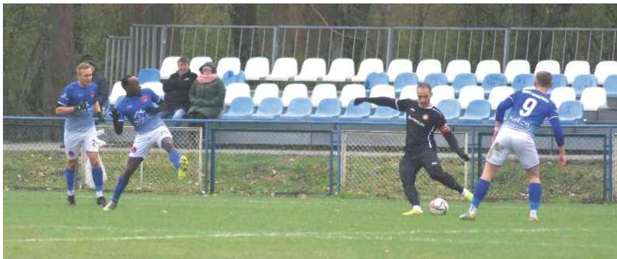
Po dobrym starcie wiosny Wiara Łęczna dwukrotnie musiała uznać wyższość rywali w meczach wyjazdowych

Ludwiniak Ludwin po bardzo dobrej jesieni, nieco zepsutej przez końcówkę rundy miał dobrą pozycję do ataku na lidera z Piask. Co więcej, pierwszy mecz był właśnie starciem z Piaskovią. Powiedzieć, że rewanż za porażkę 3:4 z Ludwina to jak nic nie powiedzieć. Rywale zdecydowanie rozbili „żółto-niebieskich” punktując ich przy każdej możliwej okazji i wygrywając 6:0. Kolejny skalp na lokalnych zespołach wzięli już tydzień później, pokonując Błękit w Cycowie 1:3. Tutaj jednak należy dodać, że błękitno-biali byli przez cały mecz stroną dominującą i tylko doskonała postawa bramkarza z Piask i bezwzględna skuteczność pod bramką strzeżoną przez Miłosza Niewiadomskiego doprowadziły do takiego stanu rzeczy. Jak się okazało tylko lider był w stanie poskromić ekipy z Ludwina i Cycowa.