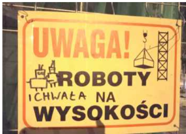
Taką tabliczkę na budowie przy ul. Marii Skłodowskiej-Curie 38 w Lublinie napotkała nasza Czytelniczka Magda