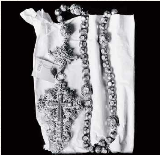
Jeden ze skarbów Szkatuły: różaniec Marii Leszczyńskiej, polskiej królowej i królowej Francji, pochodzący z I połowy XVIII w., wykonany w części ze srebra, w technice filigranu oraz twardego drewna inkrustowanego masą perłową

W 1830 roku ukochany syn księżnej Adak Jerzy, mimo że całe życie był zwolennikiem orientacji rosyjskiej, zostaje prezesem Rządu Narodowego. Wywołuje to wściekłość Moskali, którzy po wkroczeniu do Puław demolują Pałac i jego