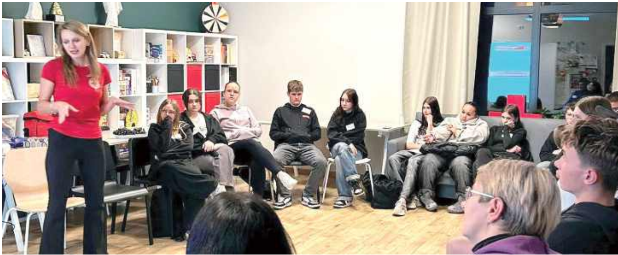
Ale krótka część teoretyczna też była potrzebna

Sztuczna krew, opatrunki i sporo emocji – tak wyglądał start Akademii Pierwszej Pomocy PCK w Opolu Lubelskim. To nowa przestrzeń dla młodzieży, która chce nie tylko wiedzieć, jak pomóc, ale też wiedzieć, jak zadziałać, gdy liczy się każda sekunda.