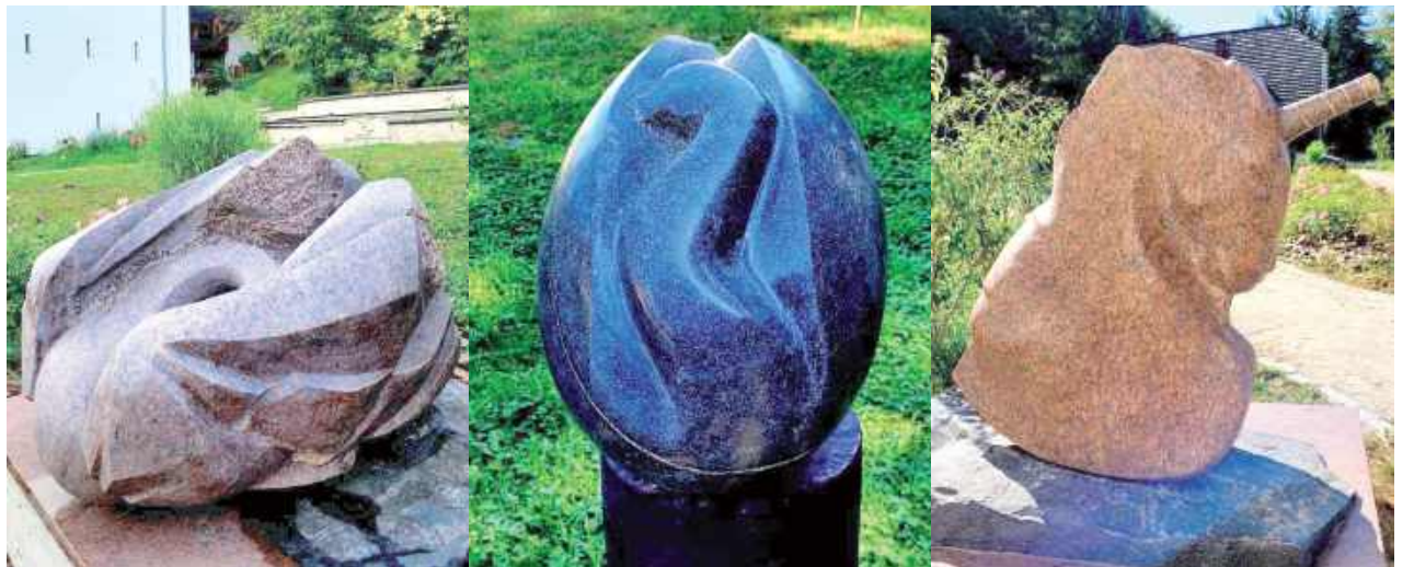
Rzeźby podziwiać można w ogrodzie przy Muzeum Przyrodniczym (ul. Puławska 54)