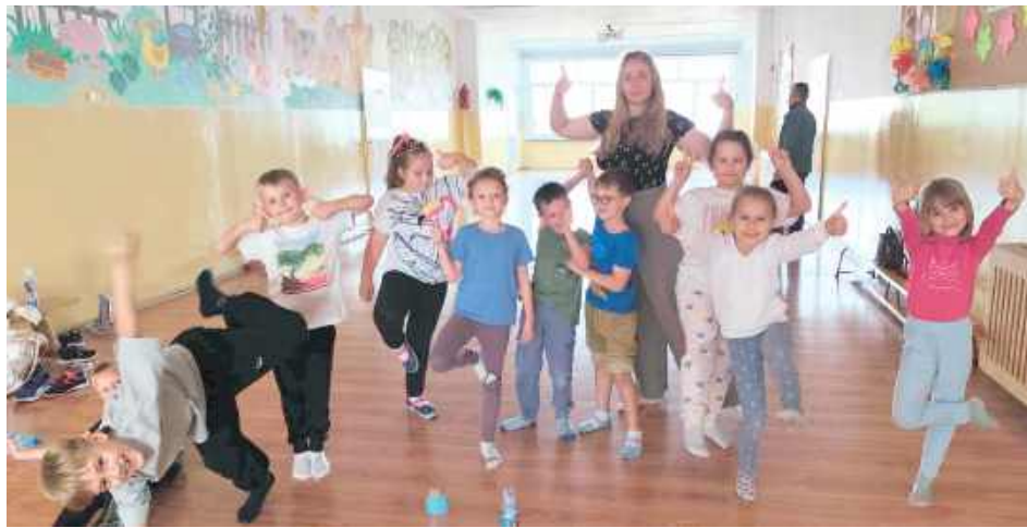
Na zajęciach dzieci mają przestrzeń do tego, czego często nie mogą robić w szkolnych murach