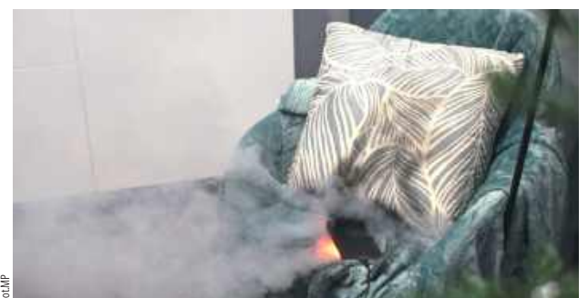
Strażacy mają możliwość zasymulowania uczniom, m.in. tego, co może stać się z telefonem pozostawionym na długo pod ładowarką i pod poduszką