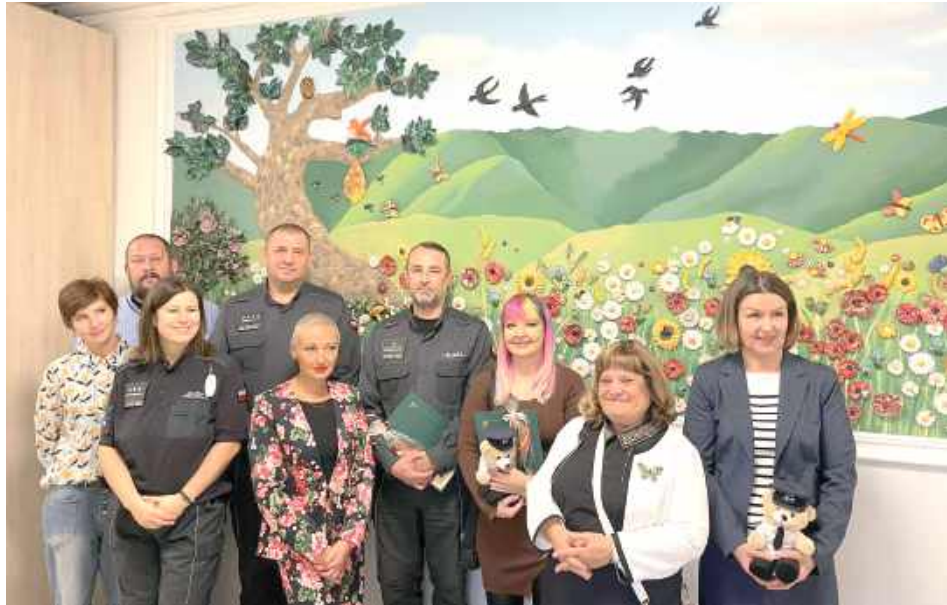
Nowa ozdoba nie tylko cieszy oko, ale przede wszystkim wspiera terapię i daje uczestnikom zajęć wiele radości