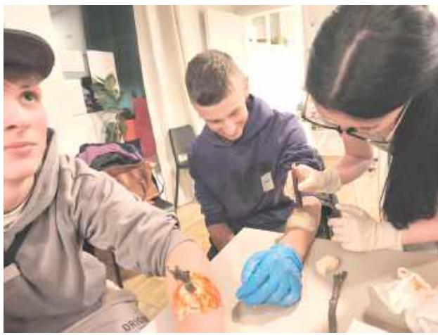
Najważniejsza i najciekawsza była praktyka. Ale najpierw trzeba było przygotować obrażenia...

Już podczas pierwszego spotkania uczniowie nie tylko ustalili zasady funkcjonowania Akademii, ale także od razu przeszli do ćwiczeń praktycznych. Tematem inauguracyjnych zajęć były