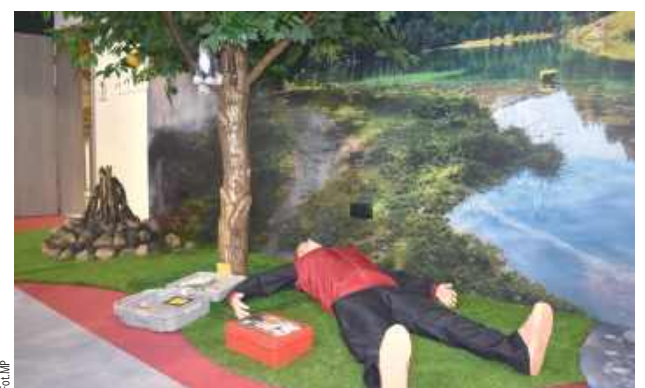
W sali „Ognik” są strefy, które symulują zagrożenia zarówno na świeżym powietrzu, jak i wewnątrz budynku