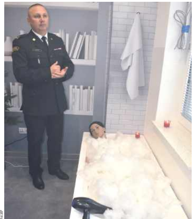
Sala edukacyjna „Ognik” jest podzielona na strefy do złudzenia przypominające zwykłe mieszkanie czy dom, gdzie mogą czyhać niebezpieczeństwa

Przygotowanie sali edukacyjnej kosztowało 230 tys. zł. Inwestycję finansowo wsparły także okoliczne gminy, z których dzieci także będą z niej korzystać.