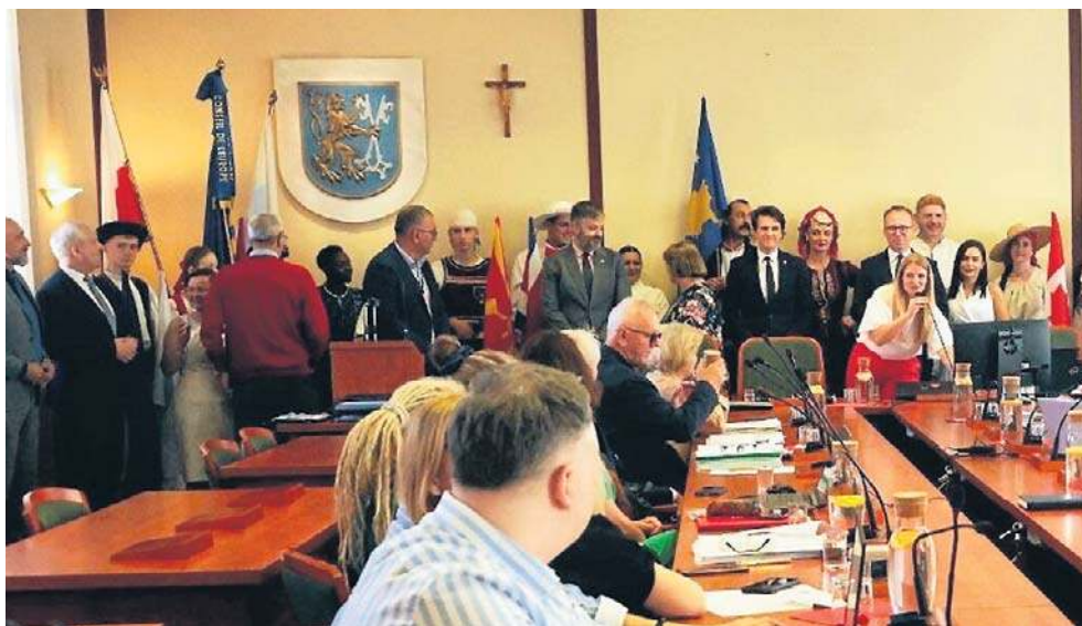
Przed remontem sali sesyjnej obok godła miasta wisiał krzyż