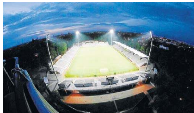
Dzięki modernizacji, powstało profesjonalne oświetlenie

Przypomnijmy, że cztery maszty z platformami oświetleniowymi zostały zamontowane w 2014 r. Po obecnej modernizacji natężenie płynące z nich światła będzie większe.