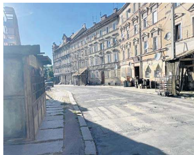
„Waterland” dostał dotację w wysokości 400 tys. zł