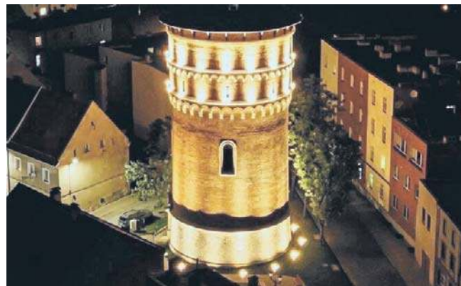
Wieża ciśnień jest ważnym elementem wodociągów, ale też upiększa Jawor

- Zainwestowaliśmy w obiekt, który od 140 lat dba o wodę i ciśnienie w Jaworze. To dzięki tej wieży nasze miasto funkcjonuje sprawnie i bez niej