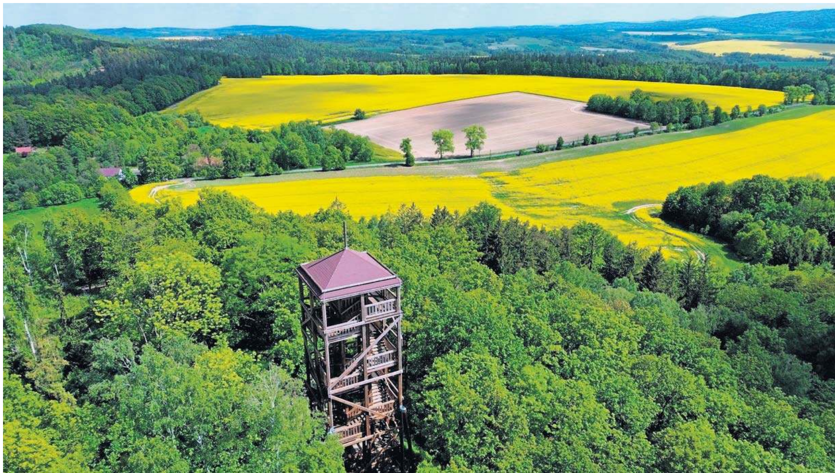
Kraina Wygasłych Wulkanów na Dolnym Śląsku to ustanowiony w 2024 r. geopark UNESCO

- Procedura wymaga do 15 minut w uwzględnieniu sygnałów ostrzegawczych, odbywając się wyłącznie w ciągu