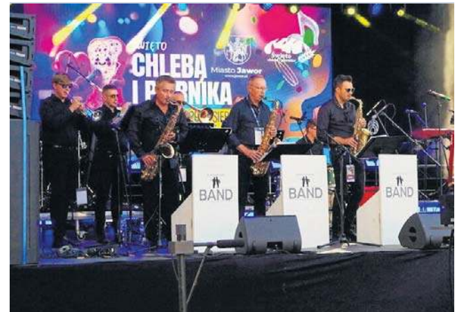
Imprezę zainaugurował korowód. Potem były m.in. wybory miss, koncerty i oczywiście smakowanie wypieków