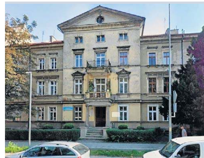
Remontowana będzie też elewacja domu przy ul. Libana 10

Wspólnota Mieszkaniowa Orzeszkowej 38 na remont po-