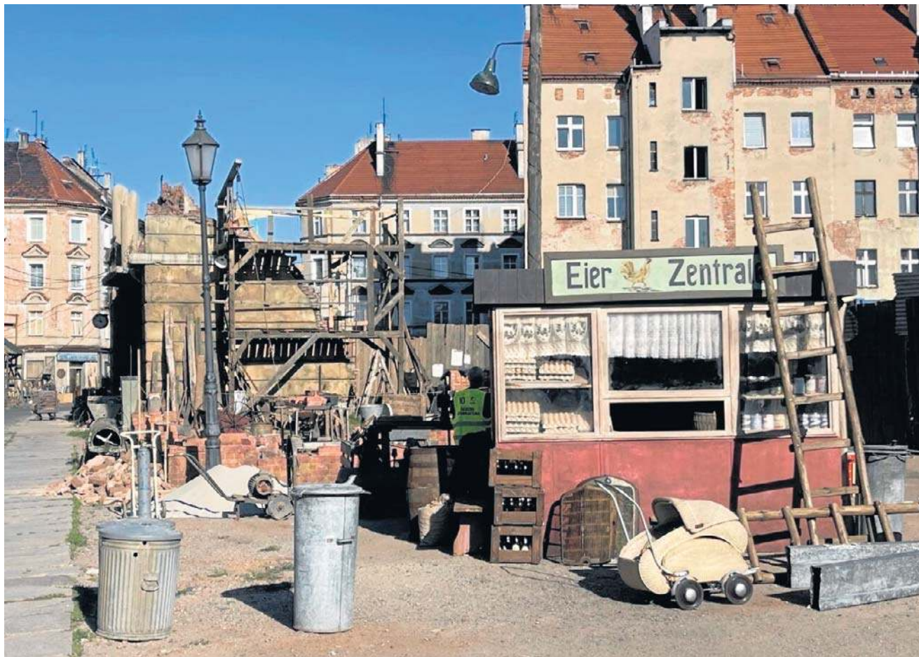
Film „Waterland” Pawła Pawlikowskiego kręcony jest na legnickim Zakaczwie

- Dolny Śląsk od lat jest miejscem, które inspiruje filmowców z całego świata. Cieszę się, że dzięki rekordowemu budżetowi, w tegorocznej edycji aż dziewięć wyjątkowych projektów otrzyma wsparcie naszego funduszu. To zarówno produkcje międzynarodowe, jak i filmy opo-