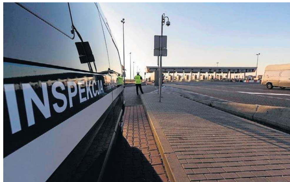
Inspekcja Transportu Drogowego uruchomiła przy ul. Zielonogórskiej punkt ważenia pojazdów

- Inspektorzy Transportu Drogowego sprawdzali też m.in. czas pracy kierowców i niektóre parametry techniczne pojazdów. W wyniku kontroli, w trzech samochodach stwierdzono usterki