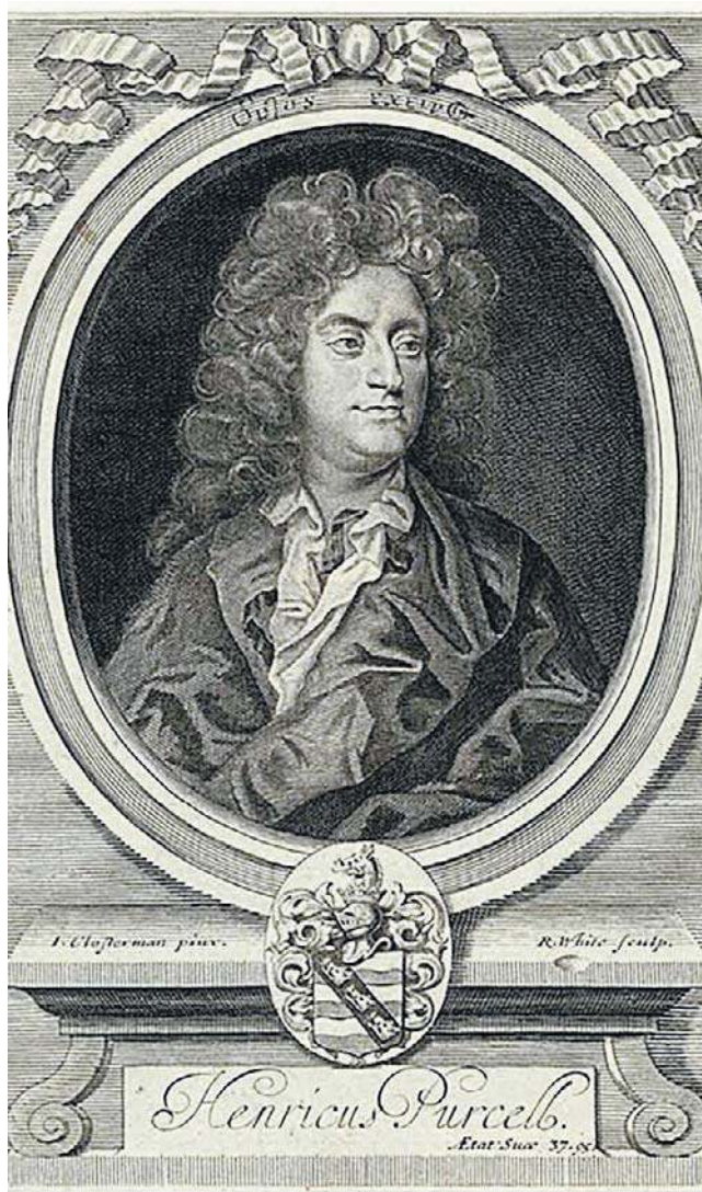
Henry Purcell (ok. 1659-1695) jest uważany - i słusznie - za jednego z najwybitniejszych twórców angielskiej muzyki epoki „pudrowanych peruk”

Akt trzeci rozpoczyna ewidentna uciecha Czarownicy widzącej rozpacz królowej Dydony. Co prawda Eneasz wyraża gotowość sprzeciwienia się woli bogów i pozostania w Kartaginie, jednak dumna Dydona nie zgadza się na to. Woli umrzeć niż poślubić człowieka, który śmiał pomyśleć o jej porzuceniu. „Lament Dydony” towarzyszy nam w jej ostatniej drodze z tego padółu.