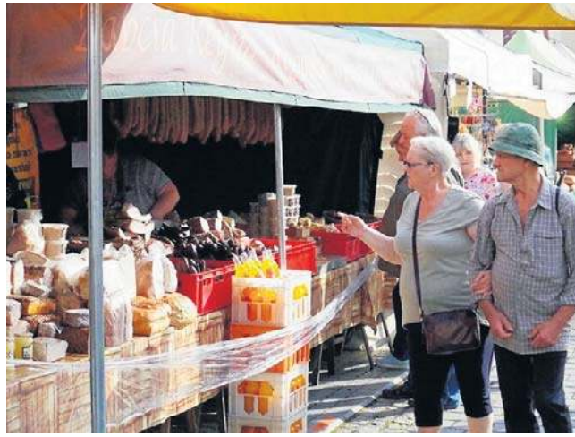
W sobotę udało się kolejny raz pobić rekord w długości piernika (zdj. z lewej). Tym razem osiągnął on 80,6 m!