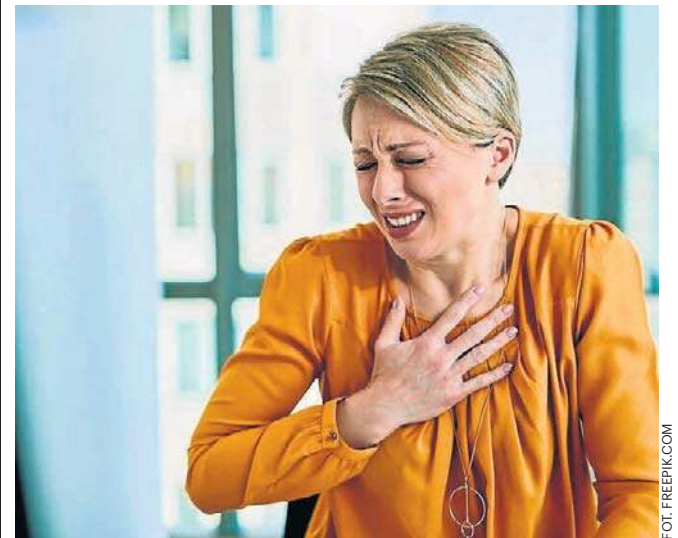
Jeden ze skutków wirusa COVID-19 szczególnie dotyka kobiety

Naukowcy podkreślają, że starzenie się naczyń krwionośnych można spowolnić poprzez zmiany w stylu życia oraz odpowiednie leczenie, takie jak obniżanie ciśnienia krwi i poziomu cholesterolu. Wczesna diagnoza i interwencja mogą pomóc w zapobieganiu zawałom i udarom w przyszłości.