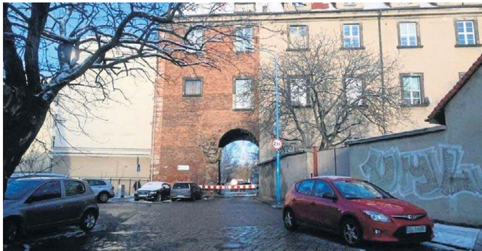
Dzięki miejskiej dotacji wyremontowana będzie brama przejazdowa na ul. Murarskiej

Parafia św. Jana Chrzciciela na renowację i zabezpieczenie