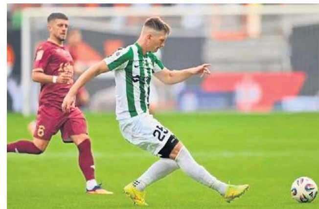
Zagłębie po dobrym, ale przegranym meczu z Wisłą Płock, teraz zremisowało z Piastem