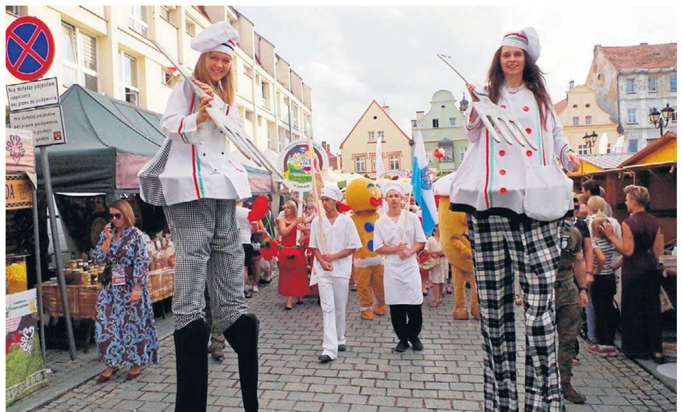
Tradycyjna, kolorowa parada z udziałem licznych parlamentarzystów, delegacji, wystawców, gości i mieszkańców