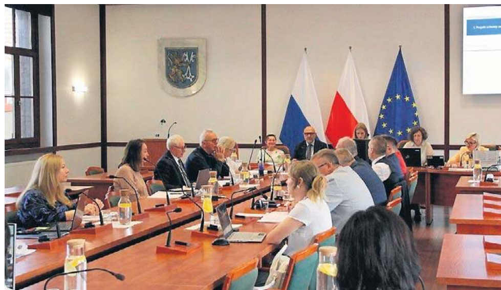
Po remoncie godło miasta powróciło, a krzyż zniknął