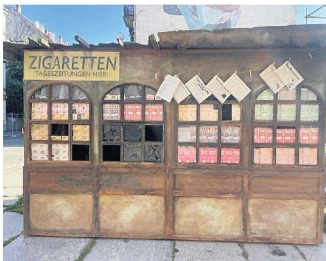
Pawlikowski zadbał o wierną epokę scenerię