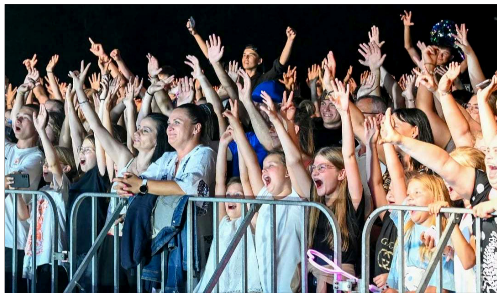
Rok 2026 zapowiada się w gminie Cmolas niezwykle intensywnie i pełen wrażeń. Wielu czeka na tegoroczne Dni Cmolasu.

Maj w Cmolasie zapowiada się pełen radości. Święto Narodowe Trzeciego Maja to okazja do wspólnego świętowania, a Mistrz Tabliczki Mnożenia oraz Gminny Konkurs Matematyczny odbędą się 19 maja w Szkole Podstawowej w Ostrowach Baranowskich. Dzień 23 maja upłynie pod znakiem Dnia Mamy, Taty i Dziecka w SOK Cmolas oraz Święta Rodziny w Ostrowach Baranowskich. Warto również zaznaczyć, że III Gminny Bieg pod hasłem „Od Smyka do Maratończyka” odbędzie się 27 maja, a Piknik Rodzinny w Porębach Dymarskich – 30 maja.