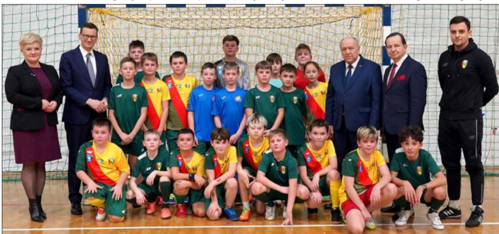
Na hali spotkał się także z trenującą młodzieżą.