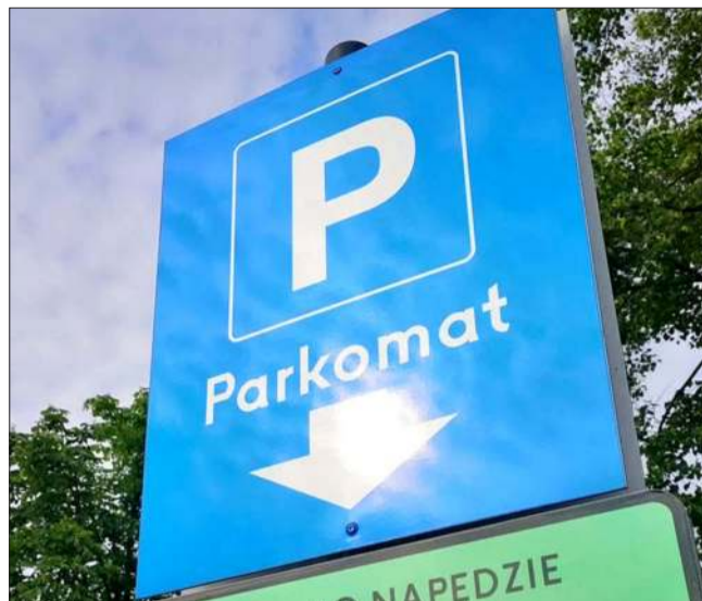
Niebawem kierowcy za parkowanie na kolbuszowskim rynku zapłacą więcej.

Mimo rozszerzenia strefy płatnego parkowania, istnieją pewne wyjątki. Zgodnie z regulaminem, zwolnione z opłat będą osoby niepełnosprawne