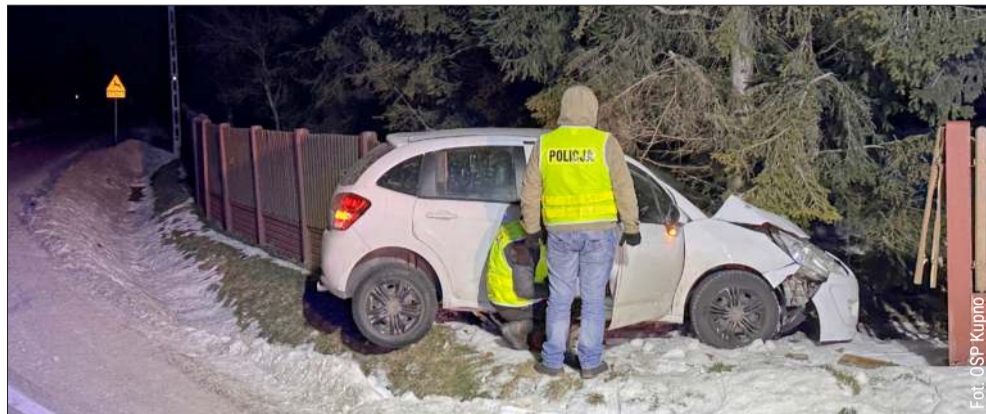
Do incydentu doszło na drodze powiatowej.

Do zdarzenia doszło w niedzielę, 1 lutego, tuż przed godziną 23 w miejscowości Kupno (gmina Kolbuszowa). Jak przekazał nam podkomisarz Adrian Kocój z Komendy Powiatowej Policji w Kolbuszowej, kierujący samochodem osobowym marki citroen C3, na rzeszowskich tablicach rejestracyjnych, wjechał w ogrodzenie jednej z posesji.