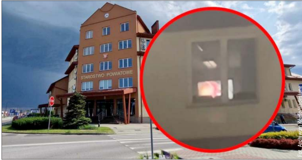
Czy w starostwie w Kolbuszowej oglądano film dla dorosłych? To będzie wyjaśniane przez urząd.

Zanim zaczęto komentować sprawę na szeroką skalę, pojawiły się wątpliwości co do autentyczności nagrania. Niektórzy użytkownicy internetu wskazywali na słabą jakość materiału,