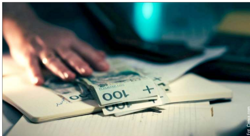
Czy małe gminy będą miały problem z utrzymaniem się i dojdzie do reformy w samorządach?

Jak czytamy na stronie portalsamorządowy.pl, problem