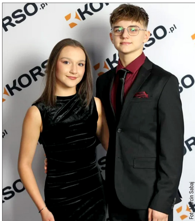
Zwycięzcy plebiscytu korso.pl.

- Co miesiąc mamy Grand Prix Polski. Od października do grudnia mamy sezon Mistrzostw, czyli Mistrzostwa Polski w tańcach latynoamerykańskich, stan-