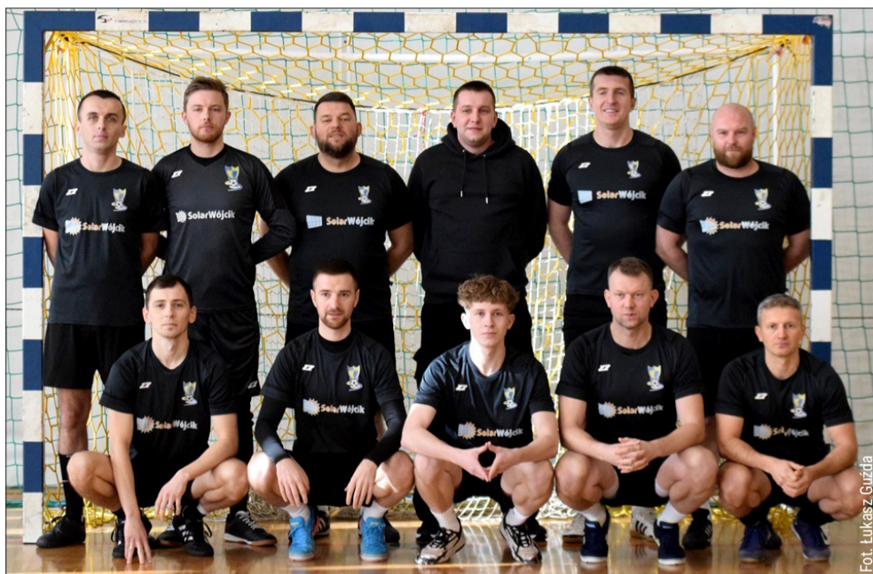
Drużyna z Ostrów Tuszowskich okazała się najlepsza w całych rozgrywkach