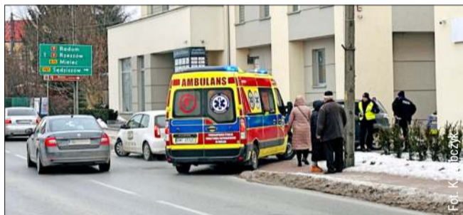
Nie obyło się bez interwencji służb.

We wtorkowe przedpołudnie, 3 lutego, w Kolbuszowej przy ul. Obrońców Pokoju doszło do nieoczekiwanego zdarzenia. Na miejscu interweniowała policja i pogotowie.