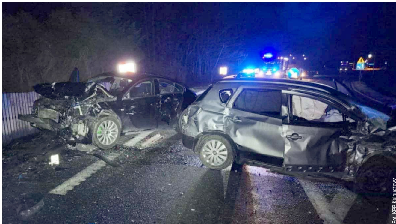
Na polskich drogach obowiązują nowe, zdecydowanie surowsze przepisy wymierzone w piratów drogowych.

Zaostrzone zostały również przepisy wobec osób tamujących lub utrudniających ruch na drogach publicznych. Zniknęła możliwość zastosowania