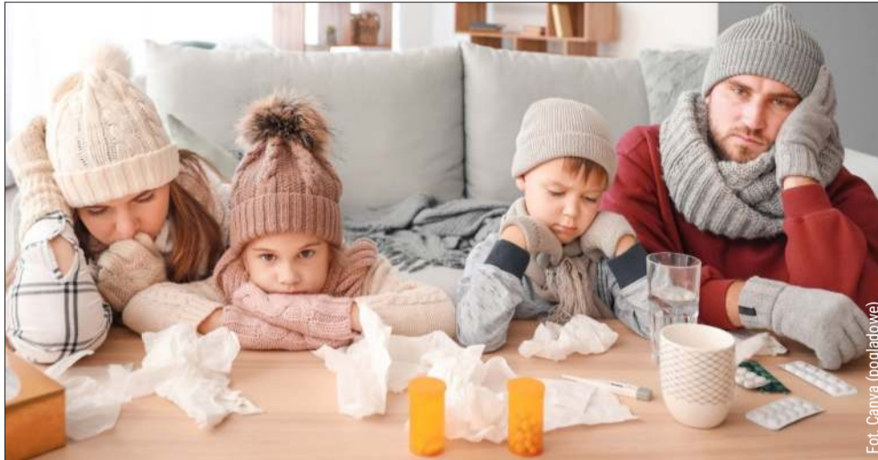
Coraz więcej rodzin w powiecie kolbuszowskim choruje na grypę.