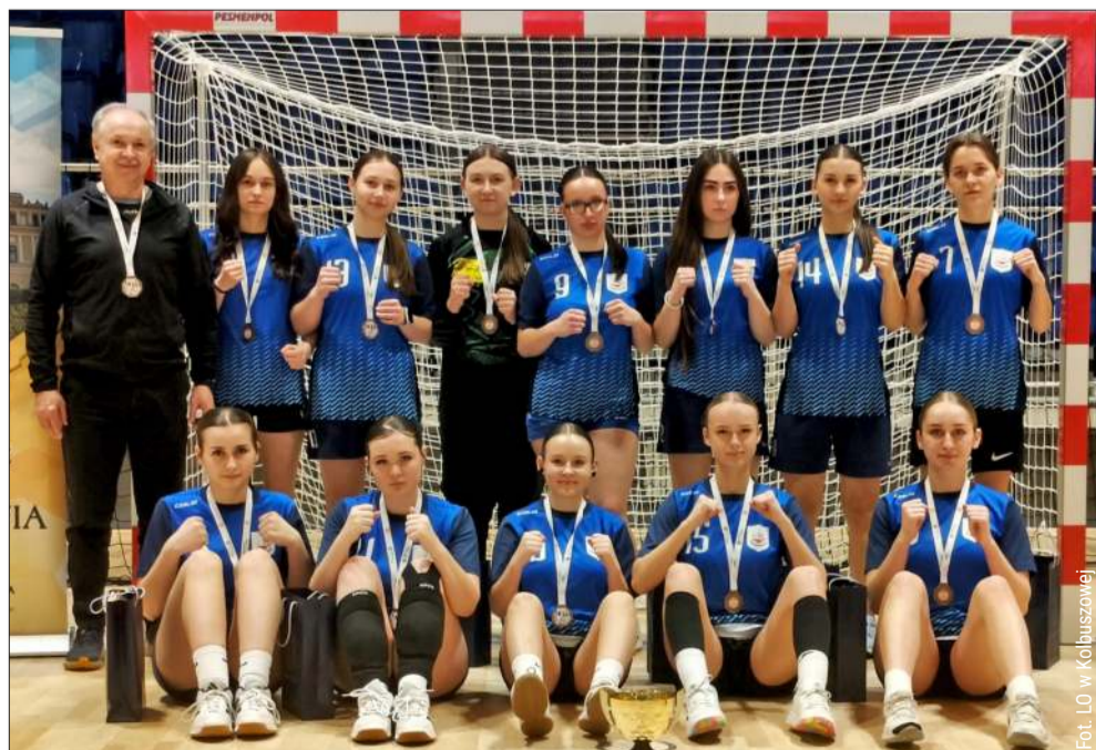
Zawodniczki z Kolbuszowej zajęły na turnieju w Jarosławiu trzecie miejsce.