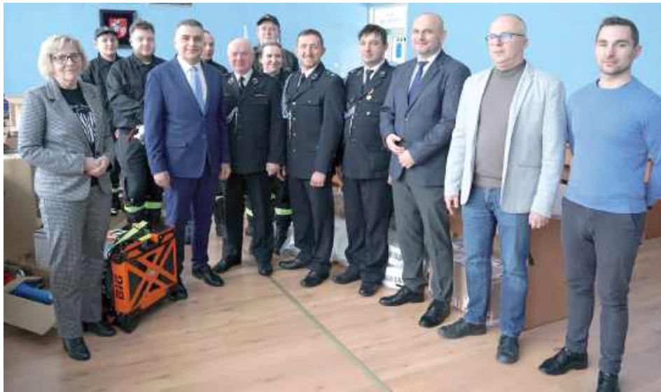
OSP we Włostowicach ma teraz do dyspozycji nowy sprzęt. Dzięki dotacji udało się zakupić m. in. sprzęt ochrony dróg oddechowych, hydrauliczny zestaw ratowniczy, odzież ochronną, kamerę termowizyjną, węże pożarnicze oraz wentylator oddymiający

Do niedawna w Polsce brakowało spójnego i skutecznego systemu ochrony ludności i obrony cywilnej. Zmieniło się to wraz z wejściem w życie usta-