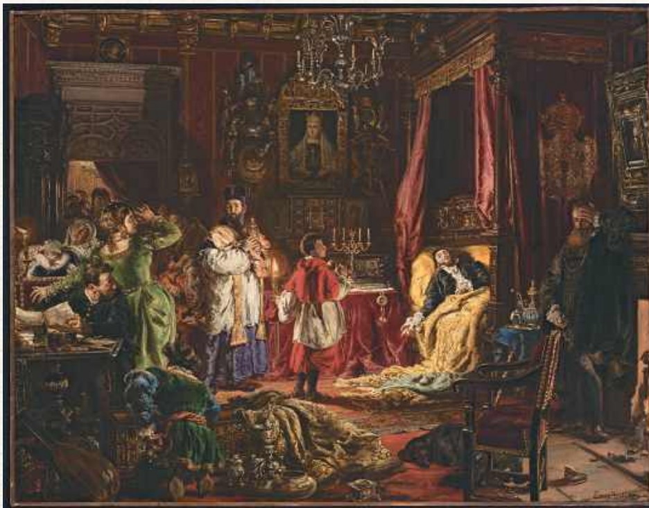
Na słynnym obrazie Matejki przedstawiającym śmierć Zygmunta Augusta Mniszechowie przedstawieni są w lewej części planu, tuż obok Giżanki. Jeden z nich przeszukuje królewską skrzynię, drugi grzebie w dokumentach. Skandal tylko na krótko obłożył ich infamią, Jerzy szybko wrócił na szczyty polskiej polityki

Objął go po nim jego najstarszy syn Jan (1541-1612). Oczywiście nie oznaczało to, że młodzieniec był przywalony mnóstwem, sprawowanych w imieniu króla, obowiązków administracyjnych czy sądowych - w tym czasie było to stanowisko w dużej części honorowe, acz stosunkowo intratne. Jan przez kilka lat w Łukowie nawet nie był, zajęty studiowa-