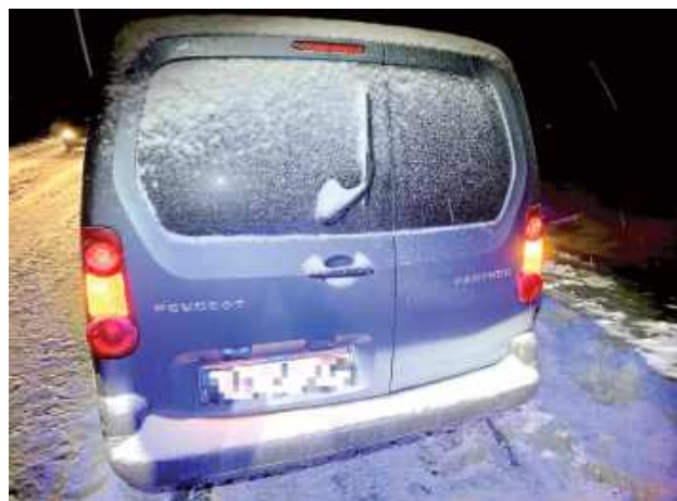
Świadkowi udało się zatrzymać pojazd, a po podejściu do kierującego natychmiast zauważył, że znajduje się on najprawdopodobniej pod działaniem alkoholu

POWIAT OPOLSKI: Tylko dzięki wzorowej postawie jednego z kierowców udało się zapobiec drogowej tragedii... Dostrzegł on jadącego wężykiem Peugeota, po czym wywnioskował, że jego kierowca może być pod wpływem alkoholu. Świadek zadziałał zdecydowanie - odebrał „podejrzanemu” kierowcy kluczyki, po czym wezwał policję.