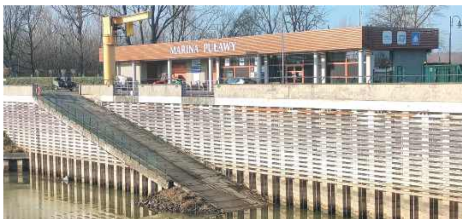
Jednym z miejsc, które ma przejść remont dzięki dotacji ma być puławska Marina

Ale skorzystać mają także mieszkańcy. Dzięki dotacji w „stolicy” powiatu modernizację ma przejść m. in. port Marina, w gminie Końskowola mają powstać punkty odpoczynku i napraw rowerów, a np. w Kazimierzu zaplanowano zagospodarowanie przestrzeni wokół przystani rzecznej.