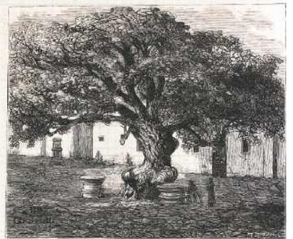
Lipa św. Stanisława w Piotrawinie nad Wisłą.

BIZYGH WISEY ILLUSTROWANE PRZEZ M. E. ANDRIOLLEGO.