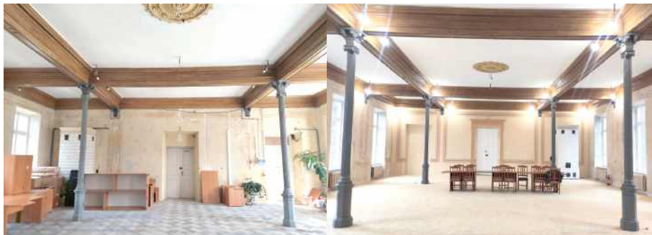
Tak Sala Rysunku prezentowała się przed przeprowadzonymi w tym roku pracami remontowo - konserwatorskimi. Różnicę po zrealizowaniu remontu widać gołym okiem

Tuż przed Bożym Narodzeniem zakończył się drugi etap prac w Sali Rysunku. Specjaliści dokonali m. in. konserwacji malarskiej wystroju ścian oraz odtworzyli zamurowany wcześniej otwór drzwiowy. Ale to nie koniec przywracania dawnego blasku temu miejscu.