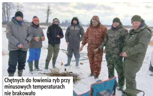
Chętnych do łowienia ryb przy minusowych temperaturach nie brakowało

Mistrzostwa w łowieniu ryb w gm. Baranów są tradycją od wielu lat. Za organizację wydarzenia odpowiadało Koło PZW Meandry