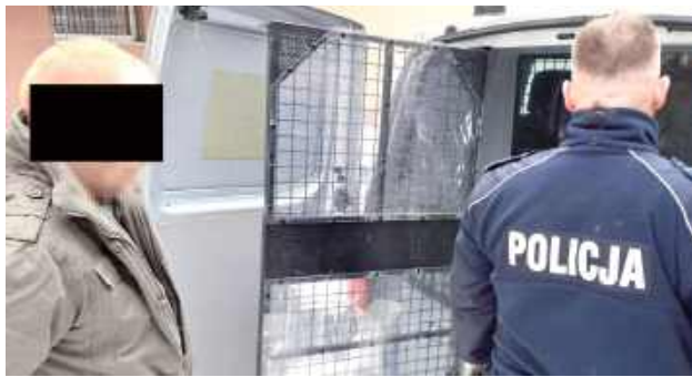
50-latek, grożąc ekspedientce nożem, zabrał ze sklepowej kasy utarg w wysokości 1,5 tys. zł. Teraz będzie odpowiadał za rozboj z użyciem niebezpiecznego narzędzia

Nawet 20 lat odsiadki grozi mieszkańcowi Puław, który zastraszył nożem kasjerkę i zabrał pieniądze z kasy w sklepie na jednym z puławskich osiedli. Sąd aresztował go na 3 miesiące.