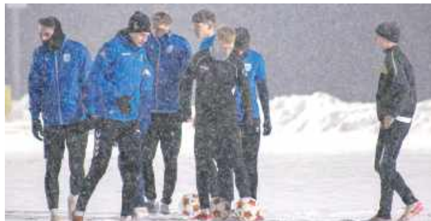
Wicelider z Lubartowa już trenuje. Jest ciężko, ale pracować trzeba

W minionym tygodniu piłkarze Lewartu wznowili treningi grupowe, inaugurując zimowy okres przygotowawczy. Zajęcia odbywały się w wymagających, typowo zimowych warunkach, co jednak nie wpłynęło na zaangażowanie zawodników.