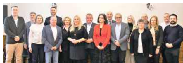
W składzie Powiatowej Rady Rynku Pracy znajduje się 13 osób

Pierwsze posiedzenie zorganizowano 8 stycznia. Powiatowa Rada Rynku Pracy ma pełnić istotną rolę opiniotwórczo-doradczą w sprawach związanych z funkcjonowaniem rynku pracy,