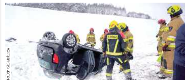
30-letni kierowca z Warszawy nie dostosował prędkości do warunków na jezdni, stracił panowanie nad pojazdem, uderzył w bariery, a następnie dachował w rowie

Niedostosowanie prędkości do warunków panujących na drodze było przyczyną kolizji, do jakiej doszło na drodze ekspresowej S12/S17 na wysokości Kurowa.