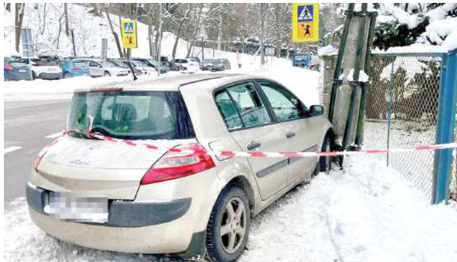
23-latką na łuku drogi chciała uniknąć zderzenia z innymi samochodami, odbiła kierownicą w prawo i w rezultacie uderzyła w słup energetyczny

Niedostosowanie prędkości do warunków jazdy było przyczyną kolizji w Nałęczowie. Młoda kobieta nie zapanowała nad autem i jazdę osobowym Renault zakończyła na słupie energetycznym.