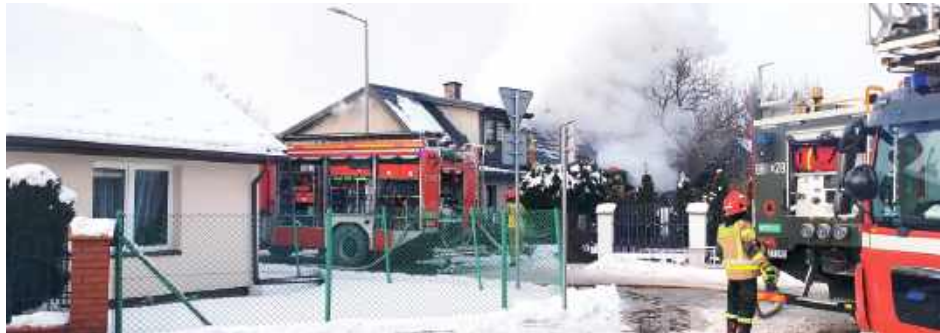
Dom starszej pani spłonął doszczętnie. Najważniejsze, że nikt nie poniósł śmierci

Do zdarzenia doszło 13 stycznia około godziny 13:20 w domu przy skrzyżowaniu ulic Przechodniej i Wiatracznej. Zgłoszenie wpłynęło do straży pożarnej, a na miejsce natychmiast wysłano trzy zastępy ratowników. Pożarem ca-