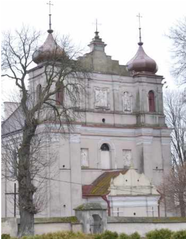
Tak prezentuje się markuszowska świątynia po przeprowadzeniu robót budowlanych i prac konserwatorskich. Wcześniej z szarego obiektu z daleka było widać odpadającą elewację