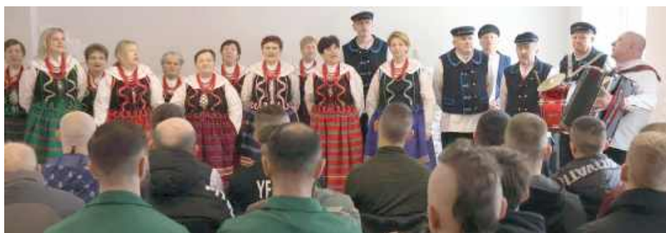
Koło Gospodyń Wiejskich „Zagrody Razem” wzięło udział w koncercie dla więźniów w Zakładzie Karnym w Lublinie. Jak sami przyznają, było to nowe doświadczenie

Najbardziej rozchwytywane koło z powiatu puławskiego ma za sobą już wiele koncertów m.in. podczas dożynek, konkursów muzycznych czy występów telewizyjnych. Ich prezentacje