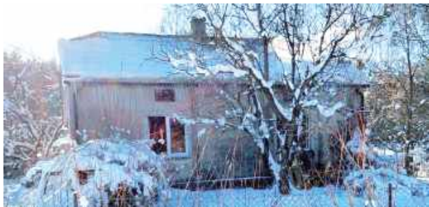
Wewnątrz panowała zerowa widoczność, co zmusiło ratowników do pracy w pełnym rynsztunku i aparatach tlenowych

Ciszę mroźnego poranka przerwał przesywający dźwięk syren, który zwiastował dramat rozgrywający się w jednym z tutejszych domów. Tuż po