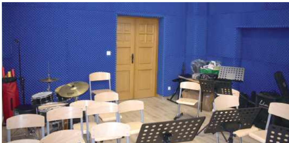
W sali muzycznej zamontowano piankowe panele akustyczne, które ograniczą dźwięki z innych pomieszczeń. W tym miejscu ma również powstać studio nagraniowe

Teraz aż chce się wracać do takiego miejsca. Po wielu miesiącach remontu kadra i wychowankowie MDK-u mogą pracować i prowadzić zajęcia w zupełnie innych warunkach. Co się zmieniło?