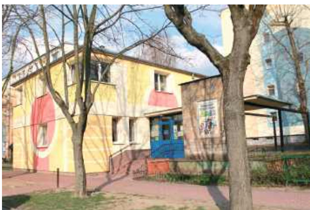
PSM chce sprzedać działkę w centrum miasta wraz z budynkiem

Puławska Spółdzielnia Mieszkaniowa kończy działalność Osiedlowego Domu Kultury „Amik” przy ul. Skłodowskiej-Curie. Działka z budynkiem w centrum miasta została wystawiona na sprzedaż.