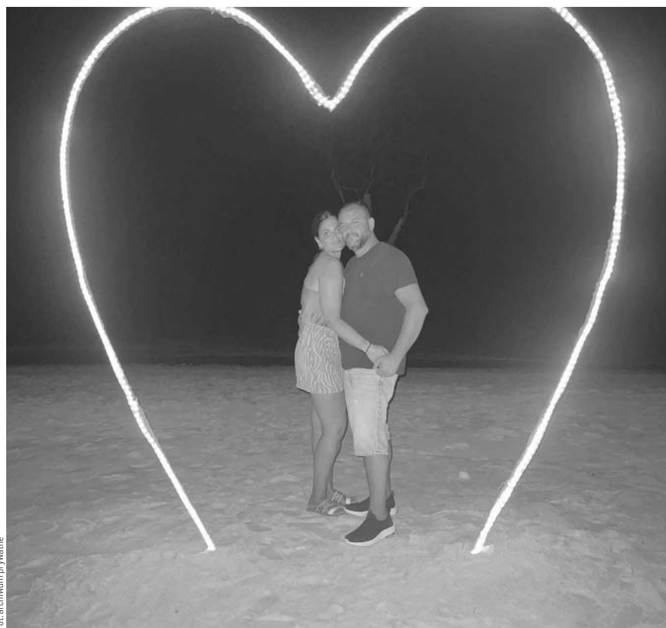
Dzieci to moje największe szczęście i motywacja do działania