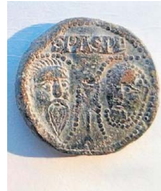
Bulla Papińska z przełomu XIV i XV wieku