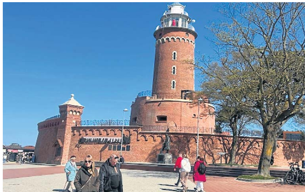
Kołobrzeg to raj dla kuracjuszy. Nazywany jest „perłą Bałtyku”. To najbardziej popularne uzdrowisko w kraju. Znajduje się tutaj kilkanaście sanatoriów i szpitali uzdrowiskowych

No tak, gdyby każdy pacjent opowiadał medykowi szczegółową historię swoich chorób, to