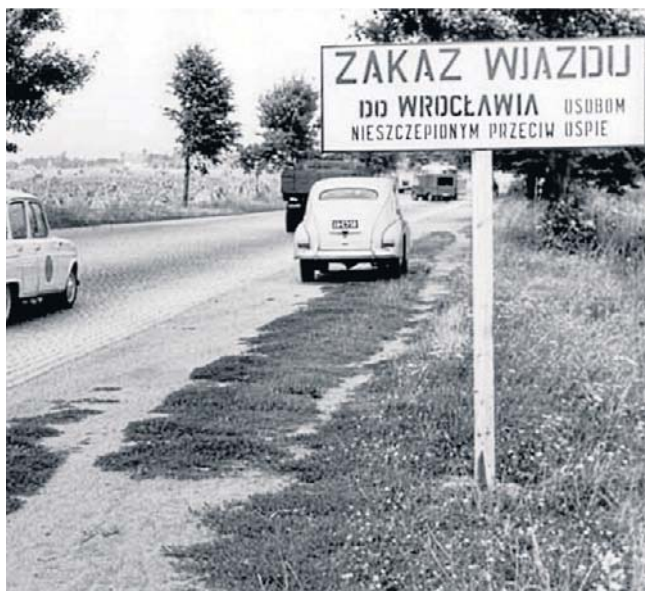
We Wrocławiu w maju 1963 r. wybuchła jedna z ostatnich w Europie epidemii ospy prawdziwej. Stan epidemii ogłoszono 17 lipca, odwołano go po kilku tygodniach, 19 września

miany ospy prawdziwej zabiły nawet ponad 80 proc. osób zarażonych. Najwyższą umieralność obserwowano u osób nieszczepionych.