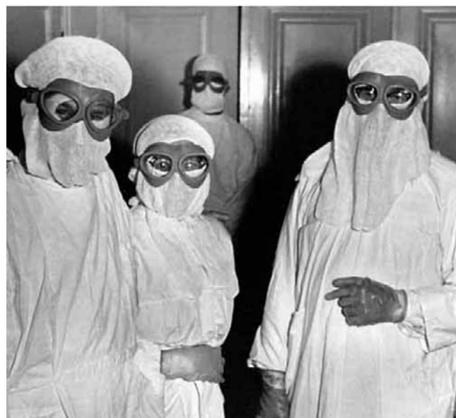
Ubiór ochronny służby zdrowia w okresie epidemii we Wrocławiu. Zachorowało 99 osób (najwięcej było pracowników służby zdrowia), z których siedem zmarło, w tym cztery to lekarze i pielęgniarki

Co ciekawe, pojawiają się głosy, że wyeliminowanie ospy odrąbiono nieco na wyrost. Jest bowiem wielce prawdopodobne, że nie wszystkie kraje zastosowały się do Konwencji o zakazie prowadzenia badań,