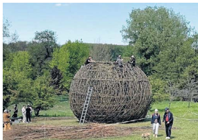
„Gniazdo” to nowa atrakcja dla odwiedzających Zespół Pałacowo-Parkowy w Ostromecku. Rzeźba z wikliny ma średnicę 8 metrów i wysokość 6 m. Do wykonania tej konstrukcji zużyto ponad trzy tony wikliny

Jak już informowaliśmy, prace nad instalacją rozpoczęły się 1 maja, a przygotowanie całej konstrukcji trwało 10 dni. Przy „Gnieździe” stanie jeszcze tabliczka informująca o projekcie, natomiast oficjalne odsłonięcie rzeźby planowane jest w czerwcu. ©©