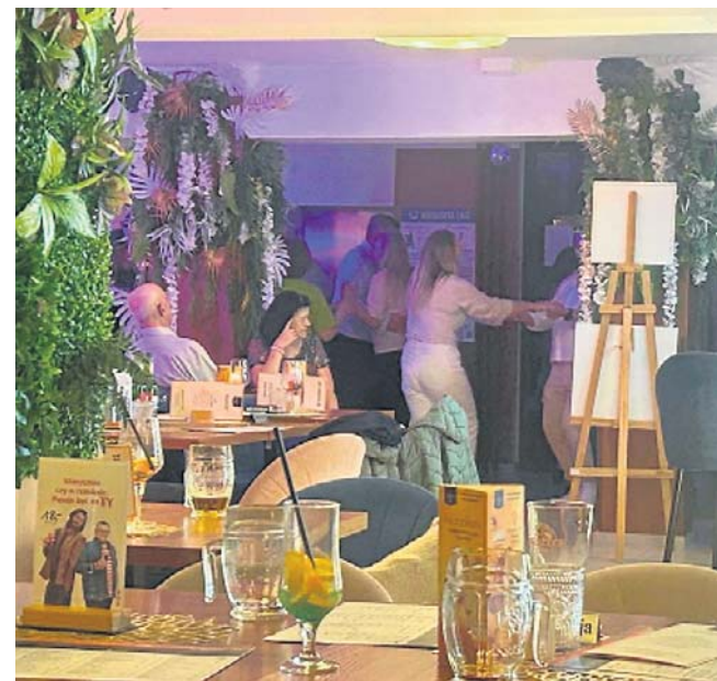
Tańce na dansingu lepsze niż rehabilitacja? Stawy i kręgosłup odpuszczają, a ciśnienie wariuje

- Niby stare ludzie, a bawią się tymi guzikami jak małe dzieci - komentuje pan z obsługi, tzw. „złota rączka”. - Raz na tydzień muszę wymieniać przyciski, któ-