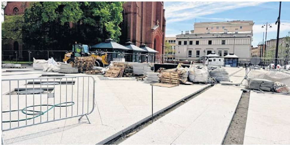
Nowy Plac Wolności reklamowano jako zieloną arkadę. A co wychodzi z worka?

W każdym razie zamieszanie ze stacjami ładowania na pewno nie pomoże w rozwoju rynku aut elektrycznych, nie tylko nad Brdą. A rynek ten u nas i tak nie rozkwita w prognozowanym kilka lat temu tempie - głównie z powodu niedostatków infrastruktury, zwłaszcza szybkich, nowoczesnych stacji ładowania. Możemy zatem kilka kolejnych lat na drodze do klimatycznej katastrofy spędzić na akademickich sporach o to, czy bardziej zatruwają środowisko spaliny z rur wydechowych, czy raczej zużyte akumulatory. Z poważ-