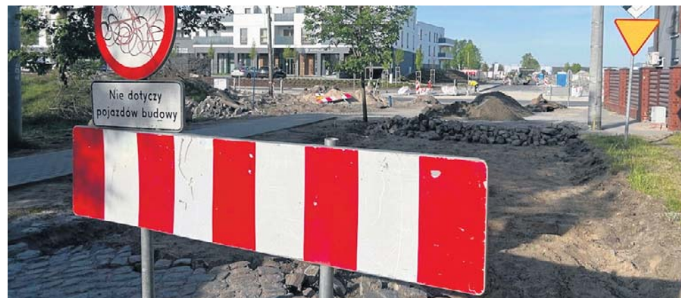
Prace na obecnym pierwszym odcinku, od ulicy Żwirki i Wigury do Skorupki, zakończą się w wakacje

- Ale lepsze to niż tragedia, która wisiła w powietrzu! Jed-