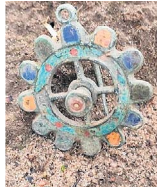
Fibula wywołała sensację w świecie archeologii

Cennych przedmiotów znalezionych na polu jest wiele m.in.: ● najstarszy - grot strzały scytyjskiej pochodzący z VI wieku p.n.e., ma więc 2600 lat! (Scytowie byli ludem, który właśnie wtedy najechał ludy mieszkające między Wisłą a Odrą) ● rzymska moneta - denar cesarza rzymskiego Aleksandra Sewera, który panował w latach 222-235 r. naszej ery, ● znakomicie zachowana ponad 600-letnia Bulla Papińska, pieczęć - pochodząca z czasów