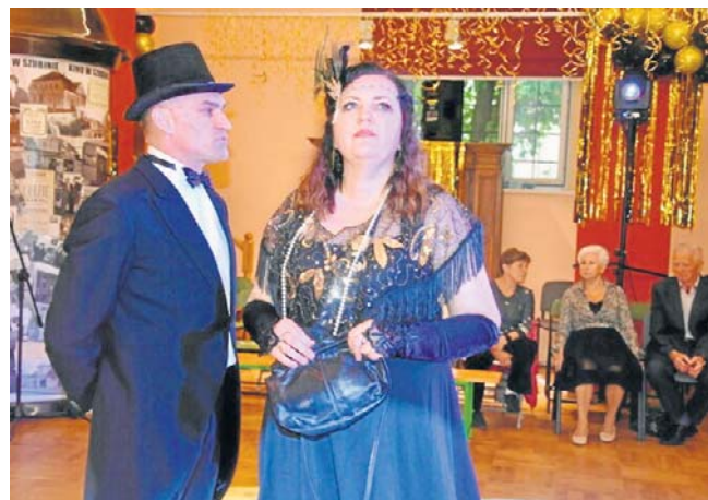
Zabawy i bale to temat przewodni tegorocznej „Nocy Muzeów” w Szubinie. Rekonstruktorzy już gotowi. Publiczność także szykuje już balowe kreacje

Wyjazd do Nowego Jasińca w piątek około godz. 19.30. Niezmotoryzowanym organizatorzy zapewniają transport. Trzeba to jednak wcześniej zgłosić w PIT. Jak dowiadujemy się - po wsi oprowadzi grupę archeolog Ro-