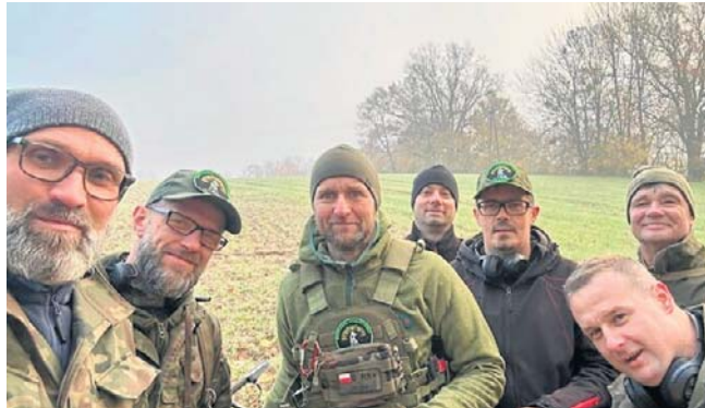
Ekipa Grudziądzkiego Stowarzyszenia Twierdza, która jako pierwsza weszła na pole skrywające cenne zabytki

To co wyciągają z ziemi wskazuje, że przed laty była tutaj osada i cmentarzisko położone przy bursztynowym - starożytnym szlaku łączącym Bałtyk z basenem Morza Śródziemnego. Teraz ziemia oddaje przedmioty, które tysiące i setki lat temu kupcy i wędrowcy tutaj zgubili, zostawili, z którymi ich pogrzebano... Znaleźli tutaj już około 50 przedmiotów o co najmniej dużej wartości historycznej.