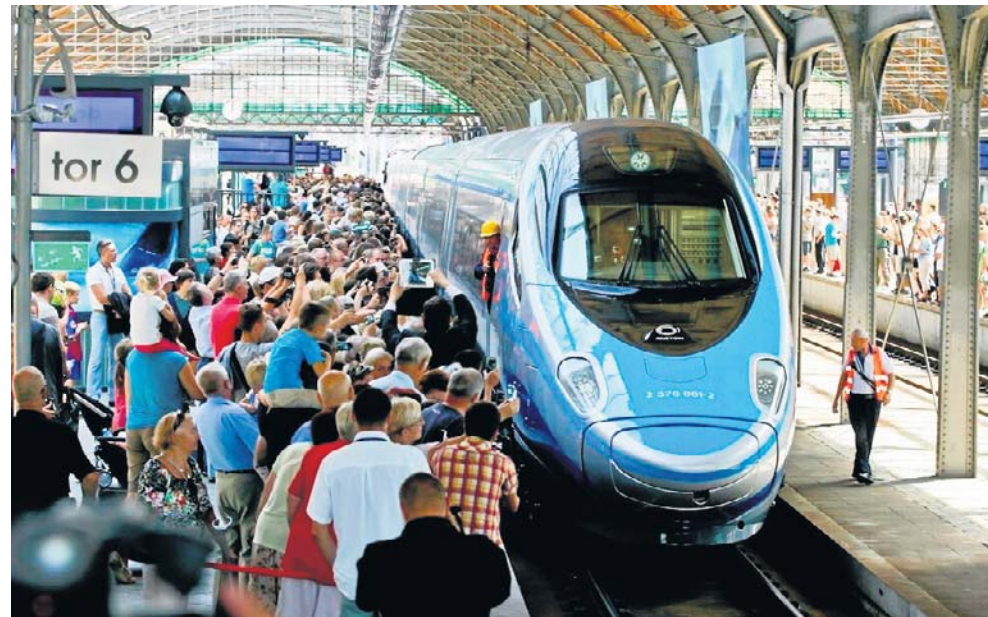
Pociągi Pendolino jeżdżą w Polsce od ponad 10 lat. Obecnie to one zapewniają najszybsze połączenia kolejowe w kraju, ale to może się zmienić

Bo nie był przygotowany. Dodaje się do tego wątki polityczne, ale moim zdaniem nie były one decydujące. Może w góra 10 proc. Brak reklamy na Dworcu Centralnym w Warszawie czy kasy biletowej, to nie są wystarczające powody rezygnacji. Zwłaszcza, że w przewozach dalekobieżnych sprzedaż biletów w kasach odchodzi do lamusa i w Intercity stanowi tylko 15 proc. RegioJet zaważył sprawę w grudniu 2025 r., kiedy to z własnej winy nie uruchomił dwóch trzeczich połączeń, bo nie dysponował taborem i pracownikami. Wiedzieli o tym, a nadal sprzedawali bilety na pociągi, które miały nie ruszyć. To mocno podkopało zaufanie. Pociągi złożone z 3-4 wagonów, mocno puste i ciągnięte przez drogą leasingowaną lokomotywę to nie mogło się udać finansowo. Koszty stałe na kolei są spore. W żadnym kraju nie witano kwiatami pociągów konkurencji, ale trzeba mieć to zało-