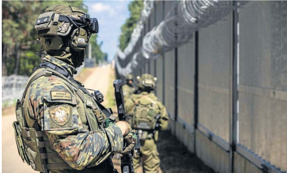
Presja migracyjna, wojna, wrogie prowokacje, sprawiły, że ochrona granicy jest elementem obrony państwa przed działaniami na progu wojny

Przez trzy i pół dekady służba przeszła głęboką ewolucję. Z formacji kojarzonej przede wszystkim z odprawami paszportowymi, rutynową kontrolą i pomocą w zwalczaniu przemytu stała się nowoczesną służbą o szerokim katalogu zadań: od zabezpieczania granicy