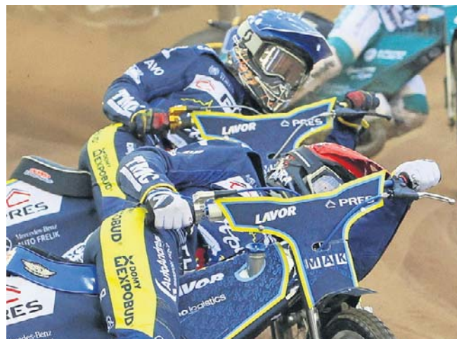
Toruńscy żużlowcy mają przed sobą wyjazd do Wrocławia. Mecz może być hitem 6. rundy PGE Ekstraligi