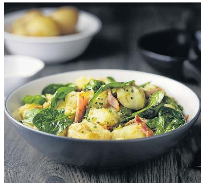
Szpinak i ziemniaki to - według EWG - najbardziej zanieczyszczone warzywa.