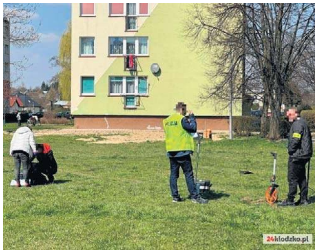
W tym miejscu rozegrała się 10 kwietnia br. tragedia. Tereny należą do miasta i Spółdzielni Mieszkaniowej.

Wielu mieszkańców Bystrzycy Kłodzkiej, którzy dali upust emocjom m.in. w programie TVN „Uwaga” twierdzi natomiast, że strach chodzić po osiedlu. Feralnego wieczoru trzech mężczyzn, którzy mieli