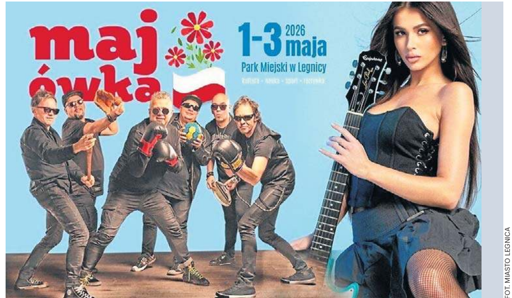
Od 1 do 3 maja w legnickim parku zapowiada się świetna zabawa

15:00 - Prezentacje lokalnych grup (ZPiT „Legnica”, Dziecięco-Młodzieżowa Legnicka Orkiestra Dęta, MCK, Flamenco, MCK, GoldArt, DK Kopernik, DK Atrium i inni).