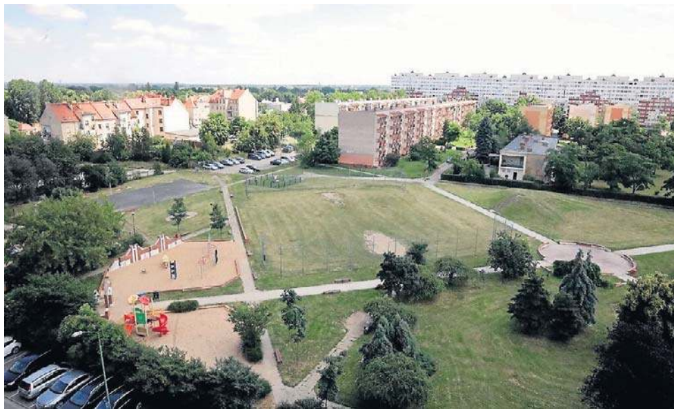
Skwer będzie solidnie oświetlony, więc odpocznemy tu także po zmroku

- Postępowanie przetargowe przyciągnęło pięciu oferentów. Co istotne, wszystkie