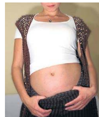
Doula dba o komfort kobiety rodzącej

Pojęcia doula (w starożyt- nym języku greckim oznaczają- ce „służącą”) użyła po raz pierwszy pod koniec lat 60. XX w. w USA antropolożka Dana Raphael, określając tak doświadczoną w swoim ma- cierzyństwie kobietę, która wspiera młodą matkę w kar- mieniu piersią i opiece nad no- worodkiem.