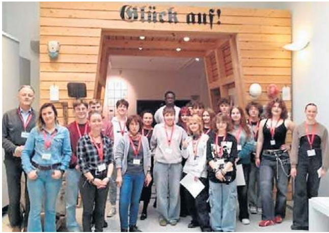
Wymiana młodzieży i nauczycieli legnickiej i miśnieńskiej szkoły. A na koniec pamiątkowa fotka