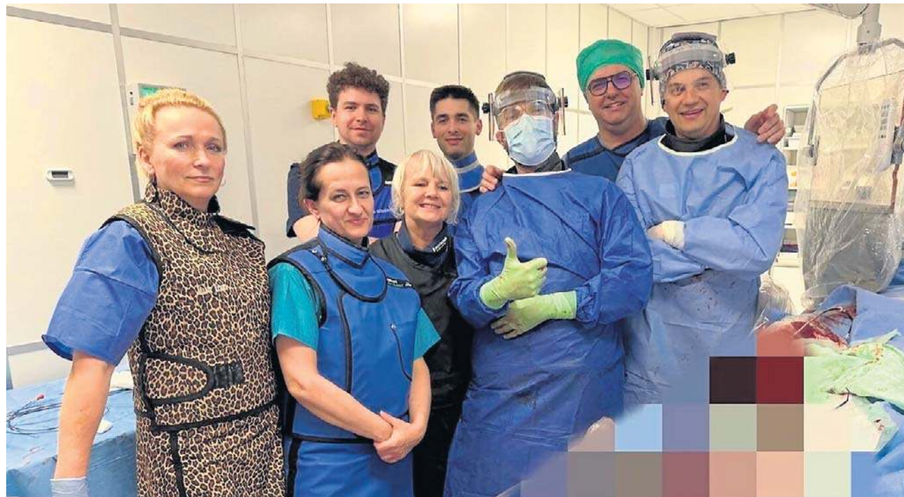
Zespół Kliniki Kardiologii legnickiego szpitala, który wykonał trombektomię płucną

Chory został pilnie przekazany do działającej w legnickim szpitalu Kliniki Kardiologii. Tam - w nowoczesnej pracowni Radiologii Zabiegowej Dolnośląskiego Centrum Sercowo - Naczyniowego im. prof. Mariana Zembała - podjęto decyzję o