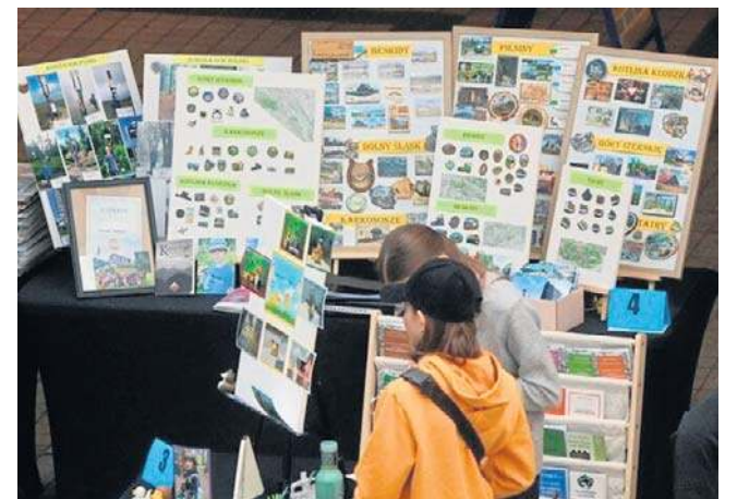
Przeгляд zorganizowano już po raz 6. Jak zwykle kolekcjonerów zaprosiła Galeria Piastów