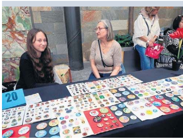
Organizatorem Przeglądu Młodych Kolekcjonerów i Hobbystów jest legnickie Towarzystwo Przyjaciół Dzieci