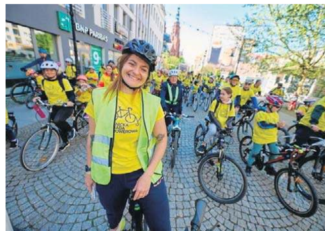
Rowerzyści spotkają się na tradycyjnej paradzie