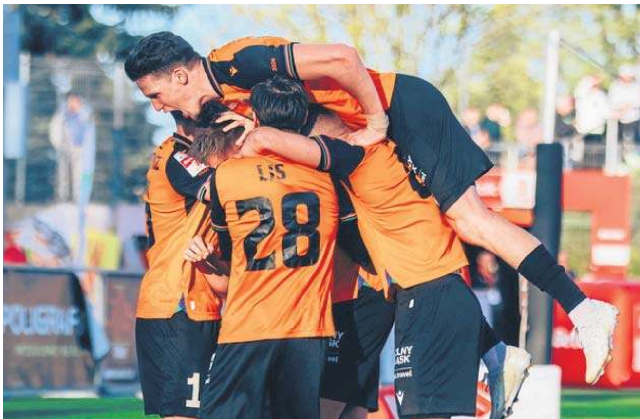
Chrobry wygrał 2:1 ze Stalą Mielec i awansował w tabeli Betclia 1. Ligi

PIŁKA NOŻNA DOLNOŚLĄSKIE DRUŻYNY Z SZANSAMI NA AWANS