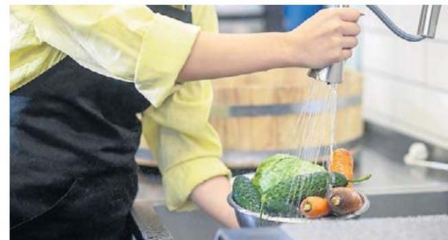
Jak zmniejszyć ilość pestycydów w jedzeniu? Jednym ze sposobów jest właściwe mycie.