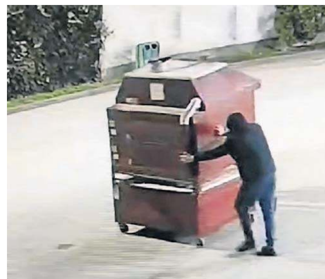
Piec skradziono na ul. Jagiellońskiej, kamera to nagrała

Okazało się, że został on sprzedany w jednym ze skupów złomu.