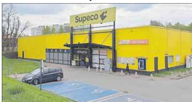
Sklep Supeco w Jaworznie

Oznacza to, że z tej lokalizacji zniknie również apteka, fryzjer oraz sklep z kawami i herbatami. Te punkty mają być wygaszane w okresie od lipca do września. Do października więc