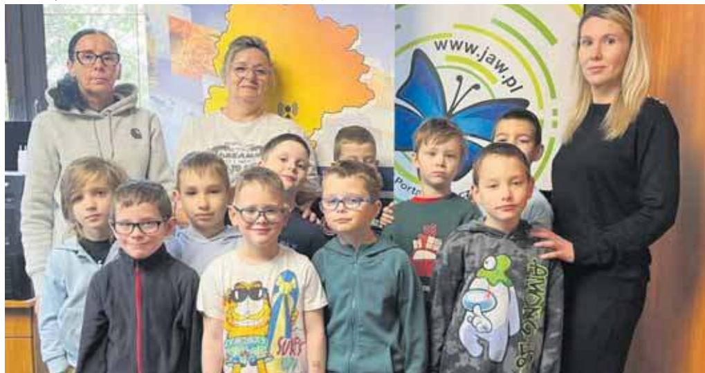
Przedkolaki z grupy „Sówki” z wizytą w naszej redakcji