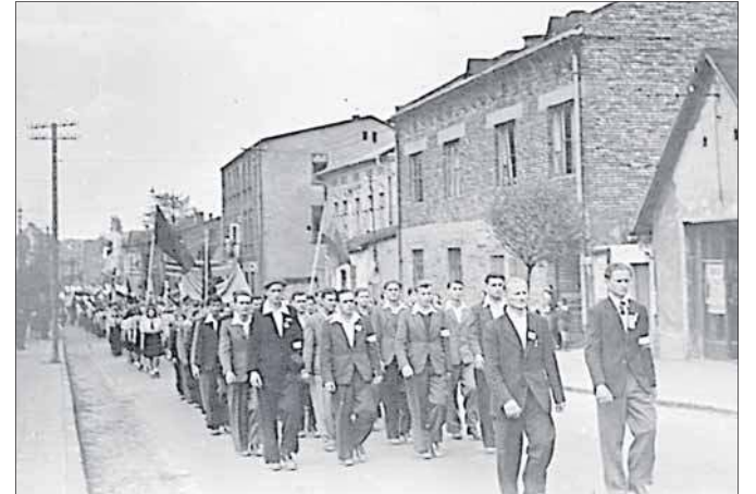
Pochód pierwszomajowy w Jaworznie w 1946 roku (zbiory prywatne)

Przed nami kolejna majówka. W jej ramach, na samym początku – bo już w piątek – świętować będziemy Międzynarodowe Święto Pracy, uznane w 1950 roku za święto państwowe, dzień wolny od pracy.