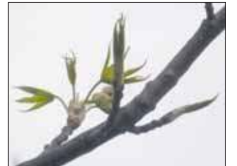
Ambrowiec w Jaworznie