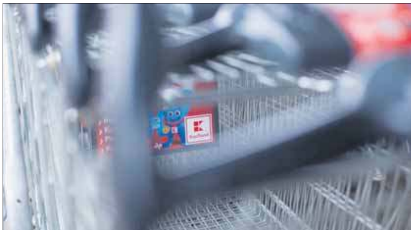
Kaufland chce zająć miejsce Carrefoura w galerii Galena w Jaworznie

– Kaufland obejmie lokal o powierzchni ok. 3200 m kw., natomiast druga część lok. 2200 m kw. – przyp.