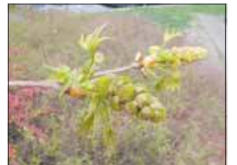
Ambrowiec w Katowicach