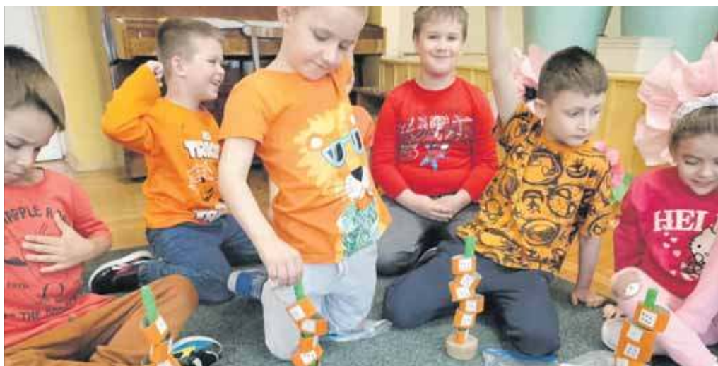
Zabawy matematyczne nie muszą być nudne

W dniu 21 kwietnia 2026 roku w Przedszkolu Miejskim nr 17 w Jaworznie bawiliśmy się z okazji Dnia Marchewki. Pomarańczowy, optymistyczny kolor dominował w placówce. Sprawili on, że humory dopisywały wszystkim.