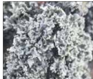
Porosty na klonie polnym