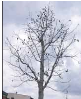
Ambrowiec w Jaworznie

Jest 24 kwietnia 2026. Wracam z planu filmowego w Sosnowcu, gdzie dokumentowaliśmy stan torfowiska Bory. Generalnie niemalże wszędzie w mieście, a w Parku Zielona przede wszystkim widać, że wiosna ruszyła z całą swoją potencją, jak mawiano dawnymi czasy, co Henryk Sienkiewicz utrwalił na kartach Trylogii. Pomiędzy rynkiem a kostkami prawie wszystko jest zielone. Wyróżnia się kilka pozornych suszków.