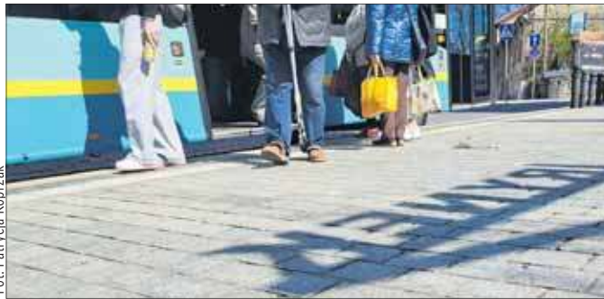
Pasażerowie jaworzniackiego autobusu PKM na przystanku w rynku

Do spółki PKM Jaworzno trafi 10 milionów złotych z budżetu miasta. Decyzję w tej sprawie prezydent Jaworzna podjął 8 kwietnia 2026 roku, podwyższając kapitał zakładowy miejskiego przewoźnika. Miasto obejmie w zamian 20 tysięcy nowych udziałów. Zapytaliśmy, na co dokładnie mają zostać przeznaczone te pieniądze.