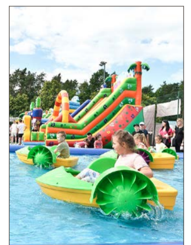
Dzień dziecka to impreza, która przyciąga tłumy.

To już tradycja, że w organizacji imprezy gminę Dębica wspiera firma Lerg S.A. Tak będzie i w tym roku, a program przygotowany przez organizatorów jak zawsze zawiera wiele atrakcji dla młodszych i trochę starszych dzieci. Będzie występ uczniów z Zespołu Szkół z Oddziałami Integracyjnymi w Pustkowie-Osiedlu, pokaz chemiczny „Chemical World”, który przybliży świat nauki, olimpiada na zielonej trawce, rodzinny program rozrywkowy, piana party, a na zakończenie seans inauguracyjny kino letnie. Będą darmowe dmuchańce, basen z łódkami, strzelnica laserowa. Nie zabraknie stoisk z przekąskami i napojami, a organizatorzy gwarantują doskonałą zabawę dla wszystkich uczestników bez względu na wiek. Zabawa zaplanowana została na ostatni piątek maja, 29. Rozpocznie