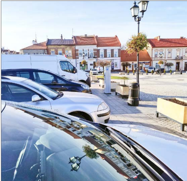
Darmowe parkowanie przez pół godziny? Na razie nie.

- Moglibyśmy się pomylić, ale oczekiwałbym przy współpracy,