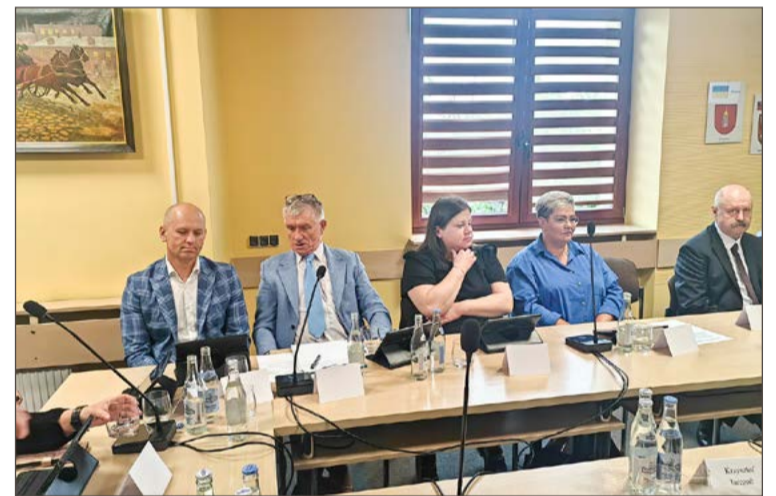
O takich wydatkach decyduje Rada Gminy.