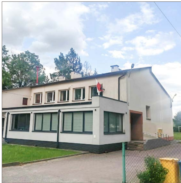
Tak budynek będzie wyglądał od strony południowej.

Nie oznacza to, że nie ma zainteresowania wśród potencjalnych wykonawców. Zapytania o szczegóły przetargu wciąż spływają do urzędu i to jest powodem kolejnego przesunięcia terminu. W tej chwili pytania zadało 16 firm z całej Polski. Dotyczą między innymi elementów stałego wyposażenia, które - oprócz robót budowlano-