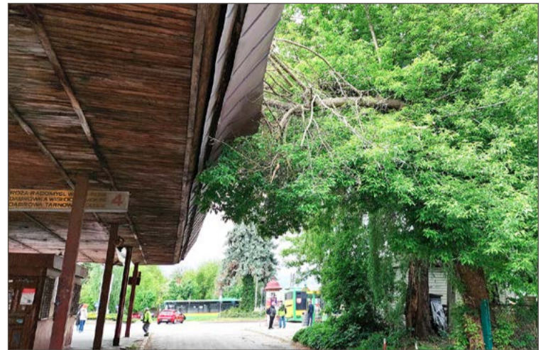
Tak sytuacja przy dworcu PKS wyglądała jeszcze w środę 13 maja.