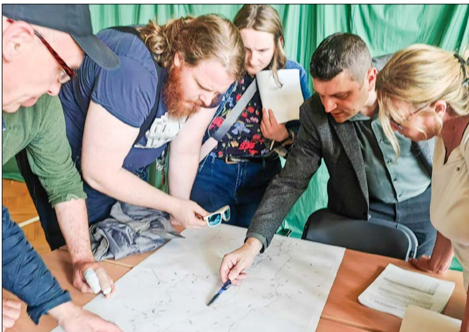
Podczas konsultacji z mieszkańcami w Pustkowie-Osiedlu.