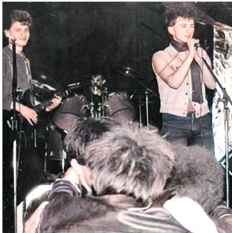
Dywersja z czasem przekształciła się w Przyczłapy do Bulgulatora nr 6.

Później, w styczniu 1987 roku, zespół jeszcze raz wziął udział w przeglądzie dębickich zespołów młodzieżowych, tym razem w DK