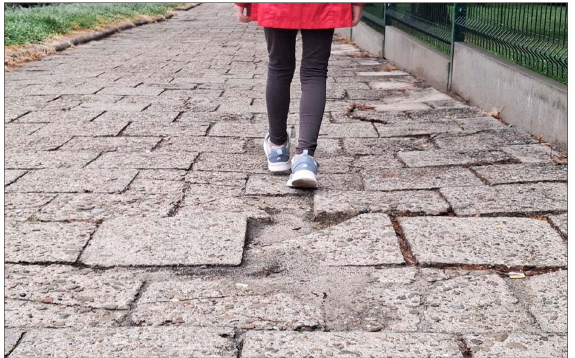
Prace projektowe przebudowy m.in. Strumskiego trwają. Przy tej ulicy chodnik przypomina tor przeszkód.

Zła sytuacja jest również w rejonie ul. Bojanowskiego. Tam po jednej stronie drogi chodnik został naprawiony, ale po drugiej lepiej uważać, gdzie i jak stawiamy nogę. Przy ul. Kochanowskiego nie jest lepiej, podobnie, jak na innych mniejszych drogach na osiedlu. W tym przypadku mieszkańcy będą pewnie musieli jeszcze poczekać, bo od lat trwają prace projektowe rewitalizacji dwóch chodników w tamtym miejscu i nic nie wskazuje na to, by w najbliższym czasie