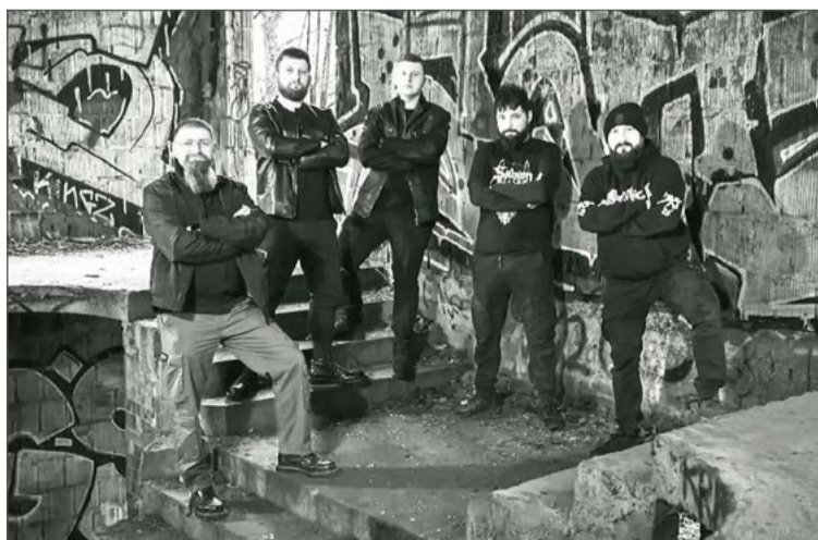
Reaper of Minds to: Grzybu, Medyk, Mortal, Kumalo i Parys.

Za punk rockowe granie odpowiedzialna będzie rzeszowska Rwa Kulszowa, która dopiero w zeszłym roku wydała swoją debiutancką EPkę.