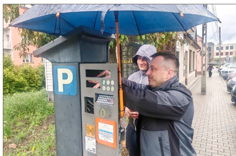
Modernizację przeprowadzili pracownicy firmy Automaticon z Jaworza.