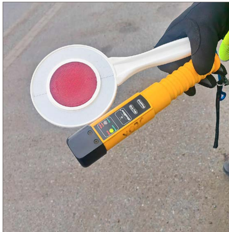
Policja zapowiada, że takie akcje będą powtarzane.

Drugi przypadek dotyczył 48-letniego kierowcy Nissana, zatrzymanego na ul. Gajowej. W jego organizmie stwierdzono ponad 2 promile alkoholu. W tej sytuacji na miejsce zatrzymania wezwany został holownik, który