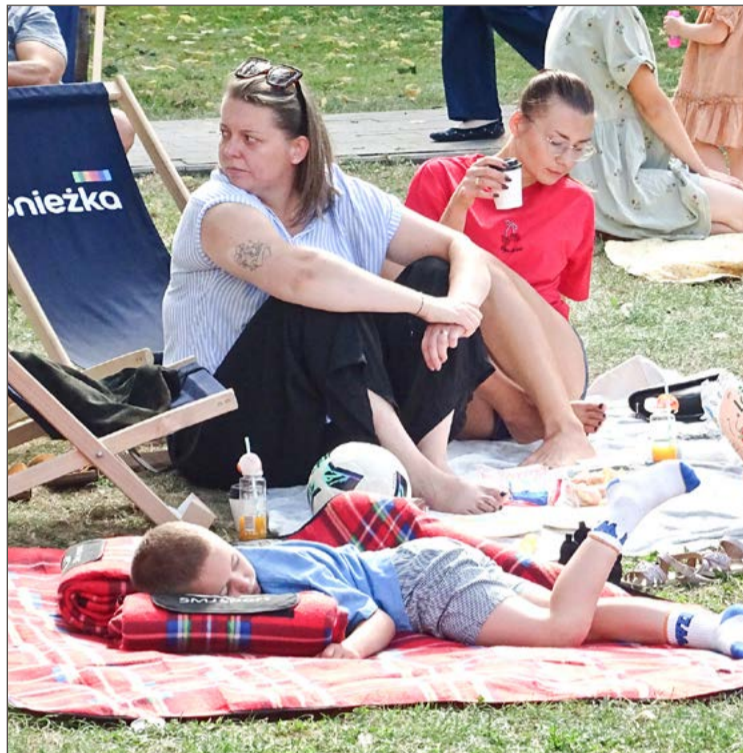
Pierwszy piknik śniadaniowy odbył się w ubiegłym roku.

Dzień później, czyli 30 maja ze swoimi Wyprzedzami Garażowymi powróci Stowarzyszenie Zielona Dębica. Pierwsza tegoroczna edycja popularnego i lubianego przez mieszkańców wydarzenia zaplanowana została przy ul. Krakowskiej, na parkingu sklepu sieci Jubilatka. Kolejne odbędą się: 27 czerwca (ul. Rzeszowska, obok dawnego Blasza), 25 lipca (Krakowska, Jubilatka), 29 sierpnia (Rzeszowska, dawny Blaszak) 26 września (Krakowska, Jubilatka). O ewentualnych dodatkowych terminach stowarzyszenie będzie zapewne informowało później. W ubiegłych