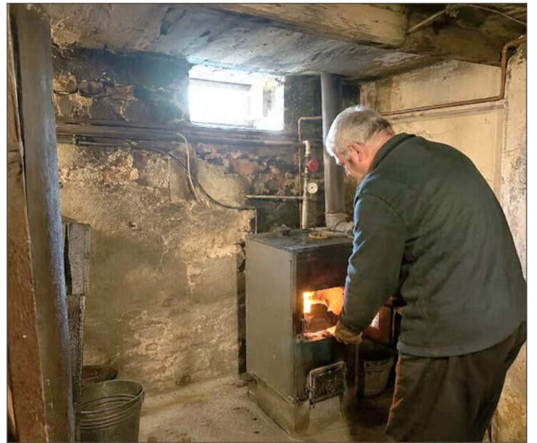
Wiele domów wciąż jeszcze ogrzewanych jest takimi piecami.

Badania przeprowadzone w zeszłym roku na potrzeby tego dokumentu wykazały, że najwyższe średnioroczne stężenie tego zanieczyszczenia wystąpiło w dwóch punktach pomiarowych: w Dębicy i Kolbuszowej. Jeśli chodzi o powiaty, dębicki jest na drugim miej-