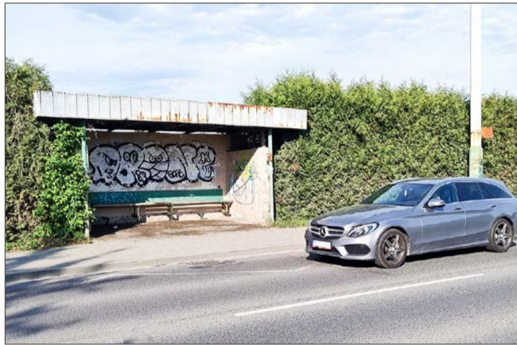
W tym miejscu powstanie zatoczka i nowa wiata przystankowa.

O ile jednak ta została wymieniona, o tyle druga remontu się nie doczekała. Wciąż jest brudna, odrapana i popisana farbą w sprayu. A metalowy dach jak zżerała rdza, tak zżera nadal. Co więcej, jak wynika ze słów Roberta Sieradzkiego, dyrektora Wydziału Infrastruktury Miejskiej i Dróg, zżerać będzie. Przynajmniej do czasu, gdy miasto, w ramach realizacji projektu Dębicko-Ropczyckiego Obszaru Funkcjonalnego, budować będzie ścieżki rowerowe. Te powstaną wzdłuż trasy kolejki wąskotorowej, a także przy ul. Starzyńskiego, Północnej, Jana Pawła II i właśnie 1 Maja.