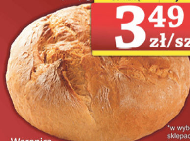
Weronica Chleb galicyjski krojony, cały 500 g