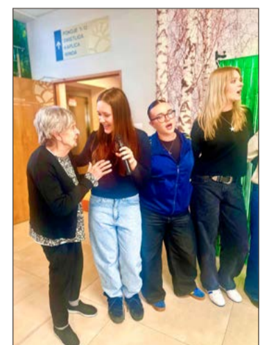
Uczennice z II LO realizowały także projekt Memoir.