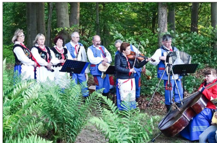
Przy figurze Matki Bożej w Połomii znów zagra Kapela Jodłowanie.

Akcja Katolicka z parafii św. Bartłomieja w Łękach Górnych wspólne śpiewanie organizuje w niedzielę 24 maja o godz. 15:00. Zainteresowani udziałem w majówce spotkają się przy kapliczce Matki Bożej, która stoi przy zabytkowym kościele św. Bartłomieja.