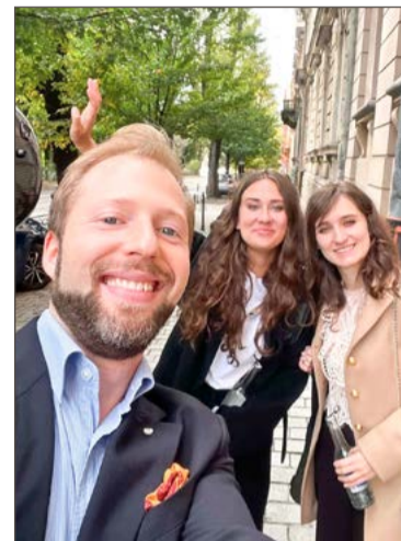
Bohema Trio to nie tylko wspólny projekt muzyczny, ale i rodzinny.

– Cieszymy się, że możemy być częścią tego przedsięwzięcia i współtworzyć album pełen arty-