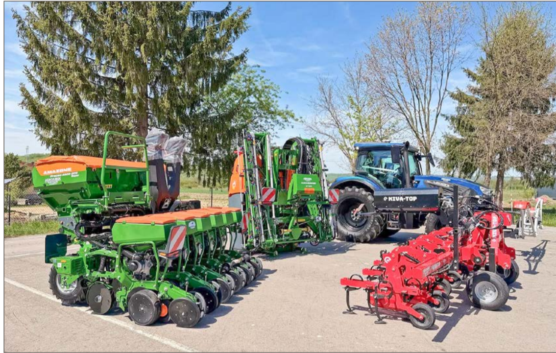
Ciągnik, siewnik, dron i wiele innych sprzętów trafiło do szkoły rolniczej.

Dzięki wyposażeniu pozyskanemu w ramach programu Rolnictwo 4.0 dla szkół rolniczych do szkoły trafiły specjalistyczne maszyny i urządzenia wykorzystywane w nowoczesnych gospodarstwach rolnych, w tym ciągnik rolniczy Landini 7-180, wyposażony w zaawansowane systemy. Maszyna posiada system prowadzenia RTK, technologię ISOBUS oraz możliwość dwukierunkowej wymiany danych z systemami zarządzania