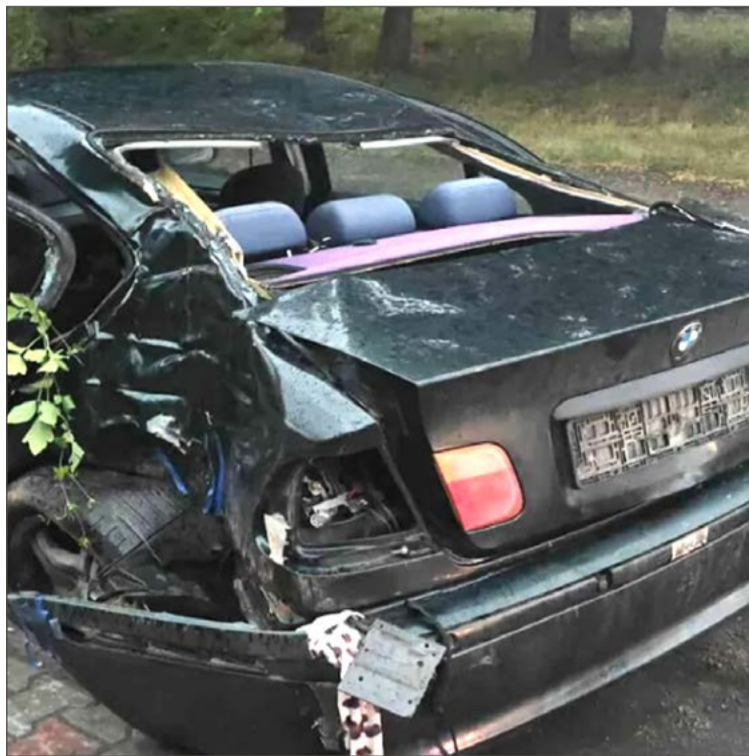
Tak wyglądał samochód po wypadku na ulicy Staszica.