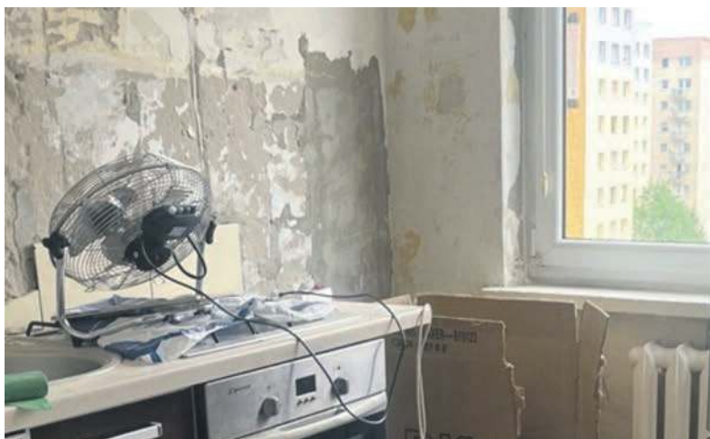
Wiele mieszkań jest zdemolowanych

Co więcej, wybuch nie oszczędził szybu windy. Ta od dramatycznego