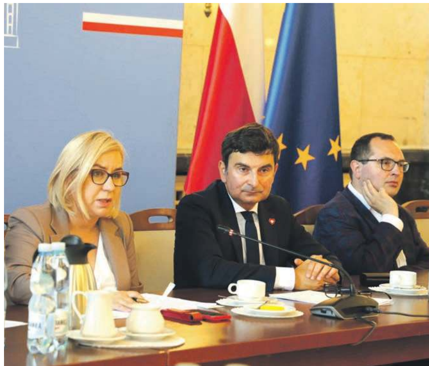
Założenia programu przedstawiła minister Paulina Hennig-Kloska

Poruszano przede wszystkim kwestie prawne walki z nielegalnym składowaniem odpadów, wymieniano się doświadczeniami w tej dziedzinie, a także zastanawiano się, jakie powinny być dalsze działania na rzecz środowiska naturalnego, by dla powszechnego zysku jak najlepiej o nie zadbać.