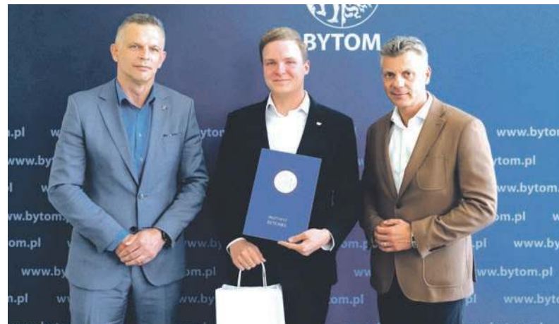
Zdolny student w otoczeniu prezydentów