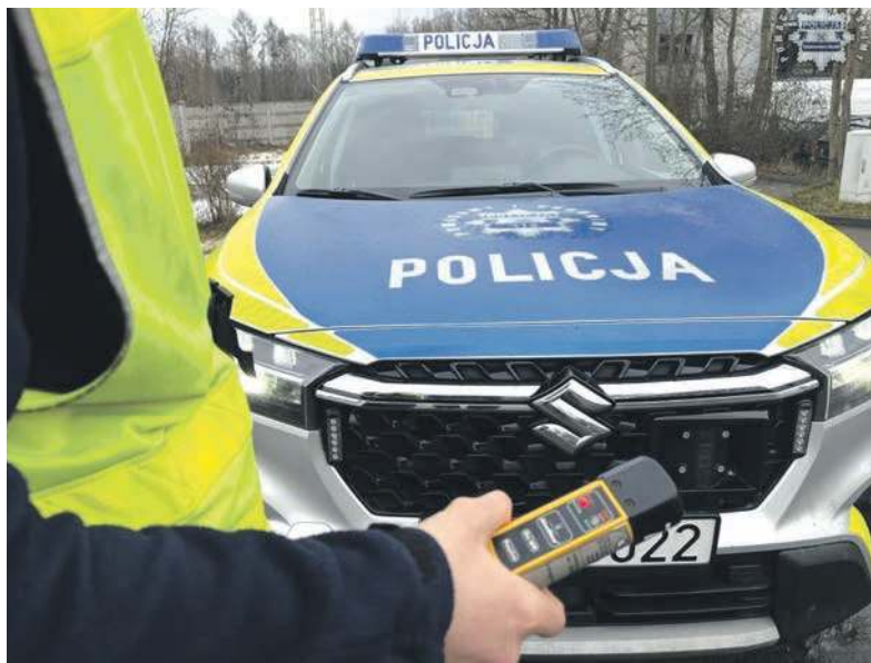
Wynik zaskoczył nawet doświadczonych policjantów

Bytomianin miał jednak poważny problem z ustaniem na nogach i mocno się chwiało. Zauważył to przypadkowy przechodzień, który od razu zareagował. Powiadomił on stróżów prawa z pobliskiego komisariatu, a ci szybko pojawili się na miejscu. Widok kompletnie zamroczonego alkoholem mężczyzny całkowicie ich zaskoczył, choć nie pracują od wczoraj. Przeprowadzone od razu badanie było