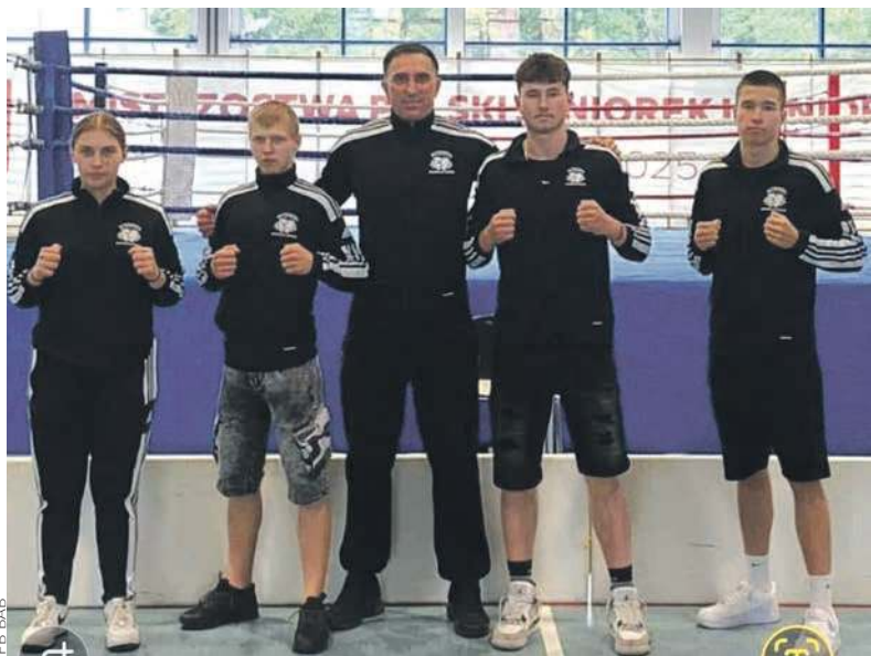
Medali nie było, ale w tych bokserach jest potencjał

- Tym razem podium nie było, ale i tak nie brakuje nam powodów do dumy. Nasi reprezentanci pokazali charakter, odwagę i potencjał, który z pewnością zaprezentuje w kolejnych startach - tak szkoleniowcy Bytomskiej Akademii