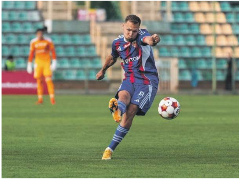
Poloniści zagrali jak stary wyjadacz, a nie jak beniaminek

Po tym wejściu smoka Polonia absolutnie nie zamierzała przejść do obrony. Jej ataki wciąż sunęły na pole karne Górnika, a nasi piłkarze prezentowali się naprawdę dobrze. Byli szybcy, zde-