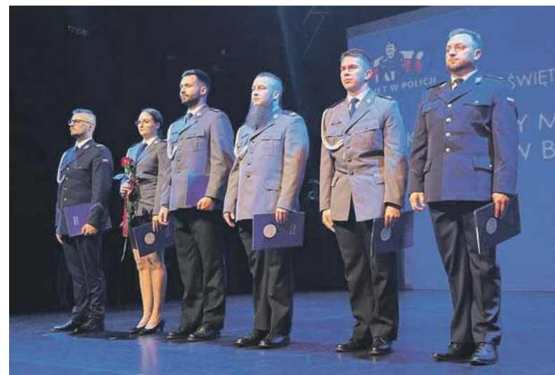
Bytomscy policjanci świętowali w Teatrze Rozbark

POLICJANCI ORAZ PRACOWNICY CYWILNI KOMENDY MIEJSKIEJ POLICJI W BYTOMIU OBCHODZILI UROCZYSTOŚCI ZWIĄZANE ZE ŚWIĘTEM POLICJI, KTÓRE PRZYPADA 24 LIPCA.