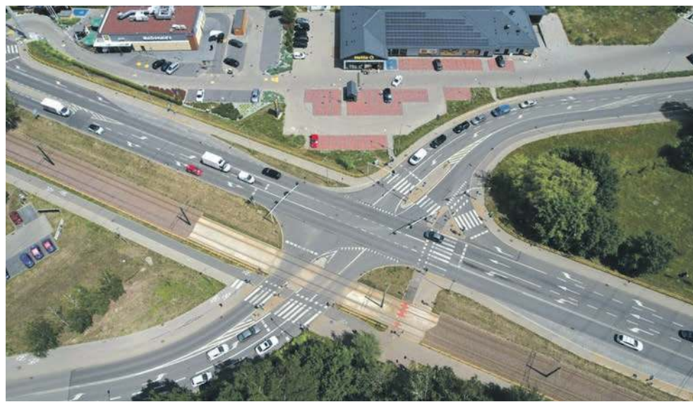
Ważne skrzyżowanie będzie przebudowane, a tramwaj zyska priorytet w przejeździe

Inwestycja zgodnie z umową powinna być zakończona jeszcze w listopadzie tego roku. W jej