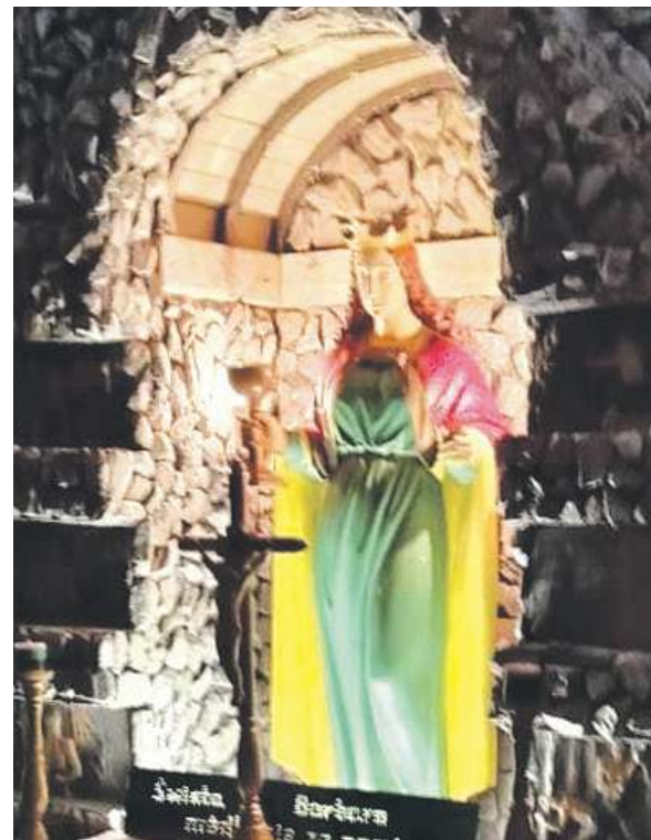
Świynto Barbara Ślonszoki majom fest we zocy i dowajom to miano swojym cerom

Downi cynsto dziolszkom dowali na miano Edeltrauda abo Elfryda. Dziś juz niy i bez to niy usłyszymy, jak fto woła: „Trauta”, abo „Fridka”. Na „E” momy tyz Elżbieta, czyli Elza, Emilia, a więc Mila, Eryka - Erika, Ernesta - Erna, Eugenia - Gynia i Emma - Yma. Żodny baby z takim mianym zech niy trefioł, ale niy wiym cymu downi na niyfajne baby godało sie: „Ty Ymo kłapiato”.