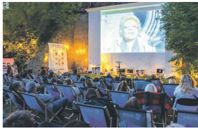
W Szombierkach widzowie obejrzeli „Seksmissję”

Przypomnijmy, że BeCeK swoje seanse organizować będzie w każdy piątek, zawsze o godz. 21.30 aż do 22 sierpnia. Spotykamy się między innymi w amfiteatrze w parku miejskim, przy siedzibie suchogórskiej Ochotniczej Straży