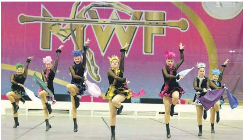
Bytomskie mażoretki w akcji

Bytomskie mażoretki z grupy Charms wybrały się na Mistrzostwa Europy do włoskiej Monzy. W ich trakcie zaprezentowały aż 9 widowiskowych i efektownych choreografii. Spisały się znakomicie.