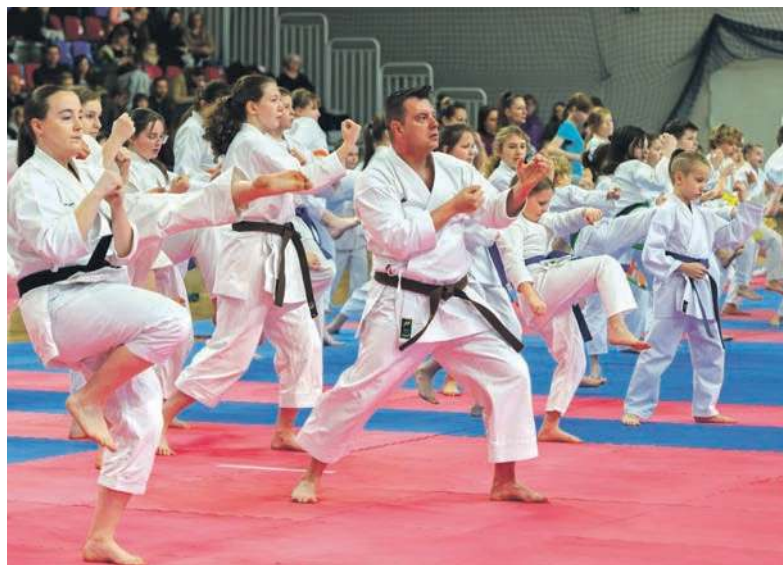
„Bytom miastem karate” - projekt o tej nazwie już kilka razy zdobywał finansowanie w ramach BBO

Pierwszy etap tegorocznego BBO już za nami. Do końca czerwca był czas na zgłaszanie projektów