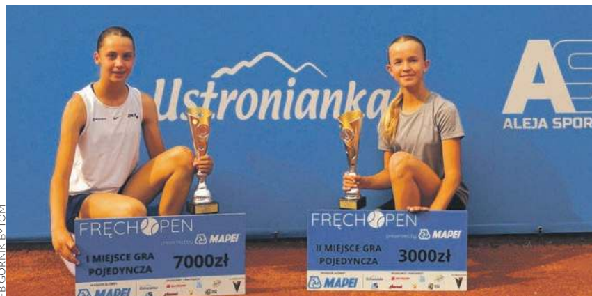
Dwie najlepsze tenisistki turnieju dziewcząt