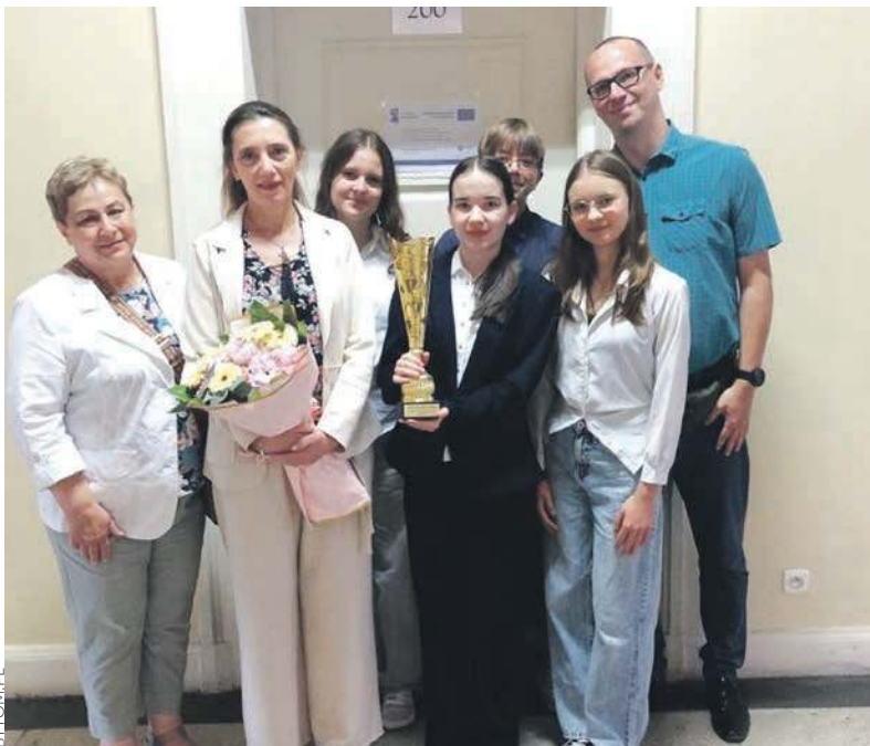
Drużyna SP nr 51 wraz z opiekunami

Nie dość, że mają bogatą wiedzę na temat dziejów naszego kraju, to jeszcze potrafią profesjonalnie się na ich temat spierać. Uczniowie bytomskiej Szkoły Podstawowej nr 51 z Oddziałami Integracyjnymi przy ulicy Łużyckiej jeszcze przed wakacjami wywalczyli trzecie miejsce podczas Turnieju Debat Historycznych.