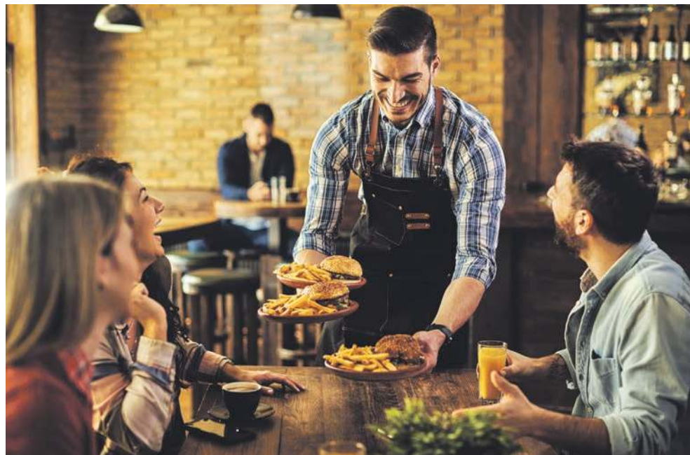
Praca w restauracji do częsty wybór wśród młodych osób