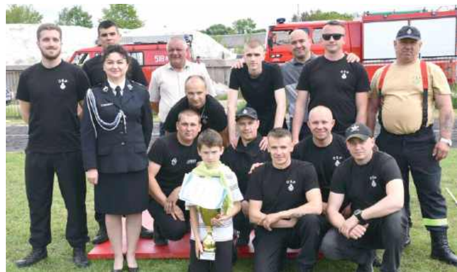
Zwycięcy w kategorii mężczyzn - OSP Wycznanka

Gospodarzem tegorocznych zawodów była Gmina Kąkolewnica. Wszystkie drużyny otrzymały pamiątkowe dyplomy. Najlepsze jednostki z gminy Kąkolewnica mogły liczyć również na puchary i bony pieniężne. Gmina, która w tym roku była gospodarzem zawodów, ufundowała nagrody dla trzech najlepszych drużyn wśród swoich reprezentantów: 2000 zł za pierwsze miejsce, 1500 zł