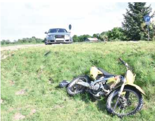
W Pratulinie 16-letni motocyklista, w trakcie nieprawidłowego manewru wyprzedzania zderzył się ze skręcającym w lewo Audi

Biała Podlaska: Do szpitala w wyniku wypadków trafiło dwóch motocyklistów. Jeden z nich to 16-latek bez prawa jazdy.