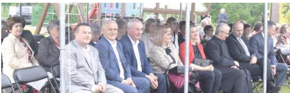
Wydarzenie na tyle się spodobało, że już teraz padają zapewnienia o organizacji kolejnych edycji i wychodzenia z zaproszeniami do zespołów spoza granic gminy