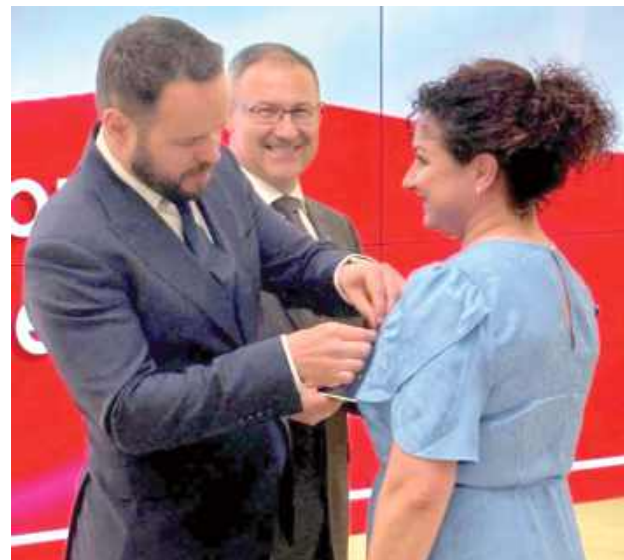
Odznaczenie wręczył Wojewoda Lubelski - Krzysztof Komorski