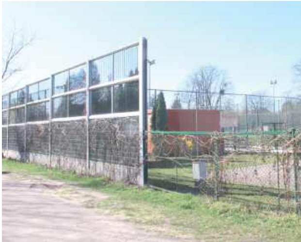
Zgodnie z decyzją sądu ekrany akustyczne zostają na swoim miejscu, bo stoją tu legalnie

Naczelny Sąd Administracyjny uznał, że ekrany akustyczne ustawione przez miasto przy boisku z zakazem użytkowania stoją legalnie. Puławy od kilku lat walczą o możliwość pełnego korzystania z „Orlika”, który zdaniem mieszkańców obok małżeństwa emituje zbyt dużo światła i hałasu.