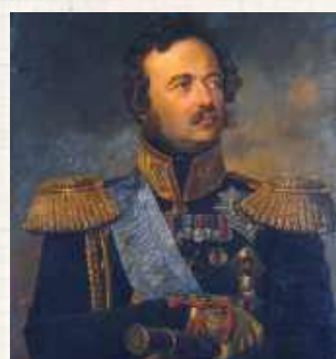
Iwan Paskiewicz z przydomkiem Erywański (1782 - 1856) był jednym z najlepszych rosyjskich dowódców, który wstawił się w wojnie z Turcją (1806-12), w wojnach napoleońskich, na Kaukazie i z Turkami. Dowodził armią rosyjską tłumiając powstanie listopadowe. Wykazał się wtedy także okrucieństwem. Jako namiestnik cesarski z wielką zjadłością tłumił wszelkie przejawy polskiego życia narodowego, w związku z czym okres jego rządów przeszedł do historii jako „noc paskiewiczowska”

Dobra dęblińska jako część majątku odebranego Czartoryskim podarowane zostały za zasługi m.in. przy tłumieniu powstania listopadowego Iwanowi Paskiewiczowi i jego rodzinie.