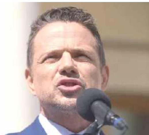
Rafał Trzaskowski zdobył 49,11 proc. poparcia (10 237 177 głosów)

Frekwencja w niedzielnych wyborach wyniosła 71,63 proc. i była rekordowa, jeżeli chodzi o wybory prezydenckie w Polsce. To więcej niż w dotychczas