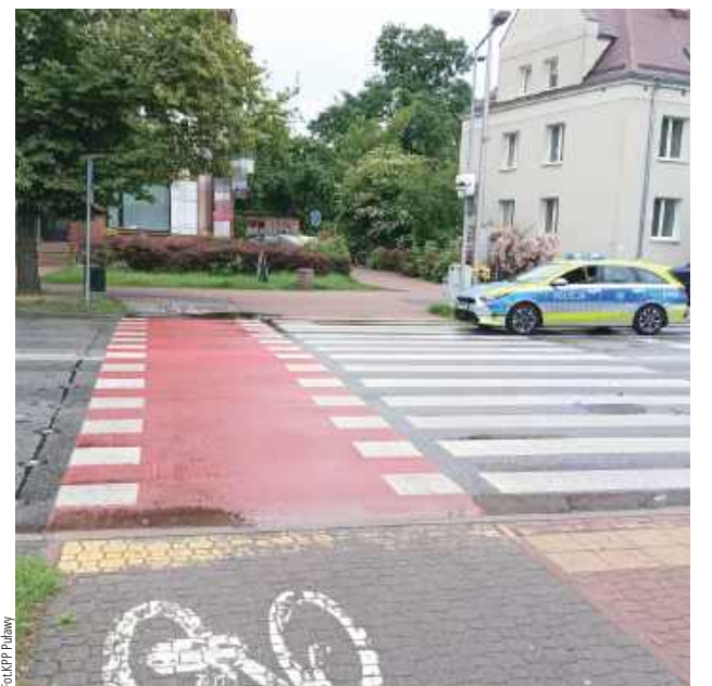
To właśnie na tym przejściu doszło do potrącenia rowerzystki

Do zdarzenia doszło przy ul. Wojska Polskiego. Mieszkaneczka Puław pokonywała ulicę, przejeżdżając po przejeździe rowerowym, gdy uderzyło w nią osobowe Renault. Kobieta upadła na ziemię, ale kierująca samochodem, zamiast zatrzymać się, pojechała dalej. Dzięki świadkom udało się ustalić pojazd, który uczestniczył w kolizji. - Okazało się, że kierowała nim 76-letnia mieszkanka gminy Końskowola. Wyjaśnienia kierującej samochodem odbiegały od wcześniejszych ustaleń, jednakże uszkodzenia samochodu wskazywały na to, że faktycznie doszło do potrącenia rowerzystki - informuje