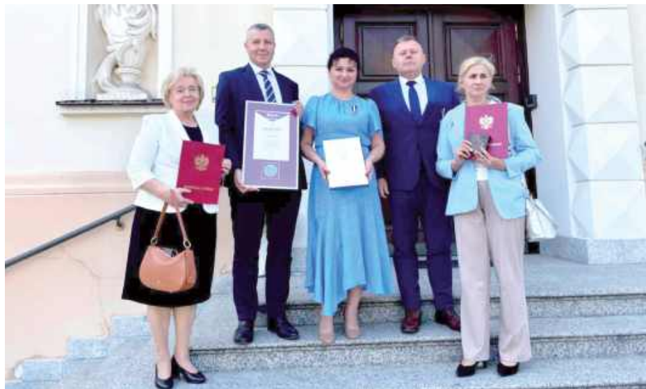
Podczas wydarzenia uhonorowani zostali liczni przedstawiciele z Powiatu Radzyńskiego