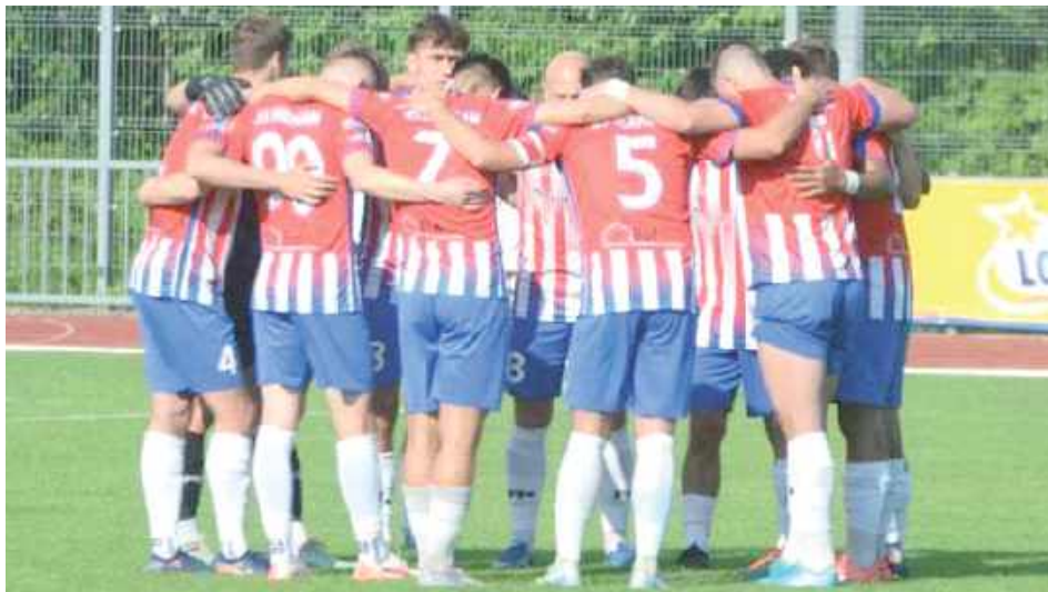
Huragan zdobył w Biłgoraju bardzo cenny punkt