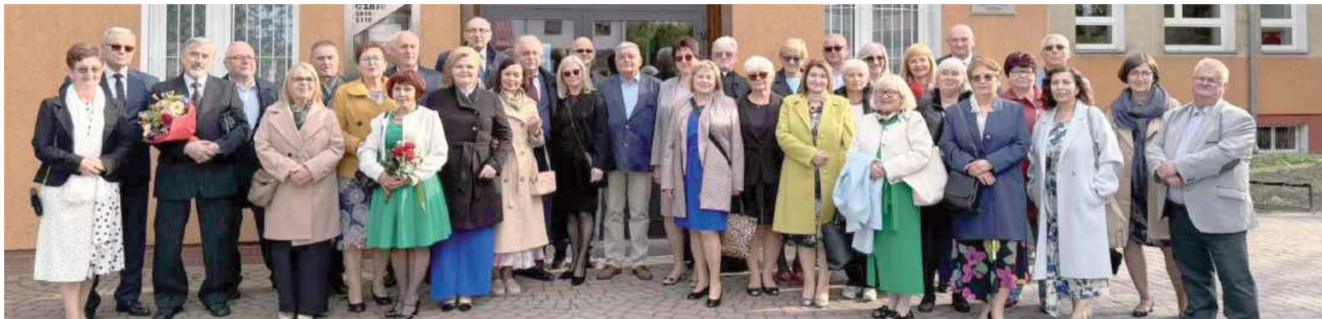
24 maja I LO w Radzynie gościło absolwentów z rocznika 1980. Minęło już 45 lat od momentu, gdy zdawali egzamin dojrzałości!