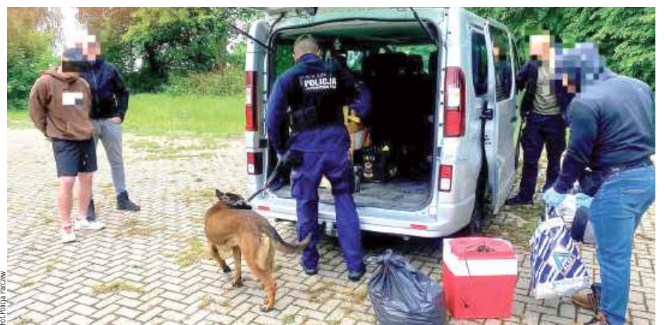
W czynnościach został wykorzystany policyjny pies służbowy, który specjalizuje się w wyszukiwaniu zapachów narkotyków, a jego węch jest niezawodny

- Zabezpieczone przedmioty oraz substancje psychoaktywne spakowane były w specjalne pakiety tj. kolorowe woreczki foliowe z zapieciem strunowym oraz szklane słoiki, wewnątrz których znajdował się susz roślinny. Wszystko było równo-