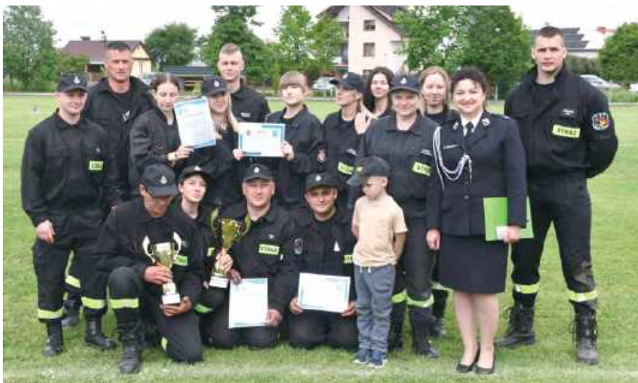
Najlepsze wśród pań były zawodniczki z Kąkolewnicy. Panowie z tego samego OSP zajęli drugie miejsce

W niedzielę, 25 maja na terenie Komendy Powiatowej PSP w Radzynie Podlaskim odbyły się gminne zawody sportowo-pożarnicze jednostek OSP z pięciu gmin powiatu radzyńskiego. W rywalizacji dobrze zaprezentowały się zarówno męskie, jak i kobiece drużyny z gminy Kąkolewnica. Najlepsze wyniki osiągnęły OSP Wycznanka i OSP Kąkolewnica.