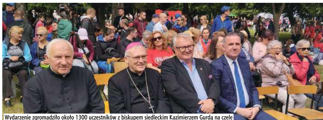
Wydarzenie zgromadziło około 1300 uczestników z biskupem siedleckim Kazimierzem Gurdą na czele

Wydarzenie zgromadziło około kilkuset uczestników, w tym wolontariuszy, pracowników i podopiecznych