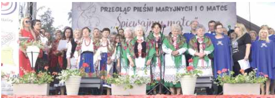
Wystąpiły zespoły śpiewacze z gminy Borki oraz Chór parafialny Ave Maryja z Woli Osowińskiej