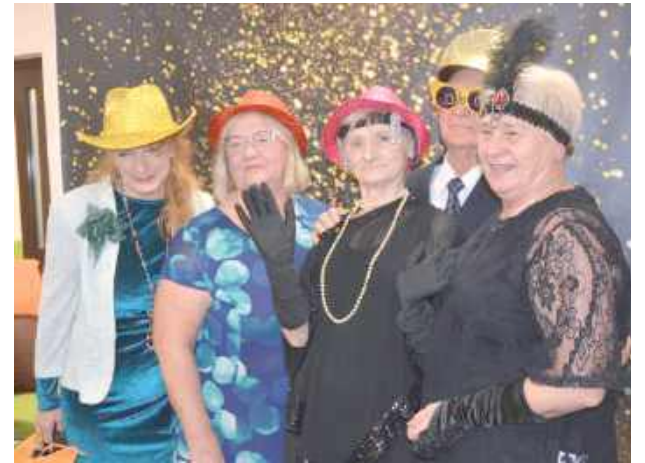
Uczestnicy mogli zrobić pamiątkowe zdjęcia w przygotowanej fotobudce, gdzie wśród ozdób dominowały kapelusze i kolorowe okulary przeciwsłoneczne

28 października w Dzielny Dom „Senior+” w Bogdance odbył się tegoroczny Gminny Dzień Seniora 2025 pod hasłem „Powróćmy jak za dawnych lat...”.