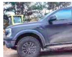
Nowe auto w Puchaczowie

W październiku Urząd Gminy Puchaczów wzbogacił się o nowy samochód terenowy typu pick-up.