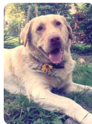
Buła, Paweł Socha, Lubartów