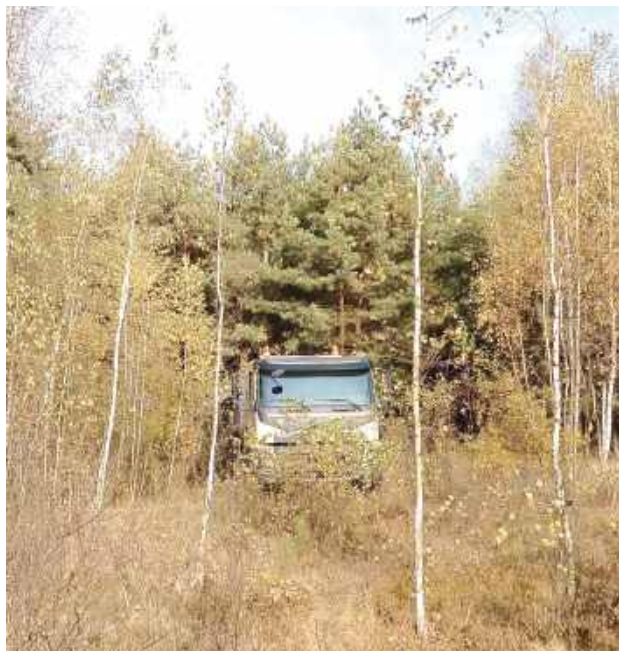
Łęczyńscy policjanci odzyskali dwa skradzione samochody warte ponad 300 tysięcy złotych

Do zdarzenia doszło w ubiegły czwartek, kiedy właściciel firmy zgłosił kradzież. Z relacji mężczyzny wynikało, że w nocy nieznanymi sprawcami zerwali kłódkę przy bramie wjazdowej i weszli na teren firmy, skąd zabrali dwa