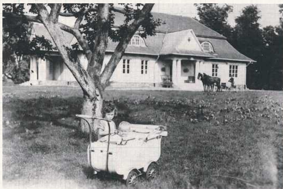
W 1927 roku stary drewniany dworek po Krasieńskich został zastąpiony nowym murowanym. Zdjęcie znaleźliśmy na arcyciekawym, zawierającym mnóstwo fascynujących, rzetelnie gromadzonych informacji, profilu facebookowym „Gułów i okolice”