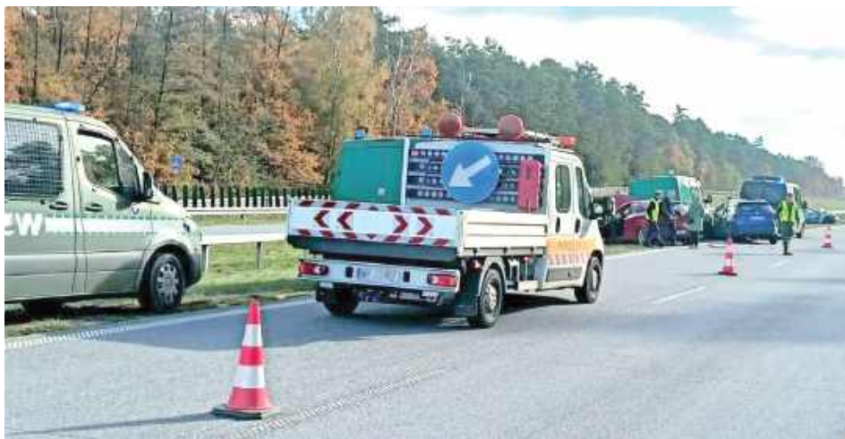
Choć w zdarzeniu brało udział aż pięć pojazdów, do szpitala została przewieziona tylko jedna osoba

- Widząc to, kierowcy dwóch samochodów Żandarmerii Wojskowej - Citroena i Volkswage-