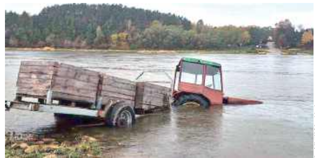
Po dotarciu na miejsce strażacy zastali pojazd w nurcie Wisły

Na miejsce natychmiast dysponowano liczne zastępy straży pożarnej, w tym jednostki wyposażone w łódzie ratownicze.