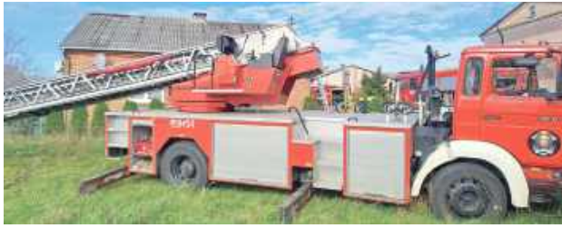
W akcji brały udział zastępy OSP z Ostrowa Lubelskiego, Kaznowa i Jam oraz JRG Lubartów

Jak informuje Ochotnicza Straż Pożarna w Ostrowie Lubelskim, w Kaznowie 1 listopada wybuchł pożar. Palił się dom mieszkalny. Straż pożarna otrzymała zgłoszenie około godziny 11.45.