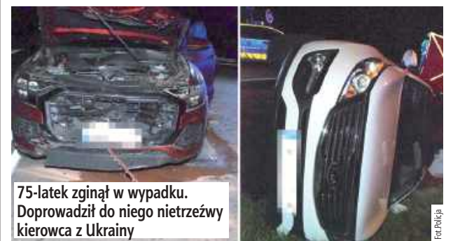
75-latek zginął w wypadku. Doprowadził do niego nietrzeźwy kierowca z Ukrainy

HRUBIESZÓW: W gminie Teratyn w powiecie hrubieszowskim nietrzeźwy obywatel Ukrainy doprowadził do zderzenia, w wyniku czego zginął 75-latek.