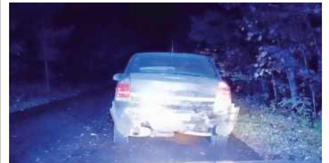
Na tył Opla najechał Renault, którego kierowca był nietrzeźwy

Kierowca samochodu Renault najechał na tył Opla jadącego przed nim. Był nietrzeźwy.