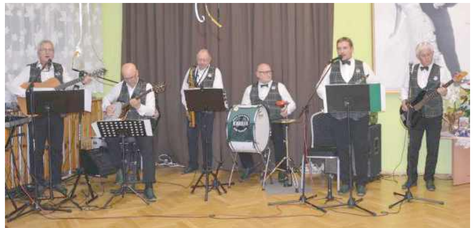
Czas umilała muzyka grana na żywo