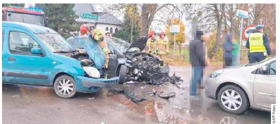
Choć zdarzenie wyglądało groźnie, to na szczęście osobom jadącym samochodami nic się nie stało, nikt nie wymagał hospitalizacji

Wszystkiemu winna kierująca Citroenem, która nie ustąpiła pierwszeństwa innemu autu. 67-letnia sprawczyni kolizji została ukarana mandatem.