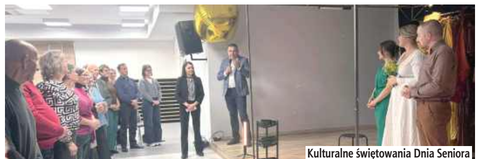
Kulturalne świętowania Dnia Seniora

26 października o godz. 16 w Gminnej Bibliotece Publicznej w Ludwinie odbył się spektakl teatralny „Cudownych rodziców mam(?)”, który został przygotowany z okazji Europejskiego Dnia Seniora.