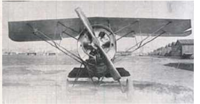
Pewną ciekawostką był samolot Morane. Był tzw. roulerem - miał skrócone skrzydła i wcale nie latał: służył do nauki kotowania na pasie. Dopiero potem młodzi lotnicy próbowali latać na m.in. Nieuportach...

Jednym z wyzwań powstającej armii odrodzonej w 1918 roku Rzeczypospolitej było stworzenie polskiego lotnictwa wojskowego. Pierwszymi instruktorami byli Francuzi, a jako docelową bazę zaplanowano Dęblin