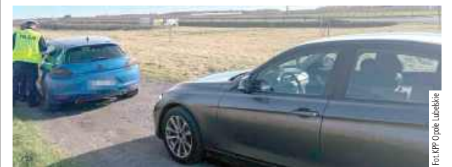
W ciągu zaledwie kilku minut funkcjonariusze zatrzymali dwóch kierowców, którzy jechali za szybko

POWIAT OPOLSKI: W sobotę, 1 listopada w Kolonii Łaziska (powiat opolski, gmina Łaziska) mundurowi prowadzili kontrolę w miejscu, które od dawna budzi niepokój okolicznych mieszkańców. Jak się okazało - słusznie. Pierwszy wpadł 21-letni mieszkaniec gminy Łaziska, który za kierownicą Volkswagena pędził o ponad 40 km/h za szybko. Zo-