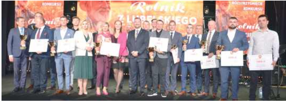
Nasi rolnicy odnieśli sukces w dwóch kategoriach

Nagrody są przyznawane w czterech kategoriach - produkcja zwierzęca, produkcja roślinna, ogrodnictwo i sadownictwo oraz producent - przetwórca. Oceniane są przede wszystkim efektywność gospodarowania,