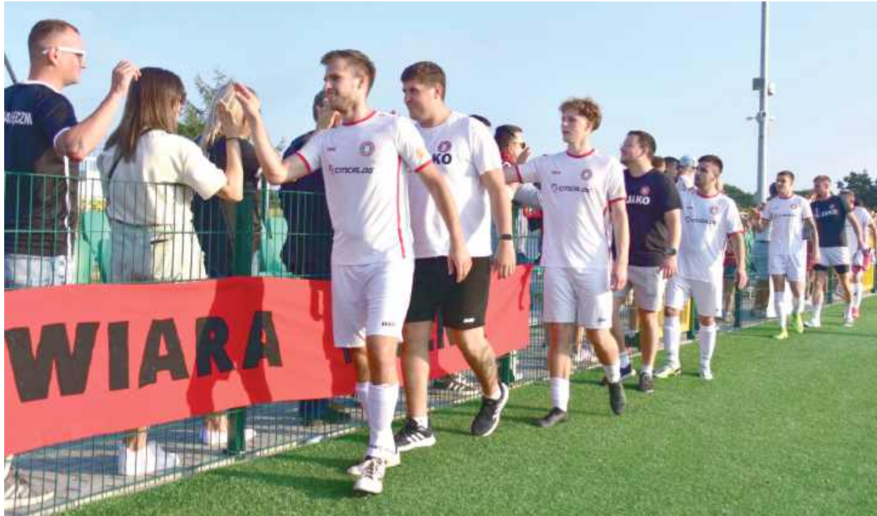
Wiara tym razem tylko zremisowała przed własną publicznością. Po remisie 1:1 podzieliła się punktami z Sokołem Konopnica