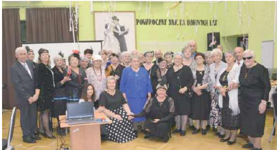
Była to okazja do spotkania w tematycznych strojach