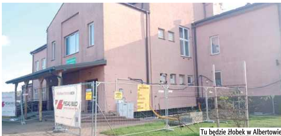
Tu będzie żłobek w Albertowie

Nowa placówka powstaje w ramach programu „Aktywny Maluch”. Dzięki projektowi w gminie Puchaczów powstanie 20 nowych miejsc opieki dla dzieci do lat trzech. Obecnie prowadzone są roboty adaptacyjne budynku, w tym prace budowlane, montaż instalacji elektrycznych, sanitarnych i wodno-kanalizacyjnych, a także wentylacji mechanicznej. W planach jest