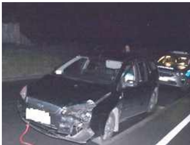
Za kierownicą siedział mężczyzna, który na widok policjantów wysiadł z pojazdu. Jak się okazało, był pod wyraźnym wpływem alkoholu

POWIAT OPOLSKI: Policjanci z opolskiej drogówki zatrzymali 31-letniego mieszkańca powiatu opolskiego podejrzanego o kierowanie pojazdem w stanie nietrzeźwości oraz posiadanie narkotyków.