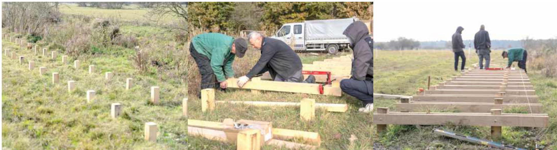
Budowa kładki na łączyńskich błotach

Ponad 1800 drewnianych pali zostało już wbitych w torfowe podłoże na łączyńskich błotach, a kolejnych 500 czeka na montaż. Właśnie ruszyły prace przy budowie kładek spacerowych, które wkrótce staną się jedną z najbardziej malowniczych tras rekreacyjnych w Łęcznej.