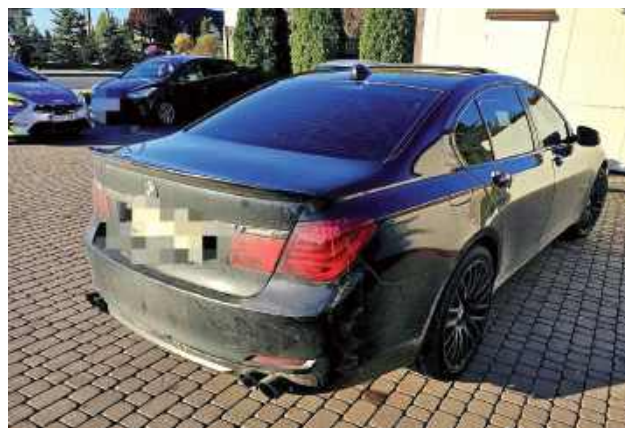
BMW kierowała 30-letnia mieszkanka powiatu lubartowskiego

Patrol policji zastał opisywany samochód przed sklepem w Skrobowie Kolonii, był tam też świadek