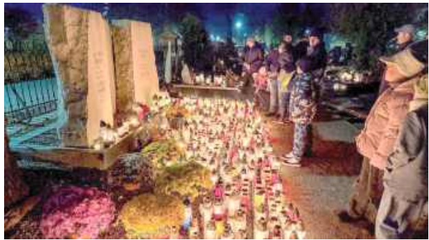
Cmentarz Parafialny w Łęcznej

Mieszkańcy odwiedzali groby swoich bliskich, przynosząc