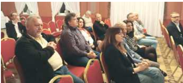
Uczestnicy spotkania w Starej Łażni

więć coś takiego w sytuacji, gdy Francja i Niemcy są po naszej stronie w kwestii bezpieczeństwa, gdy Francja jest po naszej stronie w sprawie umowy z krajami Mercosur, która jest niekorzystna dla naszego rolnictwa? Tusk z Macronem chcą tę umowę zmienić. To nie jest tylko gadanina starszego pana odklejonego od rzeczywistości, to jest niebezpieczne - powiedział poseł. Pozytywnym według niego jest powstanie Koalicji Obywatelskiej z połączenia dawnej PO, Inicjatywy Polskiej i Nowoczesnej. Pozytywnie ocenił też, że rząd Donalda Tuska ma wreszcie rzecznika prasowego. Ale to właśnie Adam Szłapka, rzecznik rządu, był pierwszym obiektem krytyki ze strony uczestników spotkania.