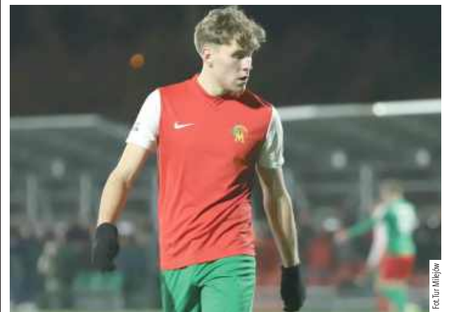
Zespół Tura sprawił sporo problemów Ładzie Biłgoraj, ale z wyjazdu wraca bez punktów

Tur ambitnie walczył z faworyzowaną Ładą, ale podopieczni Tomasza Zająca minimalnie przegrali w domu faworyta 2:1.