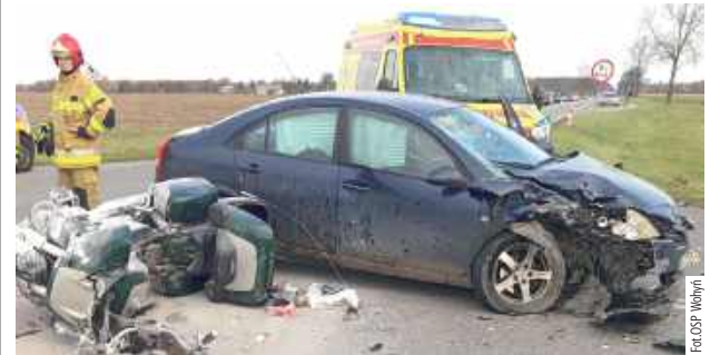
W niedzielę, 2 listopada na drodze krajowej nr 63 w Bezwoli na skrzyżowaniu kierującym z Wohynia do Międzyrzecza Podlaskiego kierujący Nissanem nie ustąpił pierwszeństwa i zderzył się z motocyklem. 44-latek kierujący jednośladem trafił do szpitala, a na miejscu ładował śmigłowiec ratunkowy.