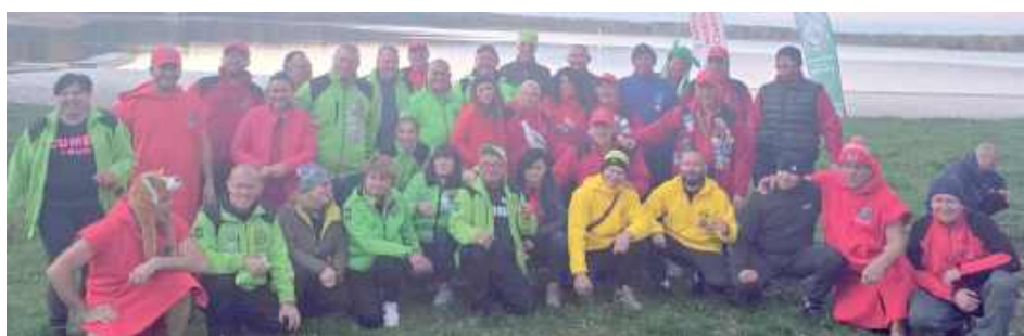
Morsy z Corsy