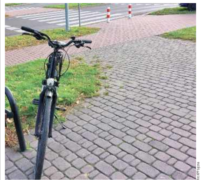
Uczestnicy wypadku byli trzeźwi

ŁĘCZNA: W Łęcznej kierująca Nissanem potrąciła rowerzystę przejeżdżającego przez przejście dla pieszych.