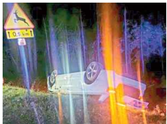
Jak ustalili funkcjonariusze, to właśnie nadmierna prędkość połączona z alkoholem doprowadziła do utraty panowania nad pojazdem i dachowania

Do zdarzenia doszło wczoraj po godzinie 3. Dyżurny opolskiej komendy otrzymał zgło-