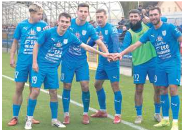
Dzięki wygranej Lewart odniósł jedenaste zwycięstwo w sezonie, w tym szóste przed własną publicznością, umacniając swoją pozycję wicelidera IV ligi lubelskiej

W kolejnych minutach biało-niebiescy kilkakrotnie groźnie atakowali. W 18. minucie Dorian Paluch minął obrońcę, a Dawid Skoczylas zagrał w pole karne, jednak strzał głową Żelisko został obroniony przez bramkarza. Goście