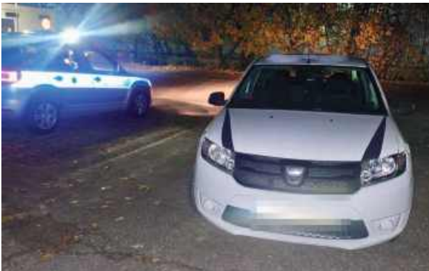
Aż ośmiu nietrzeźwych kierowców zatrzymali we Wszystkich Świętych policjanci z Lubartowa

Aż ośmiu nietrzeźwych kierowców zatrzymali we Wszystkich Świętych policjanci z Lubartowa. Niechlubnym rekordzistą został obywatel Ukrainy, który miał aż trzy promile alkoholu we krwi.