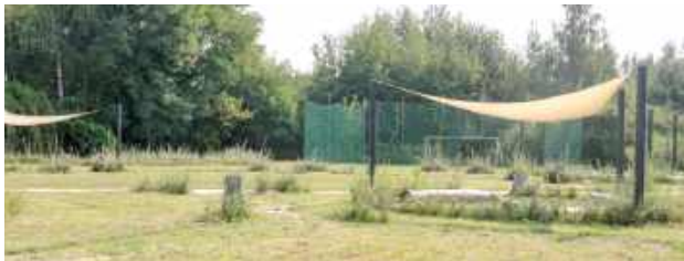
Zakątek relaksu, realizacja jednej z poprzednich edycji budżetu partycypacyjnego

Budżet został podzielony na trzy części: pierwszą – przyrodniczą, drugą – poświęconą dzieciom i młodzieży oraz trzecią – osiedlową. Mieszkańcy w „zielonym” budżecie najczęściej głosowali na projekt zakładający ustawienie około 30 ławek na osiedlach. Miejsca ich rozstawienia mają być konsultowane z radami osiedli. Podobny projekt realizowany był już w przeszłości i cieszył się dużym zainteresowaniem na etapie głosowania, a także pozytywnym odbiorem po realizacji. Teraz ławek będzie jeszcze więcej. Warto dodać, że będą one ustawiane wyłącznie na terenach gminnych – o ławki w okolicach bloków muszą zadbać już spółdzielnie mieszkaniowe. Koszt realizacji wniosku to 40 tysięcy złotych.