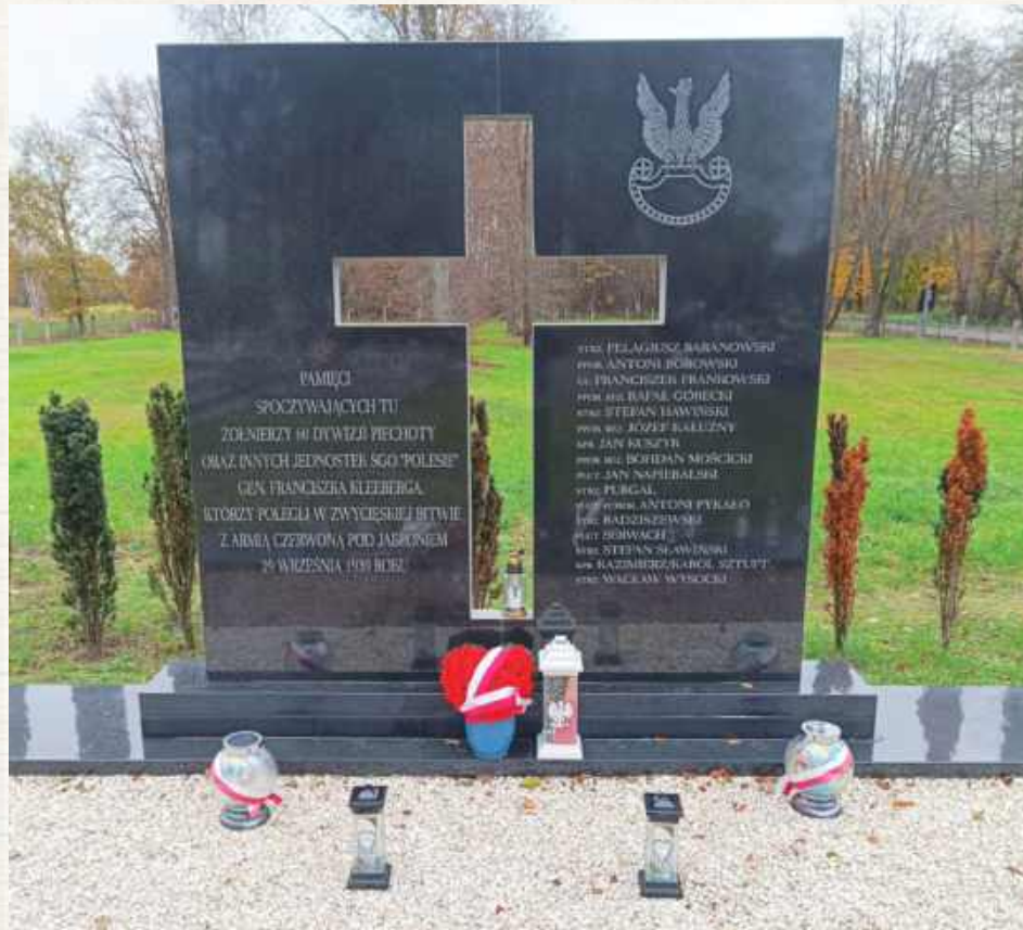
Grob żołnierzy poległych w zwycięskim starciu z Sowietami pod Jabłoniem otoczony jest troską mieszkańców

Jabłoń, podobnie jak wszystkie okoliczne miejscowości, ma bogatą i urozmaiconą historię, przeżywała wiele zmian. Co najmniej od XVI wieku istniała tu parafia prawosławna, potem unicka, pod wezwaniem Świętej Trójcy. W czasie rozbiorów, po powstaniu styczniowym, przekształcono ją, tym razem pod policyjny przymusem,