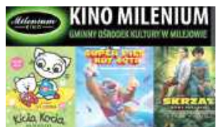
Repertuar Kina Milenium w Milejowie

Na ekranie pojawią się m.in. takie tytuły jak: „Kicia Kocia ma braciszka”, „Super Pies i Kot Łotr”, „Skrzat. Nowy początek”, a także muzyczny film „Chopin! Chopin!”. Nie zabraknie również propozycji dla dorosłych – komedii „Seks dla opor-