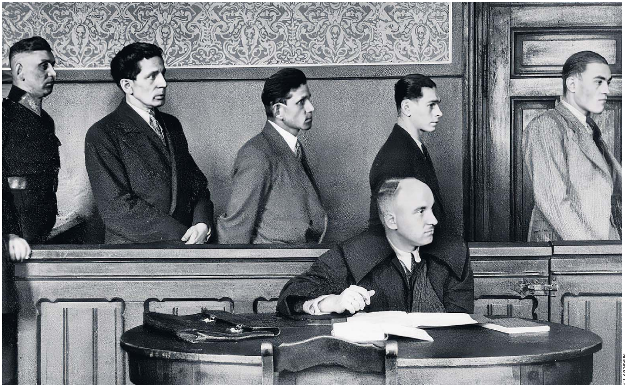
Sąd w Chorzowie. Rozpoczyna się proces sprawców napadu na Bank Ludowy w Świętochłowicach. Lata 30. XX wieku

● Plan napadu przedstawiony w filmie „Vabank” Jerzego Machulskiego powstał naprawdę ● Przedwojennych kasiarzy, lepszych od sławnego „Szpicbródki”, było zdecydowanie więcej ● Jeden ze skoków na bank w szwajcarskiej Bazylei wymagał stworzenia 80-metrowego podkopu