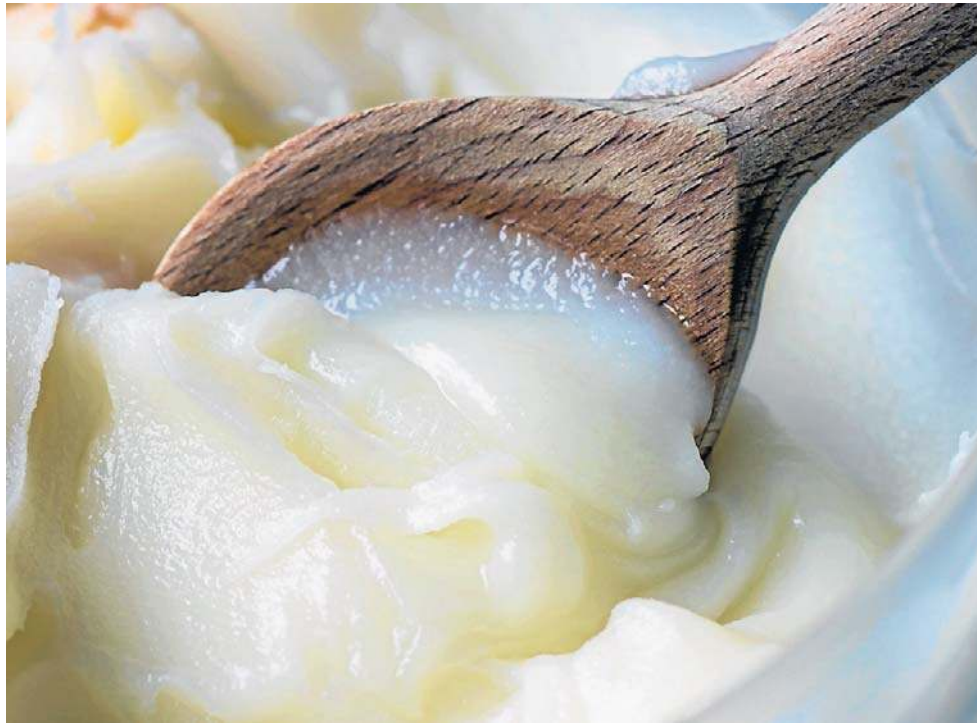
Smalec gęsi ma długą tradycję stosowania zarówno w kuchni, jak i w medycynie naturalnej.

nych krwinek, prawidłowego funkcjonowania układu nerwowego i wykorzystywania energii z pożywienia,