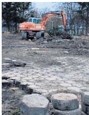
Nowy parking przyjmie blisko 80 samochodów.