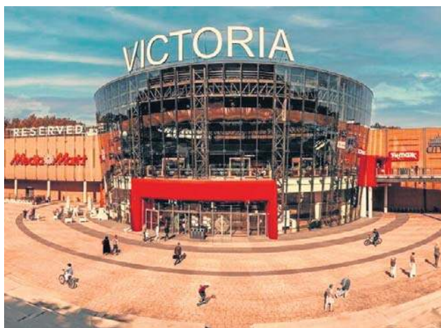
Nowy produkt największego centrum handlowego w Wałbrzychu powinien się spodobać klientom przed świętami.

- Doskonale wiemy, że idealny prezent to taki, który daje radość wyboru. Dlatego wprowadziliśmy Kartę Podarunkową Galerii Victoria: prostą, praktyczną i uniwersalną. Sprawdzi się zarówno jako upominek dla bliskich, jak też narzędzie dla firm, wspierających system motywacyjny czy bene-