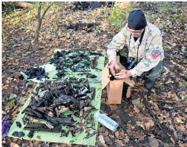
Każda wydobyta część była pieczołowicie badana.

elementów, ale to pomaga tylko częściowo. Na przykład łączka mogła być stosowana zarówno w Lancasterach, jak i w Wellingtonach (to dwusilnikowy średni bombowiec okresu II wojny światowej, budowany w zakładach Vickers - przyp. red.). A przewód pasował także do myśliwca Spitfire. To tylko przykład, który ma pokazać, z czym się mierzymy. Dokumentacja tych bombowców to około 23 tysięcy teczek papierowych, z czego tylko część jest zdigitalizowana. Reszta to żmudne, ręczne przeglądanie archiwów.