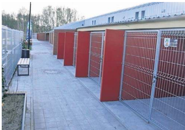
Schronisko ma ponad 60 boksów dla psów i ponad 30 dla kotów. Zastosowane tu różne nowoczesne rozwiązania.