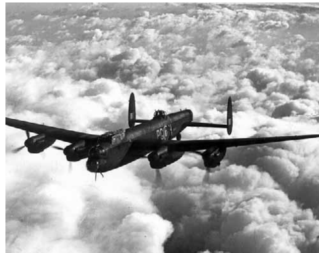
Lancastery ponad 80 lat temu bombardowały Szczecin.

- Jesteśmy na etapie eliminowania poszczególnych maszyn, które zostały utracone nad niemieckim Stettinem. Dysponujemy tabelami lotów i listami załóg Lancasterów, które nie wróciły z Szczęcina. Tego materiału jest bardzo dużo, a nadal nie mamy numeru bocznego naszej maszyny - mówi poszukiwacz. - Na podstawie pewnego bardzo lakonicznego opisu wytypowaliśmy jedną konkretną maszynę. Teraz musimy