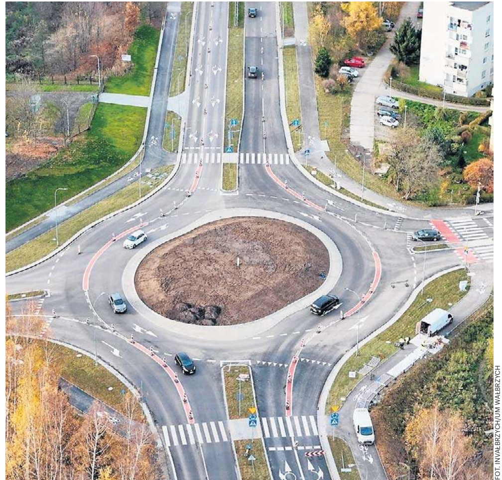
Nowe rondo turbinowe na niebezpiecznym skrzyżowaniu ul. Sikorskiego z Moniuszki.

13 listopada około godziny 21.00 właścicielka posesji przy ul. Wilczej w dzielnicy Lubiechów zauważyła na monitoringu dwóch mężczyzn, którzy kręcili się przy jej pomieszczeniach gospodarczych. Powiadomiła natychmiast policję. Mundurowi zastali na terenie posesji dwóch mieszkańców miasta w wieku 19 i 30 lat, którzy chwilę wcześniej przecięli nożycami kłódki oraz łańcuch, a następnie dostali się do wnętrza komórki. Ich celem była kradzież różnego rodzaju narzędzi ręcznych, żeliwnych kaloryferów, metalowych kątowników oraz kolorowego złomu o łącznej wartości około 10 tysięcy złotych. Funkcjonariusze zatrzymali włamywaczy na gorącym uczynku. Obydwaj trafili do policyjnej celi, grozi im teraz do 10 lat odsiadki. PG