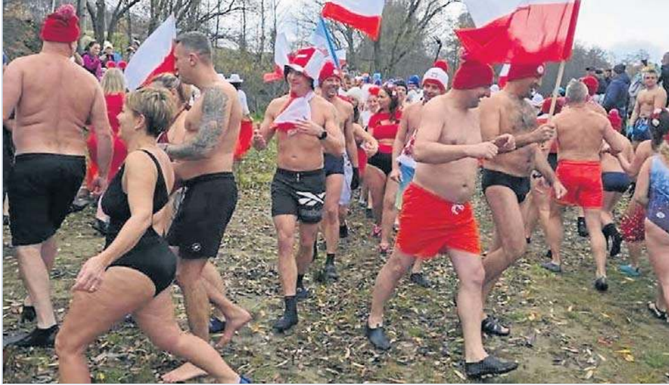
Zaczęło się jak zawsze - od zbiorowej rozgrzewki. Sama w sobie jest świetną zabawą!