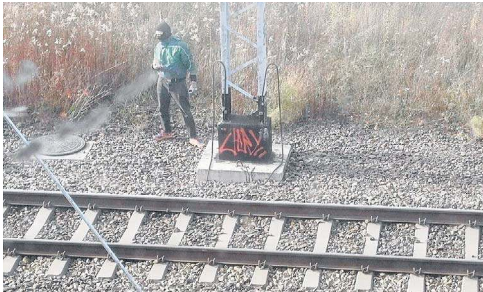
Zamaskowany mężczyzna kręcił się w okolicach stacji kolejowej na Szczawienku.

Jak zaznaczyli, od początku inwazji Rosji na Ukrainę w 2022 roku polskie służby specjalne odnotowują gwałtowny wzrost