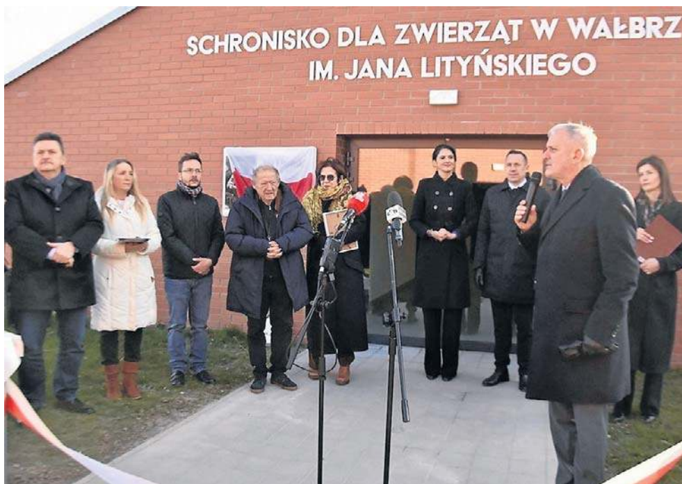
Schronisko dla Zwierząt im. Jana Lityńskiego zostało oficjalnie otwarte 21 listopada.