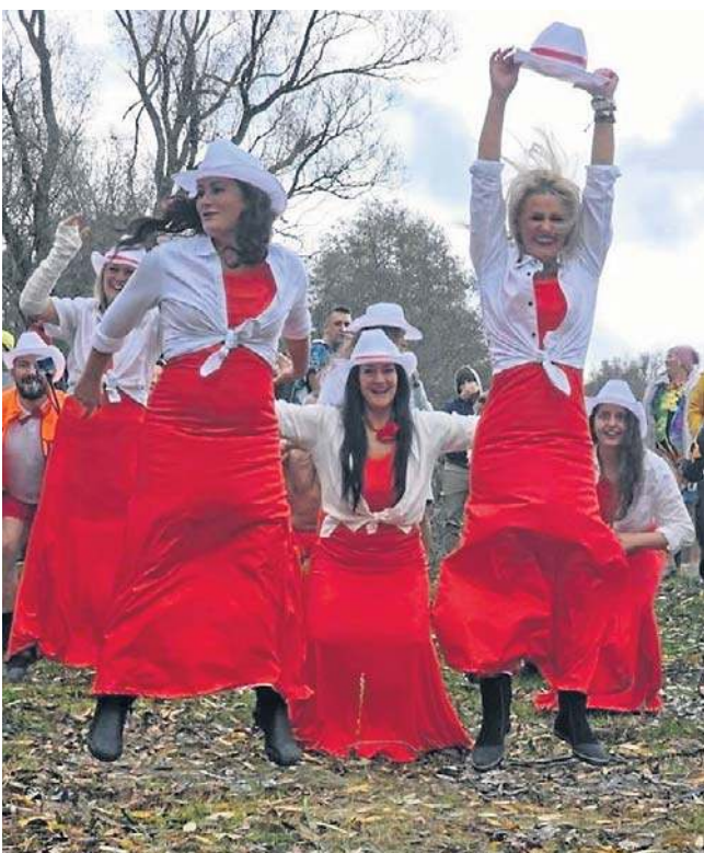
Fruwające damy w biało-czerwonych strojach? To znakomite połączenie zabawy z dbałością o historię.