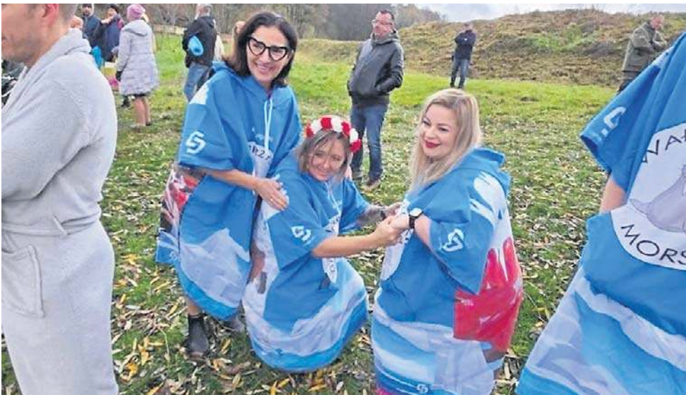
Grupa ma jednakowe stroje. Świetnie wyglądają, a przy tym są... bardzo fotogeniczne.