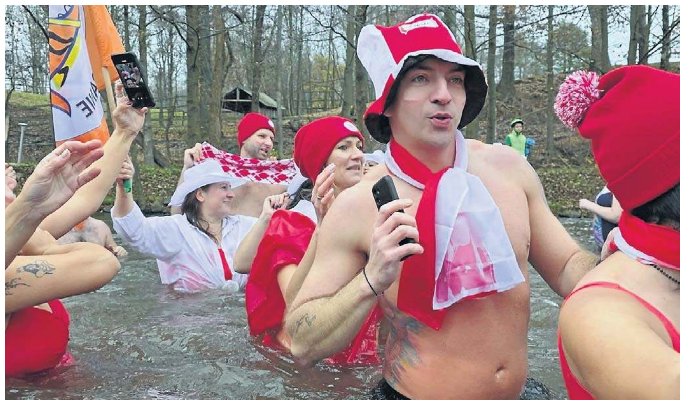
No i przyszedł długo wyczekiwany moment - pierwsze wejście do lodowato zimnej wody w sezonie 2025-2026.