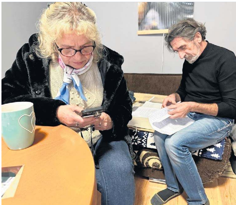
Rodzice nie wierzą w wypadek syna. - Pójdziemy nawet do ministra Żurka! - zapowiadają.