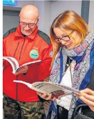
FOT. STARA KOPALNIA W WAŁBRZYCHU

To element promocji wydawnego właśnie katalogu, w którym zebrano najciekawsze znaleziska z terenu Wałbrzyska, Aglomeracji