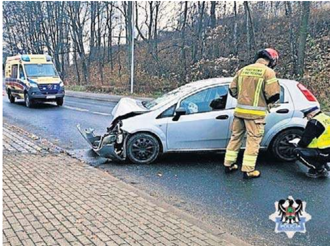
Samochód zniszczony, kierująca i jej pasażerka trafiły z obrażeniami do szpitala. Po co było tak pędzić?!