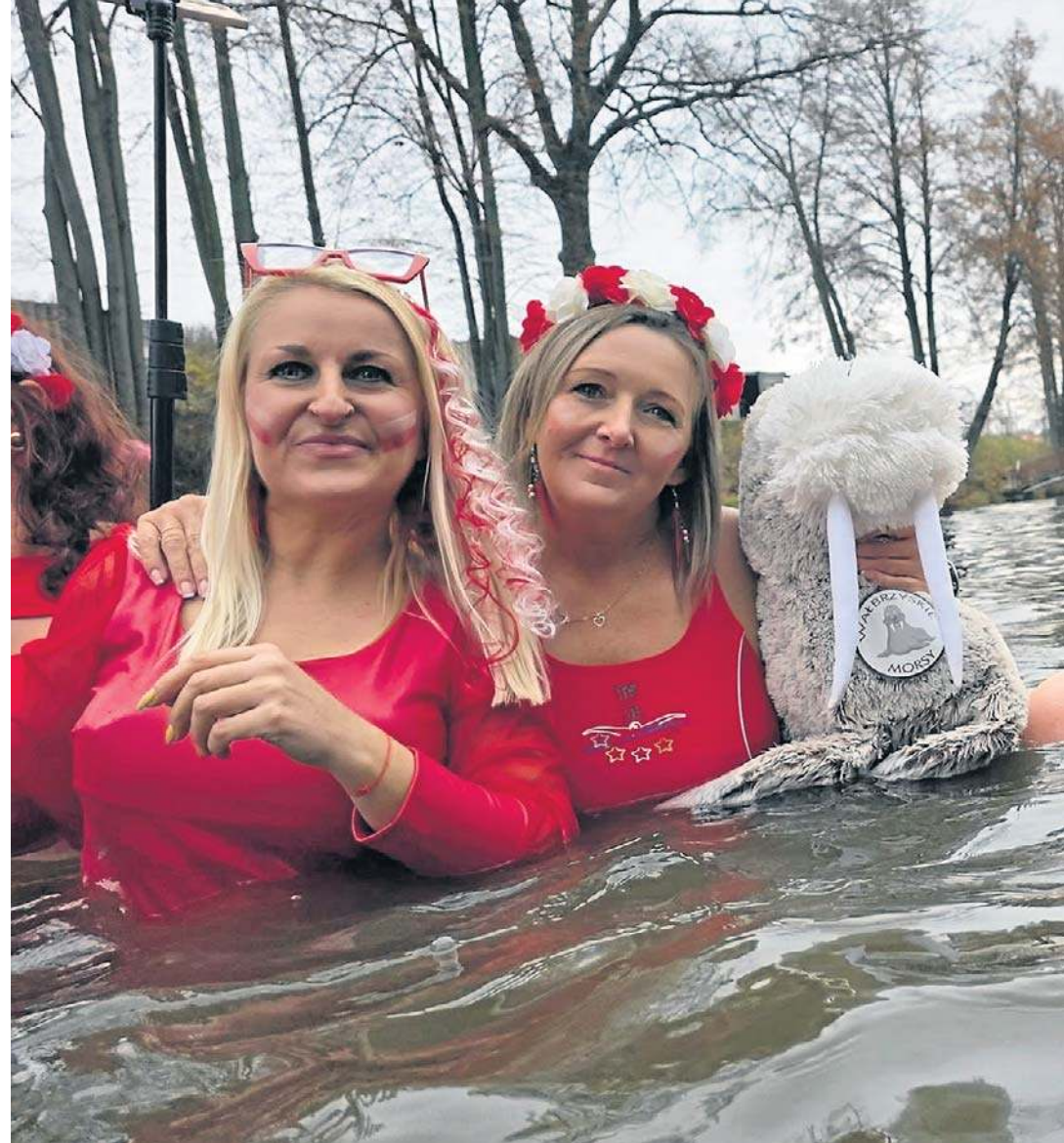
Wałbrzyskie Morsy, kąpiące się przy Karczmie Góralskiej w Dziećmorowicach rozpoczęły kolejny sezon.