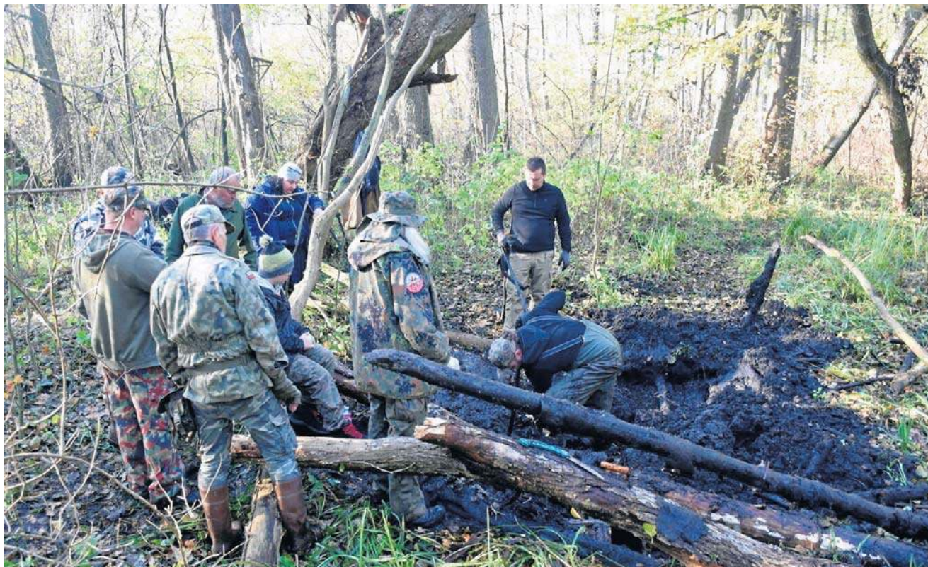
Miłośnicy historii z „Arche Gryfu” zapowiedzieli powrót na Wyspę Pucką, żeby kontynuować poszukiwania.

Udało się odczytać kilka numerów serii z poszczególnych