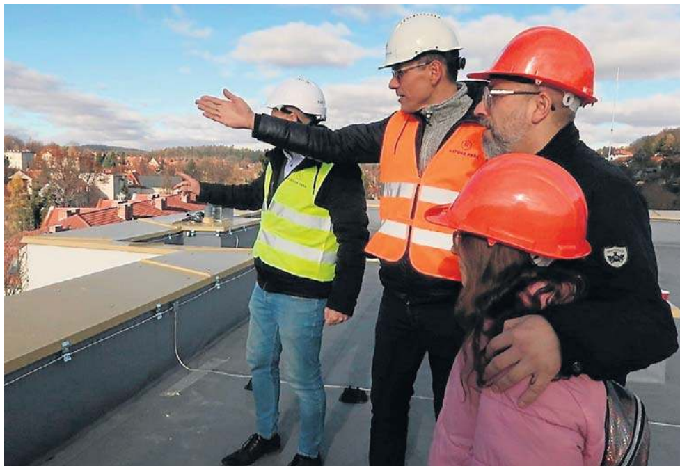
Przyszli mieszkańcy osiedla Kątova Park byli zachwyceni otoczeniem budynków.

Jak poinformował naszą redakcję inwestor, na 10 miesz-