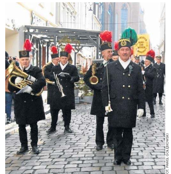
W Wałbrzychu obchody Barbórki to trwający kilka dni Festiwal Tradycji Górniczych. Tegoroczny będzie bogaty!

* 17.00 - Karczma Piwna (łaźnia łańcuskowa, wydarzenie biletowane tylko dla mężczyzn, tradycyjne spotkanie górnicze, pełne humoru i obrzędów).