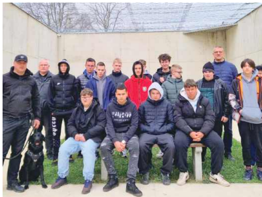
Uczniowie zwiedzili spacerniak, cele, bibliotekę, salę spotkań i inne miejsca.