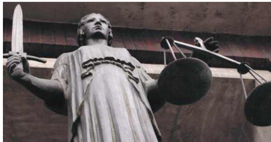
Sprawa o zabójstwo w Borowie toczy się przed wrocławskim sądem okręgowym