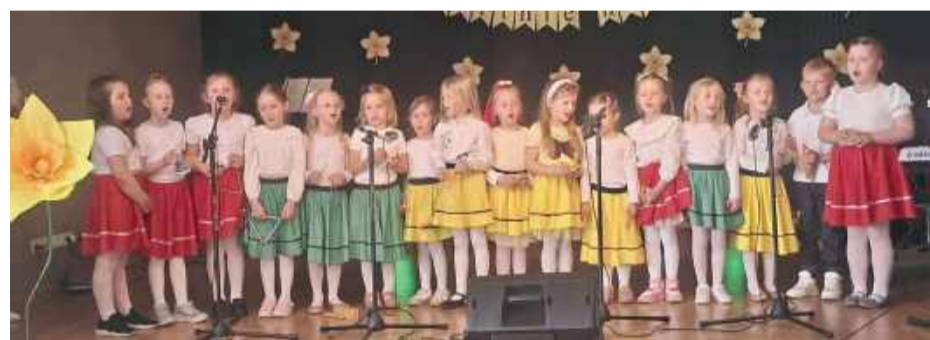
Dzieci z ogromnym zaangażowaniem występowały na scenie.

moje serce radoowało się, że tak wiele osób chciało poświęcić swój czas i zrobić razem coś dobrego.