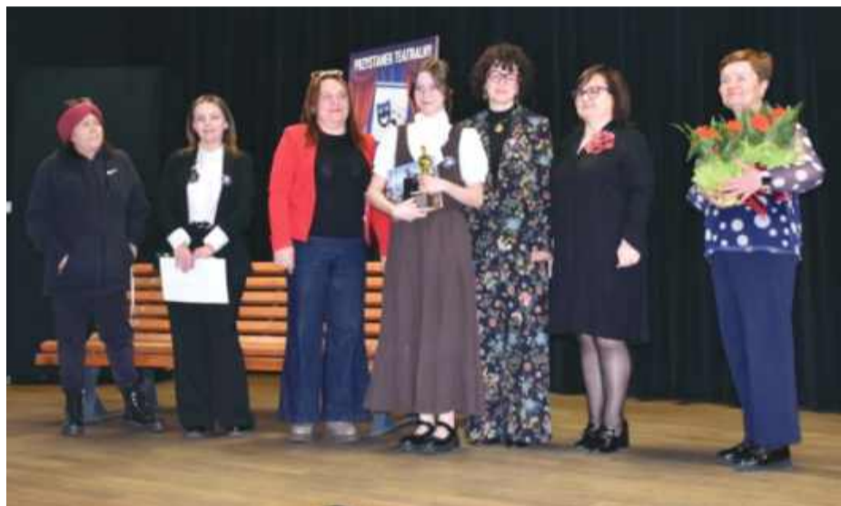
Jedna z laureatek w towarzystwie jurorów i organizatorów wydarzenia.

opowieść o uczniu, który nie lubi szkoły, po pełnej emocji i wzruszeń historii, m.in. dziewczynki z od-