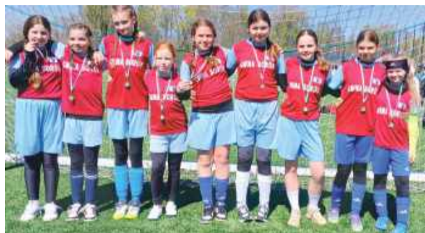
Piłkarki z gminy Borów awansowały do kolejnego etapu

ale przede wszystkim uczy współpracy, zasady fair play i radości z gry. Strzeleńskie eli-