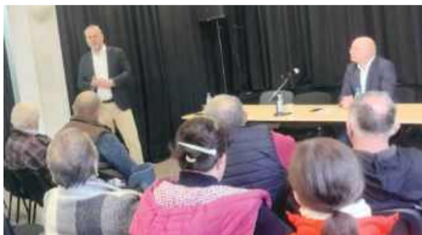
W piątek, 24 kwietnia, odbyło się spotkanie w Gminnym Ośrodku Kultury w Kondratowicach.

pyta”. W wydarzeniu uczestniczyli przedstawiciele Prawa i Sprawiedliwości, sympatycy ugrupowania oraz członkowie Klubu Gazety Polskiej – zarówno z Wrocławia, jak i z okolicznych miejscowości.