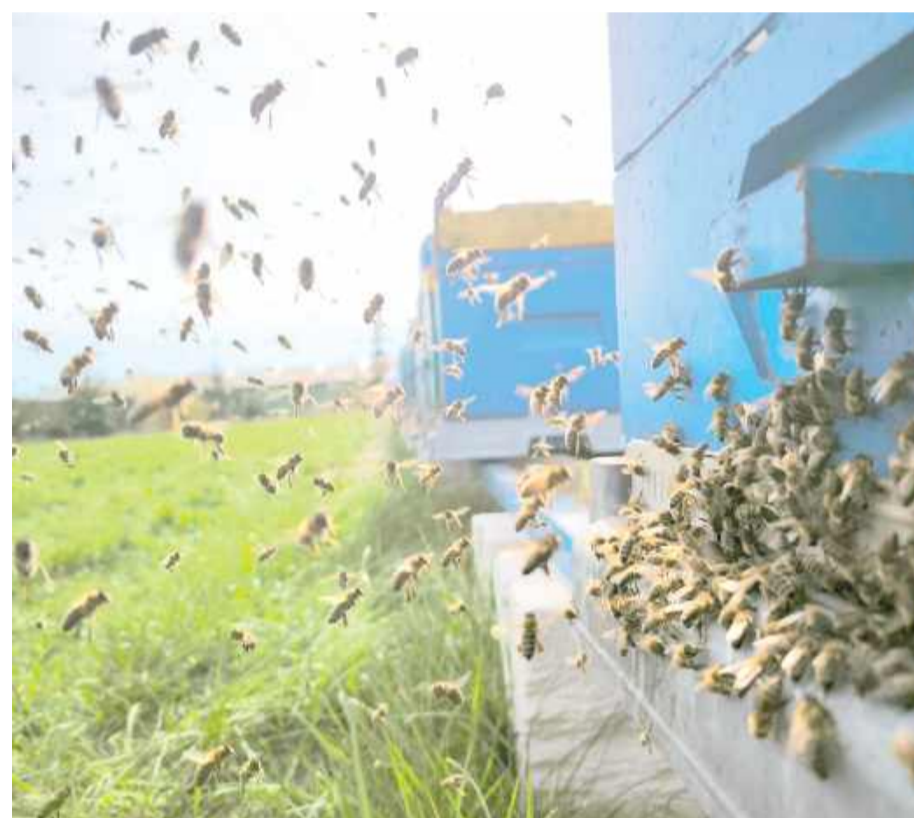
Minister klimatu przekonuje, że rząd nie ma planów likwidacji pasiek. Tłumaczy, że to kolejny fejk prawicy, a projekt Krajowego Planu Odbudowy Zasobów Przyrodniczych nie został jeszcze przyjęty.

– Faktem jest, że dzikie zapylacze wymierają i musimy ten proces zatrzymać. Liczebność populacji dzikich pszczół i trzmieli drastycznie spada. Będziemy je chronić, ale nie przez niszczenie pasiek. Chodzi o promowanie łąk kwietnych, rodzimych gatun-