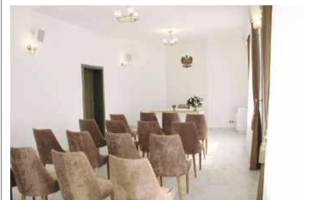
Sala ślubów w Urzędzie Gminy Borów została już wyremontowana.