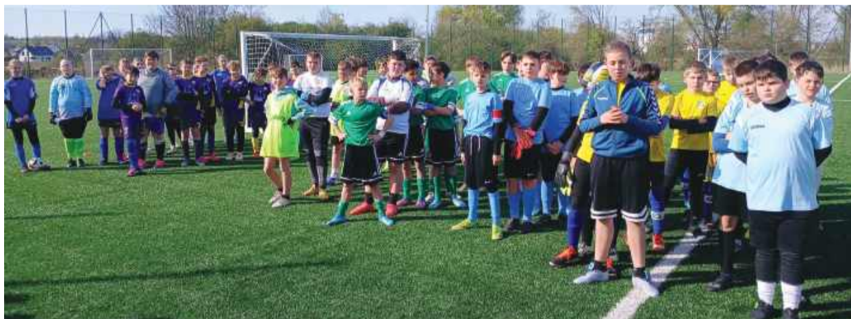
Wydarzenie przyciągnęło setki młodych zawodników

Drugiego dnia emocje były jeszcze większe. Na boiskach rywalizowały drużyny chłopców w kategoriach U-10 i U-8. Dynamiczna gra, szybkie akcje i ogromne zaangażowanie młodych