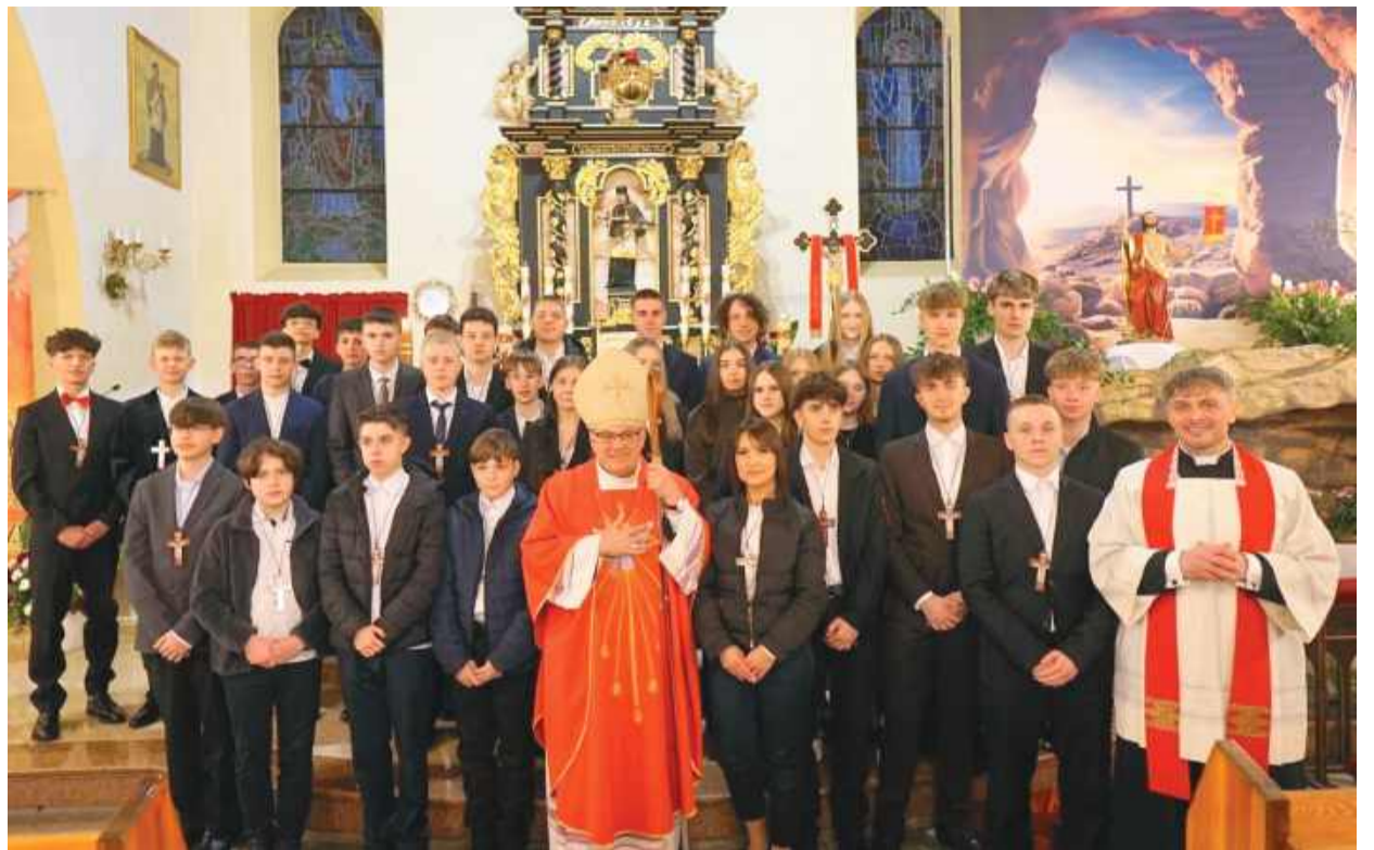
Pamiątkowe zdjęcie biskupa Jacka Kicińskiego z bierzmowanymi i księdzem proboszczem Mariuszem Trojanowskim.