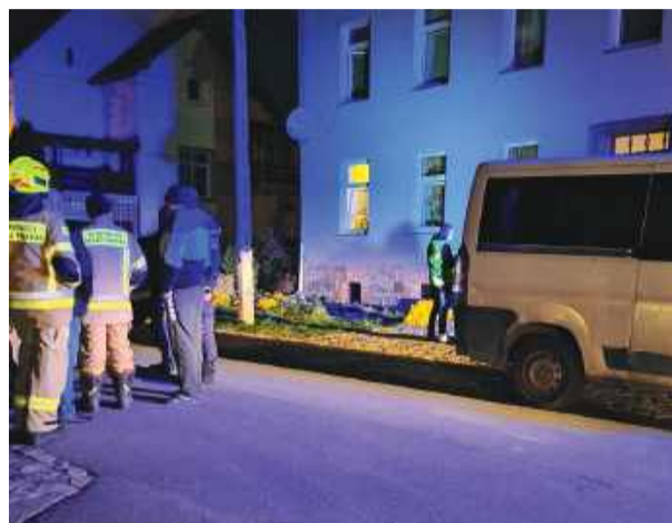
Do zatrucia czadem doszło w budynku wielorodzinnym przy ulicy Pocztowej w Przewornie.

dzięki postawie jednego z mieszkańców udało się uniknąć kolejnych ofiar –