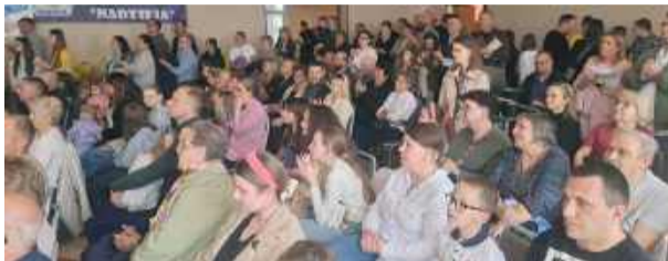
Sala GCK-E w Borku Strzelińskim była wypełniona po brzegi ludźmi o wielkich sercach.

Po południu, widząc te wszystkie ciasta przywieszane przez koła gospodyń wiejskich, rodziców uczniów szkół z gminy Borów i sołectwo Zielenice oraz osoby, które kroili je i pakowały,