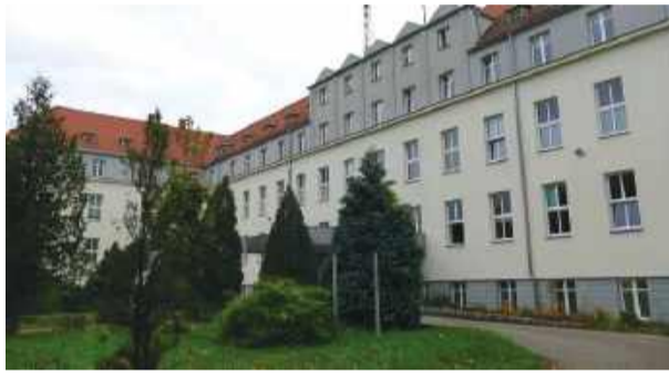
W jakiej kondycji jest szpital w Strzelinie? Czekamy na odpowiedź od rzecznik placówki

– Niewątpliwie problemem będą pieniądze i brakujące kilkanaście miliardów złotych na leczenie. Tu jednak może