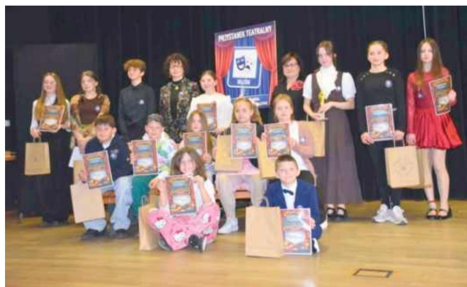
Uczestnicy teatralnego konkursu na pamiątkowej fotografii.

działu onkologicznego czy bohaterki „Dziewczynki z zapalkami”. Nie zabrakło także klasyki jak „Mały