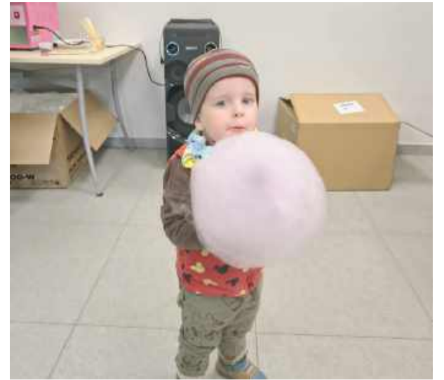
Dzieci mogły liczyć nie tylko na wspólną zabawę, ale również słodki poczęstunek po zakończeniu sprzątanía