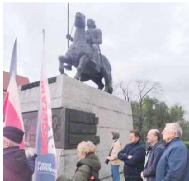
20 kwietnia przy pomniku króla Bolesława Chrobrego przy ul. Świdnickiej we Wrocławiu odbyło się spotkanie w ramach cyklu „Wrocław pyta”.

Kilka dni później, 24 kwietnia, podobne spotkanie odbyło się w Gminnym Ośrodku Kultury w Kondratowicach. Wydarzenie zorganizowano w ramach ogólnopolskiej trasy „Czas Polski – program PiS”.