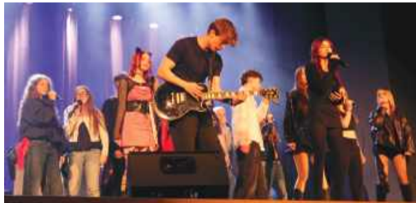
Musical przygotowali uczniowie Niepublicznej Szkoły Muzycznej I stopnia w Ząbkowicach Śląskich

Spektakl łączył elementy teatru, muzyki i tańca. Twórcy zwrócili uwagę na problem hejtu i potrzebę reagowania na takie zjawiska. Młodzi wykonawcy zwró-