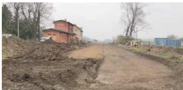
Przy dawnej stacji PKP w Kondratowicach wykonano już prace ziemne przed położeniem torów kolejowych