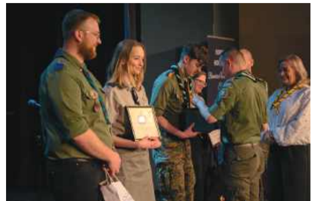
Podczas plebiscytu wyróżniono kadre oraz instruktorów z hufców: Łagiewniki, Oleśnica, Ziemi Dzierżoniowskiej oraz Ziemi Kłodzkiej. Nagrodę odebrały także dwie mieszkanki Strzelina.