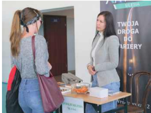
Targi były okazją do rozmów z potencjalnymi pracodawcami

– Zakład Karny w Strzelinie oprócz tego, że może zatrudniać i przyjmować do służby więziennej chętne osoby, czyli przyszłych funkcjonariuszy, którzy przechodzą drogę rekrutacji, to jeszcze ma do wynajęcia nowoczesną halę produkcyjną. Różne osoby, które prowadzą działalność gospodarczą, mogą taką działalność rozpocząć na terenie naszej jednostki. Dodatkowo