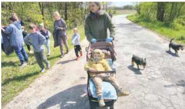
Najmłodszy mieszkańcy Jagielna również wzięli udział w akcji sprzątanía miejscowości – w wydarzenie zaangażowały się całe rodziny

przez całą miejscowość. W trakcie akcji uczestnicy zebrali 28 worków