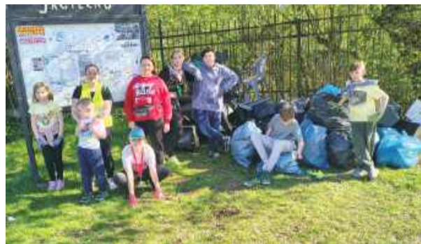
Uczestnicy akcji zebrali 28 worków śmieci