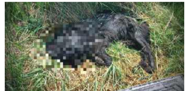
Z ustaleń śledczych wynika, że sprawcy działali wspólnie, zadając zwierzęciu liczne ciosy przy użyciu siekiery i drewnianej kantówki.

– Z ustaleń śledczych wynika, że sprawcy działali wspólnie, zadając zwierzęciu liczne ciosy przy użyciu siekiery oraz drewnianej kantówki. Obaj usłyszeli zarzuty znęcania się nad zwierzęciem ze szczególnym okrucieństwem – informuje Aleksandra Bezrąk, oficer prasowy strzelińskiej policji.