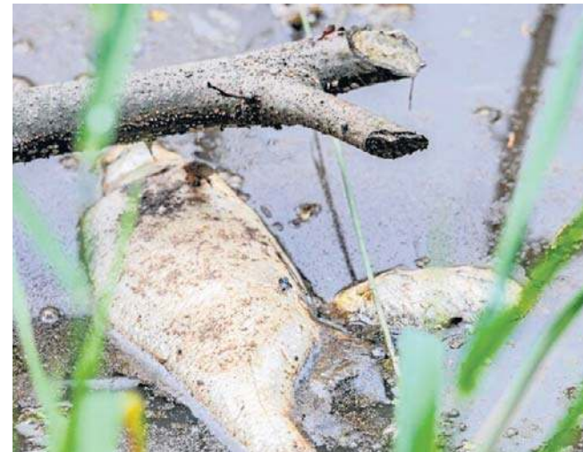
- Lata upłyną, by nowe ryby dorosły do takich rozmiarów, jak te, które teraz leżą martwe - twierdzą wędkarze

ostrzec. Gdy popełniano kolejne błędy, proponowaliśmy pomoc przy odłowach. Wszystkie nasze inicjatywy były ignorowane - piszą wędkarze.