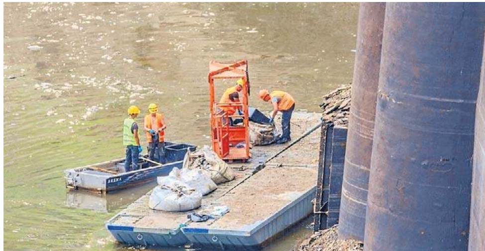
Fala skażonej, pozbawionej tlenu wody z Bobru płynie do Odry w okolicach Krosna Odrzańskiego, a stamtąd wzdłuż granicy z Niemcami do Morza Bałtyckiego.

Pytanie, czy można było przewidzieć, że dojdzie do katastrofy, pojawia się coraz częściej. Wędkarze w Koła Grodzkiego w Jełonej Górze nie mają wątpliwości: można było tego uniknąć. - Doszło do sytuacji, której spodziewaliśmy się wiele miesięcy temu, przed którą próbowaliśmy