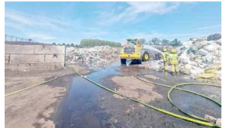
Strażakom udało się zneutralizować źródło ognia.

Na uwagę zasługuje też fakt, że z uwagi na to charakterystykę samego zakładu, ćwiczenia scenariuszowe, w których doszło do zapalenia się sterty odpadów, z udziałem strażaków odbywały się już tu przynajmniej kilkukrotnie. Dlatego też służby, zarówno PSP jak i OSP, na tego