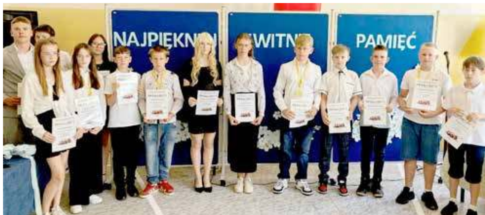
Szkoła Podstawowa w Orzechowie