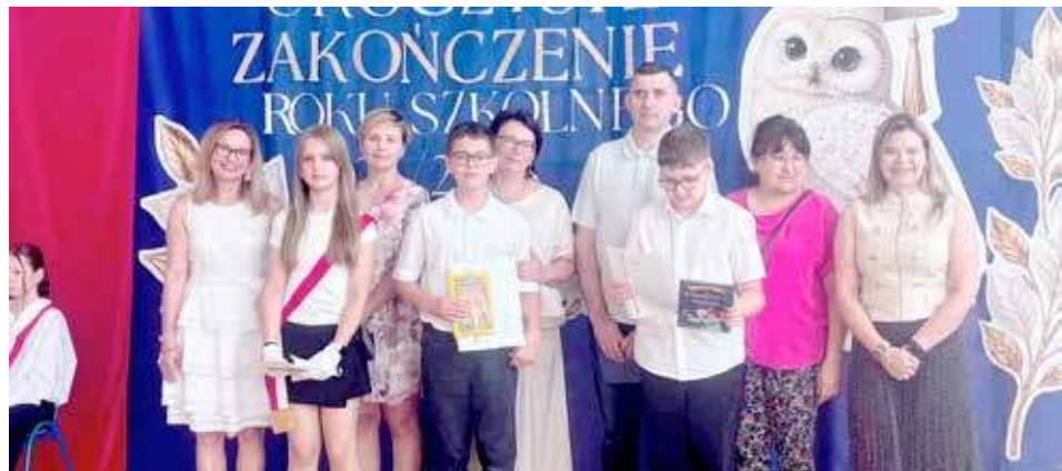
Szkoła Podstawowa w Błotnie im. Polskich Strażaków