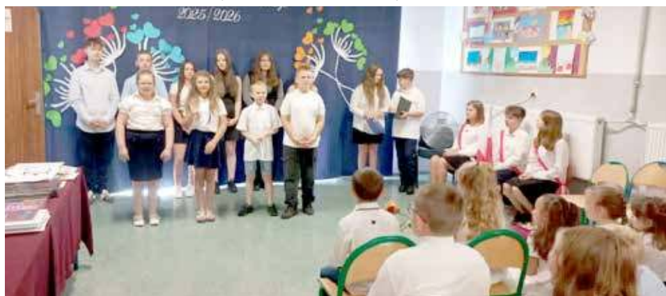
Szkoła Podstawowa w Strzelewie