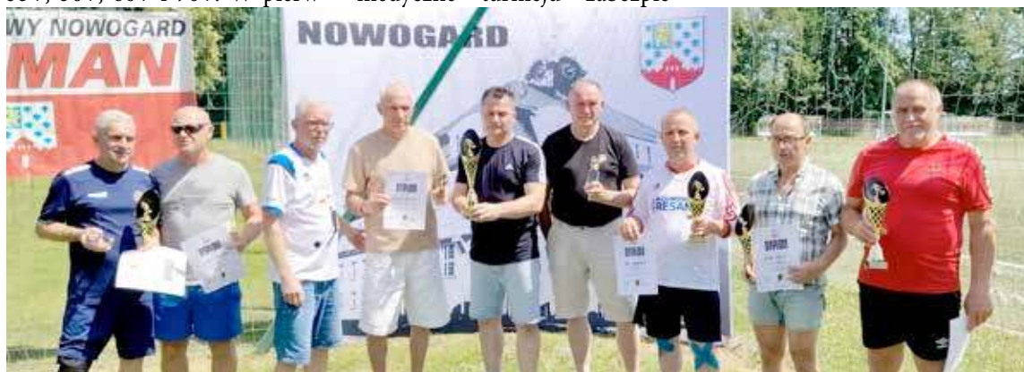
Dekoracja kapitanów drużyn po pierwszej części rywalizacji