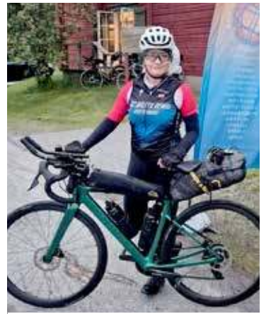
O godz. 23.30. Ciemniej w nocy już nie będzie

- Jazda na rowerze na dystansie ultra daje mi ogromną satysfakcję. Każdy przejechany km to nie tylko wysiłek fizyczny, ale także walka z własnymi ograniczeniami. Są chwile zmęczenia, bólu i zwątpienia, ale właśnie ich pokonywanie sprawia, że na mecie czuję dumę. Podczas wielogodzinnej jazdy liczy się tylko droga, rytm pedałów i otaczający świat. Mam czas by uporządkować myśli, oderwać się od codziennych spraw i po prostu cieszyć się chwilą. Największą nagrodą jest jednak uczucie, że udało się osiągnąć cel. Nie ważne jak trudna była trasa - satys-