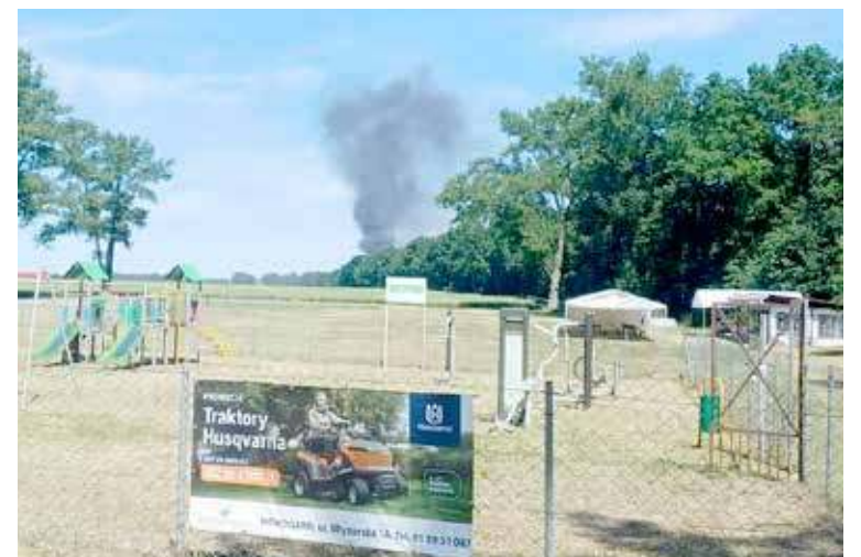
Dym widziany był doskonale z dalszej odległości