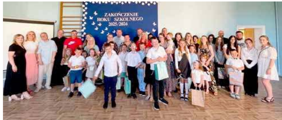
Szkoła Podstawowa w Żabowie