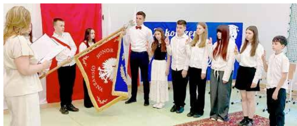
Szkoła Podstawowa w Długoleś im. Ochotniczej Straży Pożarnej