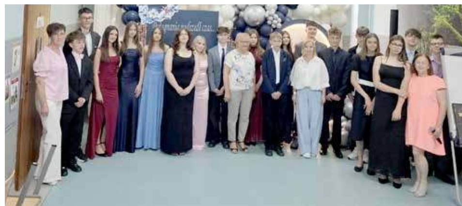
Szkoła Podstawowa w Wierzbicinie