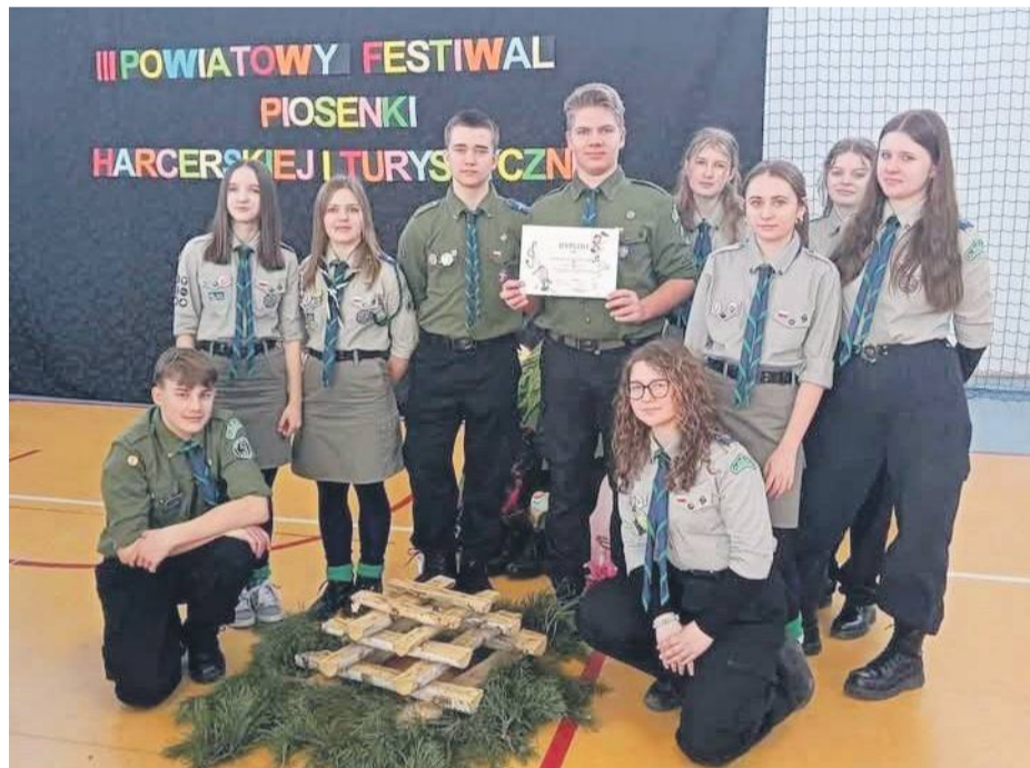
Zespół „Muzyczne Alfy” odniósł już wiele ogólnopolskich sukcesów