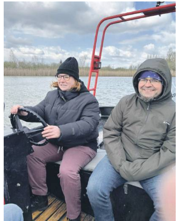
Zajęcia praktyczne na zbiorniku w Kalinowej.

Niebezpieczne wykopaliska podczas prac ziemnych