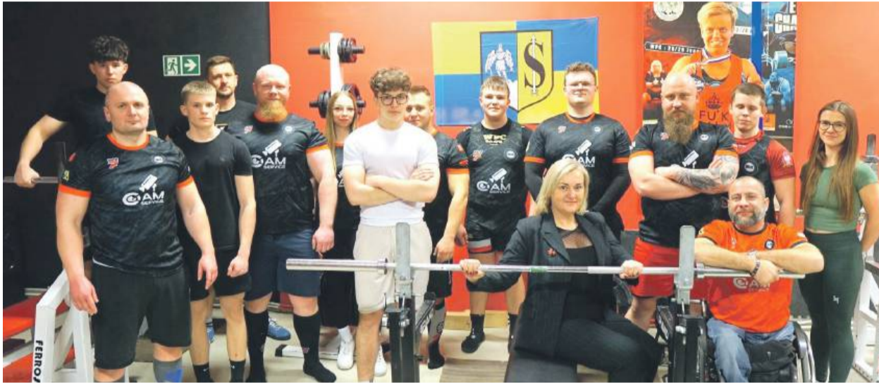
Reprezentanci Hałas Team