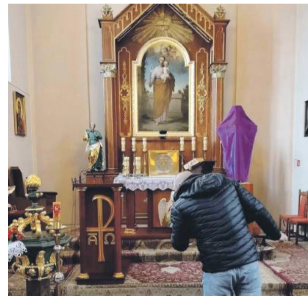
Ekipa programu Drogi Wiary gościła w zabytkowym kościele w Dankowicach