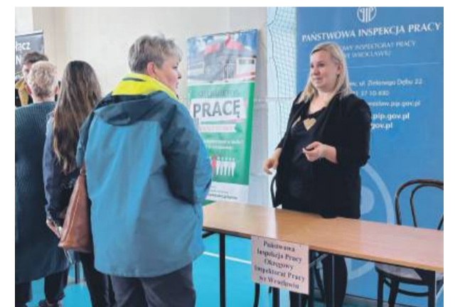
Odwiedzający poszczególne stoiska mieli możliwość porozmawiania z przedstawicielami firm i instytucji oferującymi zatrudnienie.