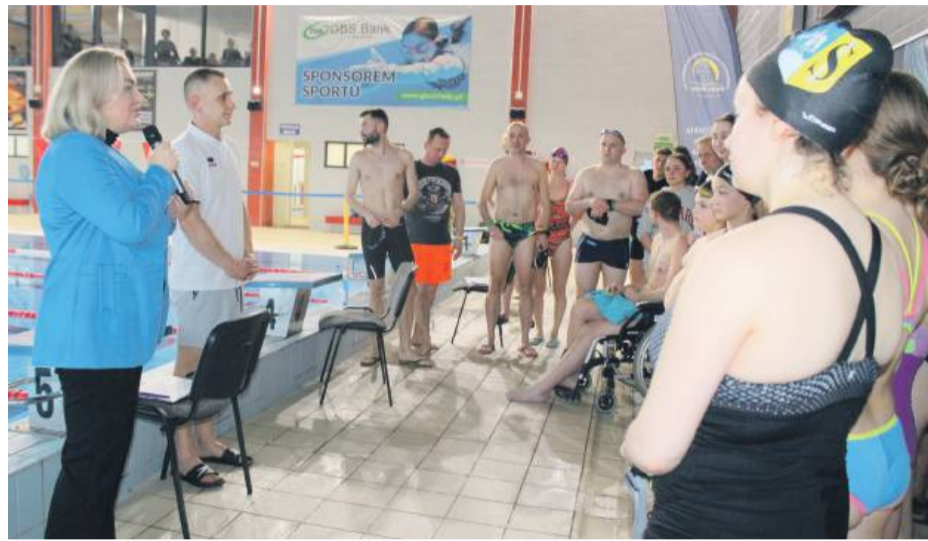
Strzelin szykuje się do kolejnego maratonu pływackiego