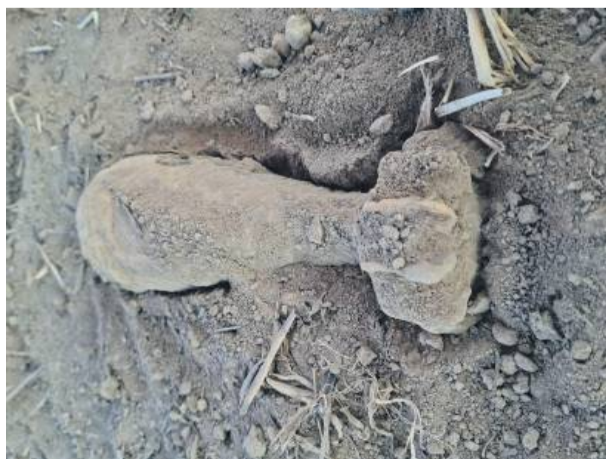
Skorupa pocisku rozrywa się na ponad sto żeliwnych odłamków