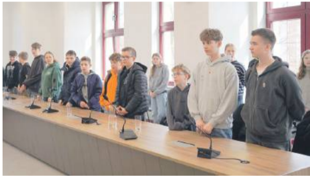
Uczniowie z polsko-niemieckiej wymiany odwiedzili strzeliński ratusz.