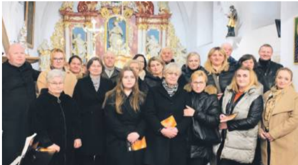
Wielkopostne wzruszenie swoim śpiewem niesie zawsze Zespół Cantanti i goście. Tu na tegorocznej Drodze Krzyżowej w Broczu.

to też zawsze czas pełen potknięć i upadków. Kiedy już sobie myślę, że zdążyłam się na to przeżywanie przygotować – wszystko poprostować, powyjaśniać, ponaprawiać, wtedy tracę czujność i upadam. I to wtedy popatrzę na bliźniego spod byka, będę się upierać przy swoim, a nie przy dobrym, a belka w moim oku będzie niespodziewanie rosła. Dlaczego tak jest?