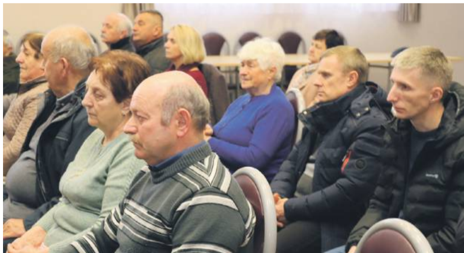
6 kwietnia GOK w Przewornie zgromadził liczną publiczność zainteresowaną tematyką współczesnych mediów