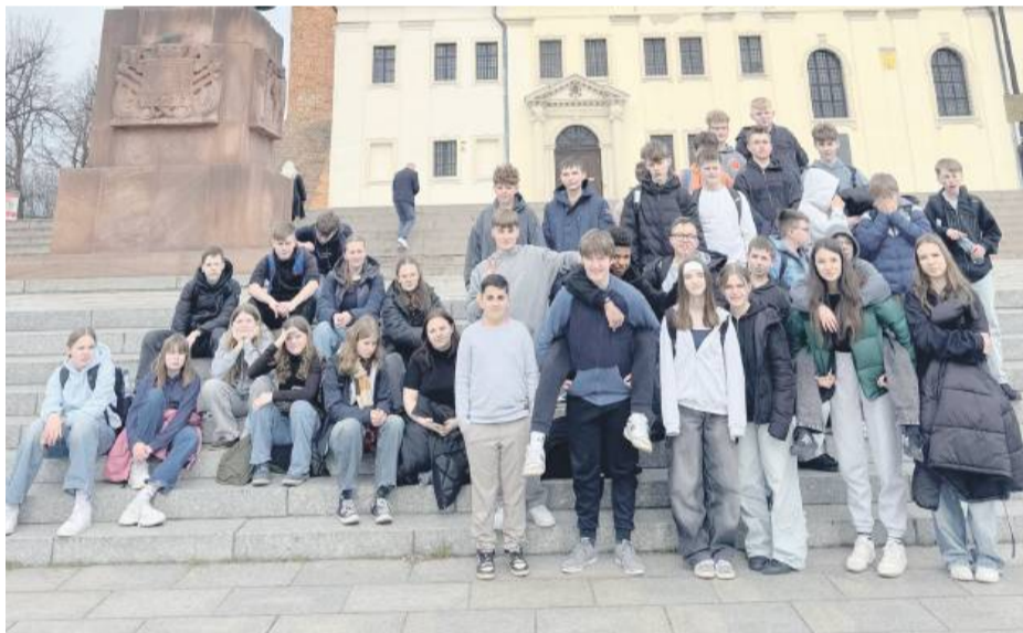
Uczestnicy tegorocznej wymiany

Gminne obchody rocznicy śmierci św. Jana Pawła II