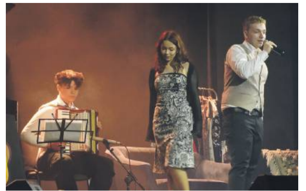
Głównym wątkiem koncertu była kobieta i uczucia