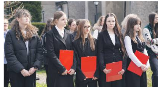
Uczennice klasy siódmej ze Szkoły Podstawowej im. Jana Pawła II w Kuropatniku przypomniały zyciorys Papieża-Polaka i wyrecytowały okolicznościowe wiersze.

Jan Paweł II zmarł 2 kwietnia 2005 roku w wieku 84 lat. Od 2014 roku jest świętym Kościoła katolic-