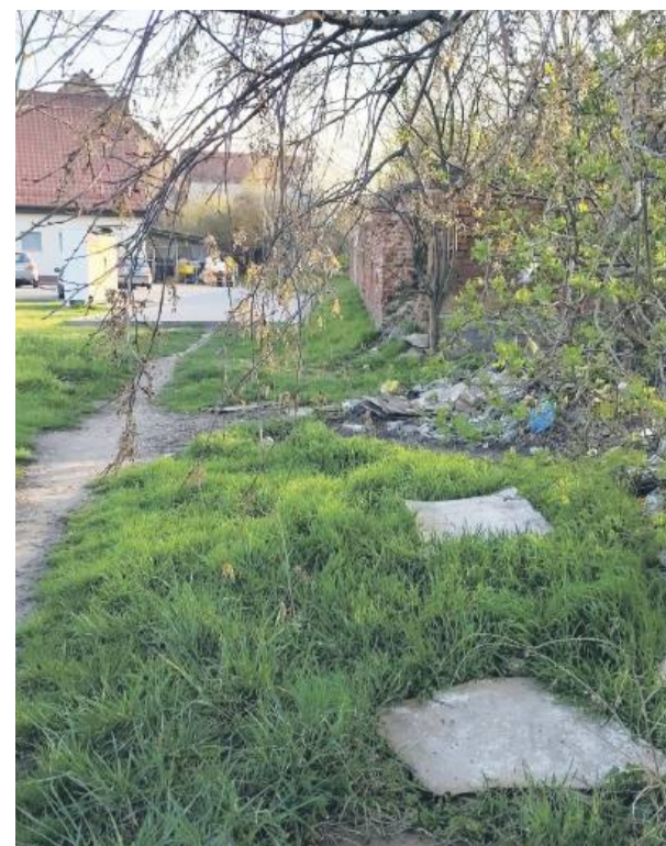
To jedno ze zdjęć przesłanych przez mieszkankę Borka Strzeleckiego, obrazujące wygląd opisywanego miejsca