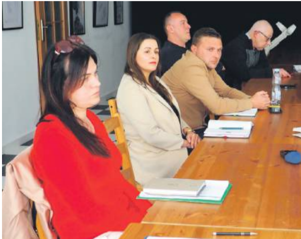
Na Komisji Skarg Wniosków i Petycji mówiono o problemach Akademii Piłkarskiej Wiązów i nielegalnych imigrantach

– Wydarzenia te wzbudziły wiele złych emocji wśród rodziców, ponieważ zostały im przedstawione jako celowe, złośliwe działania wymierzone przeciwko dzieciom. Wynikały one natomiast z niewiedzy, braku komunikacji między obsługą i trenerami obecnymi na treningu