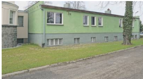
Strzeliński magistrat szuka firmy, która odremontuje drugi budynek, należący do gminnego żłobka.