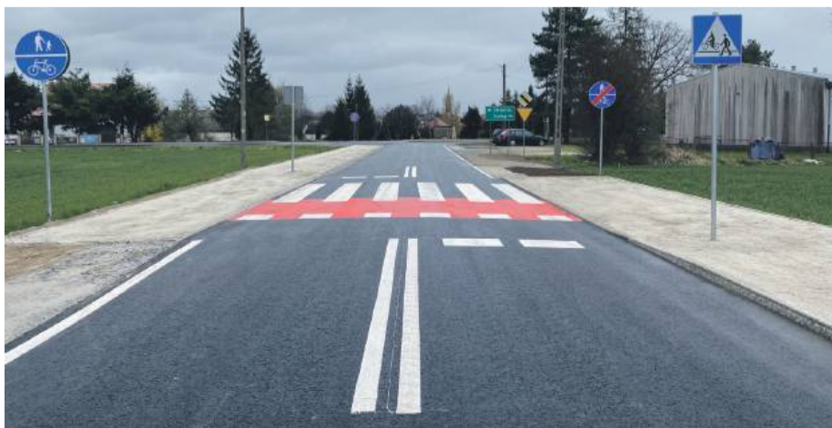
Ul. Siemysławicka w Przewornie