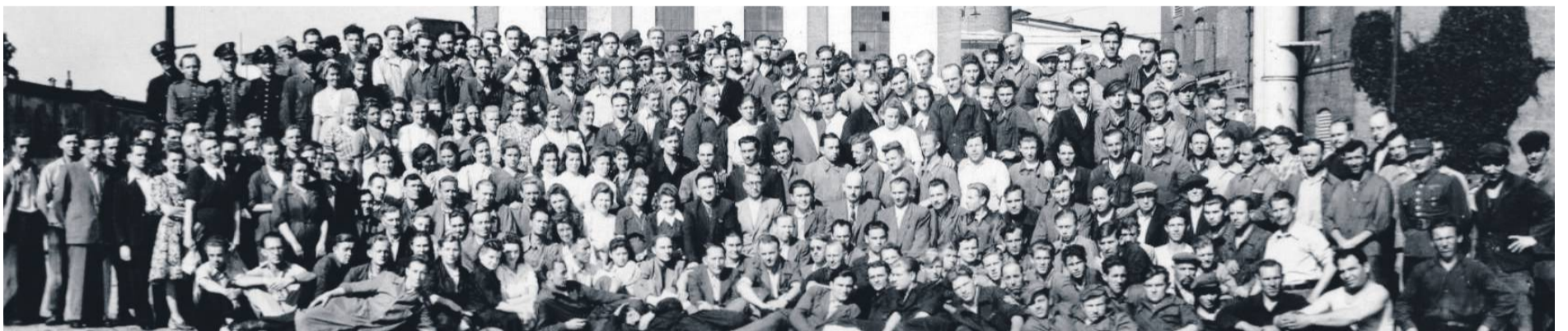
Lata 1946-1949. Pierwsza załoga strzelińskiej cukrowni.