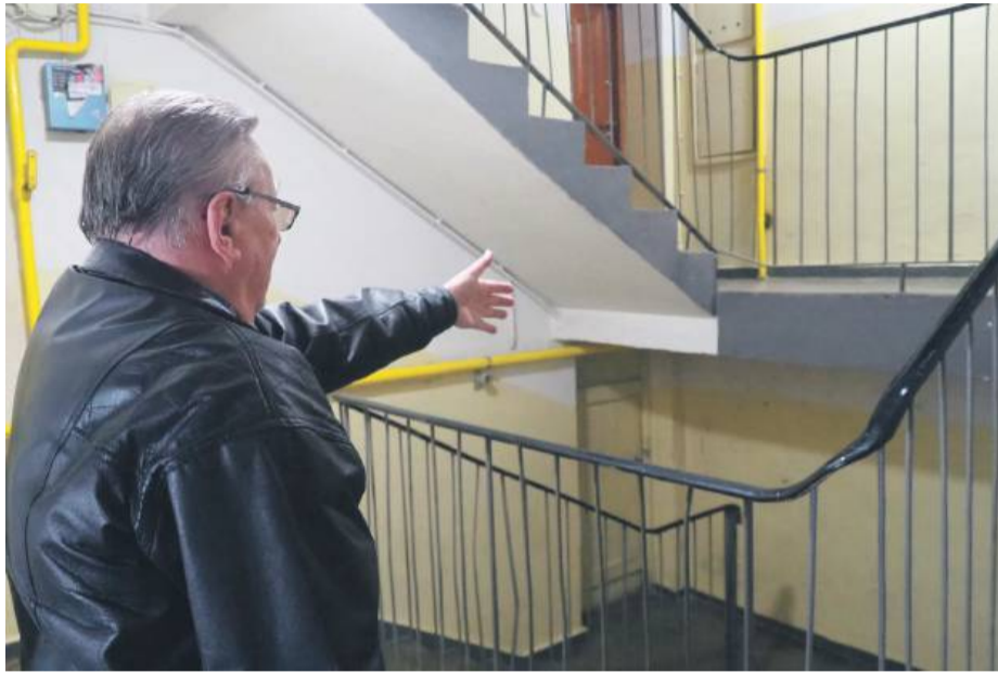
Winda lub inaczej platforma podnośnikowa ma zostać zamontowana na klatce schodowej. Mieszkańcy pytają, czy poniosą dodatkowe koszty

kańców podpisała uchwały w sprawie budowy wind. Teraz boją się, że zostali oszukani. Pytają o szczegóły w sprawie projektów i wydania pozwoleń na bu-