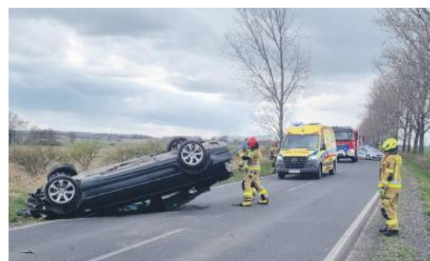
Policja zakwalifikowała zdarzenie jako kolizję