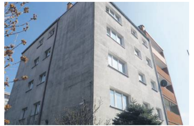
Blok przy ulicy Książąt Brzeskich 6 w Strzelinie

Na zebraniu, zwołanym w listopadzie 2024 roku, mieszkańców poinformo-