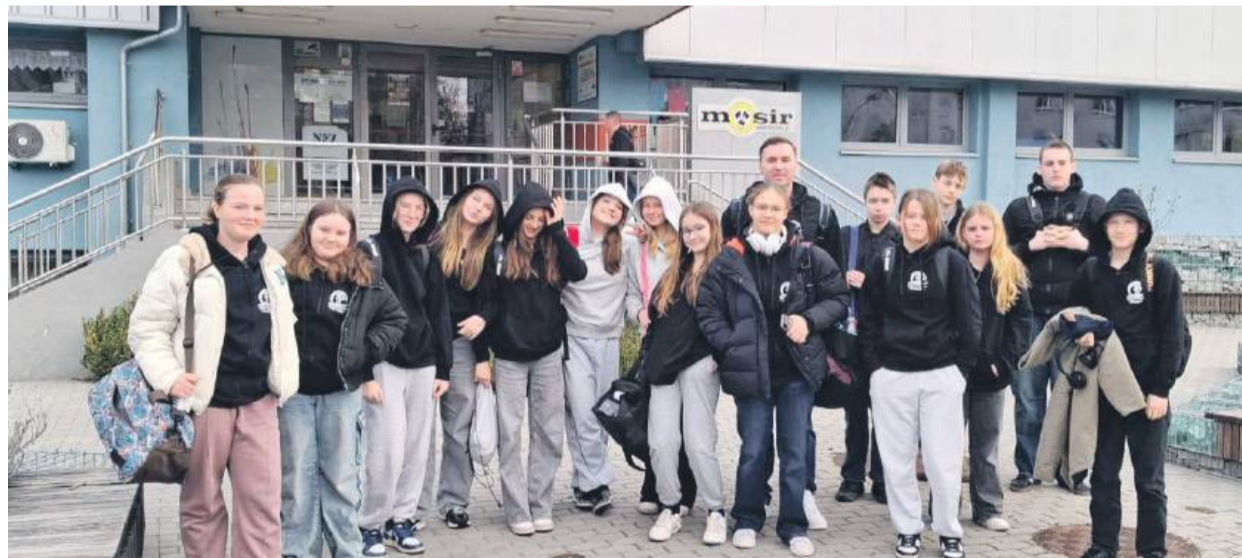
Reprezentanci sekcji pływackiej ze Strzelina