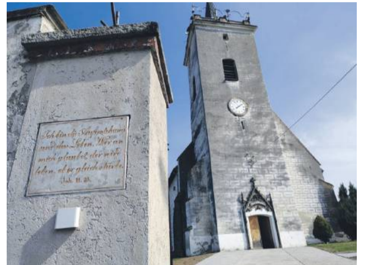
Odnowione, wyeksponowane i podświetlone tablice nawiązują nie tylko do wartości chrześcijańskich, ale są świadectwem historii Prus