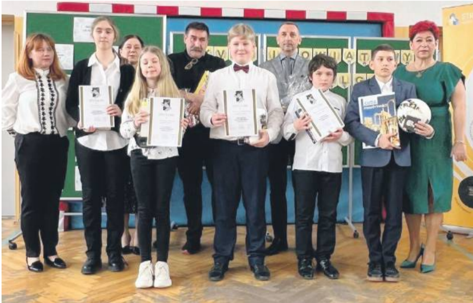
Laureaci młodszej grupy wraz z organizatorami.