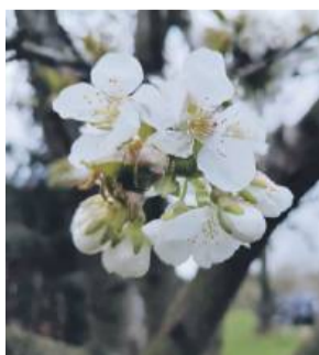
W naszym powiecie w wielu miejscach kwitną już czereśnie i inne gatunki drzew