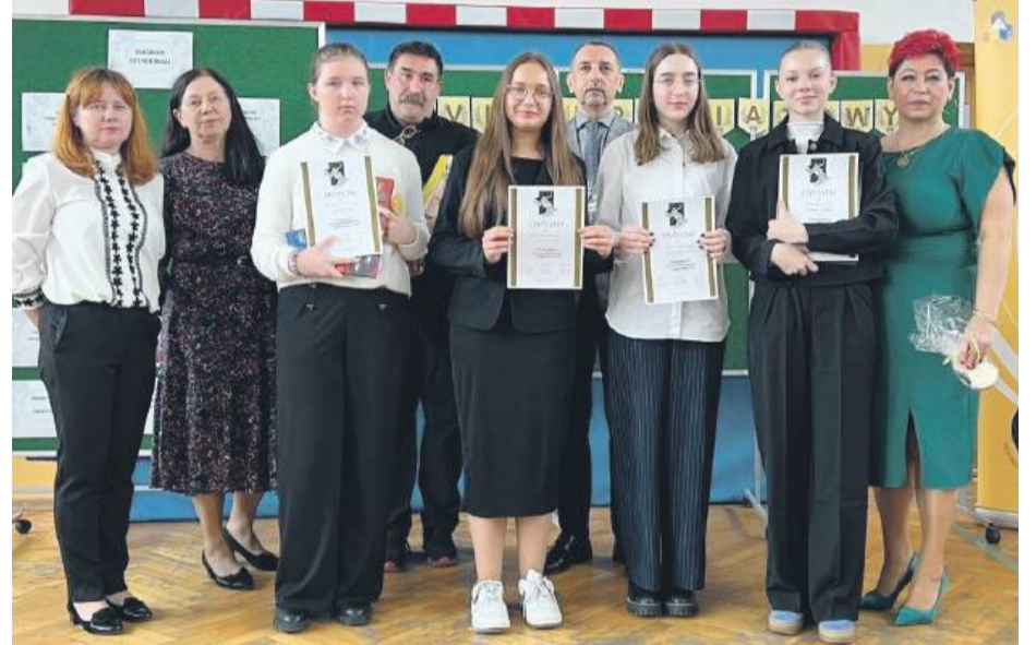
Laureaci starszej grupy wraz z organizatorami.