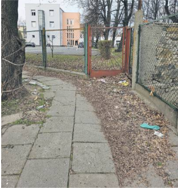
Mieszkanca zwraca uwagę, że - jej zdaniem - chodnik przy ul. Michała Archanioła nie jest należycie sprzątnięty

Przez dziesięciolecia schowane były pod warstwą tynku