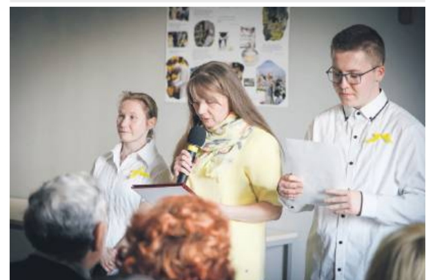
Uczestnicy warsztatów z opiekunami przygotowali wzruszające wystąpienie.