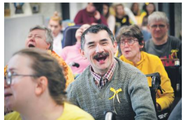
Publiczność z uwagą i radością oglądała przedstawienie.