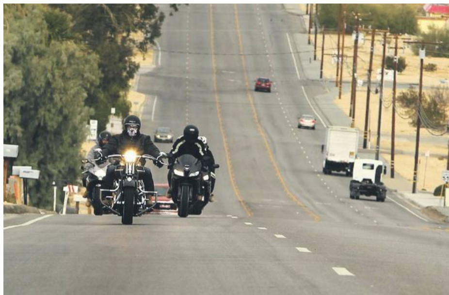
Jazda na mijankę jest przez motocyklistów praktykowana i choć niejednoznacznie interpretowana przez prawo, w praktyce nie wiąże się z mandatami