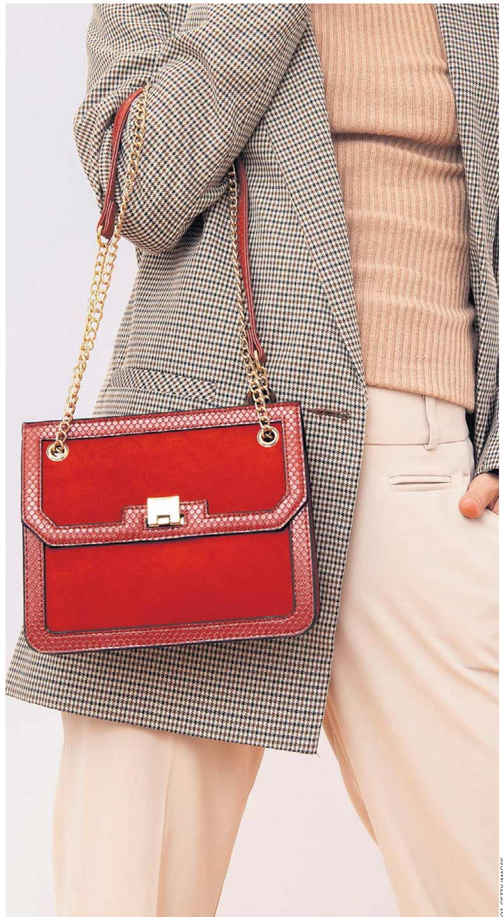
W doborze torebki obowiązuje zasada, by dopasowywać ją do całości stroju, nawiązać do stylu, kolorów oraz sytuacji