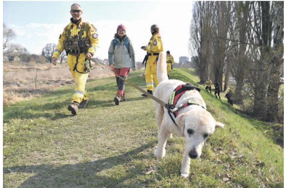
W ćwiczeniach wzięła udział m.in. Jednostka Ratownictwa Specjalistycznego ze Skarbimierza z psami

Tego samego dnia o godzinie 14.00 uczestnicy warsztatów mieli okazję przećwiczyć nabytą wiedzę podczas symulowanego ataku dronowego. Odłamki drona „spadły” tuż przy grupie harcerzy siedzących przy ognisku. Przestraszeni rozbiegli się po terenie, niektórzy ranni zgubili się w lesie. Zadaniem grup poszukiwawczych, podzielonych na grupy - przy pomocy