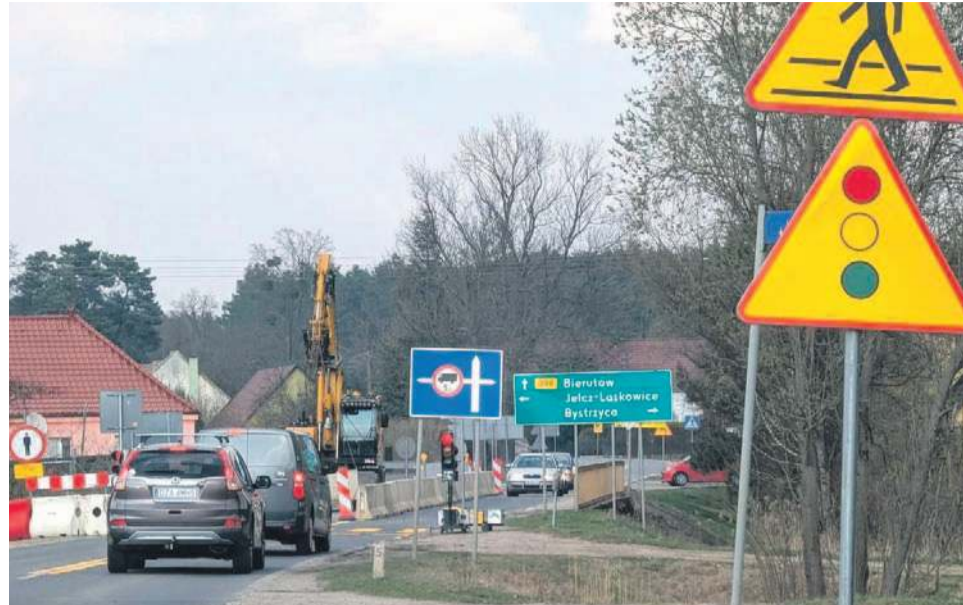
Ruch wahadłowy na moście w Janikowie - do tego tymczasowe przejście dla pieszych

go Górnika do Janikowa pojawiło się kilkadziesiąt nowych znaków, co oznacza kolejne zmiany w ruchu drogowym na tym odcinku. Od teraz na tych trzech kilometrach mamy do pokonania aż 5 sygnalizacji świetlnych i tyle samo ruchu wahadłowego, co wydłuża przejechanie tych paru kilometrów do 15-25 minut (zależy od szczęścia, bo światła nie są zsynchronizowane).