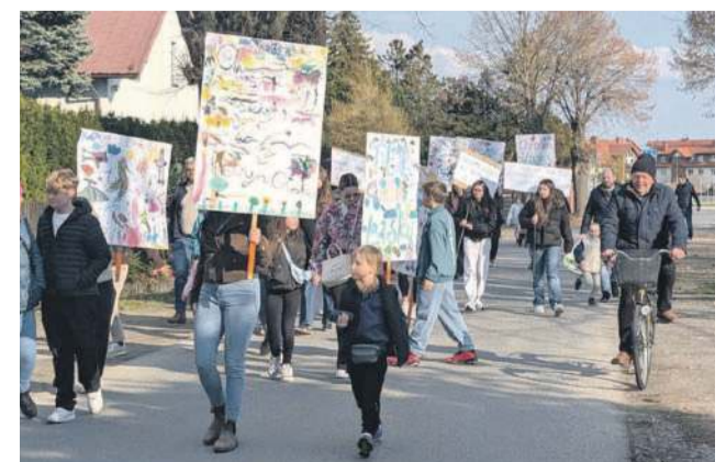
W ten sposób walczą o ostatni kawałek lasu w okolicy