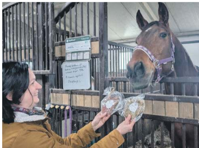
Tort był dla gości, którzy odwiedzili Jubilata - dla konia były ulubione smaczki