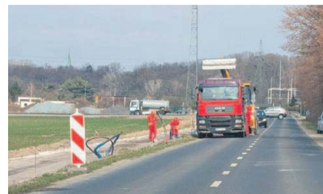
Firma wykonująca ścieżkę do Jaczkowic ma czas na jej zrobienie do końca września