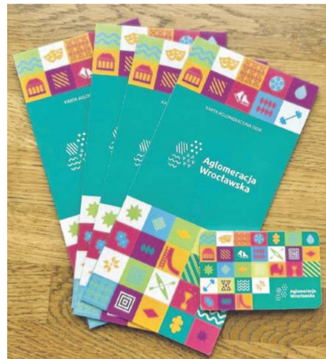
Burmistrz Stajszczyk otrzymał od organizatora 4400 kart na potrzeby mieszkańców Gminy Jelcz-Laskowice