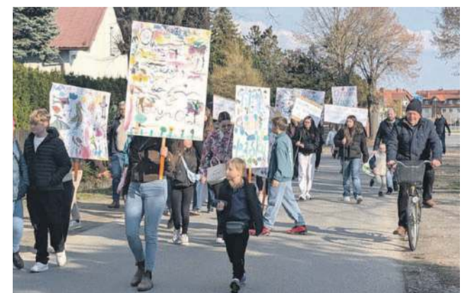
W ten sposób walczą o ostatni kawałek lasu w okolicy