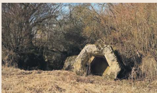
Ich obecność w tym miejscu nie jest przypadkowa