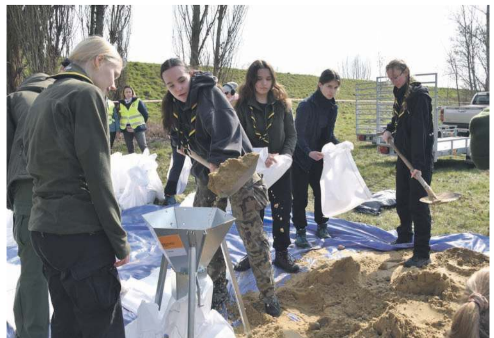
Worki do układania zapór przeciwpowodziowych powinny być odpowiednio napełnione...