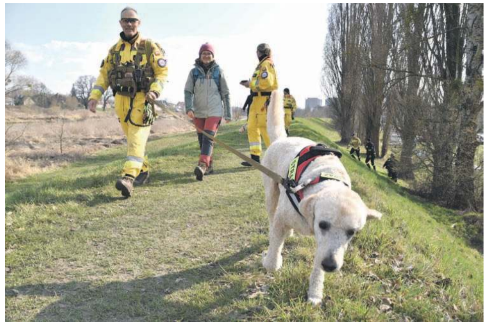
W ćwiczeniach wzięła udział m.in. Jednostka Ratownictwa Specjalistycznego ze Skarbimierza z psami

Tego samego dnia o godzinie 14.00 uczestnicy warsztatów mieli okazję przećwiczyć nabytą wiedzę podczas symulowanego ataku dronowego. Odłamki drona „spadły” tuż przy grupie harcerzy siedzących przy ognisku. Przestraszeni rozbiegli się po terenie, niektórzy ranni zgubili się w lesie. Zadaniem grup poszukiwawczych, podzielonych na grupy - przy pomocy