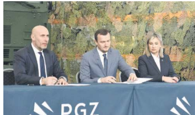
Umowę na dofinansowanie w wysokości 576 mln zł podpisano 5 marca

Mówi ona o dofinansowaniu spółki kwotą 756 mln zł na budowę nowej fabryki na trzech działkach w Miłoszycach koło Jelcza-Laskowic - powstaną tam nowe hale produkcyjne. Wszystko ma być gotowe maksymalnie za