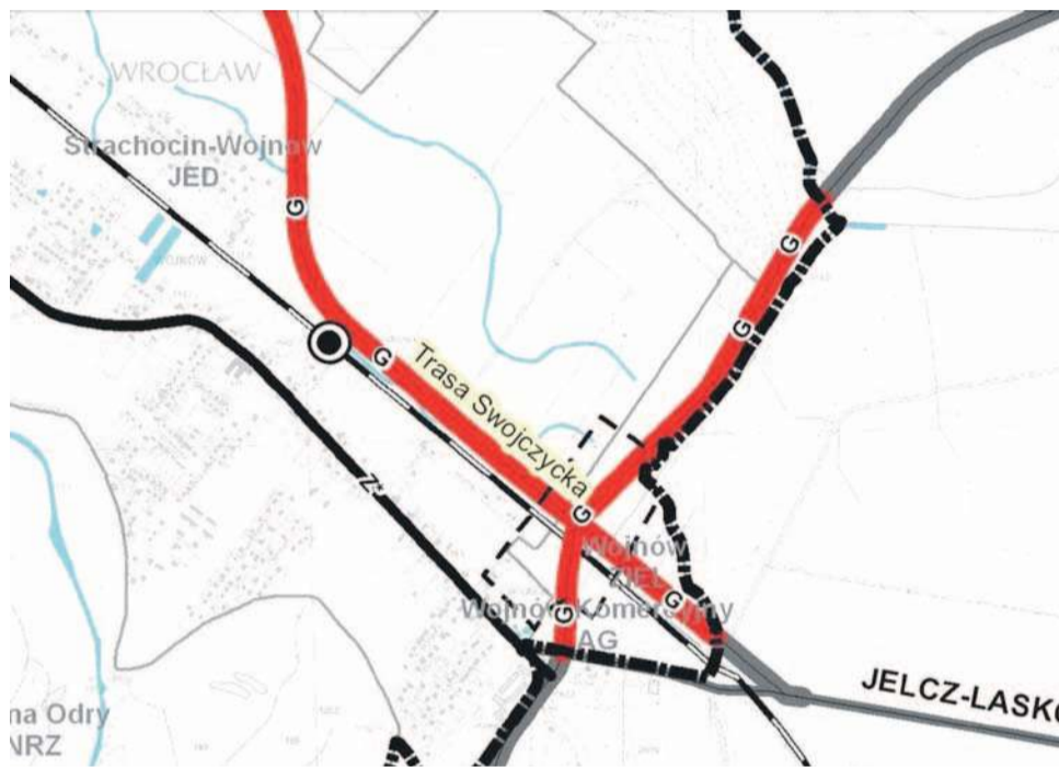
Planowana Trasa Swojczycka ma stanowić nowe połączenie komunikacyjne pomiędzy Wrocławiem a gminami położonymi na wschód od miasta