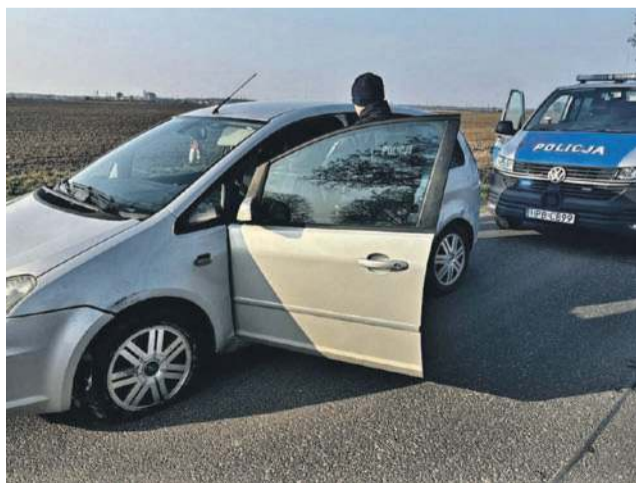
Udało się wyeliminować poważne zagrożenie na drodze w gminie Jelcz-Laskowice

Jak poinformowała oławska policja, do zdarzenia doszło około godziny 7.30. Świadek zauważył niepokojącą sytuację na drodze - pojazd stał, a w jego wnętrzu znajdował się mężczyzna. Podejrzewając, że kierowca może być pod wpływem alkoholu, zareagował natychmiast i uniemożliwił