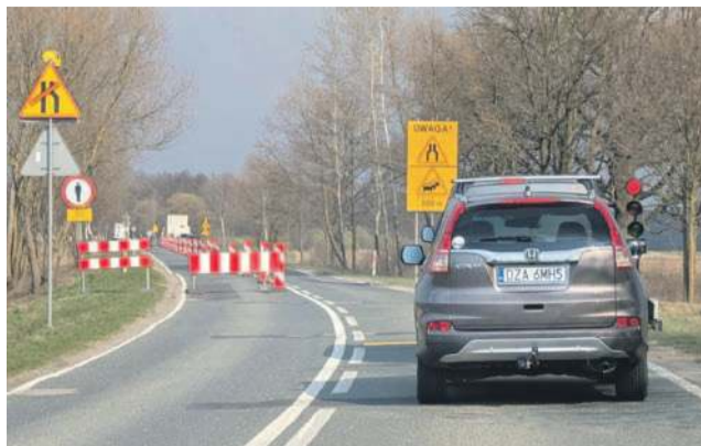
Swoje trzeba odstać w obie strony

Umowę na ten remont drogi wojewódzkiej 396 podpisano w Urzędzie Marszałkowskim Województwa Dolnośląskiego 21 lipca 2025. Inwestycja obejmuje odcinek ok. 4 kilometrów, od Starego Górnika do Janikowa. To fragment, który ucierpiał w czasie powodzi we wrześniu 2024 roku. Prace mają być realizowane w dwóch etapach. Pierwszy od skrzyżowania drogi 396 z drogą 455 do mostu za Starym Górnikiem. Drugi etap - od tego miejsca do skrzyżowania z drogą powiatową 1548D w Janikowie.