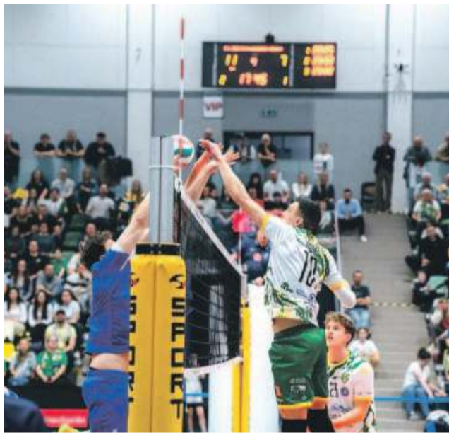
Kolejne dwa mecze zostaną rozegrane we Wrocławiu już w najbliższy weekend