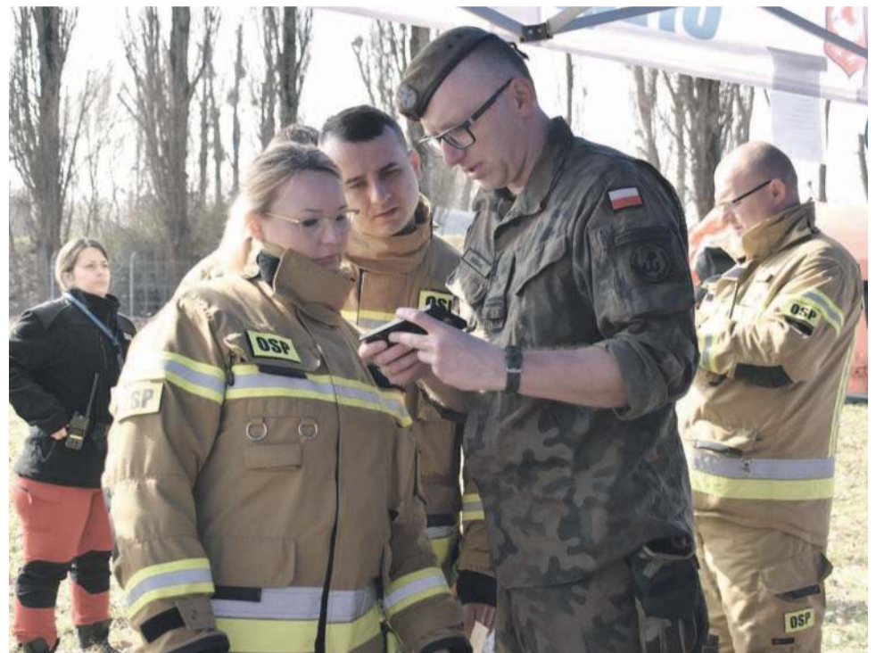
Ważna jest odpowiednia apka w telefonie

różnych sprzętów i wykorzystując różne sposoby - było odnaleźć i bezpiecznie sprowadzić wszystkich harcerzy do centrum dowodzenia, które znajdowało się przy ul. Rybackiej, koło strzelnicy w Oławie. Teren szkolenia obejmował kilkadziesiąt kilometrów, w tym las, rzekę oraz okoliczne pola i łąki.