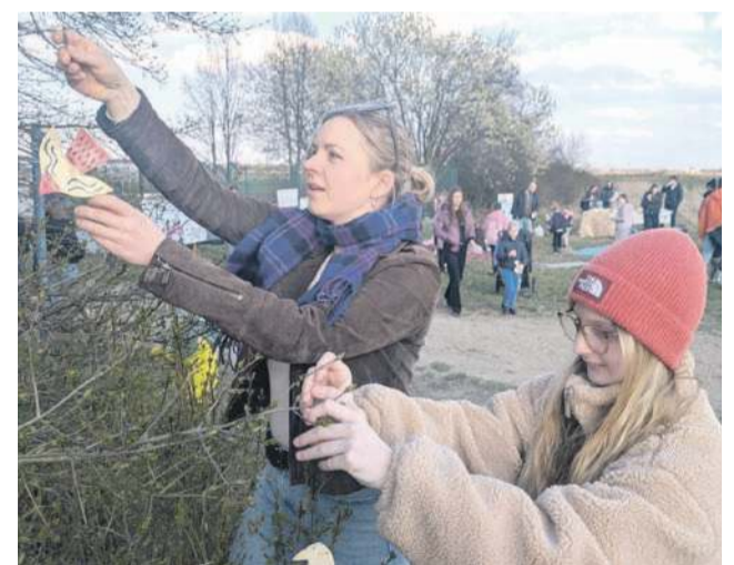
21 marca wieszali na drzewach wykonane wcześniej ceramiczne ptaki