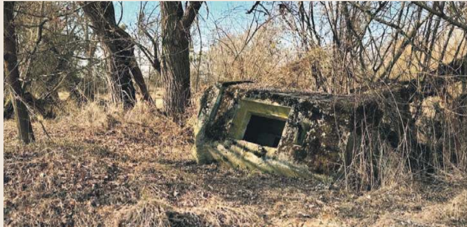
Relikty II wojny światowej – jednoosobowe bunkry

W pobliżu ruin średniowiecznego zamku w Jelczu (część Jelcza-Laskowic), nad Odrą, stoją betonowe konstrukcje przypominające ogromne pękate ołówki wbite w ziemię. Dla przypadkowego spacerowicza mogą wyglądać jak fragment zapomnianej infrastruktury technicznej.