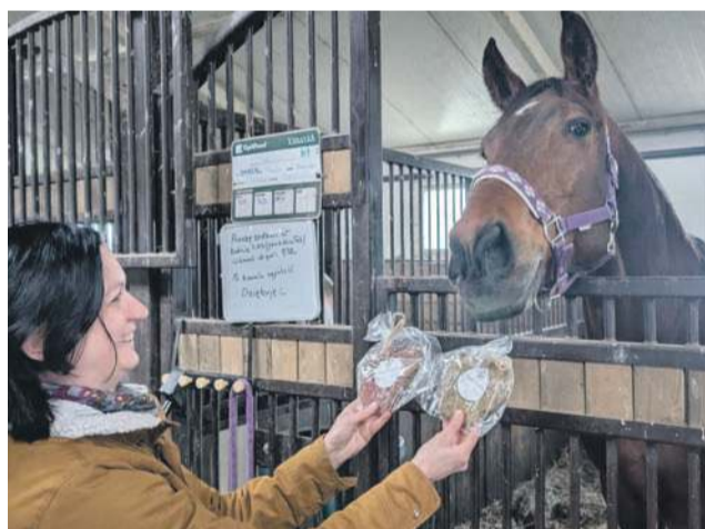
Tort był dla gości, którzy odwiedzili Jubilata - dla konia były ulubione smaczki