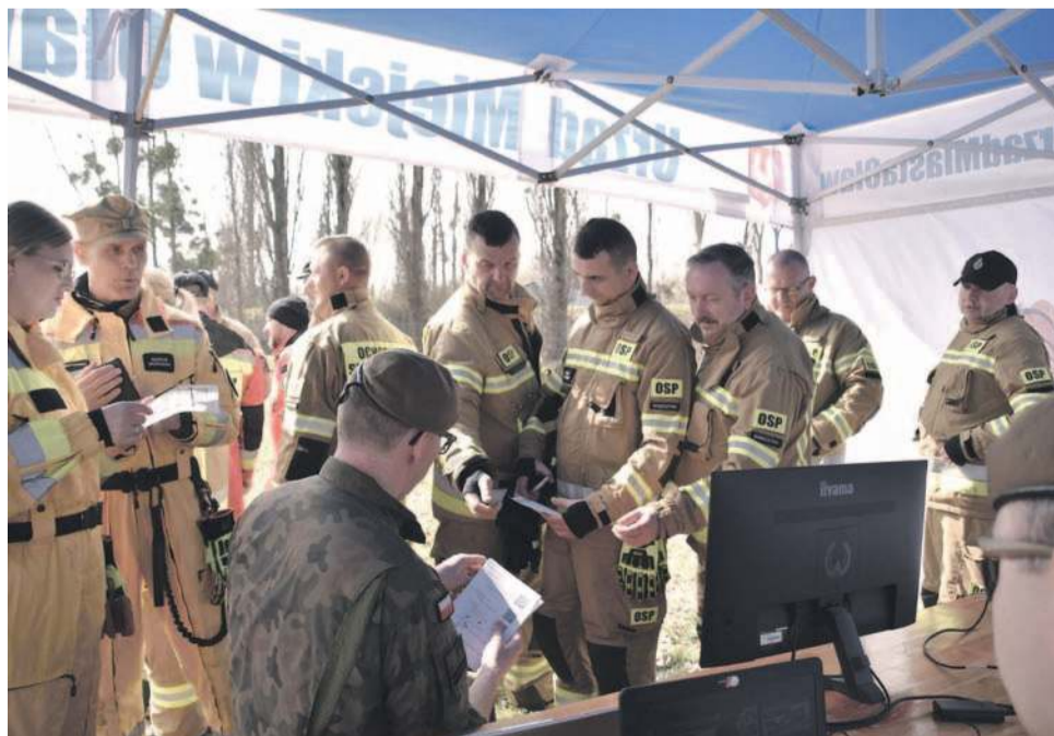
Grunt to współpraca