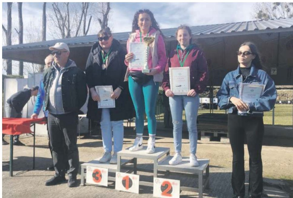
To były zacięte i udane zawody