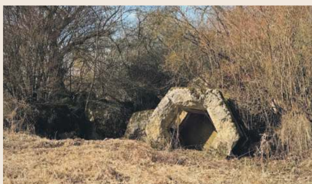
Ich obecność w tym miejscu nie jest przypadkowa