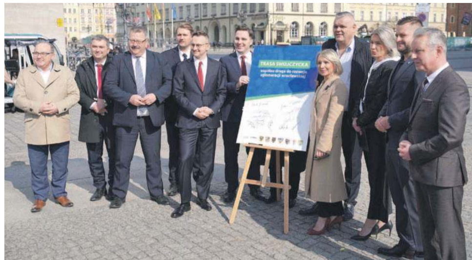
We Wrocławiu podpisano porozumienie