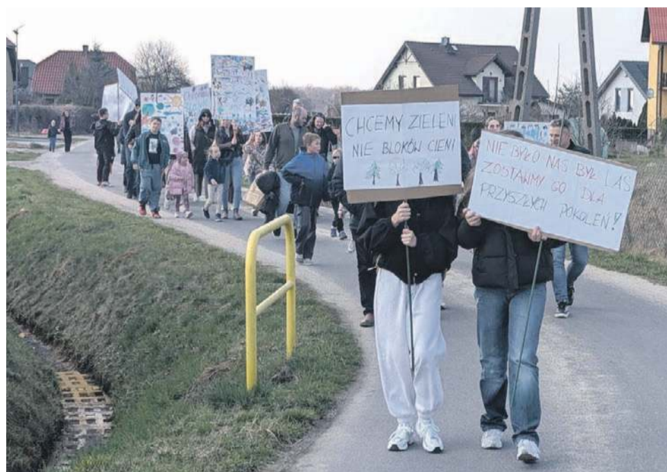
Protestujący przeszli ulicami Nowego Otku

- To kuriozalne zachowanie - komentuje zachowanie ZWiK radny Mierziak, jeden z inicjatorów akcji, która ma