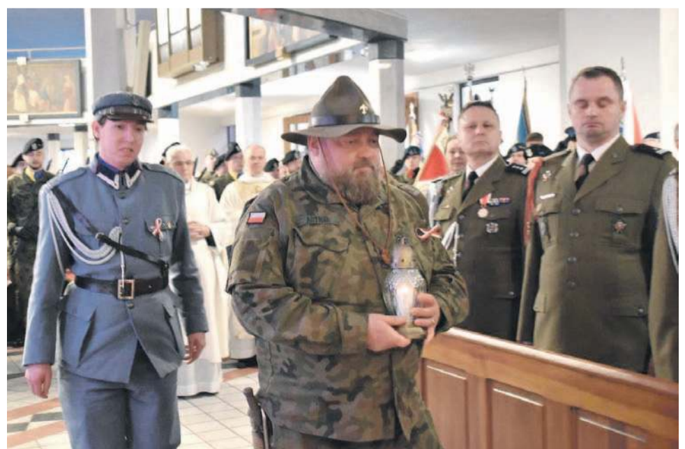
W uroczystościach wzięli udział przedstawiciele wielu instytucji i organizacji

Brygada Kawalerii Pancerniej z Zagania. Po nabożeństwie