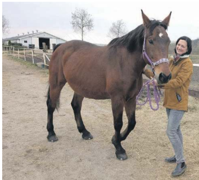
Szaron mieszka w Ośrodku Sportów Konnych Vidavia na obrzeżach Chrzęstawy Wielkiej wśród 50 innych koni