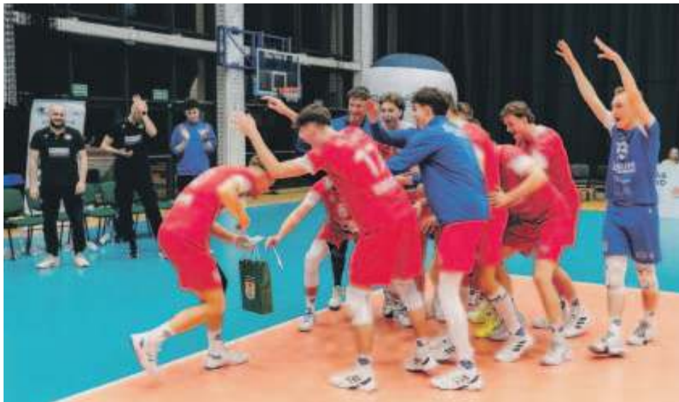
W sobotę świętowali siatkarze Gwardii Wrocław

TEKST I FOT.: KAMIL TYSA ktyisa@gazeta.olawa.pl