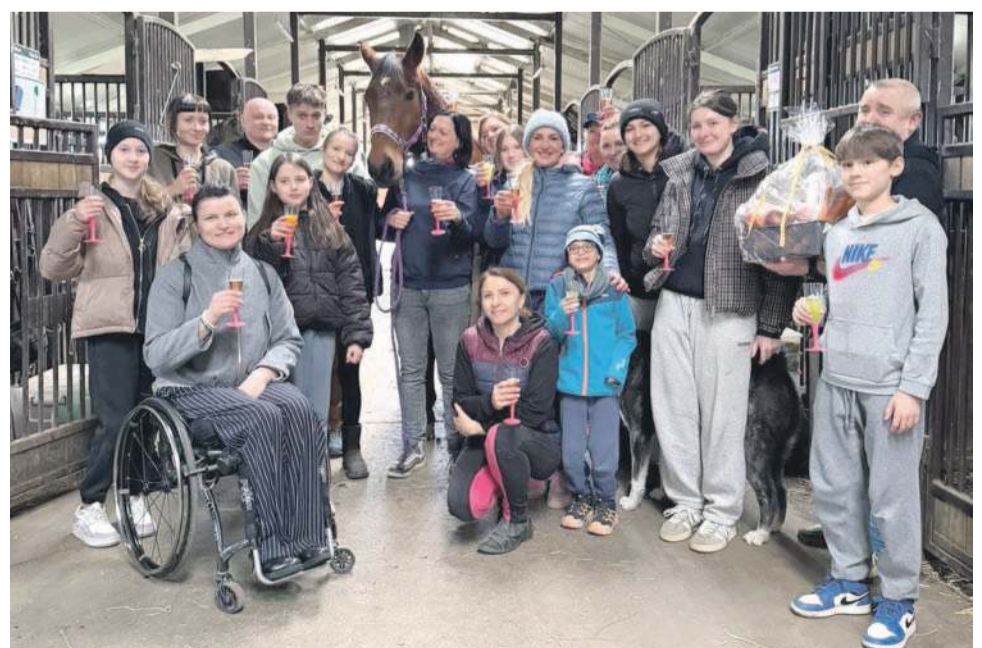
Goście u Jubilata. I to są prawdziwe urodziny!