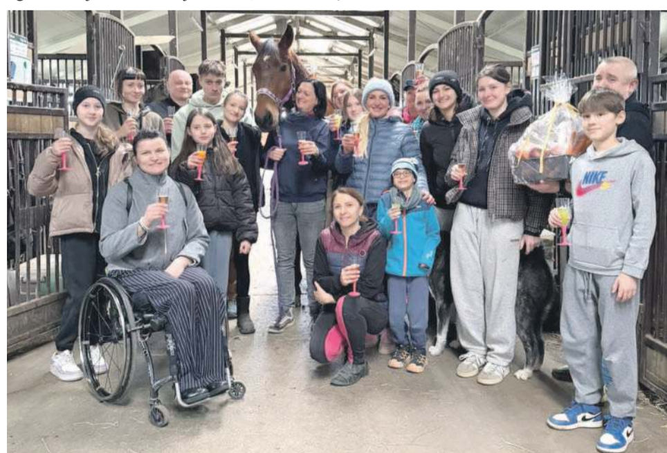
Goście u Jubilata. I to są prawdziwe urodziny!