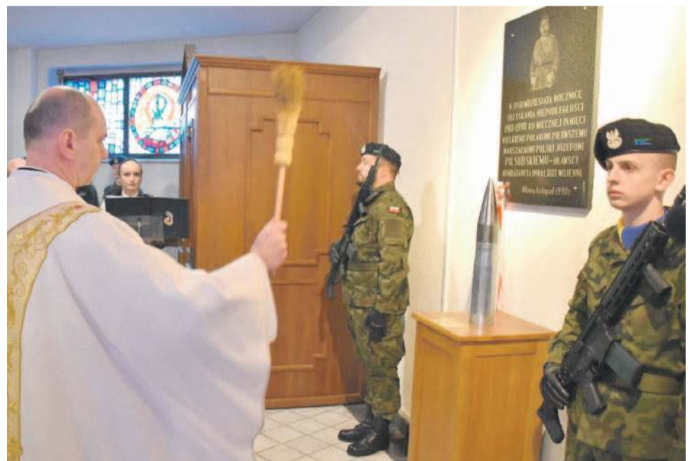
Ziemię z Zułowa - w łusce pod tablicą - poświęcono

W uroczystości, jak co roku, wzięły udział delegacje lokalnych samorządów, instytucji i organizacji, w tym mundurowych, a także szkół wraz z pocztami sztandarowymi. Wydarzenie celebrowała 34.