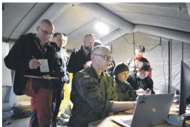
Aby rozpocząć poszukiwania, najpierw trzeba zsynchronizować urządzenia