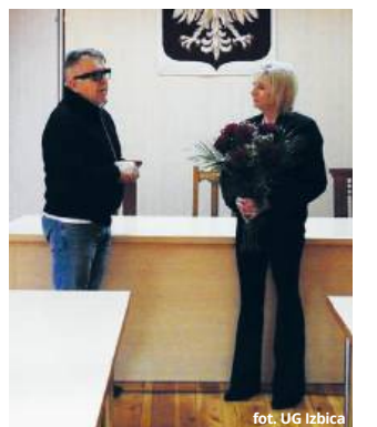
fol. UG Izbica

ki ma zapewnić pełną ciągłość finansową gminy i wsparcie dla urzędu w realizacji wszystkich zadań publicznych. AK