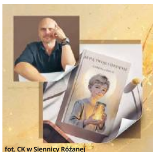
fol. CK w Siennicy Różanej

Pisanie jest dla niego drogą – osobistą, szczerą, wypływającą z wewnętrznego impulsu. „Coś puka i mówi: napisz to” – zdradza autor. Jego proza przenosi czytelnika w przestrzeń emocji, dziecięcej wrażliwości i auten-