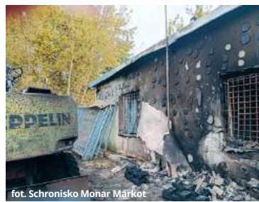
fol. Schronisko Monar Markot

Na miejsce wysłano sześć zastępów straży pożarnej z Chełma i jeden z OSP Czuchy. Akcja trwała ponad osiem godzin – zakończyła się dopiero około 10:30. Budynek spłonął doszczętnie, a strażacy długo