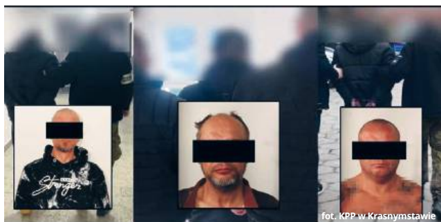
fol. KPP w Krasnymstawie

REGION Śledczy z Komendy Powiatowej Policji w Krasnymstawie zatrzymali pięciu mężczyzn, podejrzanych o wyłudzenie pieniędzy od mieszkańców kilku województw. Jak ustalono, działali w ramach zorganizowanej grupy przestępczej, podszywając się pod funkcjonariuszy policji. Straty ofiar sięgają blisko 200 tysięcy złotych.