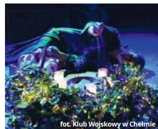
fol. Klub Wojskowy w Chełmie

strzowski sposób oddaje emocjonalną głębię postaci, zabierając widzów w intymną podróż przez lęki, pragnienia i odkrycia głównej bohaterki. Monodram staje się nie tylko teatralnym doświadczeniem, ale także zaproszeniem do refleksji nad własną drogą i siłą kobiecej duchowości.