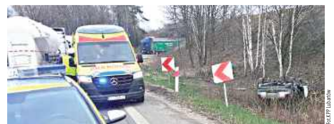
Kierowca Audi zasnął za kierownicą

8 kwietnia rano na DK 19 w Wandzinie doszło do dachowania Audi. Jak stwierdzili przybyli na miejsce zdarzenia policjanci, 61-letni kierowca zasnął w czasie jazdy, stracił panowanie nad samochodem, który zjechał z jezdni i dachował. - Mimo iż uszkodzenia pojazdu oraz sam przebieg zdarzenia wyglądał bardzo poważnie, na szczęście