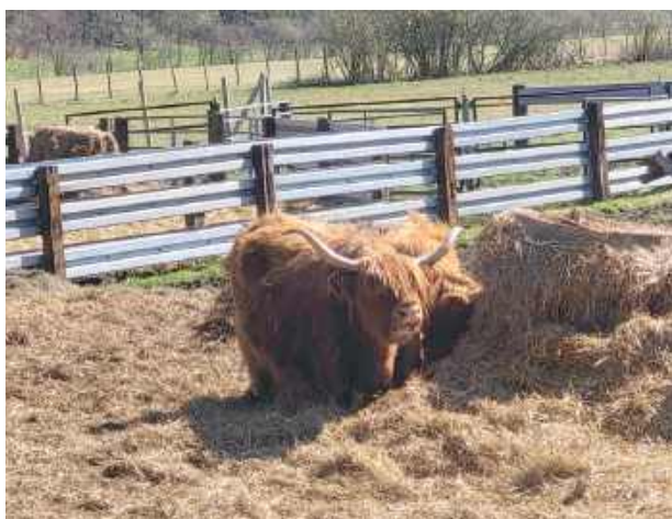
Turyści mogli podziwiać budzącą się do życia wiosenną przyrodę oraz wypasane tu szkockie krowy z prywatnej hodowli

Turyści mogli podziwiać budzącą się do życia wiosenną przyrodę oraz wypasane tu szko-