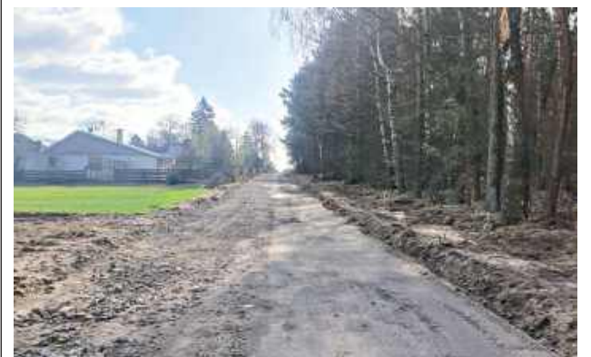
Mieszkańcy Zawieprzyc-Kolonii już niedługo będą mogli cieszyć się zmodernizowaną trasą

Mieszkańcy Zawieprzyc-Kolonii już niedługo będą mogli cieszyć się zmodernizowaną trasą. Trwa przebudowa drogi gminnej. Dzięki wsparciu ze środków zewnętrznych samorząd realizuje inwestycję obejmującą nie tylko nową nawierzchnię, ale także niezbędne poszerzenie jezdni, co ułatwi wymijanie się pojazdów na tym odcinku.