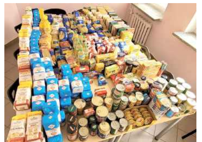
Podsumowanie przedsięwziętej akcji pomocowej w Łęcznej