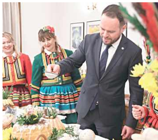
Tradycja z gminy Spiczyn na wojewódzkim stole