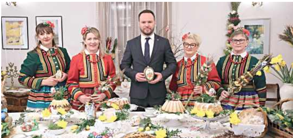
Panie z Koła Gospodyń Wiejskich Zamkowe Wzgórze wystąpiły w tradycyjnych strojach ludowych, co dodatkowo podkreśliło uroczysty charakter spotkania

Przedstawicielki Koła Gospodyń Wiejskich Zamkowe Wzgórze z Zawieprzyc stanęły przed niecodziennym zadaniem. W okresie poprzedzającym Święta Wielkanocne panie przygotowały uroczystą ucztę dla Wojewody Lubelskiego Krzysztofa Komorskiego, prezentując to, co w lubelskiej tra-