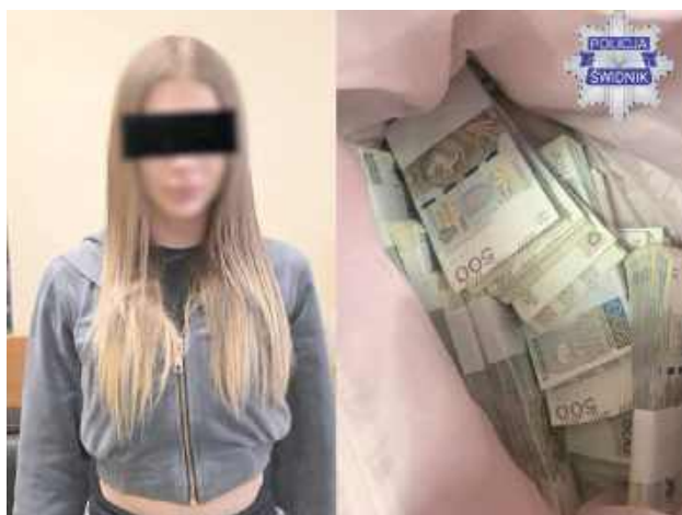
W wyniku przestępczego procederu pokrzywdzony senior stracił łącznie około miliona złotych

Jak ustalono w toku sprawy, kobieta dwukrotnie stawiała się w umówionych miejscach, gdzie odbierała gotówkę od osoby oszukanej. Za pierwszym razem przejęła ponad 300 tysięcy złotych,