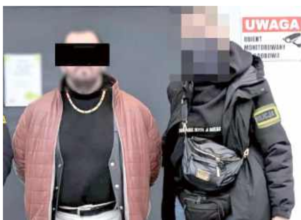
61-latek po zatrzymaniu przez lubelskich poszukiwaczy i kontrterrorystów, wielkanocne święta spędził już w celi lubelskiego Aresztu Śledczego

Do zatrzymania 61-latka doszło w minionym tygodniu. Policjanci z Wydziału Poszukiwań i Identyfikacji Osób KWP w Lublinie mieli informację, że poszukiwany mieszkaniec Lublina może poruszać się samocho-