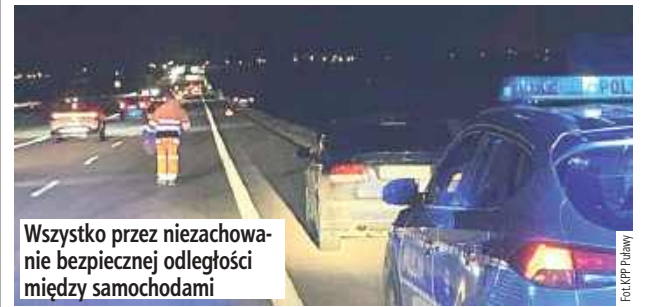
Wszystko przez niezachowanie bezpiecznej odległości między samochodami

Kierujący Saabem nie zachował bezpiecznej odległości i najechał na tył Volvo. Jedna osoba trafiła do szpitala.