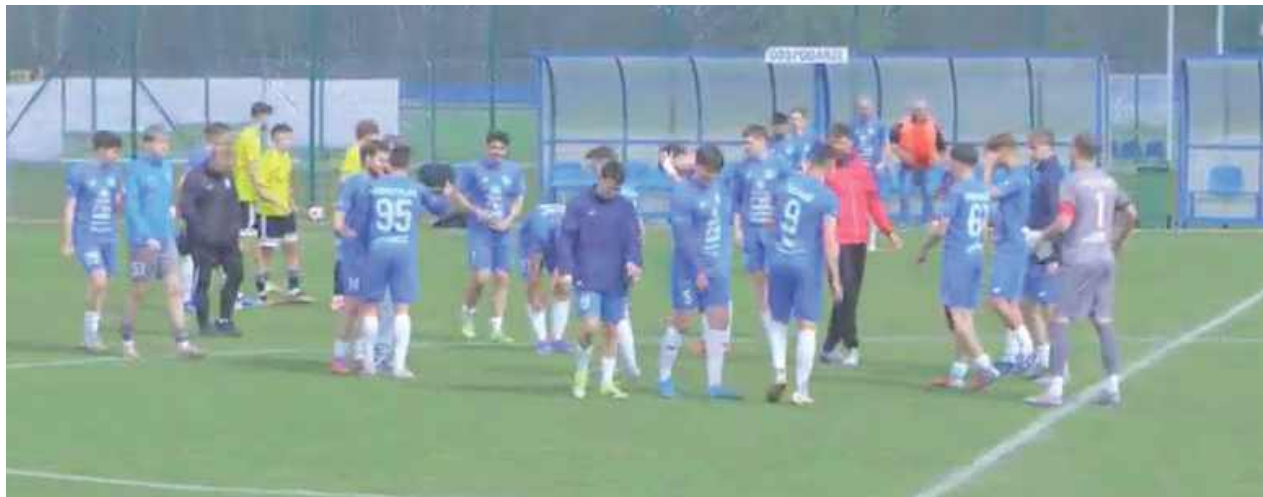
Lewart pewnie ograł Orłętę. Przed zespołem mecz z Orłętami Łuków, a później bój na szczycie z Hetmanem