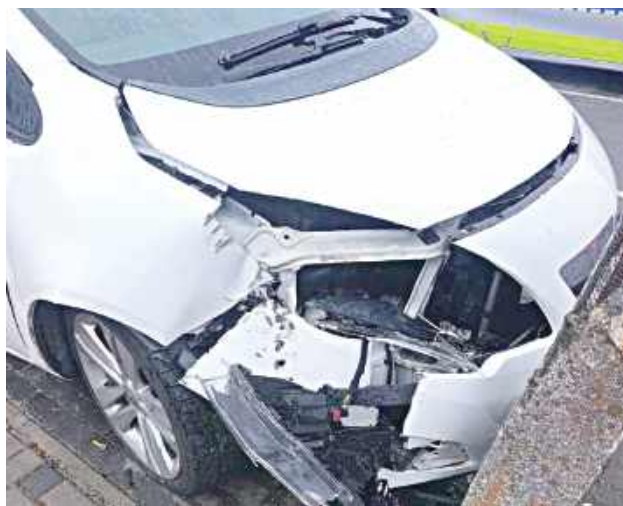
Kierowca Opla uciekał na piechotę

W Wielkanocny Poniedziałek około godz. 7 rano policjanci z drogowki zauważyli Opla, którego kierowca ich zdaniem dziwnie się zachowywał. Zawrócił za samochodem, wtedy jego kierowca przyspieszył i nagle skręcił w drogę podporządkowaną. Opel uderzył w słup energetyczny. Kierowca wysiadł i zaczął uciekać na piechotę, ale policjanci szybko