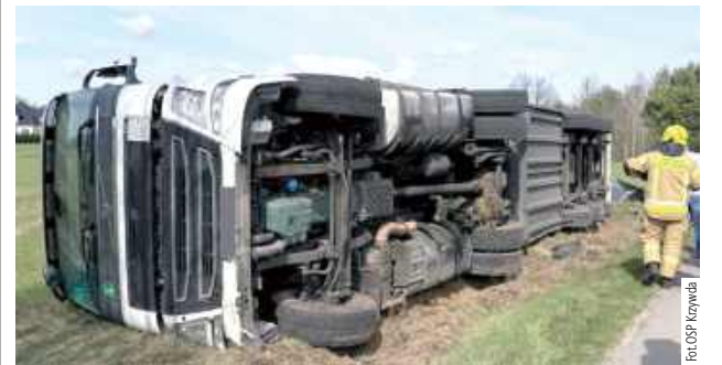
Do zdarzenia doszło w niedzielę, 12 kwietnia, około godziny 10.30

Samochód ciężarowy przewrócił się na bok w miejscowości Nowa Wróblina (powiat łukowski).