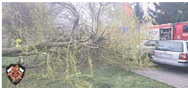
Podobne zdarzenia stają się coraz częstszym widokiem podczas gwałtownych zjawisk pogodowych, które nawiedzają nasz region

Do zdarzenia doszło 7 kwietnia dokładnie o godzinie 18.39. Dyżurny Komendy Powiatowej Państwowej Straży Pożarnej w Łęcznej otrzymał zgłoszenie, z którego wynikało, że przy ulicy Wierzbowej 1 doszło do wywrócenia się dużego drzewa. Na miejsce niezwłocznie skierowano zastępy z Jednostki Ratowniczo-Gaśniczej w Łęcznej