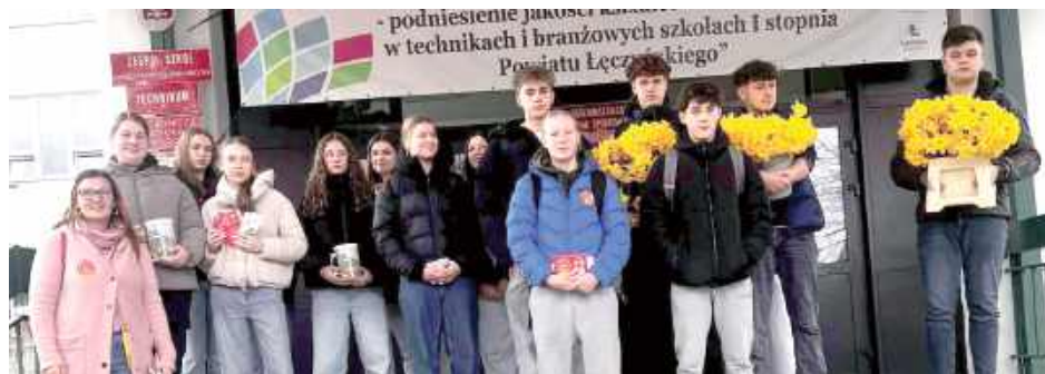
Młodzież z popularnego „Jagiellończyka” wzięła udział w przedsięwzięciu, którego celem jest zbiórka funduszy oraz szerzenie idei opieki hospicyjnej i uwrażliwianie na potrzeby osób dotkniętych chorobami nowotworowymi