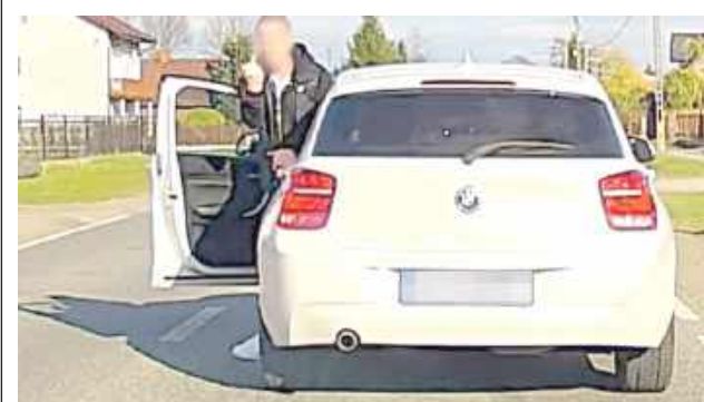
Kierowca poruszał się BMW.