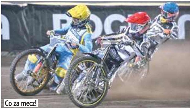
Co za mecz!