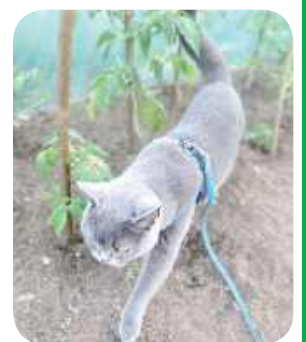
Maciek, Iwona Chalecka, Biała Podlaska