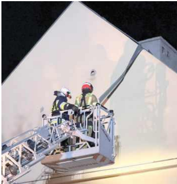
Strażacy przy pomocy drabiny dostali się do blachy i ją zabezpieczyli, aby nie spadła i nie zrobiła komuś krzywdy

Pogoda nas nie oszczędza. Po prawdziwym przedsmaku pięknej wiosny przed świętami, teraz musimy mierzyć się z niezbyt przyjemną aurą. Temperatury sięgają zaledwie kilku kresów powyżej zera, a do tego silny wiatr, którego doświadczamy od kilku dni. Choć w powiecie puławskim nie odnotowano większych szkód