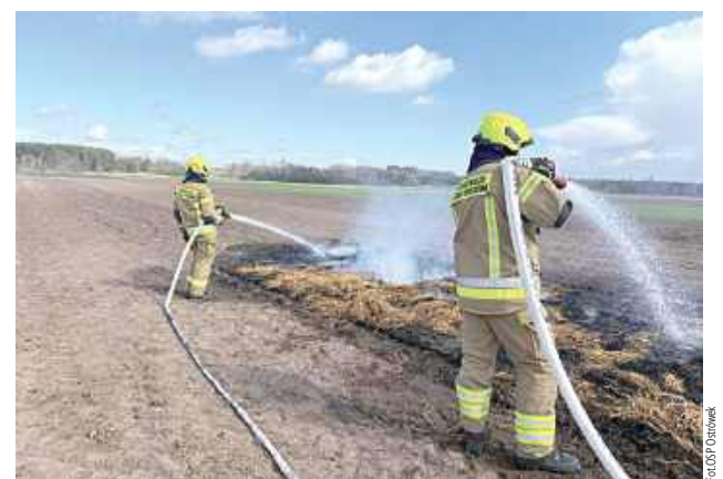
Do pożaru doszło 7 kwietnia. W Leszkowicach po godz. 13 paliły się bele słomy. Pożar gasiły zastępy OSP Ostrówek i OSP Leszkowice.