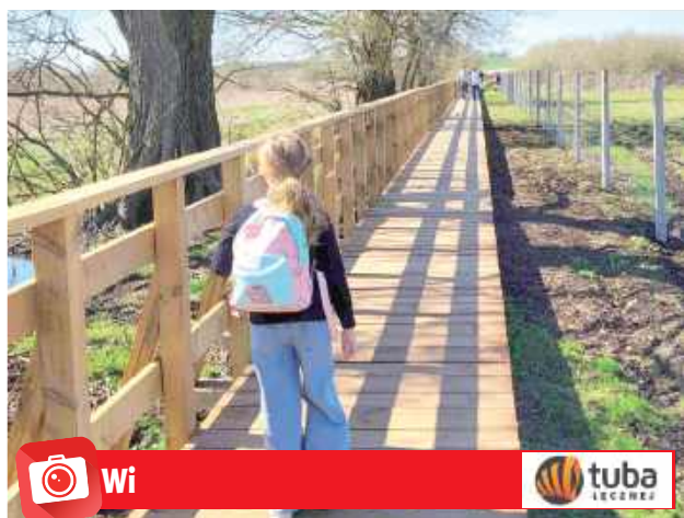
W Wielkanoc pogoda dopisała: świeciło słońce, na termometrach było niemal 20 stopni

Nowa atrakcja turystyczna Lubelszczyzny przyciągnęła w Wielkanoc sporo odwiedzających.