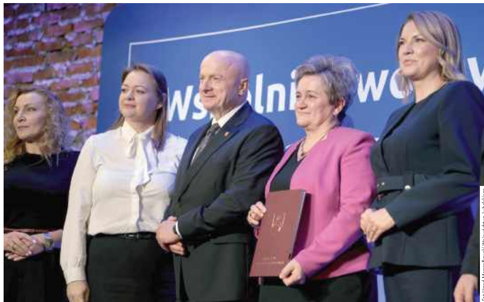
Gmina Cyców pozyskała ponad dwa miliony złotych dofinansowania na kompleksową modernizację systemu zaopatrzenia w wodę

Gmina Cyców pozyskała ponad dwa miliony złotych dofinansowania na kompleksową modernizację systemu zaopatrzenia w wodę.