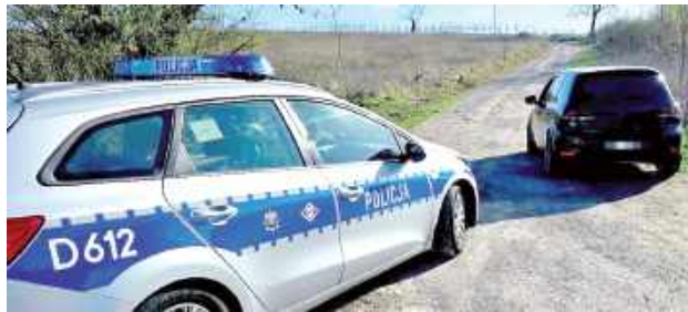
Funkcjonariusze zauważyli samochód osobowy, którego kierowca w trakcie jazdy dopuścił się szeregu wykroczeń

Do zdarzenia doszło w środę, 7 kwietnia po godzinie 8 w Wallowicach w gminie Józefów nad