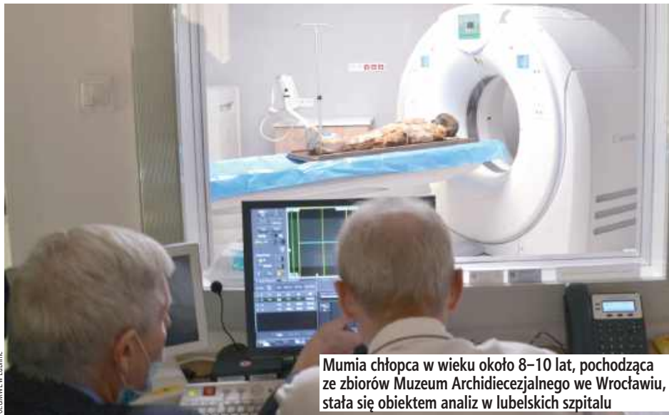
Mumia chłopca w wieku około 8-10 lat, pochodząca ze zbiorów Muzeum Archidiecezjalnego we Wrocławiu, stała się obiektem analiz w lubelskim szpitalu

- Nasza aparatura na co dzień służy ratowaniu życia i zdrowia pacjentów, jednak jej parametry techniczne sprawiają, że może to być również doskonałe narzędzie dla innych dziedzin nauki. Badanie tak delikatnego obiektu wymagało precyzyjnego planowania logistycznego, aby z jednej strony nie zakłócić pracy oddziałów szpitalnych, z drugiej zaś