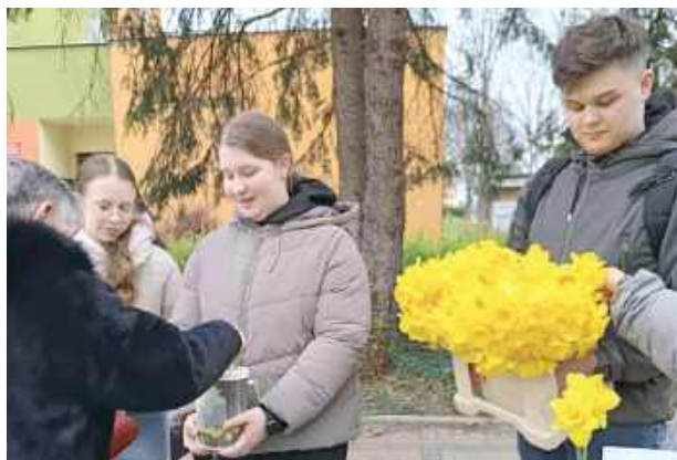
Żonkile nadziei na ulicach Łęcznej