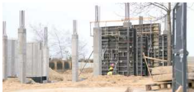
Na działce sąsiadującej z głównym gmachem szpitala intensywnie postępuje budowa Powiatowego Centrum Zdrowia Psychicznego

Na działce sąsiadującej z głównym gmachem szpitala intensywnie postępuje budowa Powiatowego Centrum Zdrowia Psychicznego. Do końca bieżącego roku powstanie tam nowoczesny, piętrowy budynek o powierzchni dwóch i pół tysiąca metrów kwadratowych. Inwestycja ta odpowiada na rosnące potrzeby społeczne w zakresie opieki psychiatrycznej, oferując wsparcie zarówno w formie ambulatoryjnej, jak i stacjonarnej. W nowym obiekcie znajdzie się Poradnia Zdrowia Psychicznego