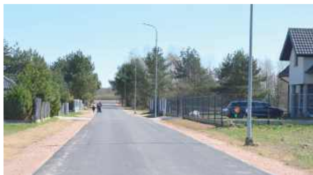
Nowa droga w gminie Puchaczów już gotowa

Mieszkańcy Puchaczowa mogą już korzystać z nowoczesnego odcinka drogi gminnej, którego przebudowa i rozbudowa właśnie dobiegła końca. Inwestycja realizowana na odcinku od ulicy Partyzantów poprawiła jakość poruszania się w tej części miejscowości oraz ułatwiła dojazd do prywatnych posesji.