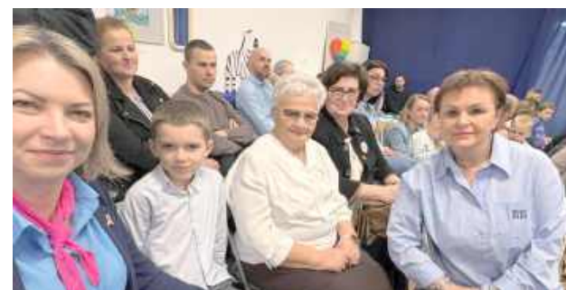
Światowy Dzień Świadomości Autyzmu to czas, w którym uwaga mieszkańców skupia się na budowaniu akceptacji oraz zrozumienia dla neuroroznorodności

Światowy Dzień Świadomości Autyzmu to czas, w którym uwaga mieszkańców skupia się na budowaniu akceptacji oraz zrozumienia dla neuroroznorodności. Z tej okazji przedstawicielki Stowarzyszenia Kobiet Amazonki w Łęcznej gościły w murach przedszkola i żłobka Casper. Spotkanie upłynęło w atmosferze radości oraz wyjątkowej energii, którą potrafią stworzyć jedynie dzieci.