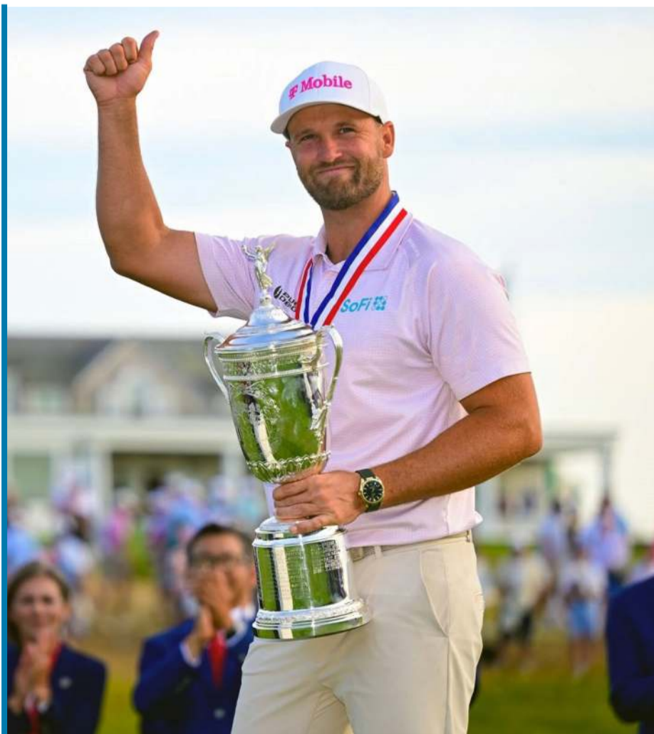
Mistrz po raz drugi!