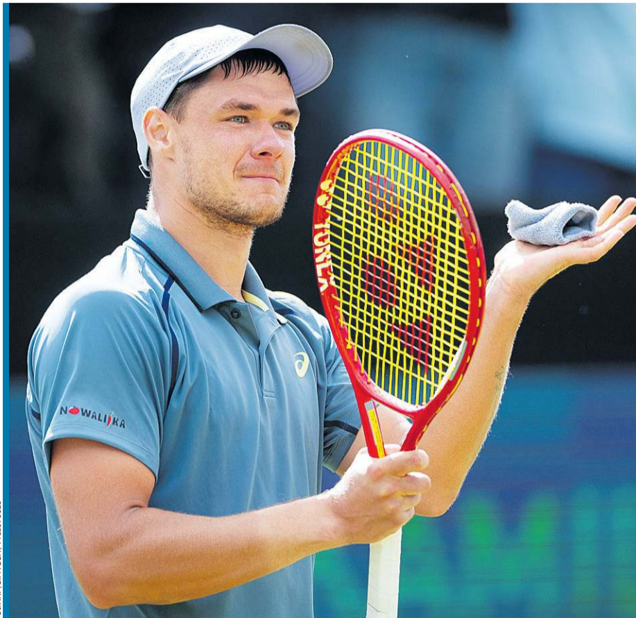
Było się czego bać?

Piotrkowianin podkreśla, że zawsze wierzył, że jest w stanie zwyciężyć w turnieju cyklu ATP, ale