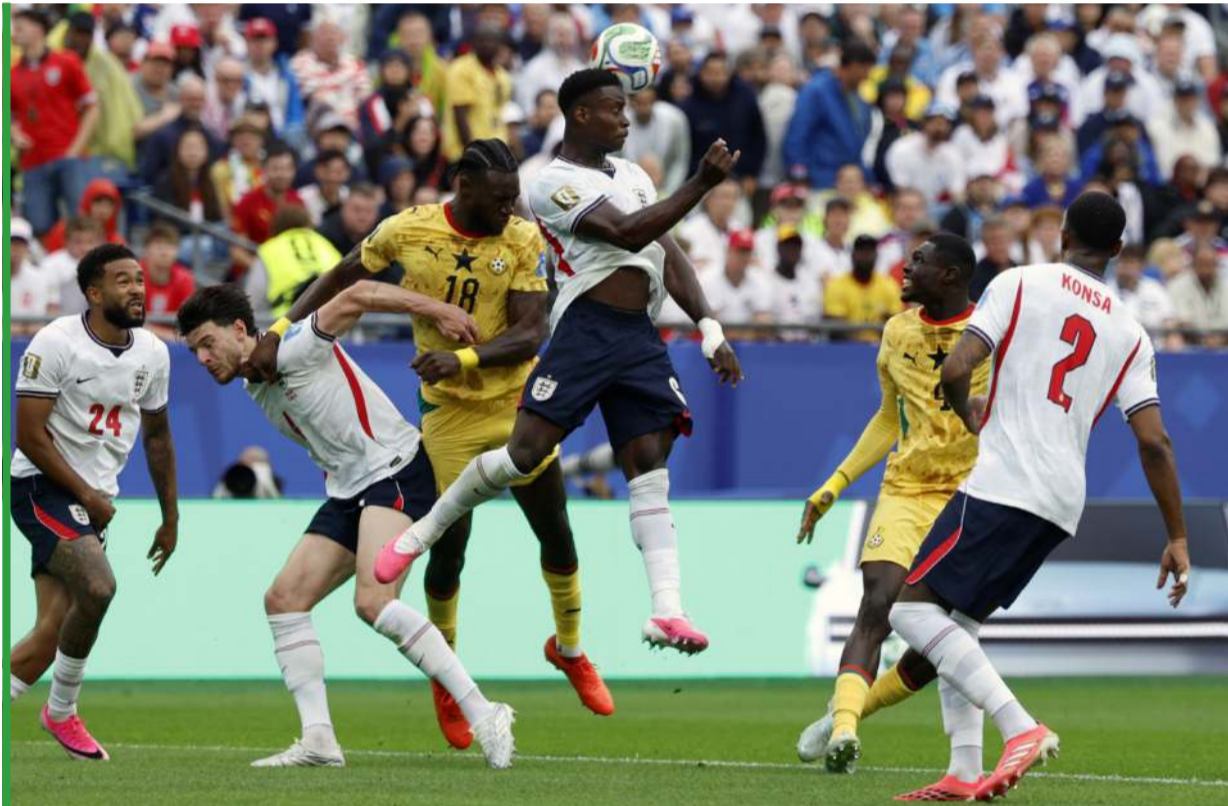
Wygranie pojedynku z ghańską obroną stanowiło spore wyzwanie.

świata był dowódcą irańskiej reprezentacji. Kadre Ghany objął w kwietniu, nie miał więc zbyt wiele czasu na pracę z zespołem, ale swoją turniejową