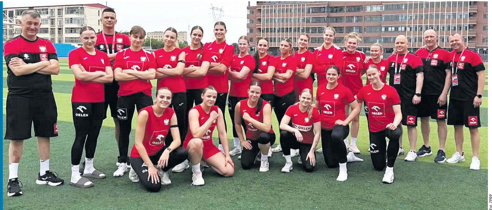
Biało-czerwone pozdrawiają z Chin i podkreślają, że są gotowe do walki na mundialu.

■ Maskotki nazwane Tianian i Meimei są inspirowane lampartem północnochińskim, narodowym zwierzęciem będącym w pierwszej kategorii zwierząt pod ochroną. Symbolizują urok miasta i ducha młodzieżowego sportu.