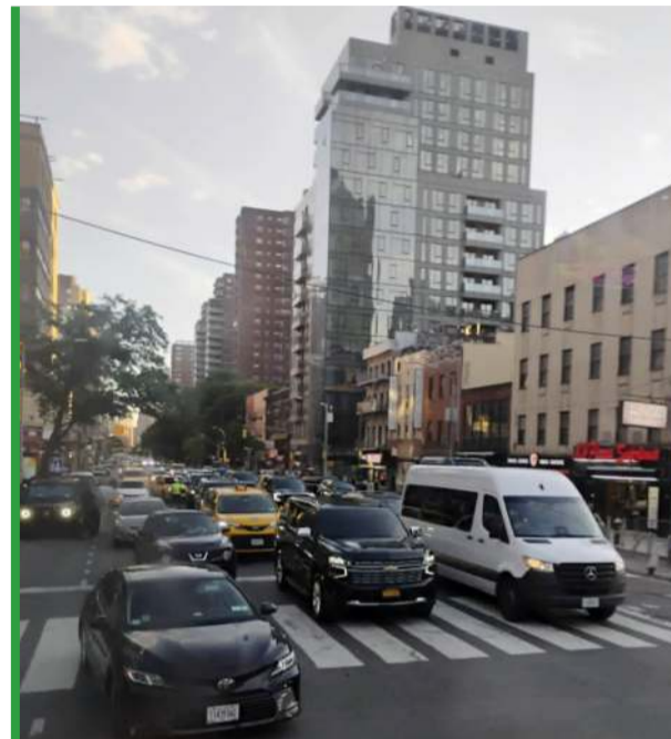
Zatłoczone ulice i transport to nie tylko problem Nowego Jorku.

dobrze wyglądają, podobnie jak Maroko. Widać, że dobrze się czują w tych upałach i mogą jakąś niespodziankę sprawić. Na pewno też Amerykanie są na plus. Wzięli świetnego trenera, a „Poch” znakomicie przygotował drużynę