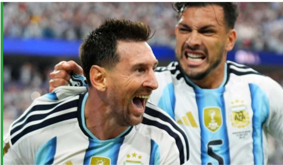
Leo Messi strzelił właśnie piątą bramkę w tym turnieju.

Średnia wieku tego elitarnego grona to około 26 i pół roku. Trójkę z przodu w chwili osobistego triumfu tego rodzaju mieli tylko Chorwat Davor Suker (1998) i Urugwajczyk Diego Forlan (2010). Teraz zjawiskowy, olśniewający, brylantowy, epitety można mnożyć, Lionel Messi może znacznie przesunąć tę granicę. W dwóch pierwszych meczach turnieju zdobył już pięć bramek. Już tylko to dałoby mu tytuł na dwóch mundialach – w 1934 i 1962 roku, a przecież zabawa dopiero się zaczyna. Przed nami wiele, wszystko nieodgadnione – może zdarzyć się, że Argentyna odpadnie już w 1/16 finału, może zdarzyć się, że Messi odniesie kontuzję i nie będzie mógł dalej grać. Gdyby jednak wszystko poszło po myśli Argentyńczyków, gdyby Messi nadal strzelał z taką regularnością – to niepobity rekord Justa Fontaine'a z 1958 roku byłyby zagrożony. Francuz wbił wtedy aż 13 goli, a „La Pulga”, żeby go przeskoczyć, musiałby trafić jeszcze aż dziewięć razy. Niemożliwe?