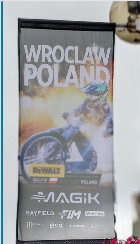
Świdnicka udekorowana przed GP Polski. Wrocław od dawna kocha żużel!

Wracamy do roku 2026 z koniecznym wspomnieniem Waldstadionu 1974 w