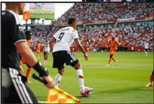
Swoje problemy mają na amerykańskim mundialu sędziowie, piłkarze i... dziennikarze.