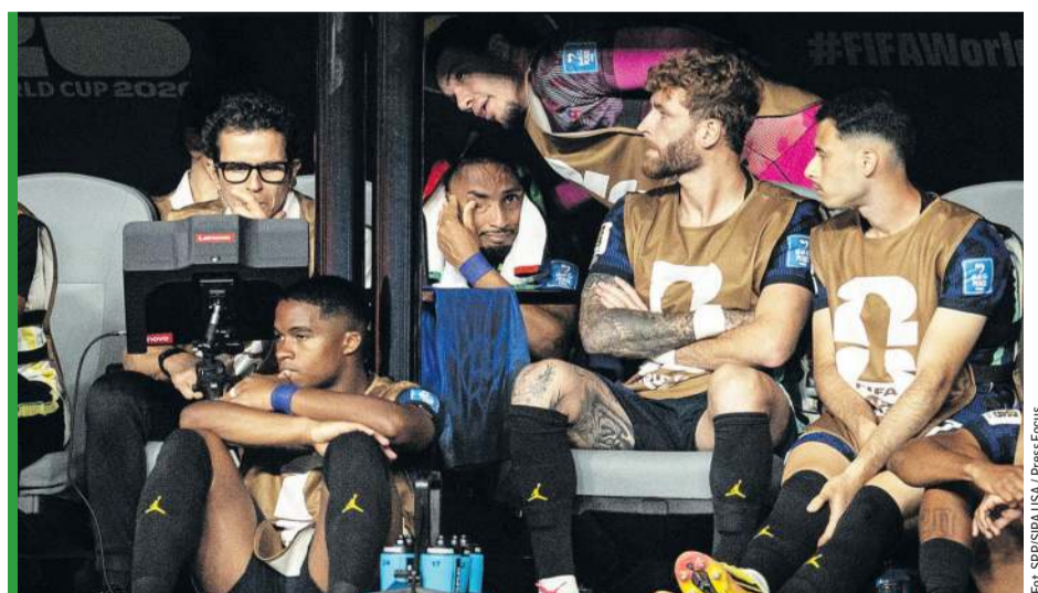
Nie tylko małżonka Raphinhi, ale i on sam uronił łzę po zejściu z murawy z powodu kontuzji.