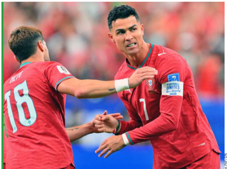
Sportową złość CR7 wyładował na rywalach z Uzbekistanu.